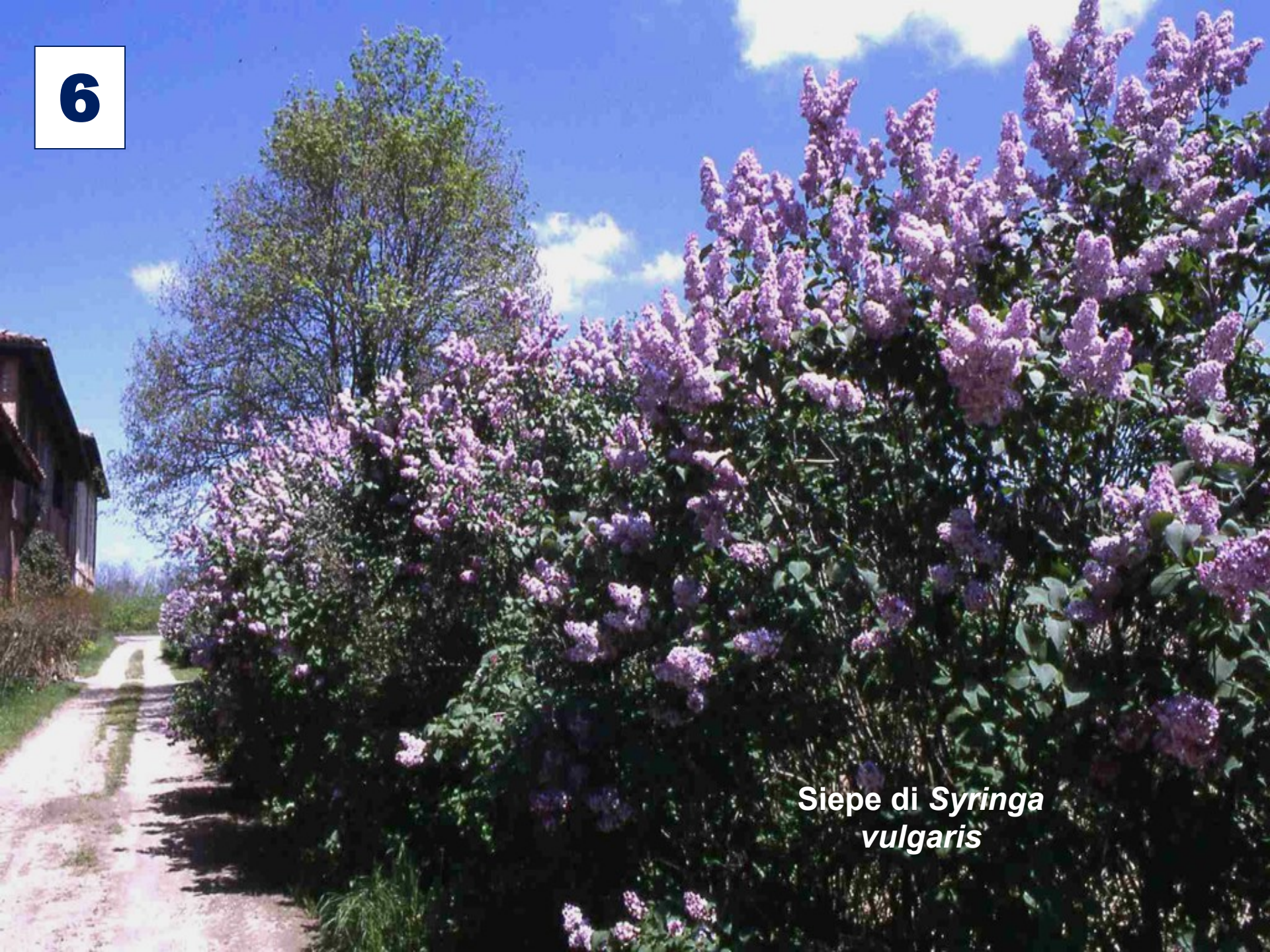
Siepe di Syringa vulgaris