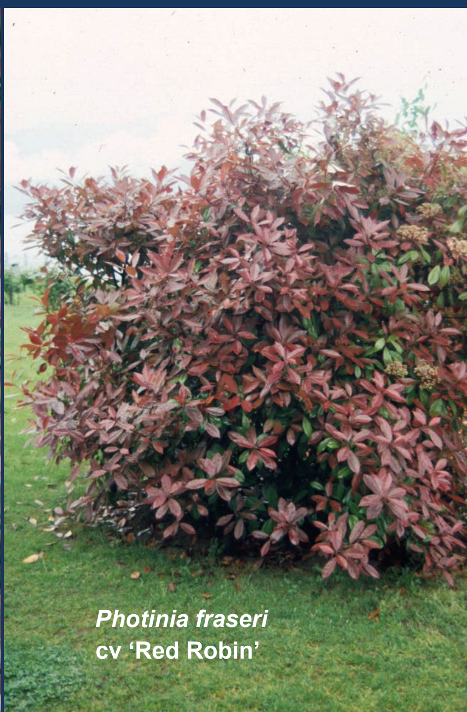
Photinia fraseri cv 'Red Robin'