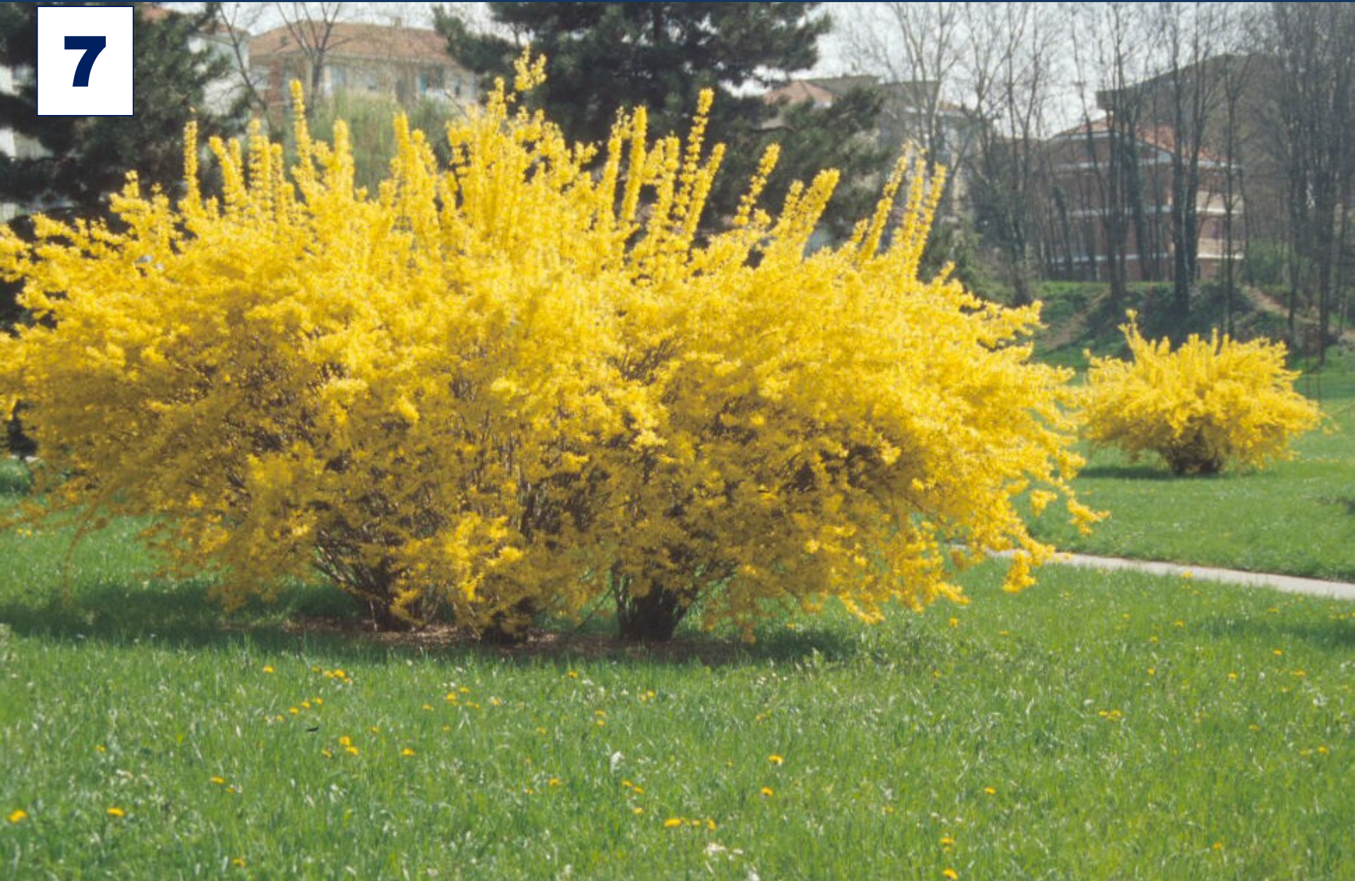
Forsythia x intermedia