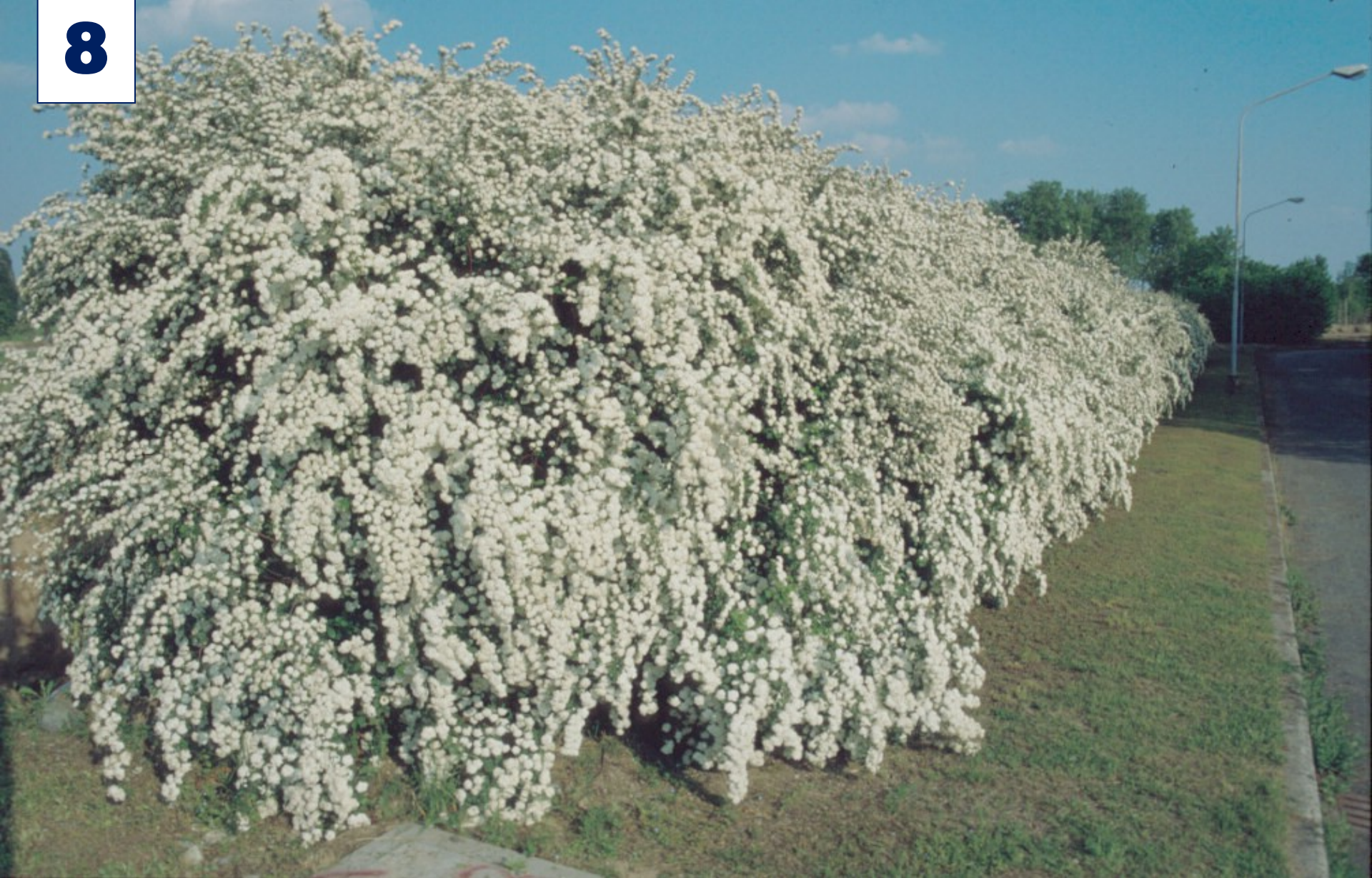
Esempio di siepe ottenuta con Spiraea arguta