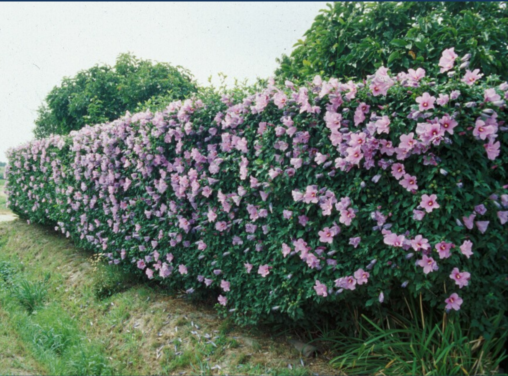
Siepe fiorita di Hibiscus syriacus