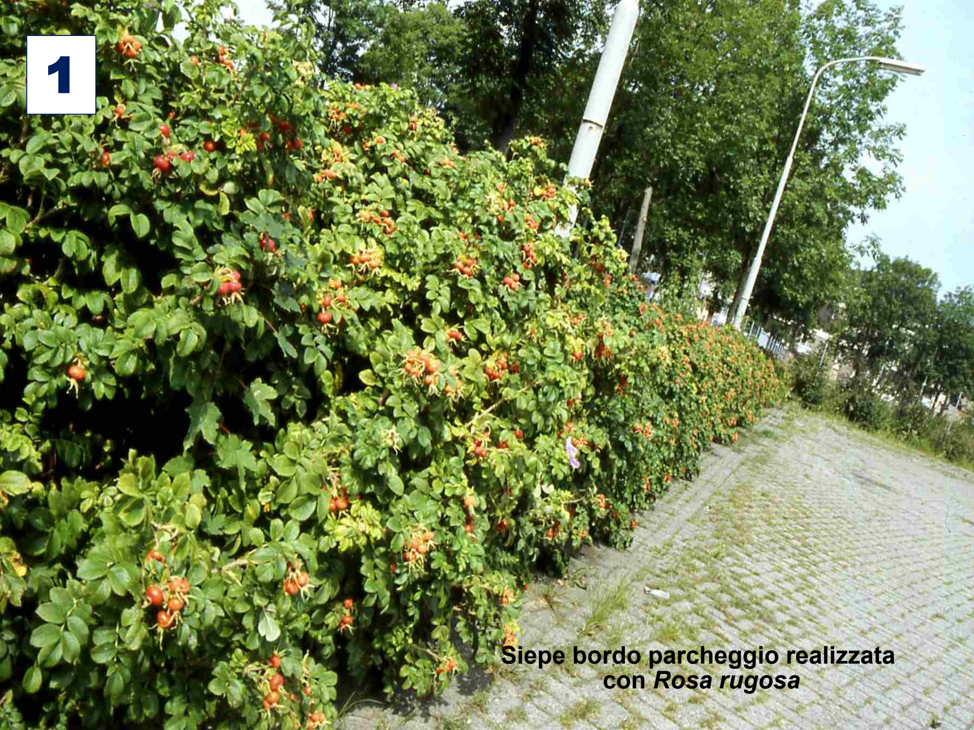
Siepe bordo parcheggio realizzata con Rosa rugosa