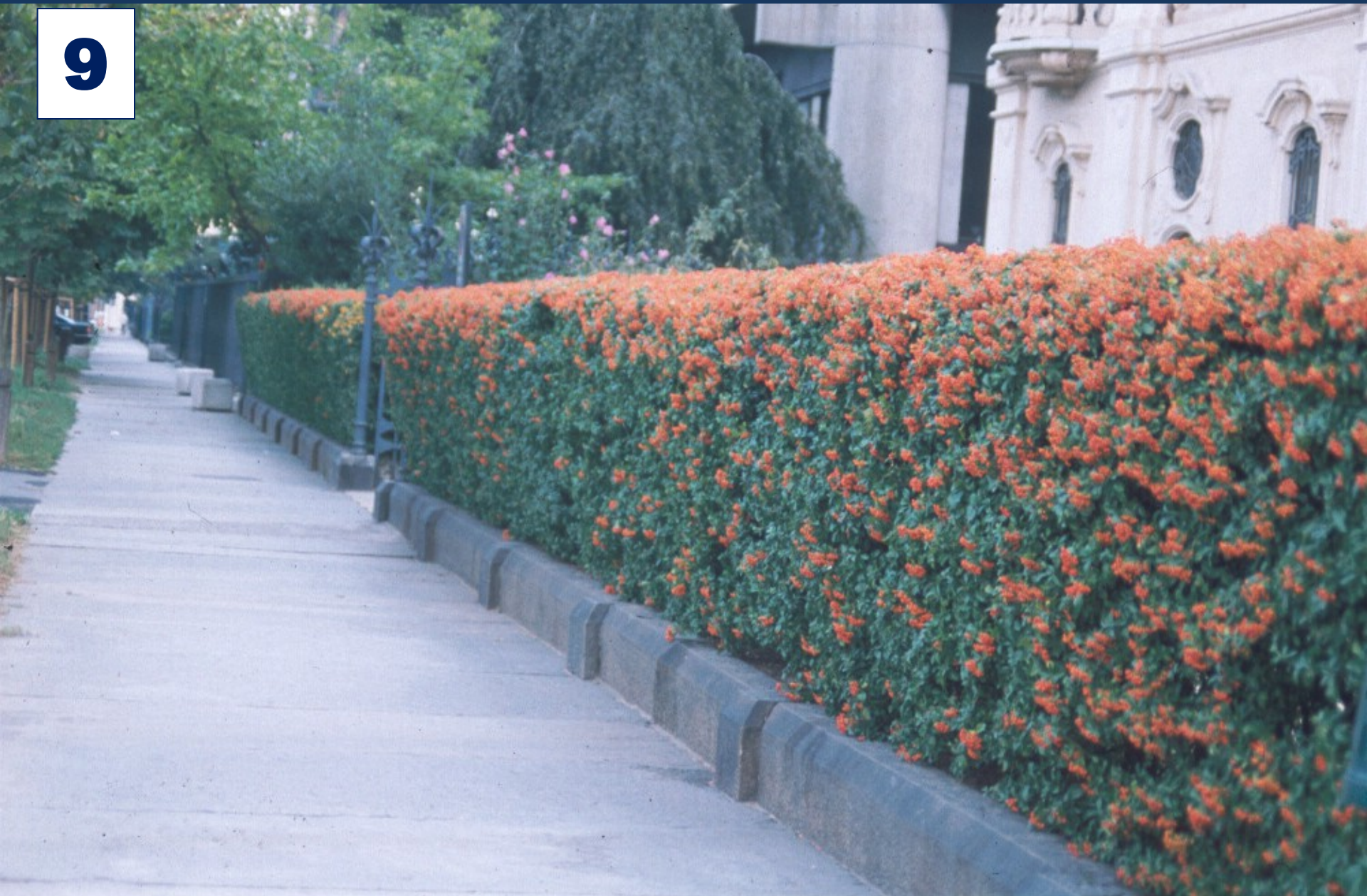
Siepe ottenuta con la specie Pyracantha coccinea