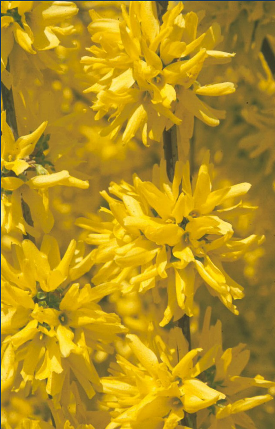
Forsythia x intermedia