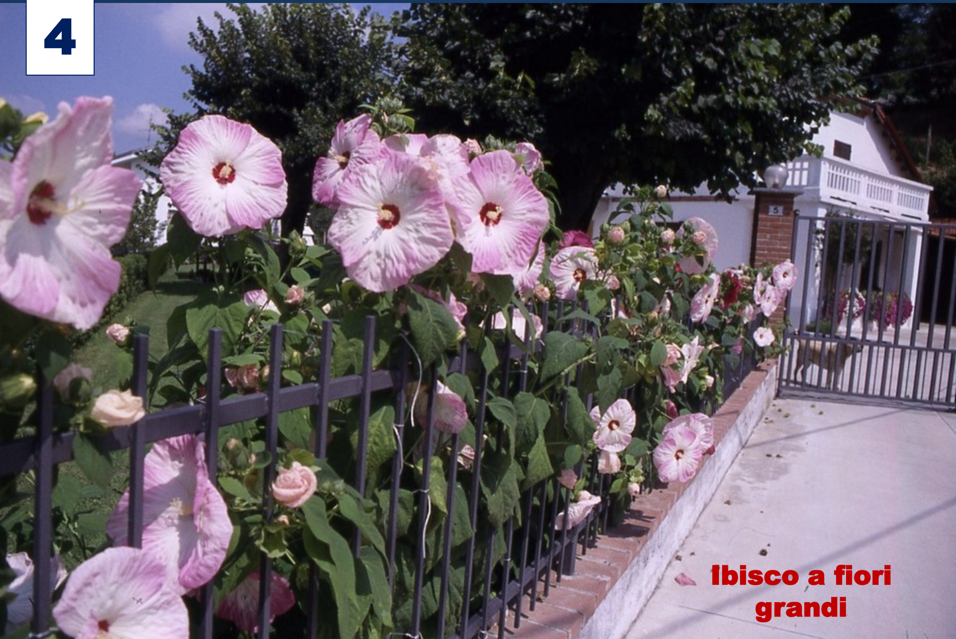
Ibisco a fiori grandi