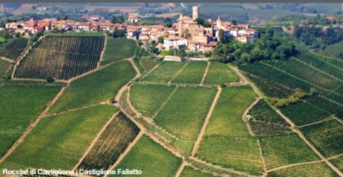
Rocche di Castiglione | Castiglione Falletto