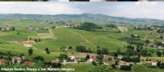
Regioni Radice, Ronco e San Martino | Moasca