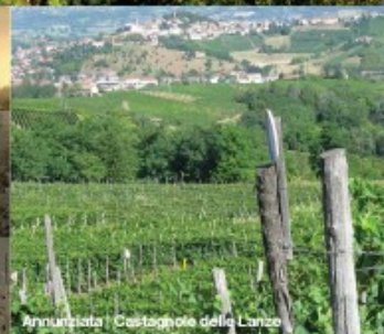
Annunziata | Castagnole delle Lanze