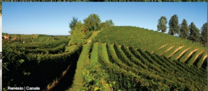
Renesio | Canale