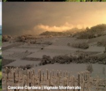
Cascine Cordera | Vignale Monferrato