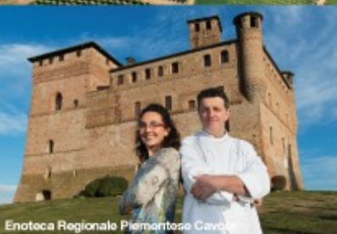
Enoteca Regionale Piemontese Cavour