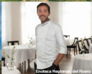
Enoteca Regionale del Roero