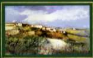
Il paesaggio dipinto Astigiano, Monferrato e Langhe