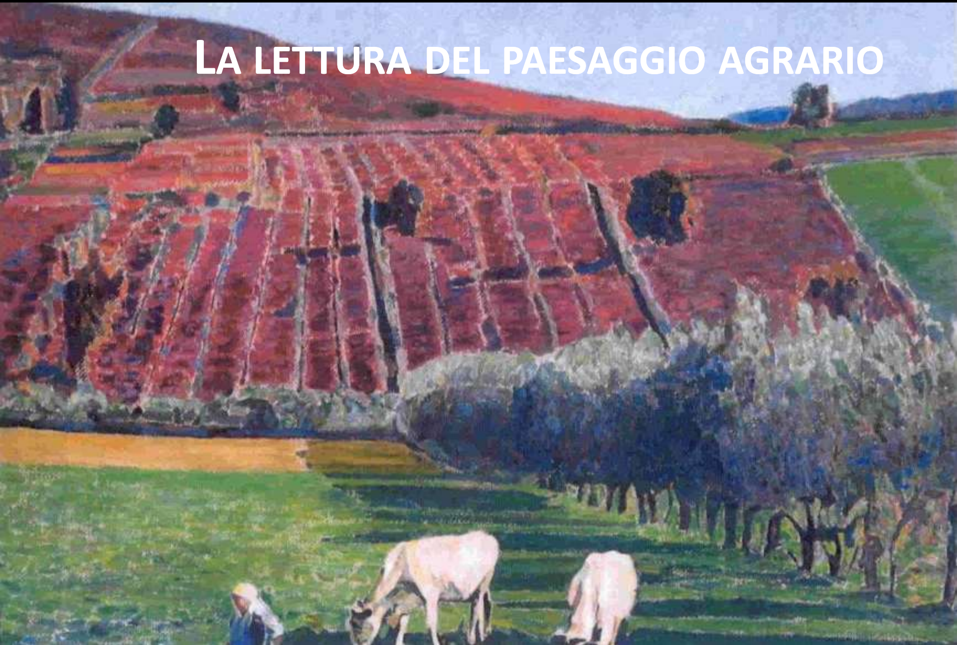
Vigneti autunnali - Agostino Bosia