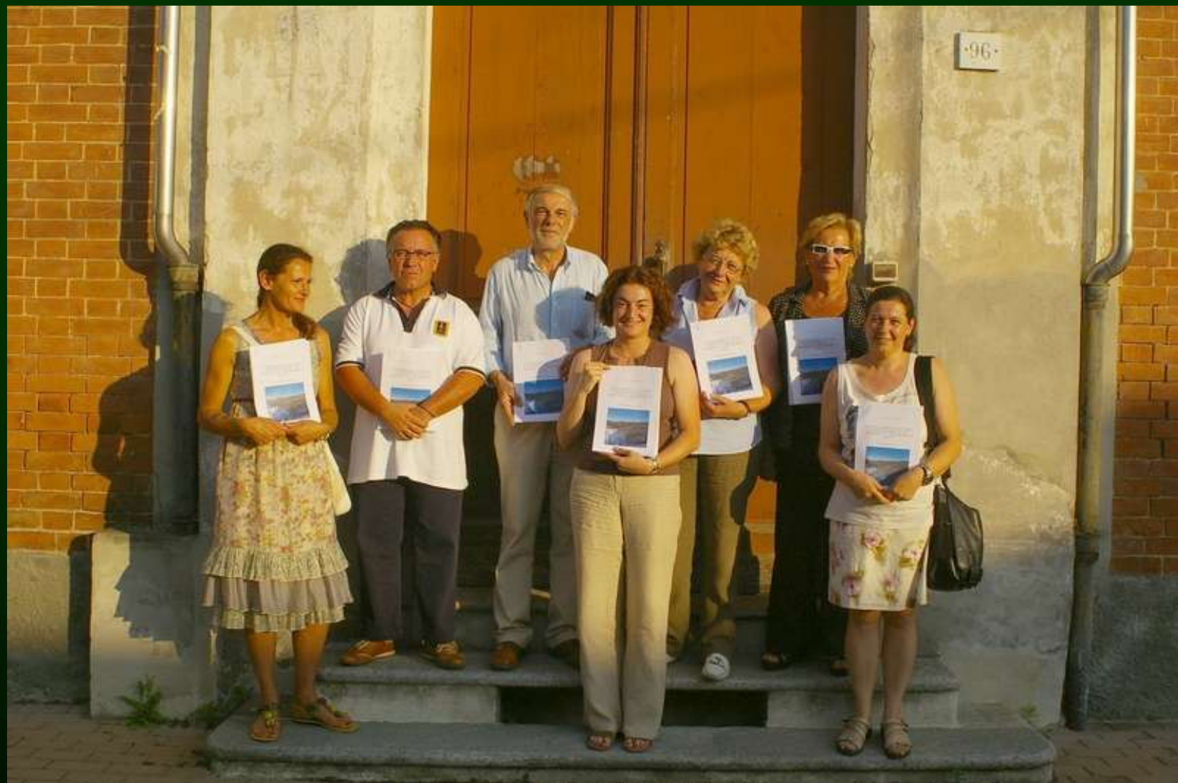
SPEDIZIONE DELLA DICHIARAZIONE DI NOTEVOLE INTERESSE PUBBLICO DEL PAESAGGIO DI SAN MARZANOTTO (7 luglio 2010)