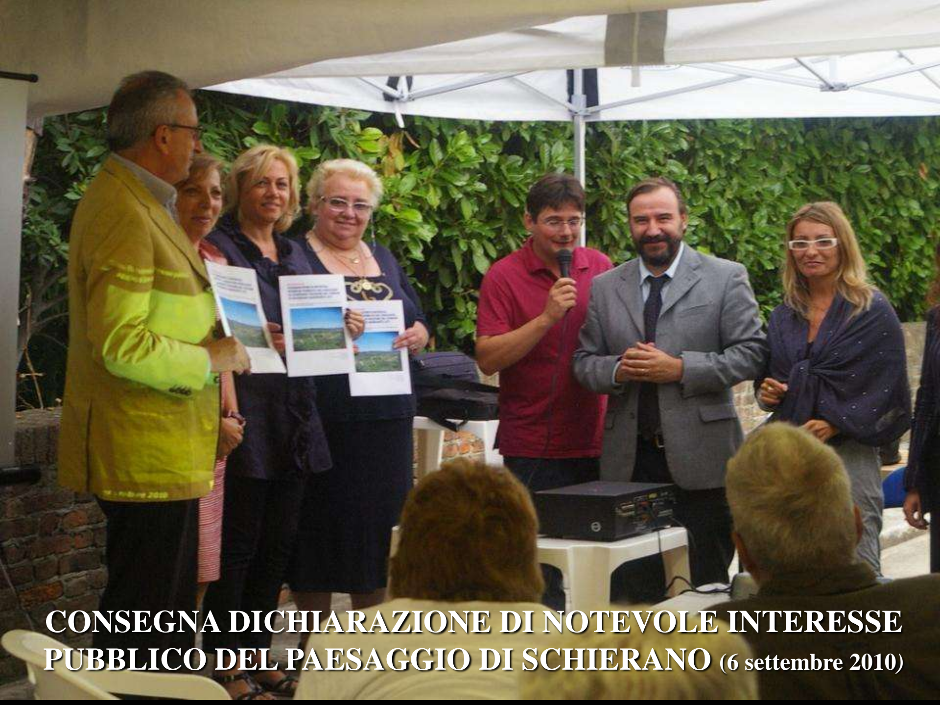
CONSEGNA DICHIARAZIONE DI NOTEVOLE INTERESSE PUBBLICO DEL PAESAGGIO DI SCHIERANO (6 settembre 2010)