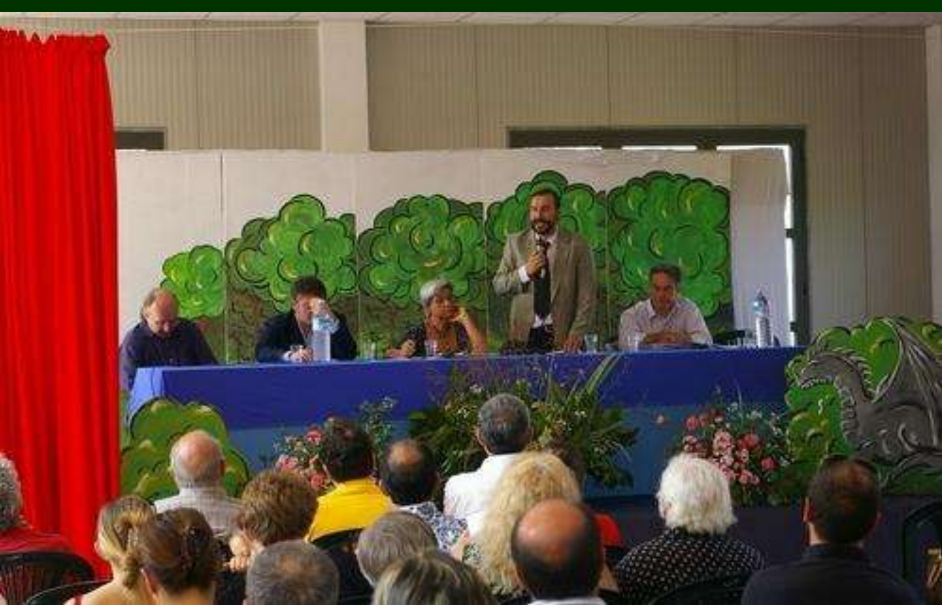
Convegno DICHIARAZIONE PER LA NOTEVOLE INTERESSE PUBBLICO DEL PAESAGGIO DI CORTIGLIONE ( Codice Urbani ) 1 luglio 2007