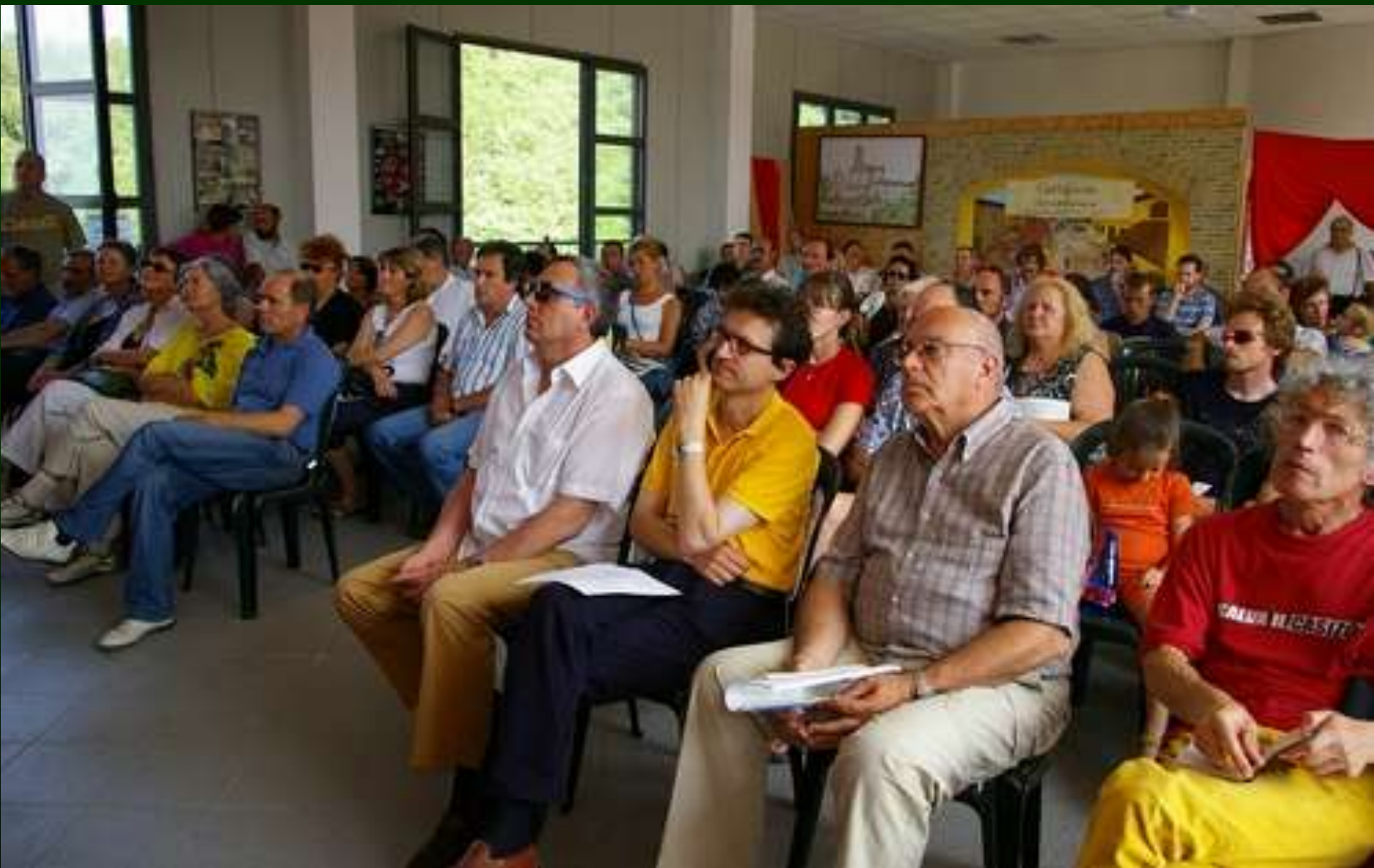
Convegno DICHIARAZIONE PER LA NOTEVOLE INTERESSE PUBBLICO DEL PAESAGGIO DI CORTIGLIONE ( Codice Urbani ) 1 luglio 2007