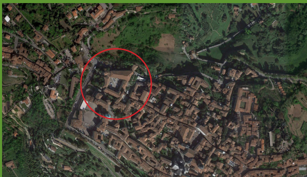
Sala Curò | Piazza della Cittadella, 10 | Bergamo Alta

CONAF ( Consiglio dell'Ordine Nazionale dei Dottori Agronomi e dei Dottori Forestali ) è l'istituzione che rappresenta i professionisti che in Italia operano nel settore agralimentare, agricolo, forestale, ambientale e paesaggistico. Nell'ambito del Paesaggio e dei Sistemi del Verde, l'attività del CONAF è tesa alla valorizzazione delle identità territoriali, alla riqualificazione urbana e rurale, alla promozione della progettazione integrata e alla qualificazione del prodotto attraverso il riuso delle risorse territoriali e all'azzeramento del consumo di suolo. Il CONAF, è membro dell' Associazione Mondiale degli Agronomi (WAA) e, a livello europeo, della European Confederation of Agronomist Associations (CEDIA) , e della Union European Forester (UEF) .