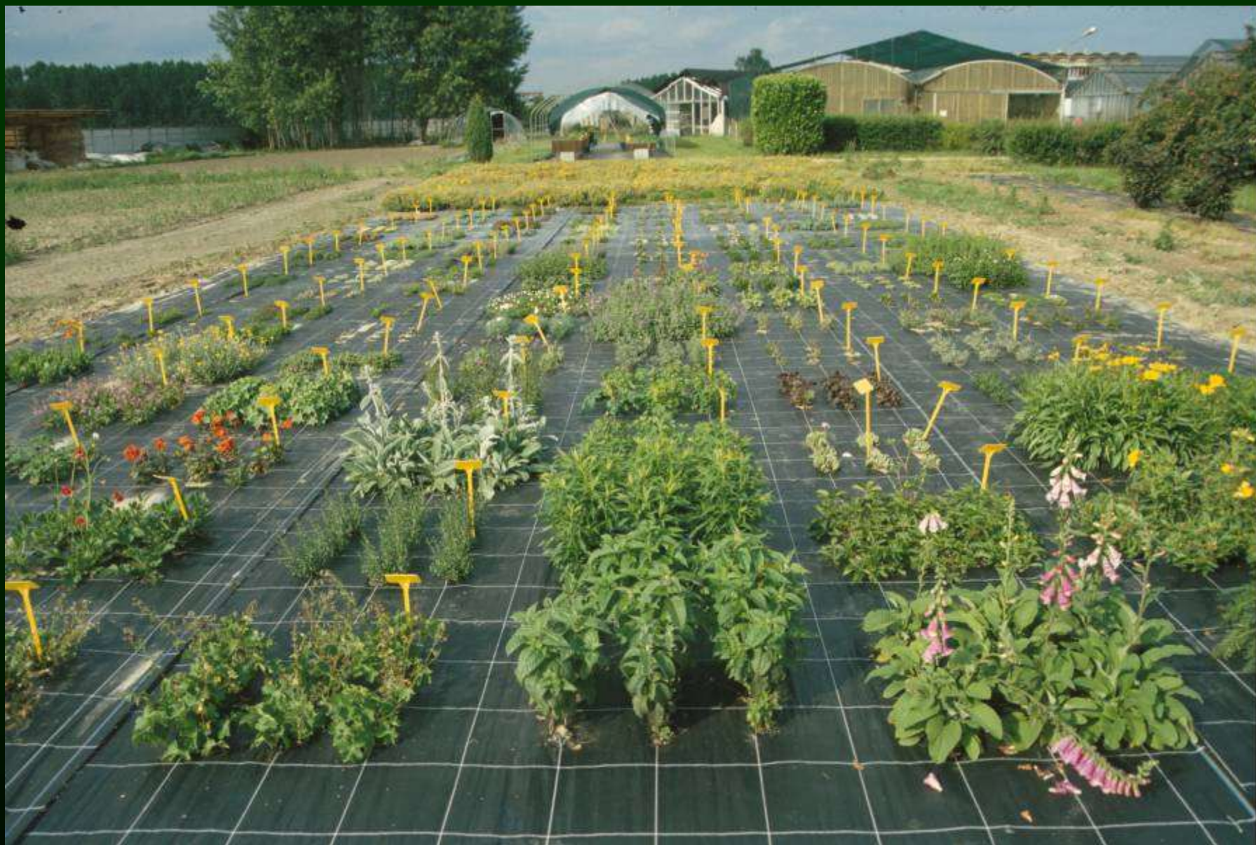
Campi catalogo – Centro sperimentale della Facoltà a Carmagnola (TO)