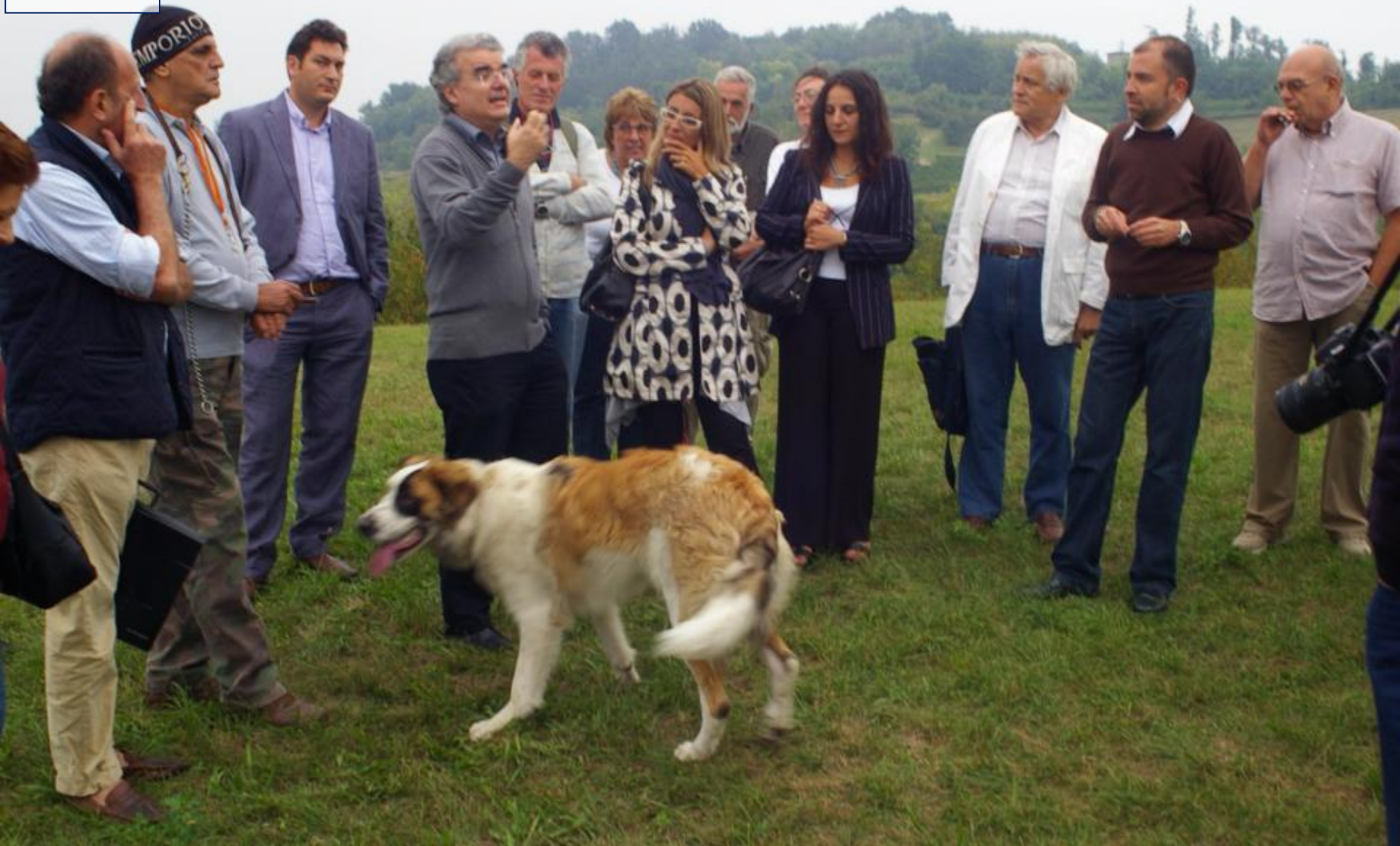
SOPRALLUOGO pubblico ai luoghi della richiesta di Dichiarazione di notevole Interesse pubblico del paesaggio di Schierano (Passerano Marmorito Lunedì 6 settembre 2010)