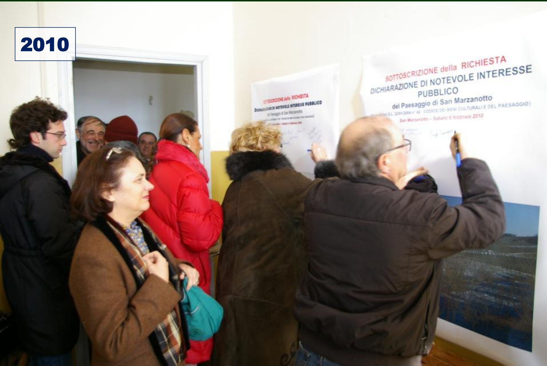
SOTTOSCRIZIONE della Dichiarazione di notevole Interesse pubblico del paesaggio di San Marzanotto (6 febbraio 2010)