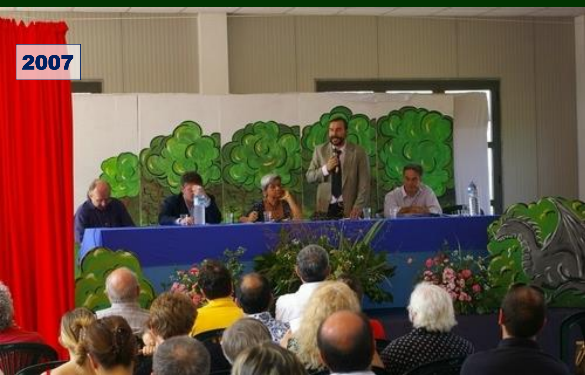
Convegno DICHIARAZIONE PER LA NOTEVOLE INTERESSE PUBBLICO DEL PAESAGGIO DI CORTIGLIONE ( Codice Urbani ) 1 luglio 2007