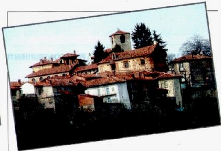
Schierano di Passerano