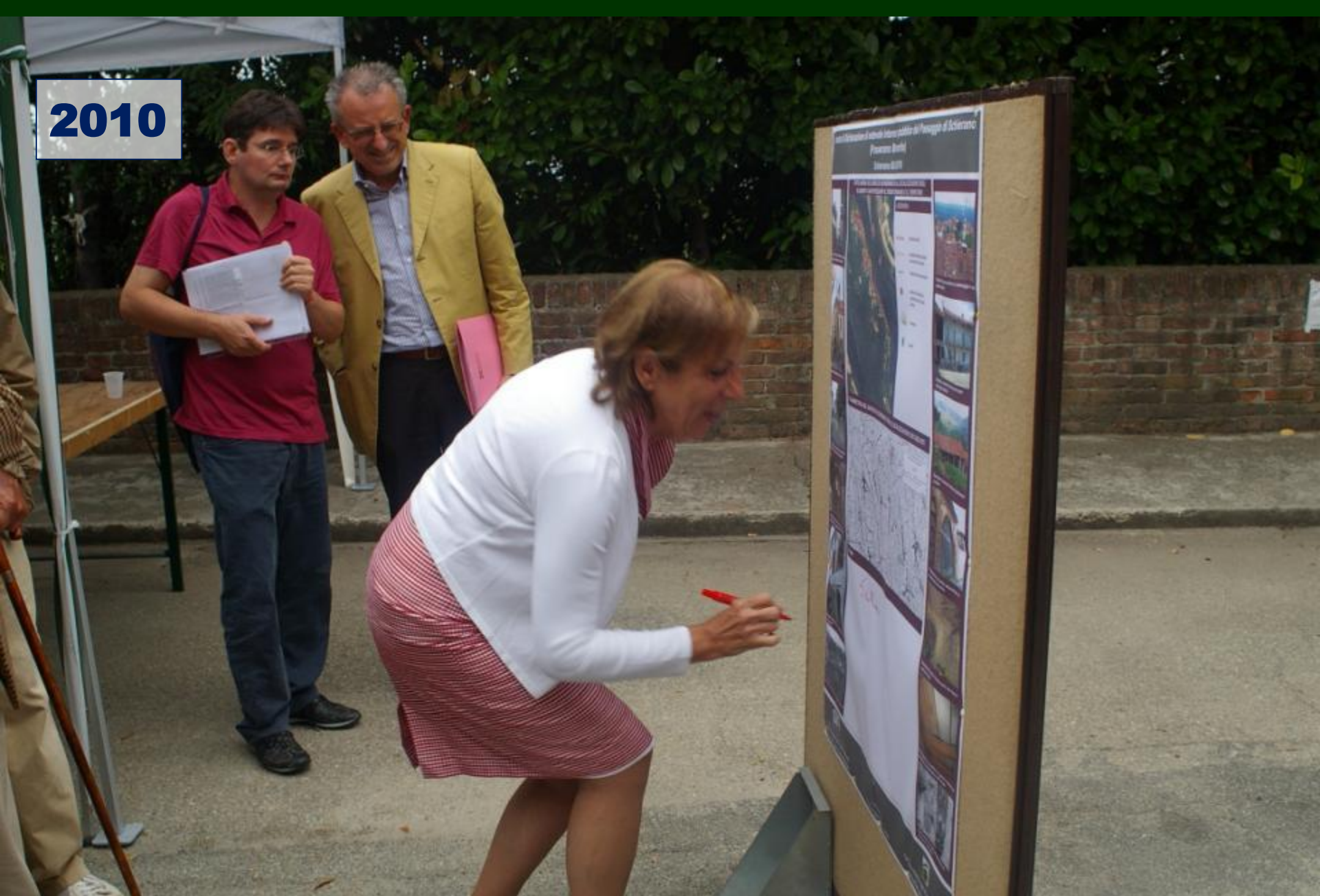
SOTTOSCRIZIONE pubblica della richiesta di Dichiarazione di notevole Interesse pubblico del paesaggio di Schierano (Passerano Marmorito Lunedì 6 settembre 2010)