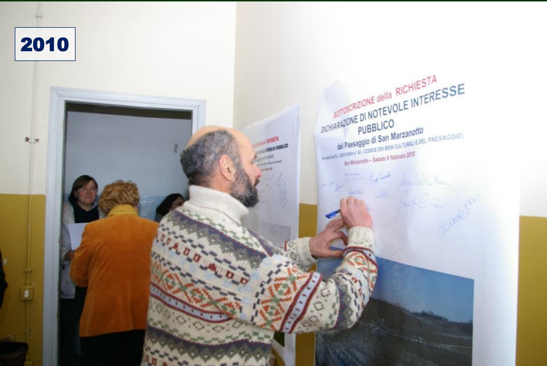
SOTTOSCRIZIONE della Dichiarazione di notevole Interesse pubblico del paesaggio di San Marzanotto (6 febbraio 2010)