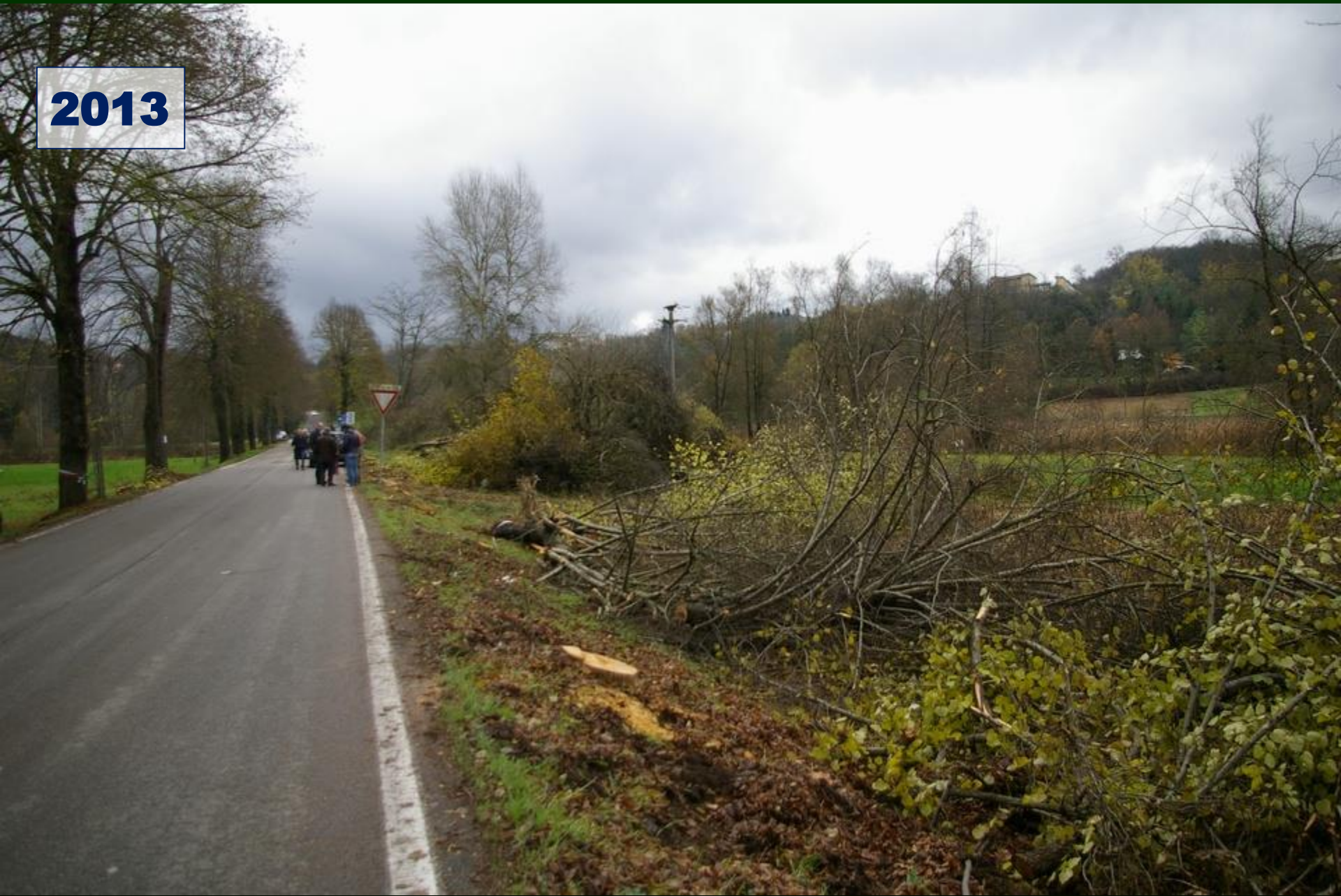
Alberi abbattuti lungo il viale di Montafia (venerdì 21 novembre 2013)