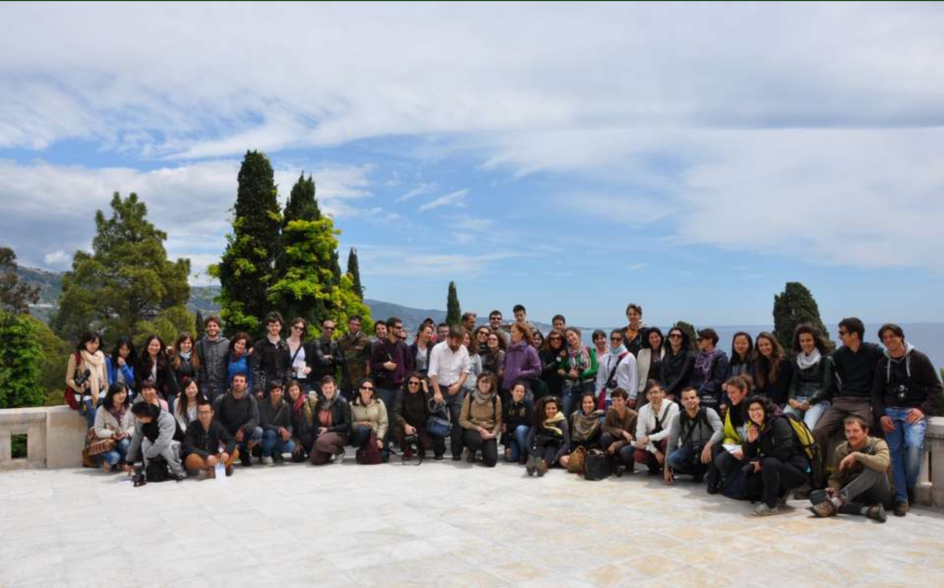
Giardini di Villa Hanbury a La Mortola (Ventimiglia)