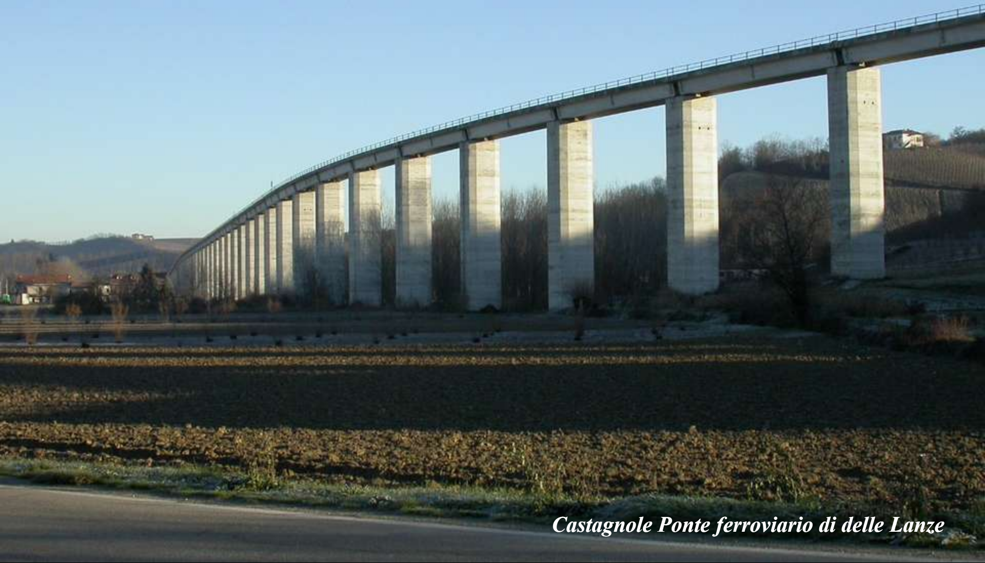
Castagnole Ponte ferroviario di delle Lanze