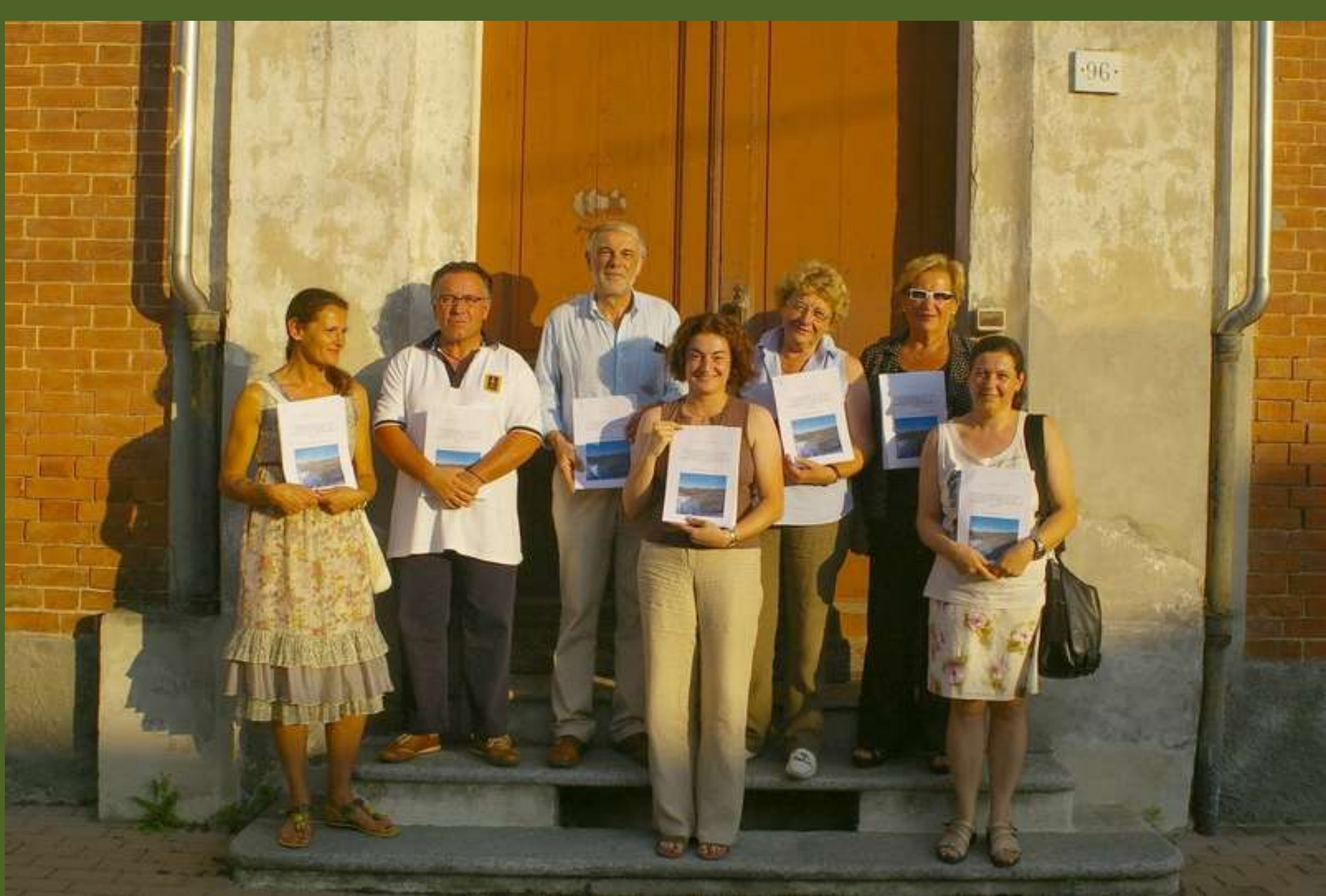
SPEDIZIONE DELLA DICHIARAZIONE DI NOTEVOLE INTERESSE PUBBLICO DEL PAESAGGIO DI SAN MARZANOTTO (7 luglio 2010)