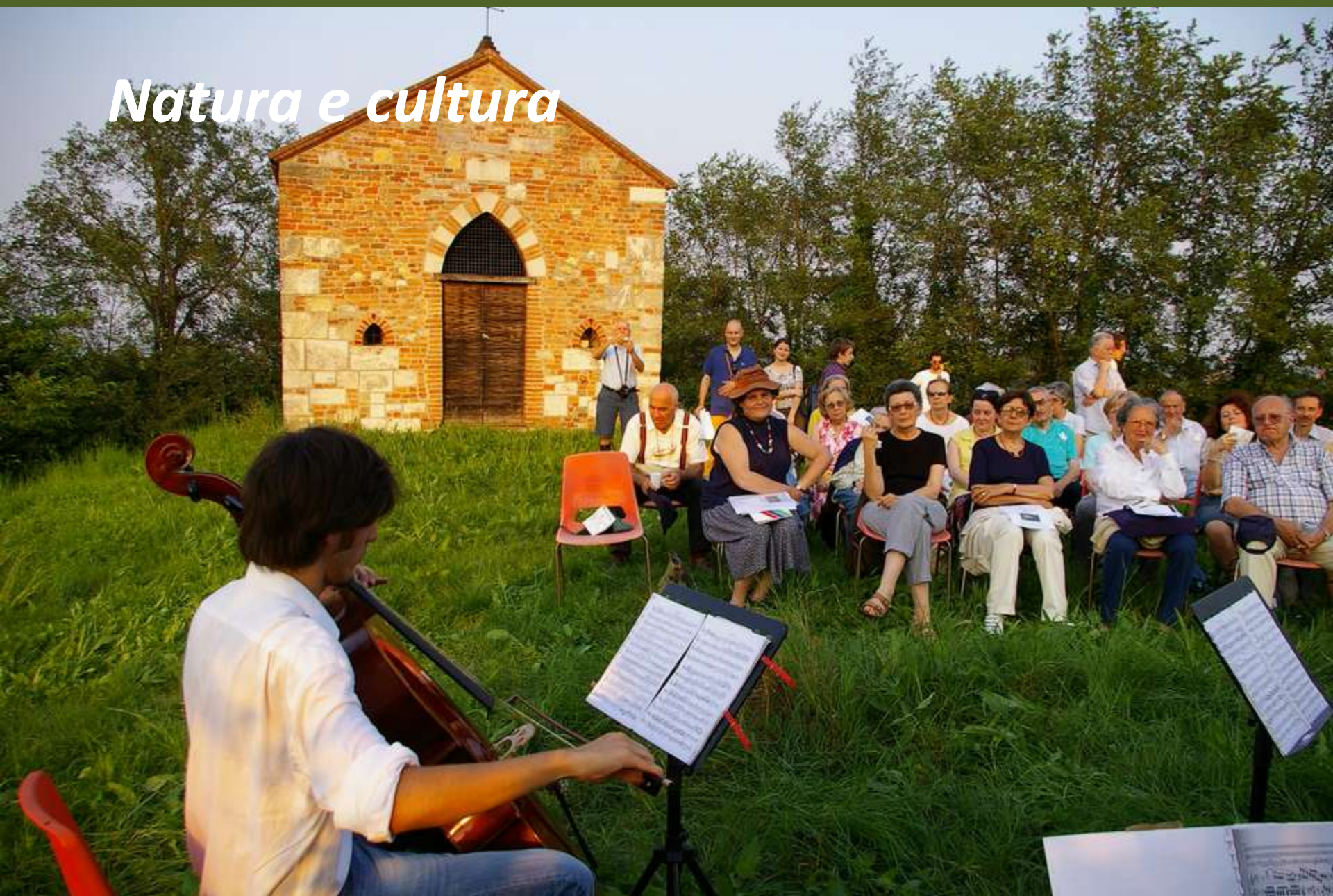
Chiesa romanica di Santa Maria di Pisenzana – Montechiaro d'Asti – giugno 2008