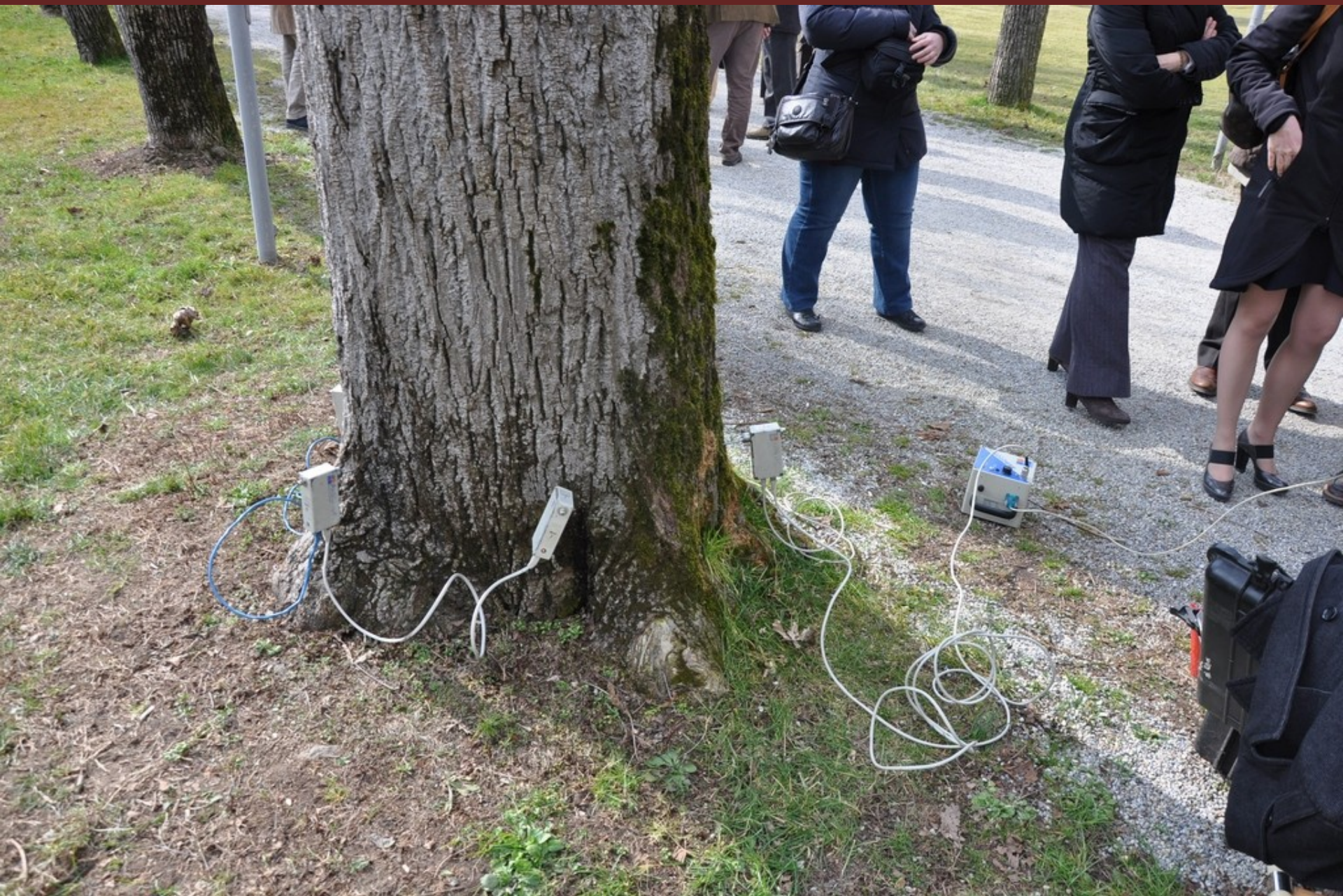
Effettuazione a titolo esemplificativo di un'analisi di "Tomografia sonora" al termine del Convegno su di un albero presente lungo il viale di ingresso all'Università di Pellenzo