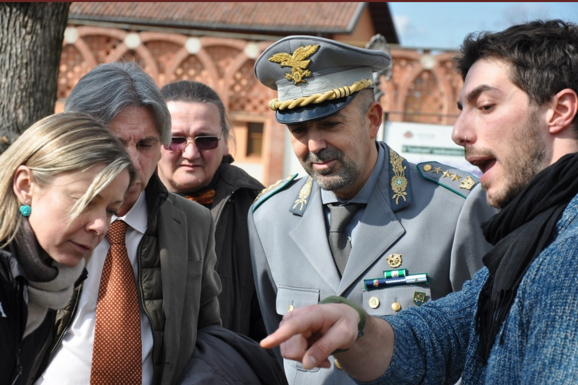
Effettuazione a titolo esemplificativo di un'analisi di "Tomografia sonica" al termine del Convegno su di un albero presente lungo il viale di ingresso all'Università di Pollenzo