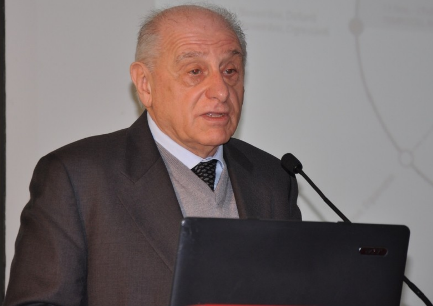
Relazione introduttiva del Magnifico Rettore dell'Università di Scienze gastronomiche Prof. Piercarlo Grimaldi "Il tartufo, l'albero e le tradizioni popolari, come patrimonio dell'umanità"