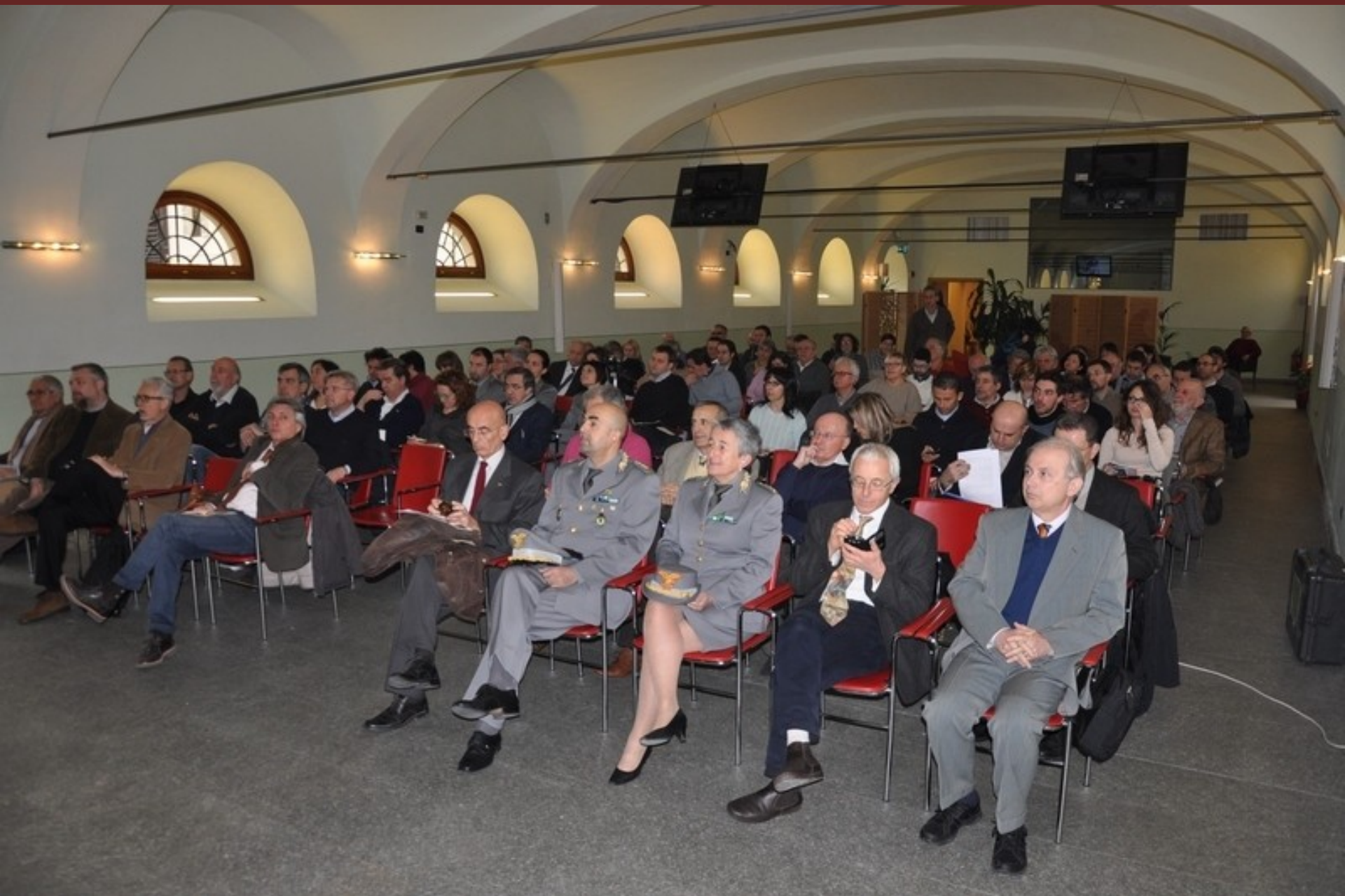
Veduta del folto pubblico presente al Convegno “La centralità dell’albero nella progettazione territoriale”