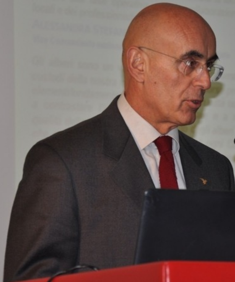
Saluto introduttivo da parte del Dott. Paolo Salsotto, Comandante regionale del Piemonte del Corpo forestale dello Stato