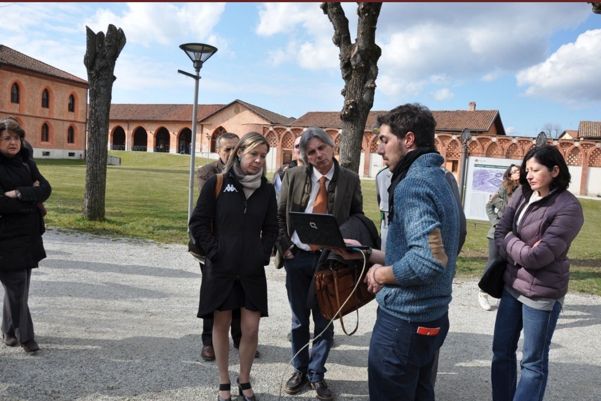
Effettuazione a titolo esemplificativo di un'analisi di "Tomografia sonora" al termine del Convegno su di un albero presente lungo il viale di ingresso all'Università di Pellenzo