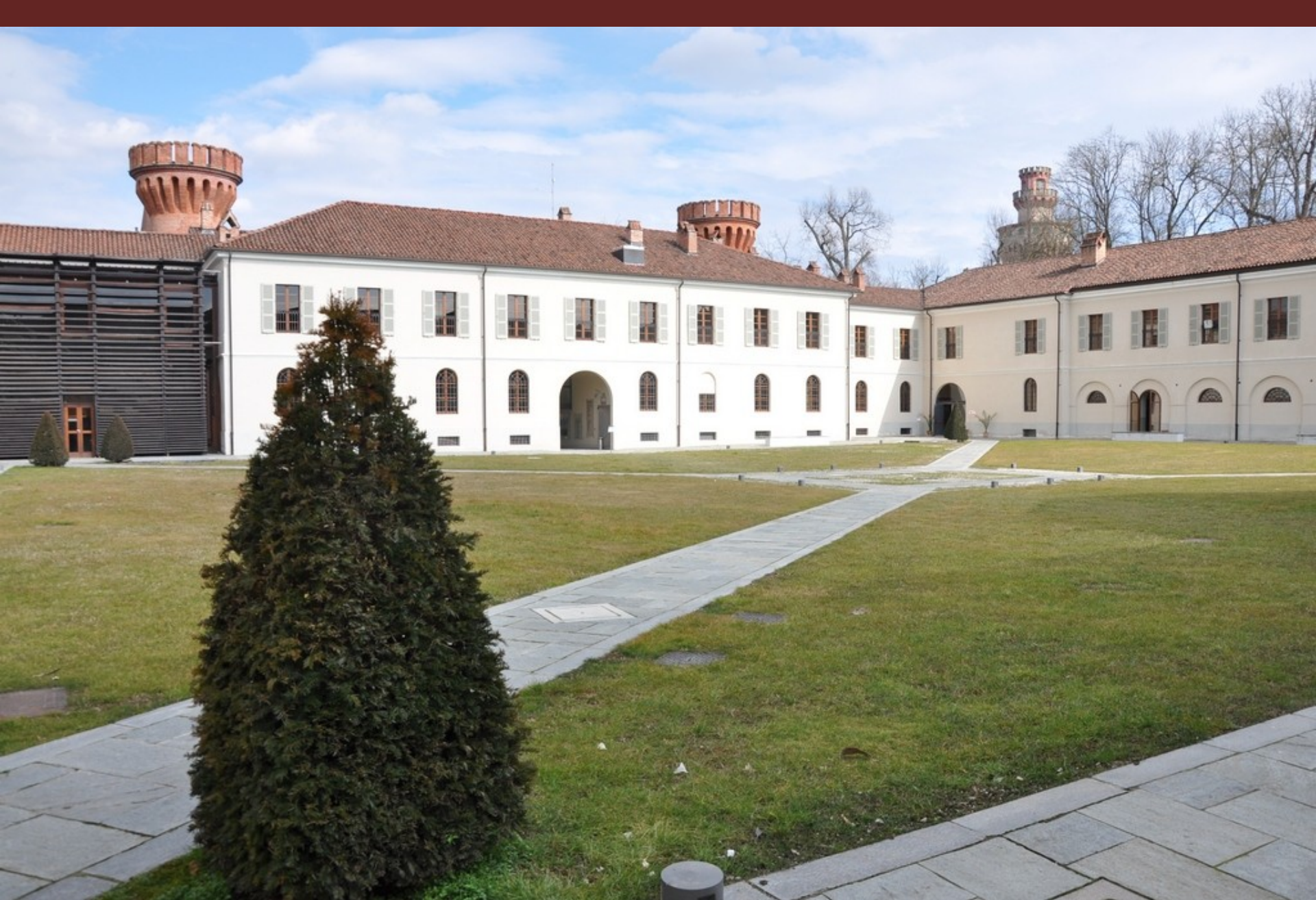
Corte interna dell'Università di Scienze gastronomiche di Pollenzo, sede del Convegno "La centralità dell'albero nella progettazione territoriale"