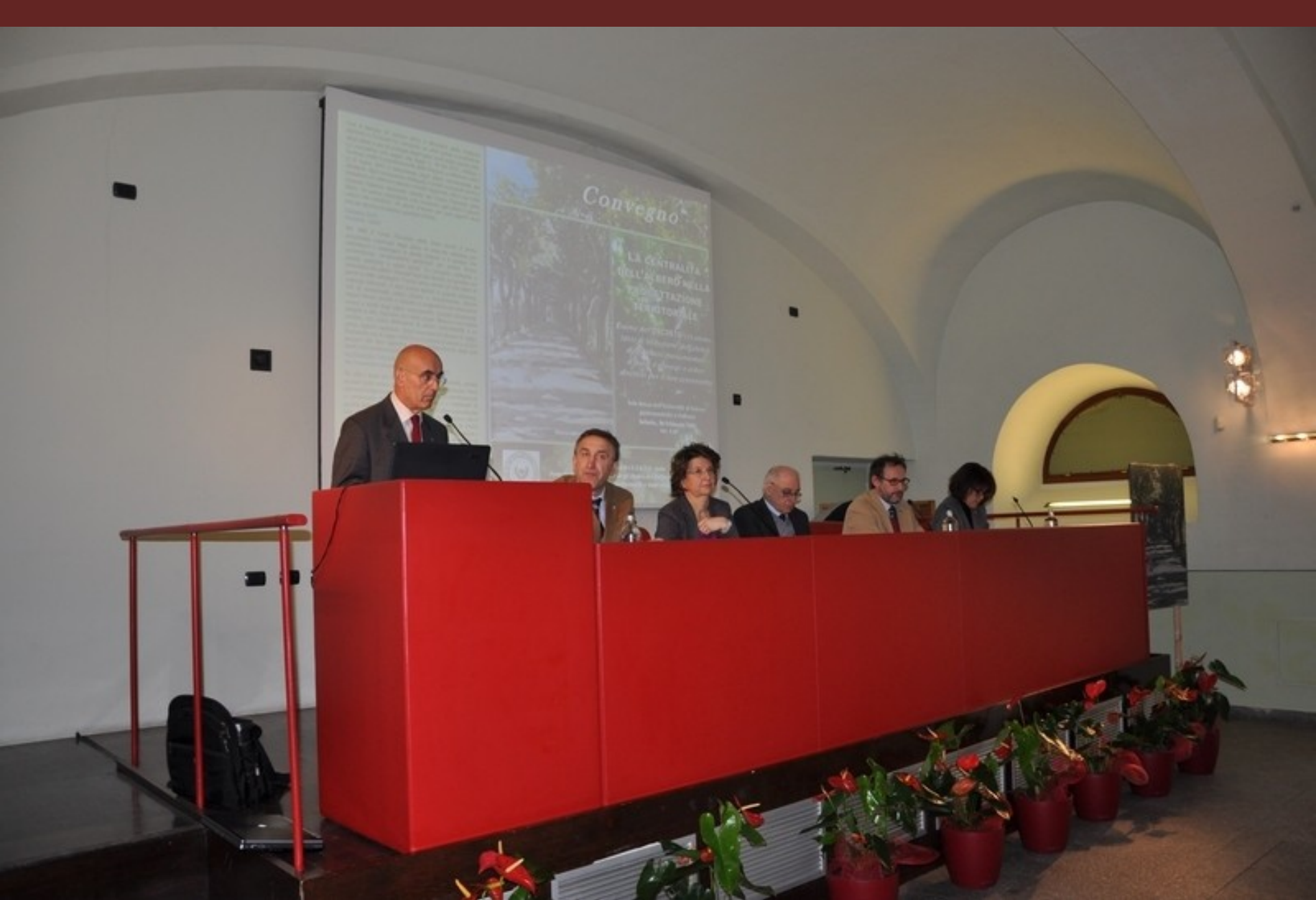
Saluto introduttivo da parte del Dott. Paolo Salsotto, Comandante regionale del Piemonte del Corpo forestale dello Stato