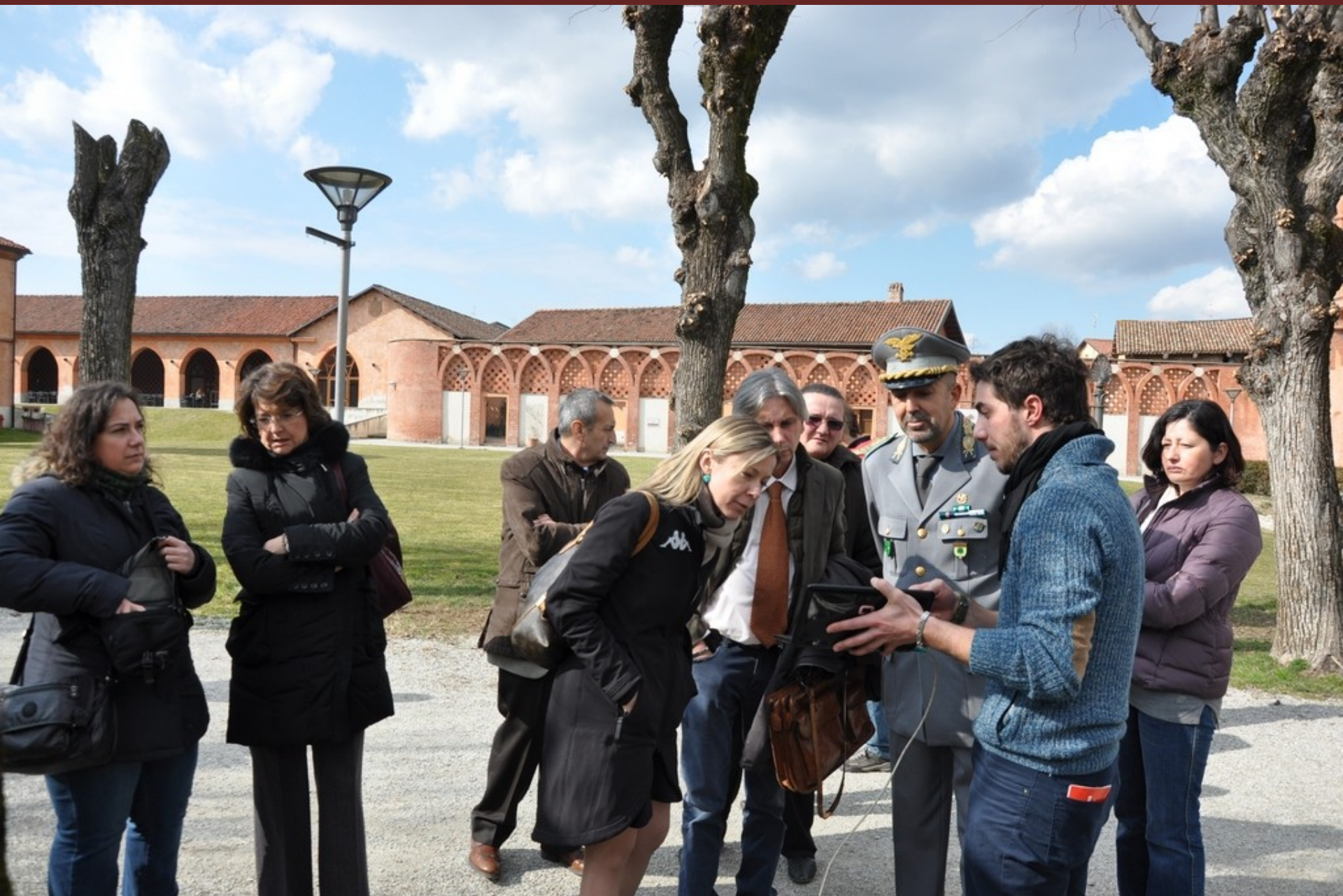
Effettuazione a titolo esemplificativo di un'analisi di "Tomografia sonica" al termine del Convegno su di un albero presente lungo il viale di ingresso all'Università di Pellenzo