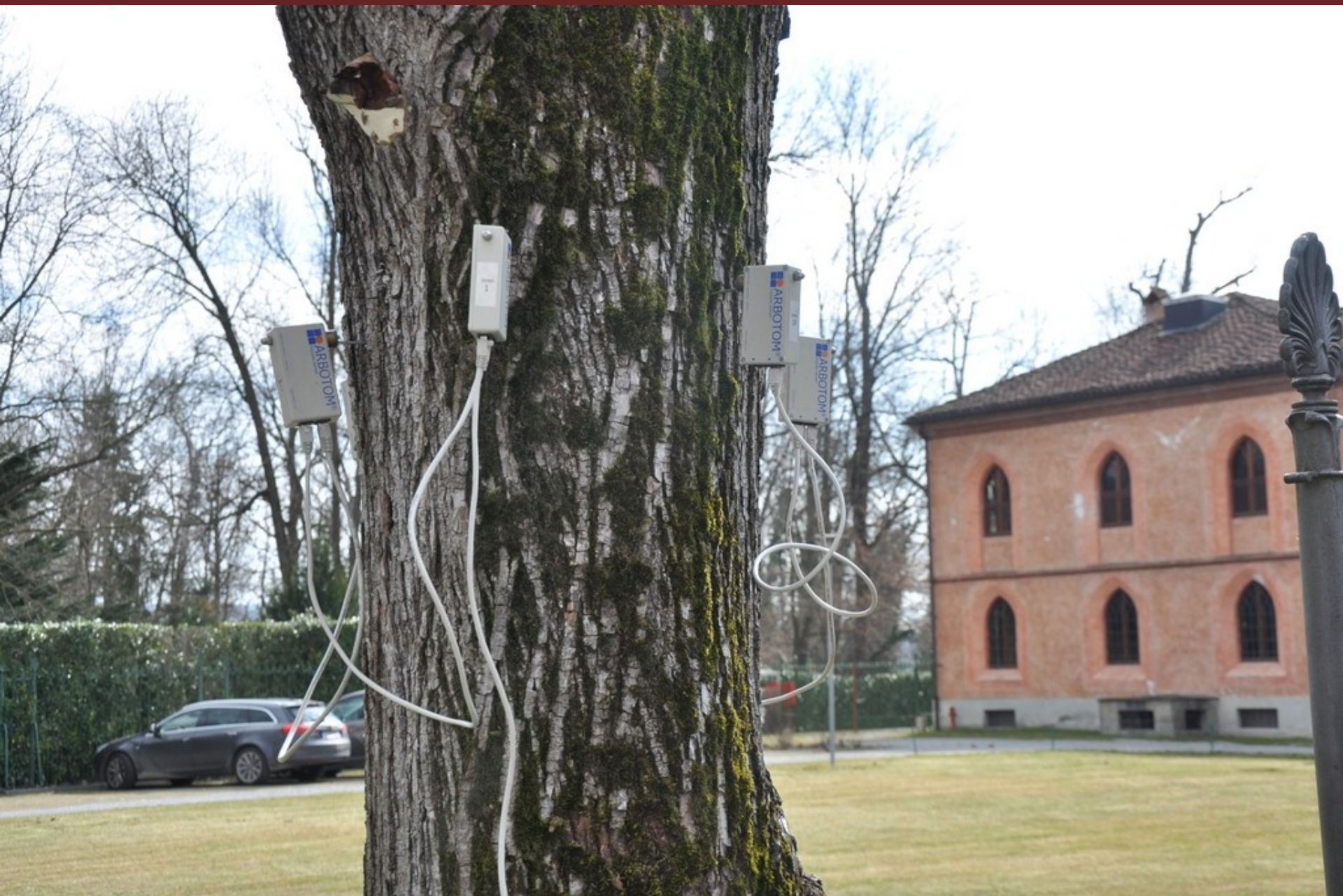
Effettuazione a titolo esemplificativo di un'analisi di "Tomografia sonora" al termine del Convegno su di un albero presente lungo il viale di ingresso all'Università di Pellenzo