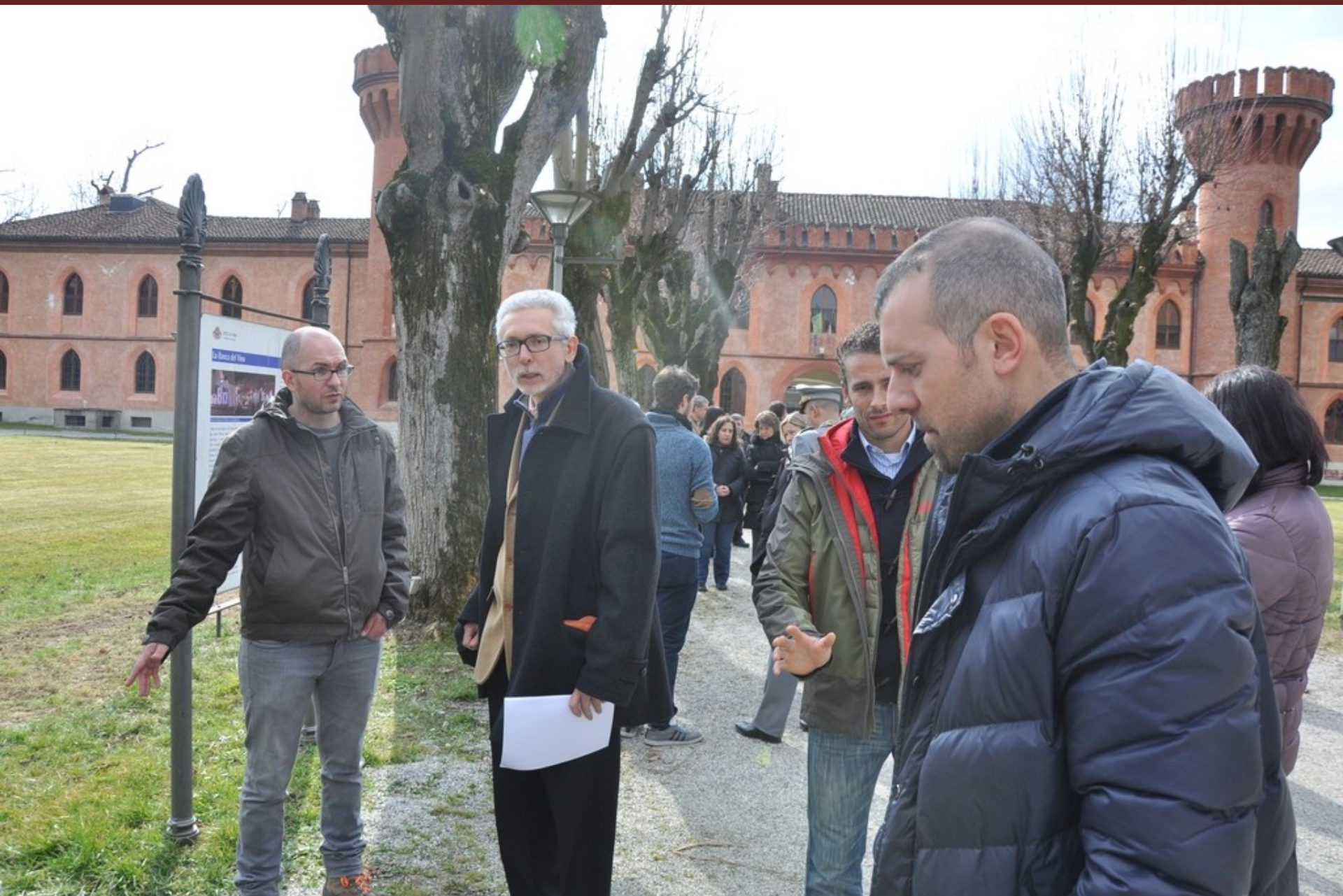
Effettuazione a titolo esemplificativo di un'analisi di "Tomografia sonora" al termine del Convegno su di un albero presente lungo il viale di ingresso all'Università di Pellenzo