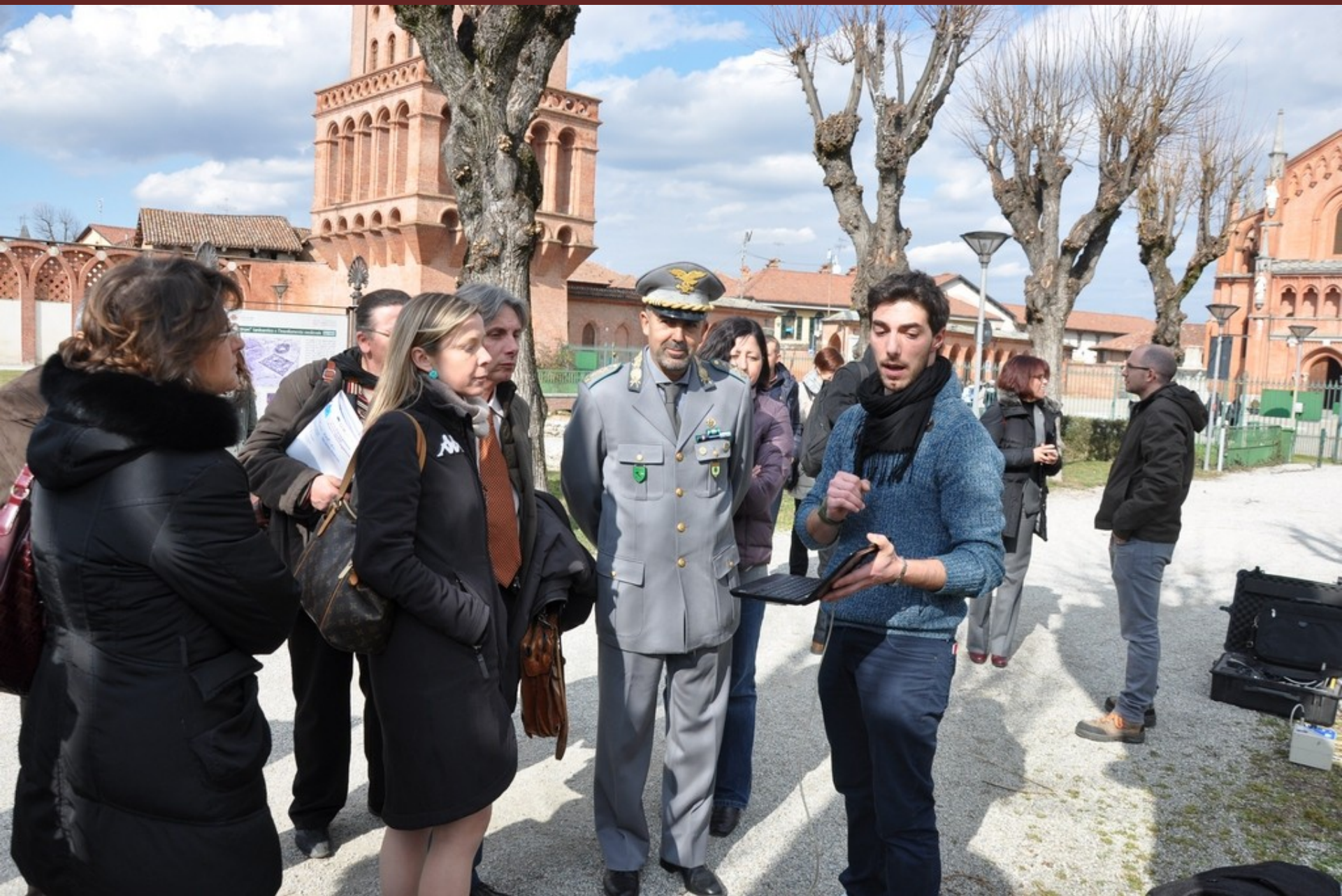
Effettuazione a titolo esemplificativo di un'analisi di "Tomografia sonora" al termine del Convegno su di un albero presente lungo il viale di ingresso all'Università di Pellenzo