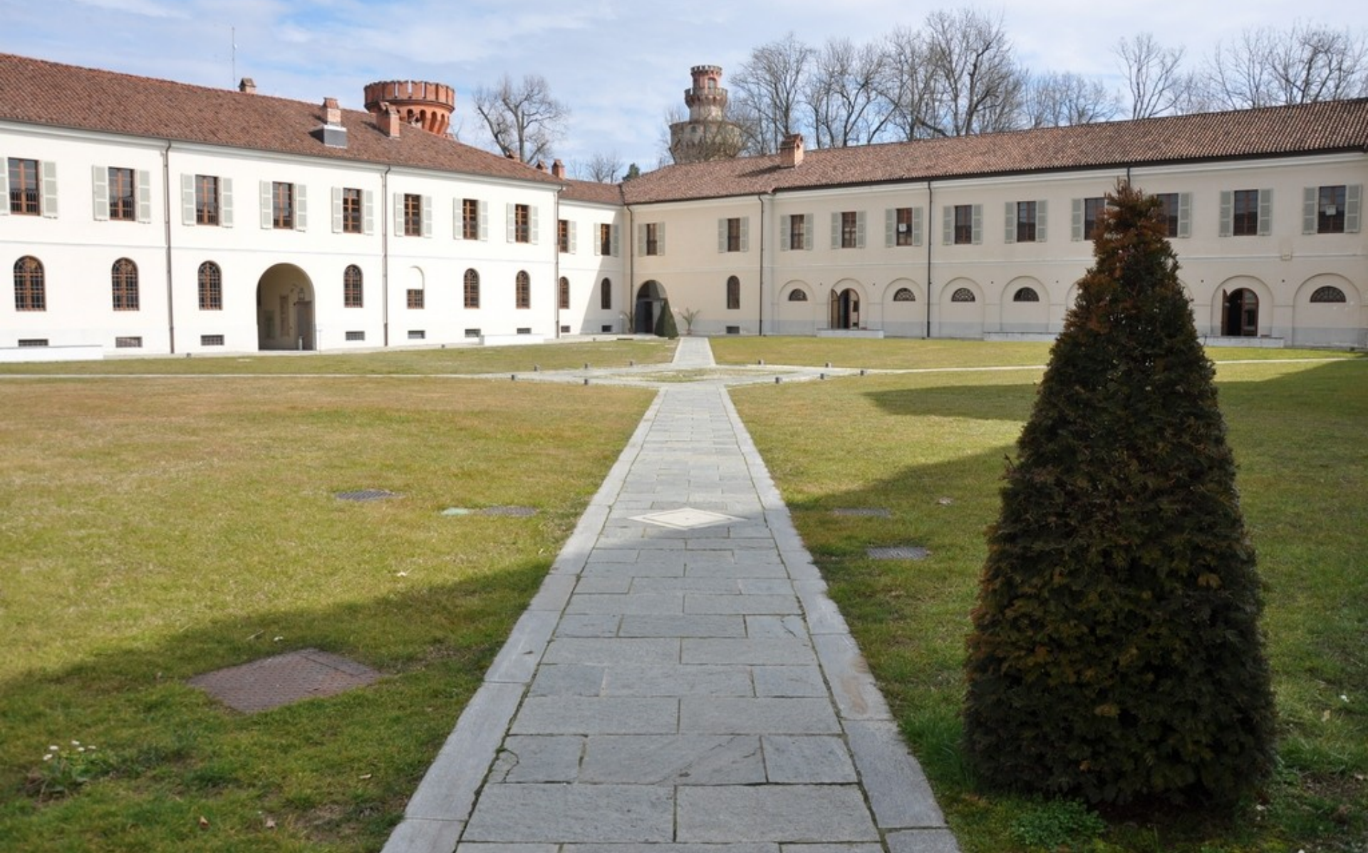
Corte interna dell'Università di Scienze gastronomiche di Pollenzo, sede del Convegno "La centralità dell'albero nella progettazione territoriale"