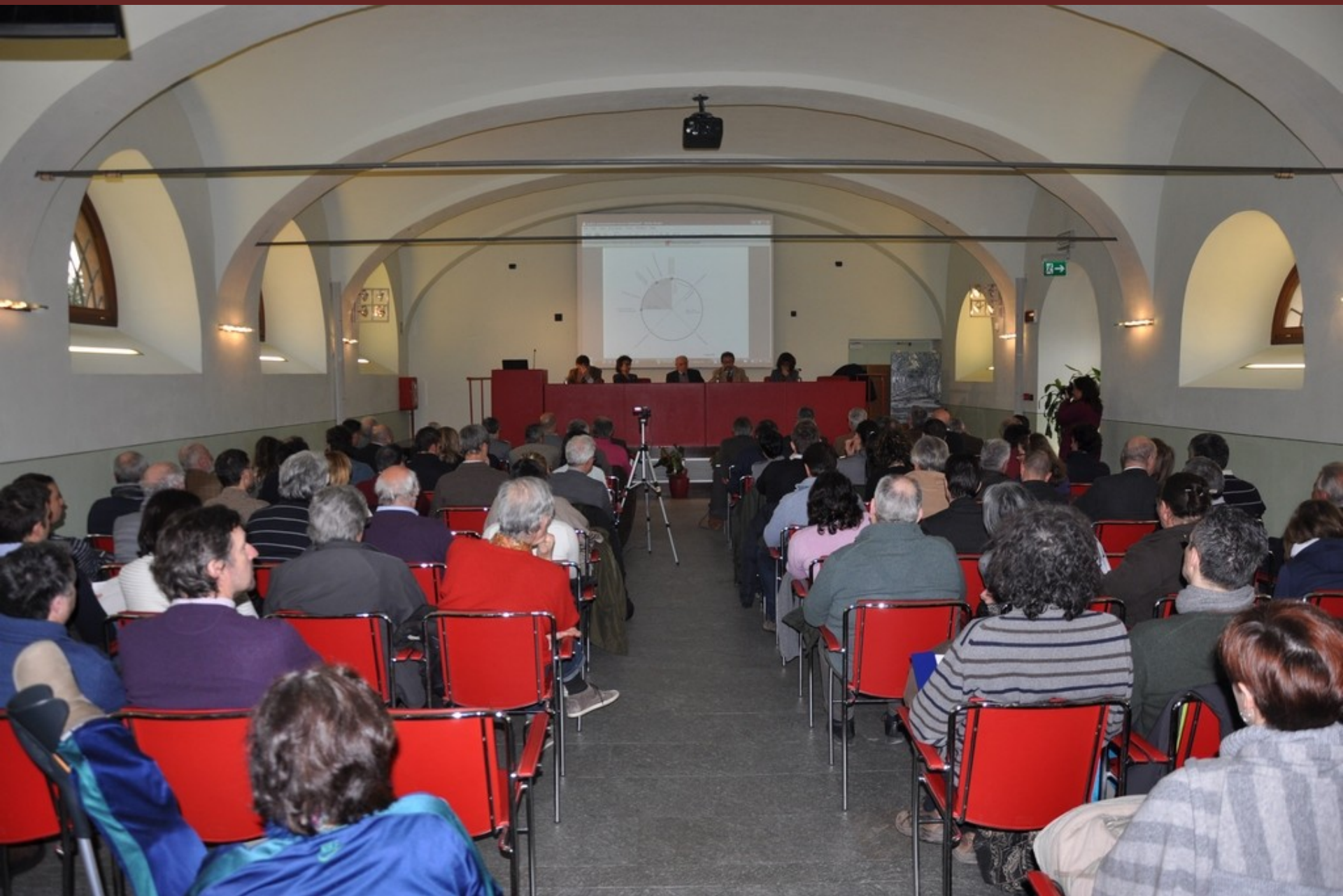
Veduta del folto ed attento pubblico presente al Convegno “La centralità dell’albero nella progettazione territoriale”