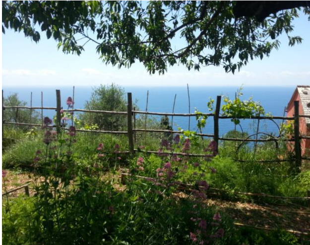
"In uno scatto...tutto il nostro mondo la terra, il mare e il cielo!"