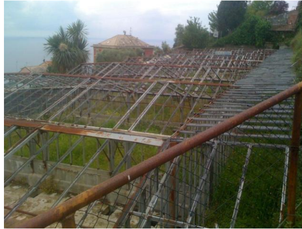
Questa foto mi da un senso di abbandono