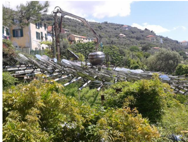
"Vecchia centrale solare di valore storico importante gestita dall'Univerdità. Degrado e spreco di un patrimonio"