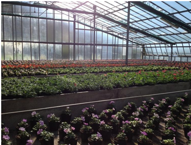
"Le serre della nostra scuola, dove lavoriamo e arricchiamo le nostre conoscenze riguardo alle piante. "