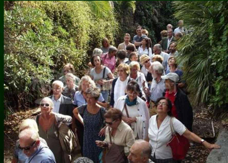
Visita ai Giardini Winter in Arziglia a Bordighera