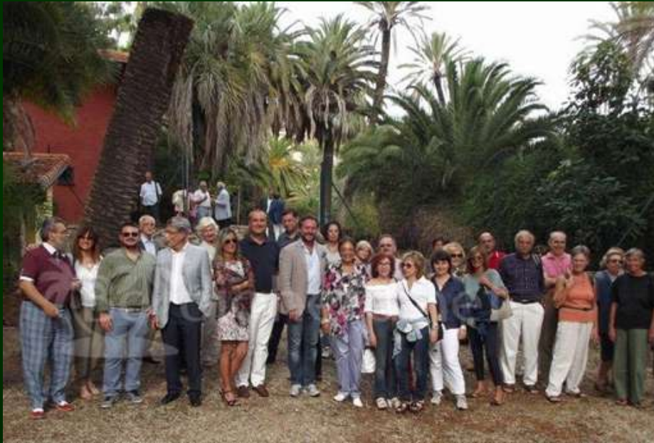
Convegno “LUDOVICO WINTER E LA RIVIERA” Un Giardiniere Tedesco a La Mortola Villa Hanbury, 8 settembre 2013