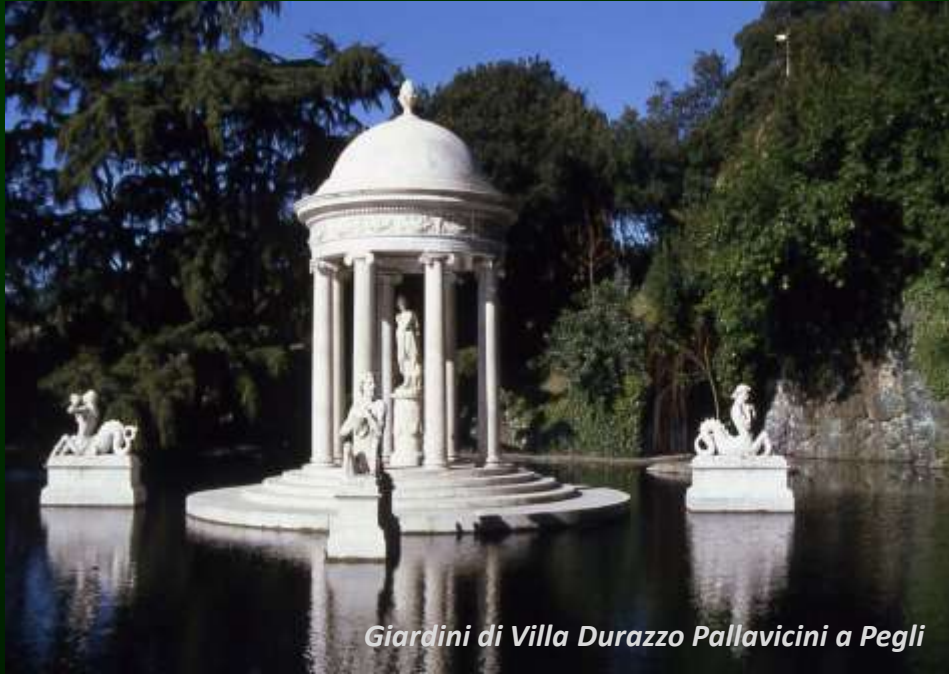
Giardini di Villa Durazzo Pallavicini a Pegli

“I piani urbanistici devono preservare l’ambiente dei giardini storici conservando intorno ad essi degli spazi verdi e devono assicurare inoltre il rispetto di un’atmosfera adatta alla natura del luogo”