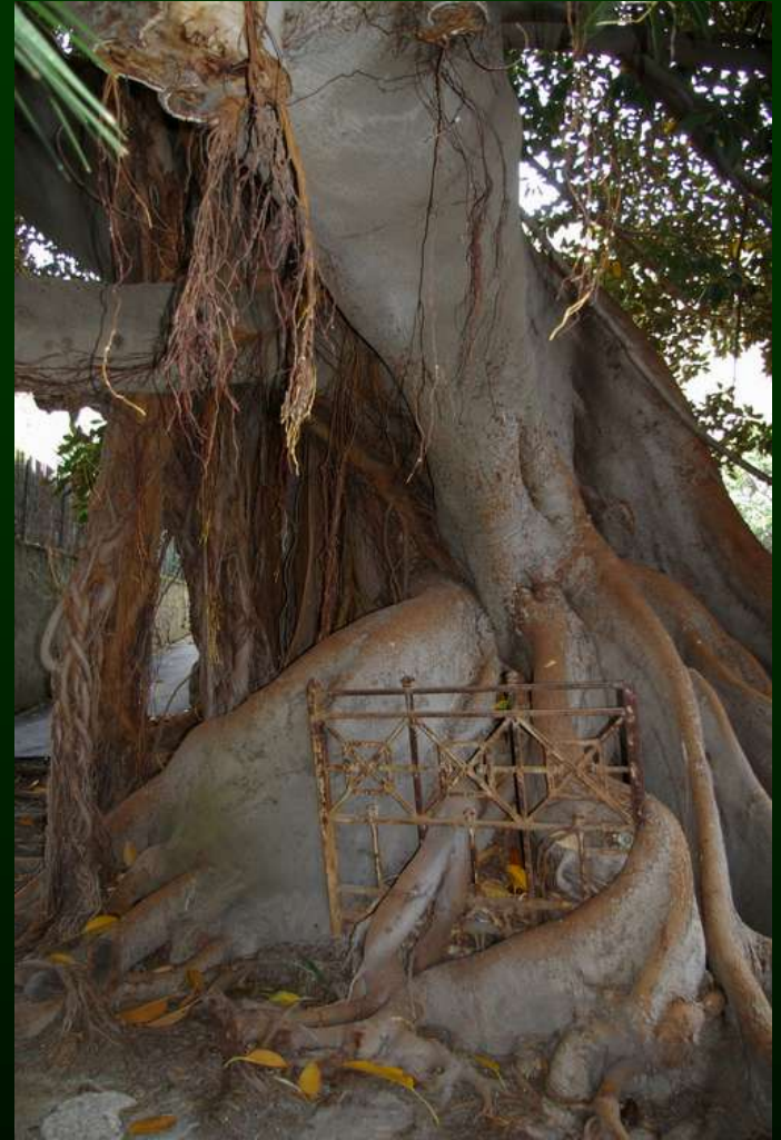
Giardino Villa Blicknell a Bordighera

“I piani urbanistici devono preservare l’ambiente dei giardini storici conservando intorno ad essi degli spazi verdi e devono assicurare inoltre il rispetto di un’atmosfera adatta alla natura del luogo”