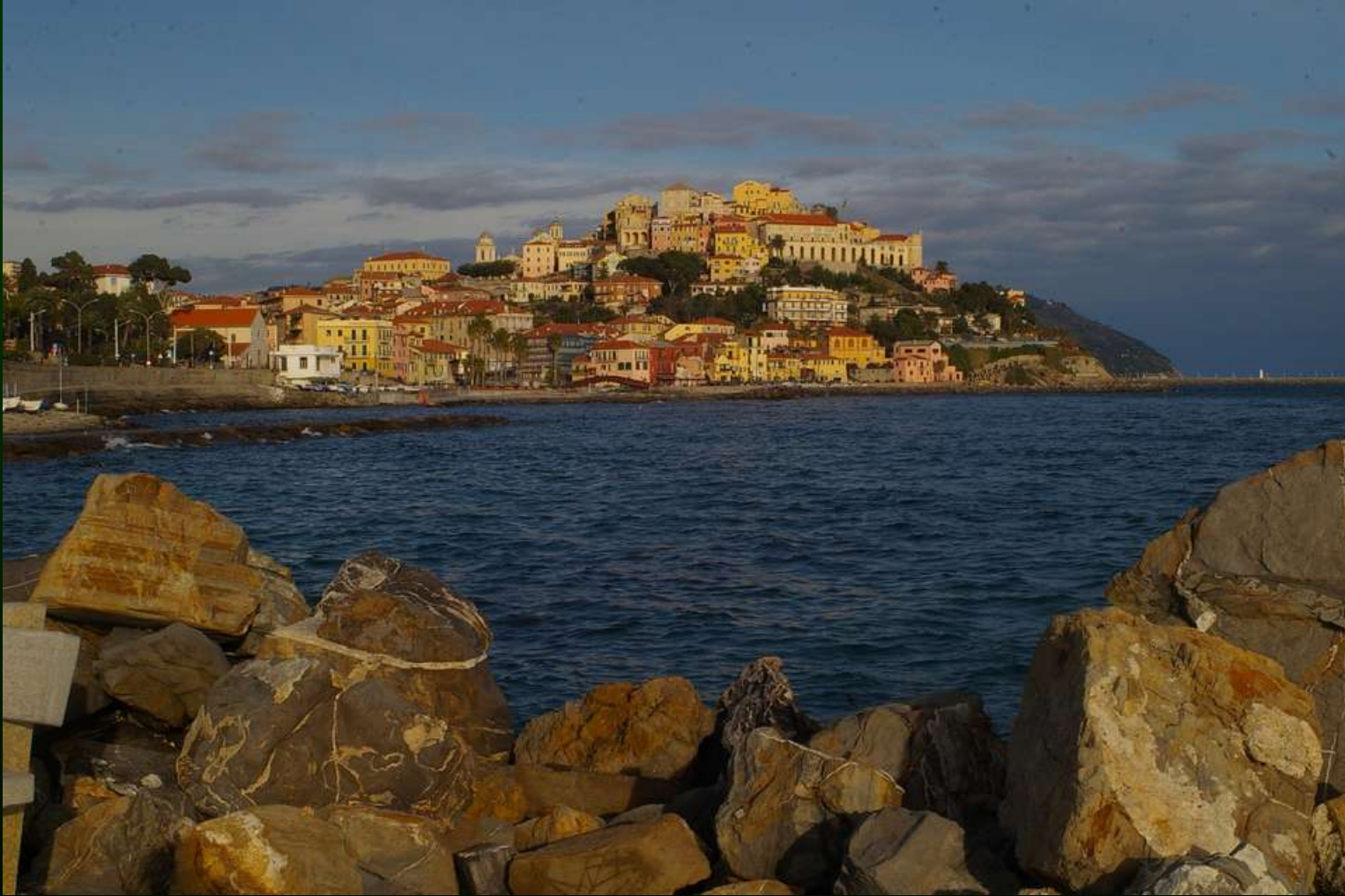
Imperia Porto Maurizio (IM)