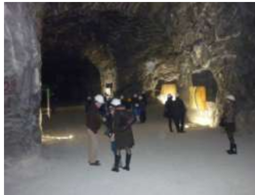
Murisengo Underground Gallery (nov. 2012) – mostra fotografica di Mark Cooper