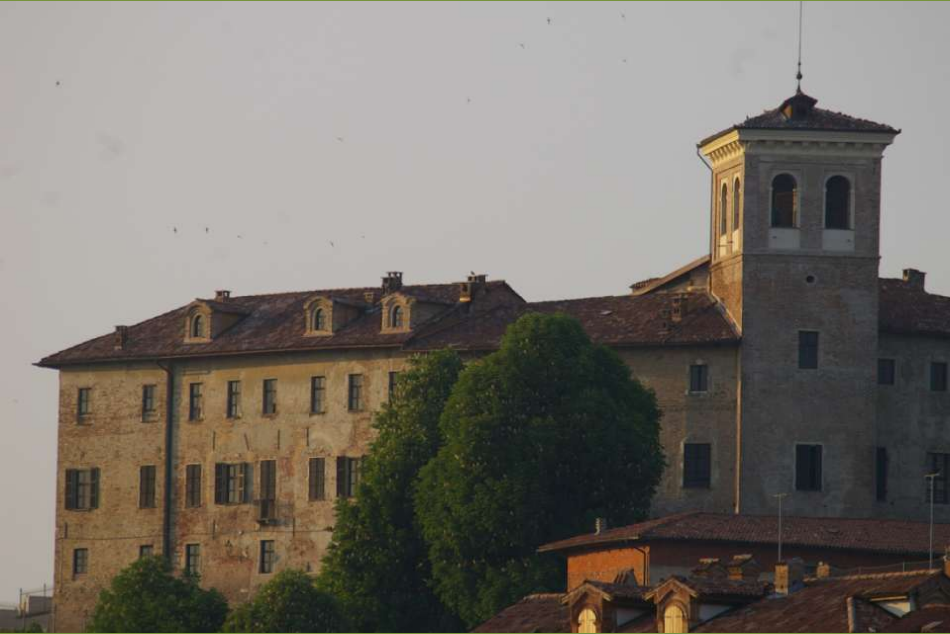
Moncuco Torinese (TO)