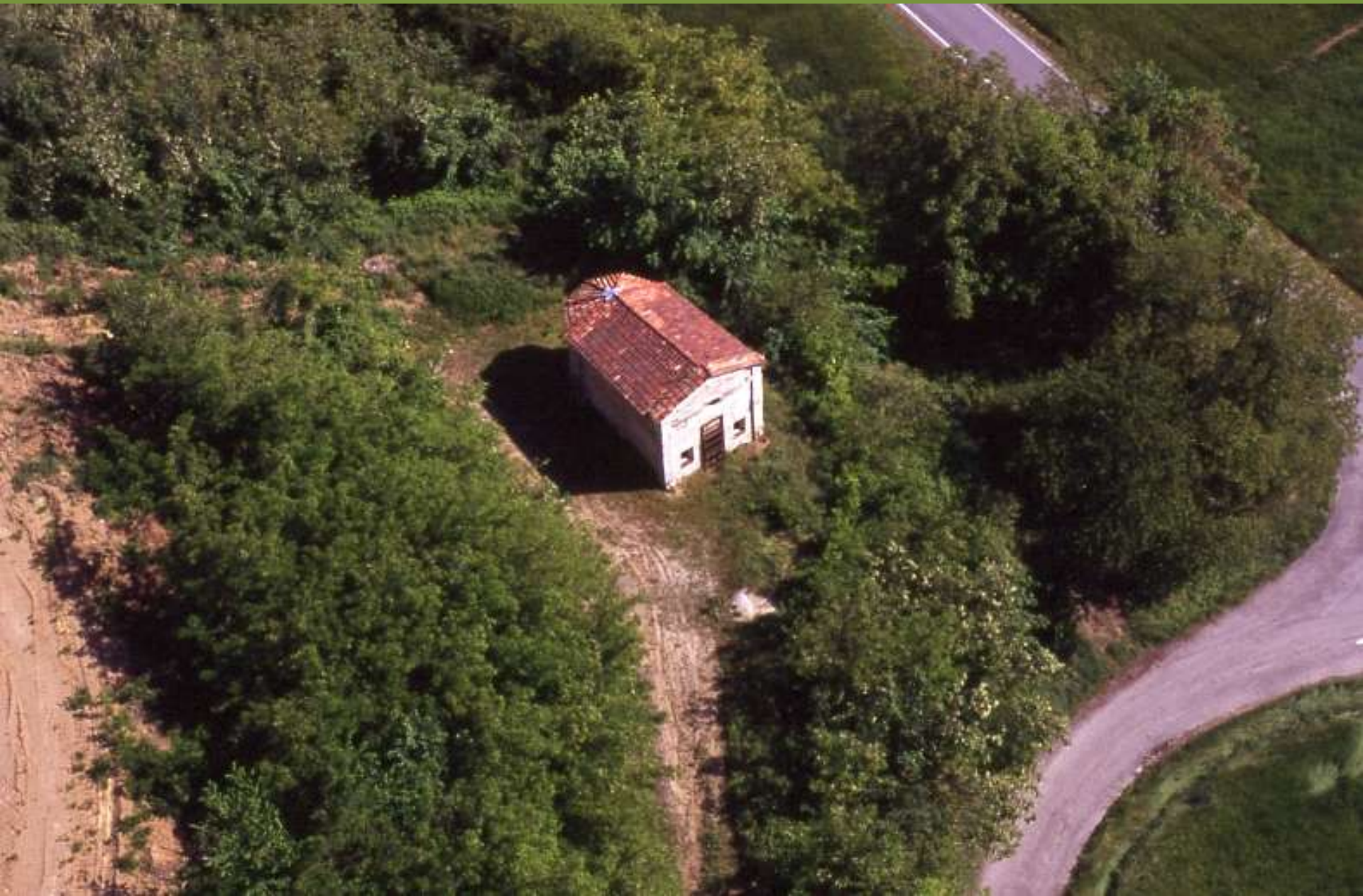
Foto aerea