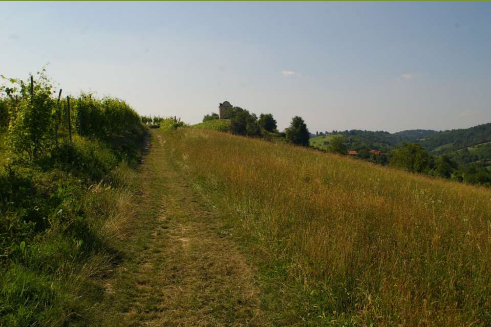
Paesaggio agrario a Castelnovo Don Bosco (AT)