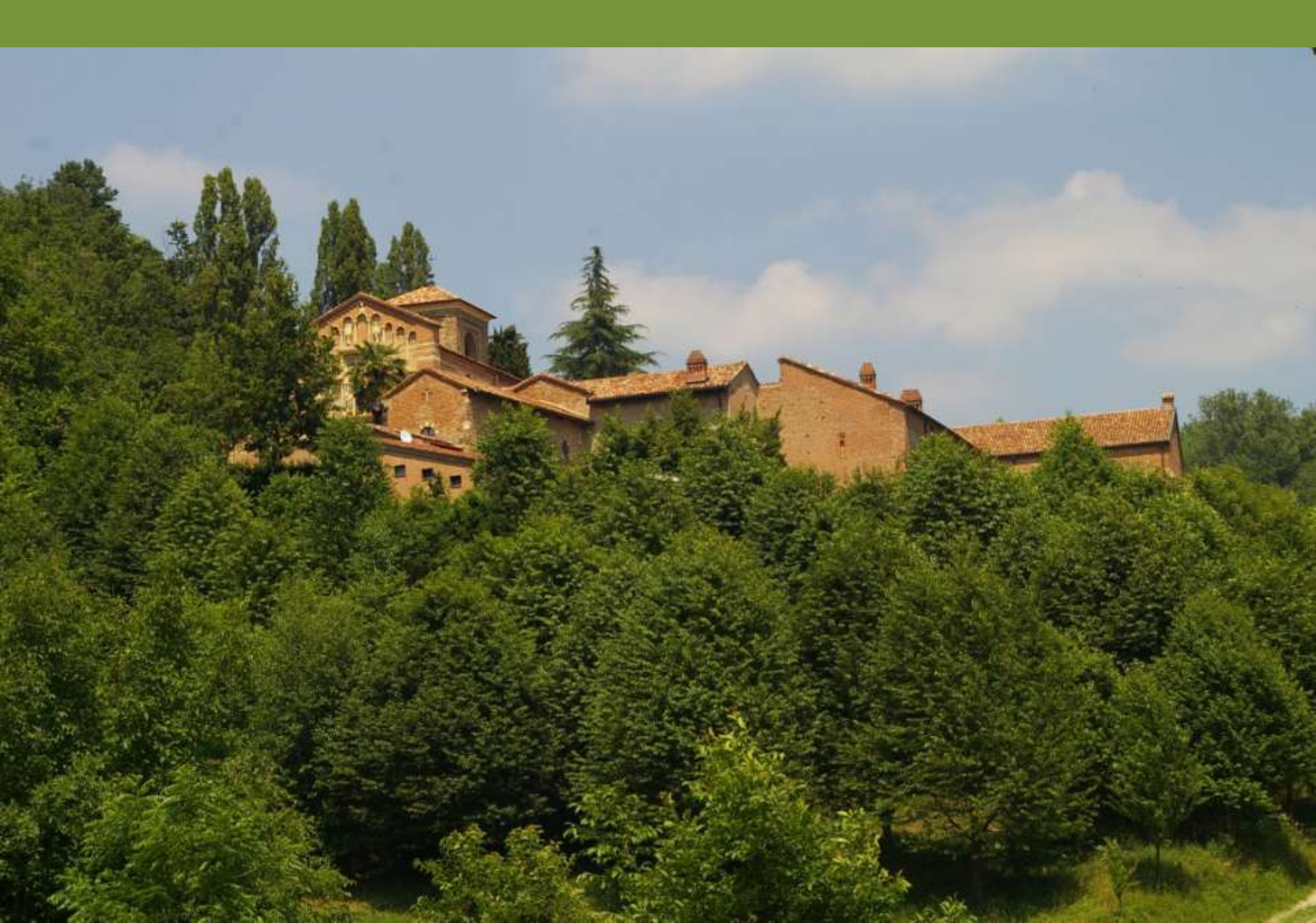
Canonica di Santa Maria di Vezzolano ad Albugnano (AT)