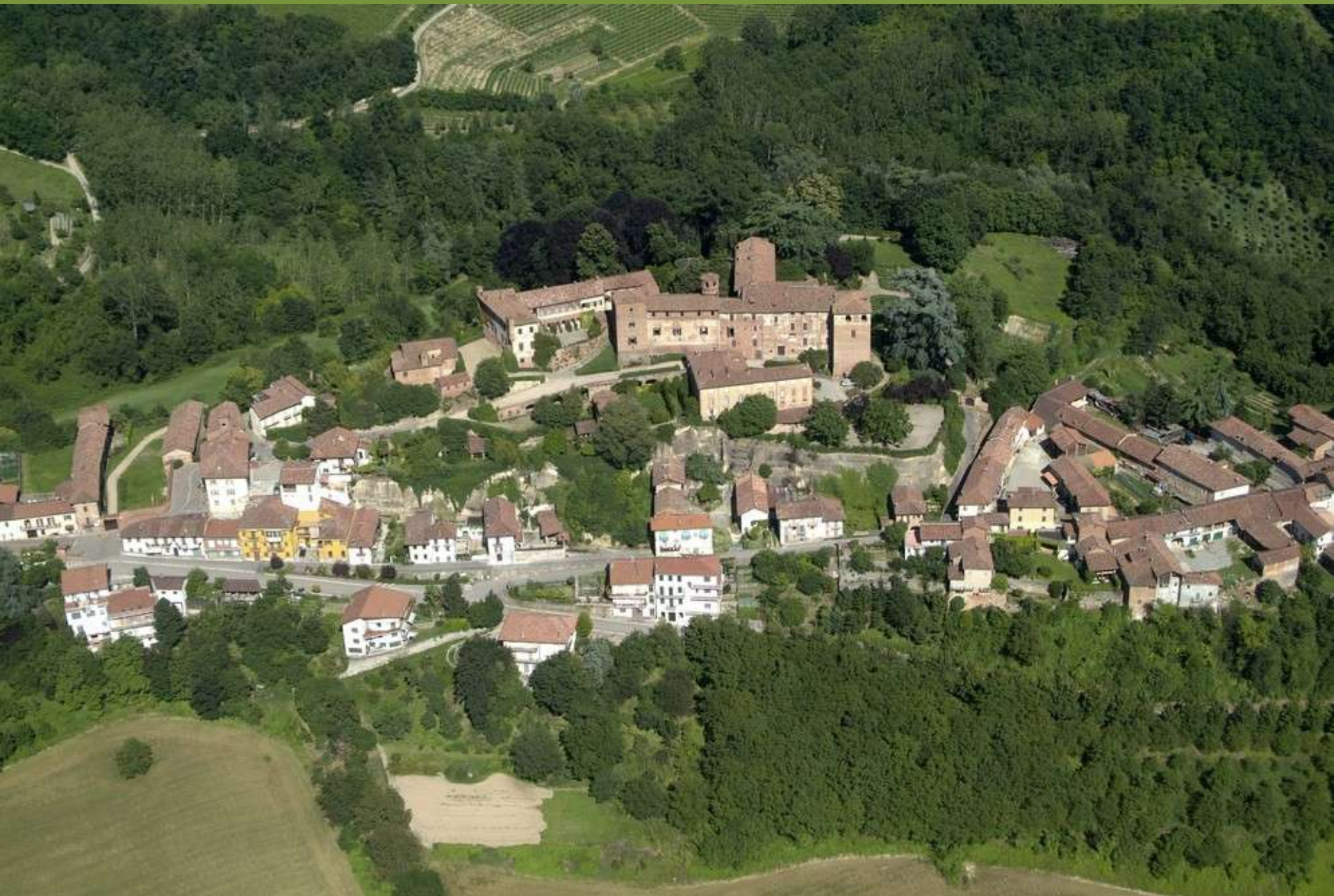
Foto aerea