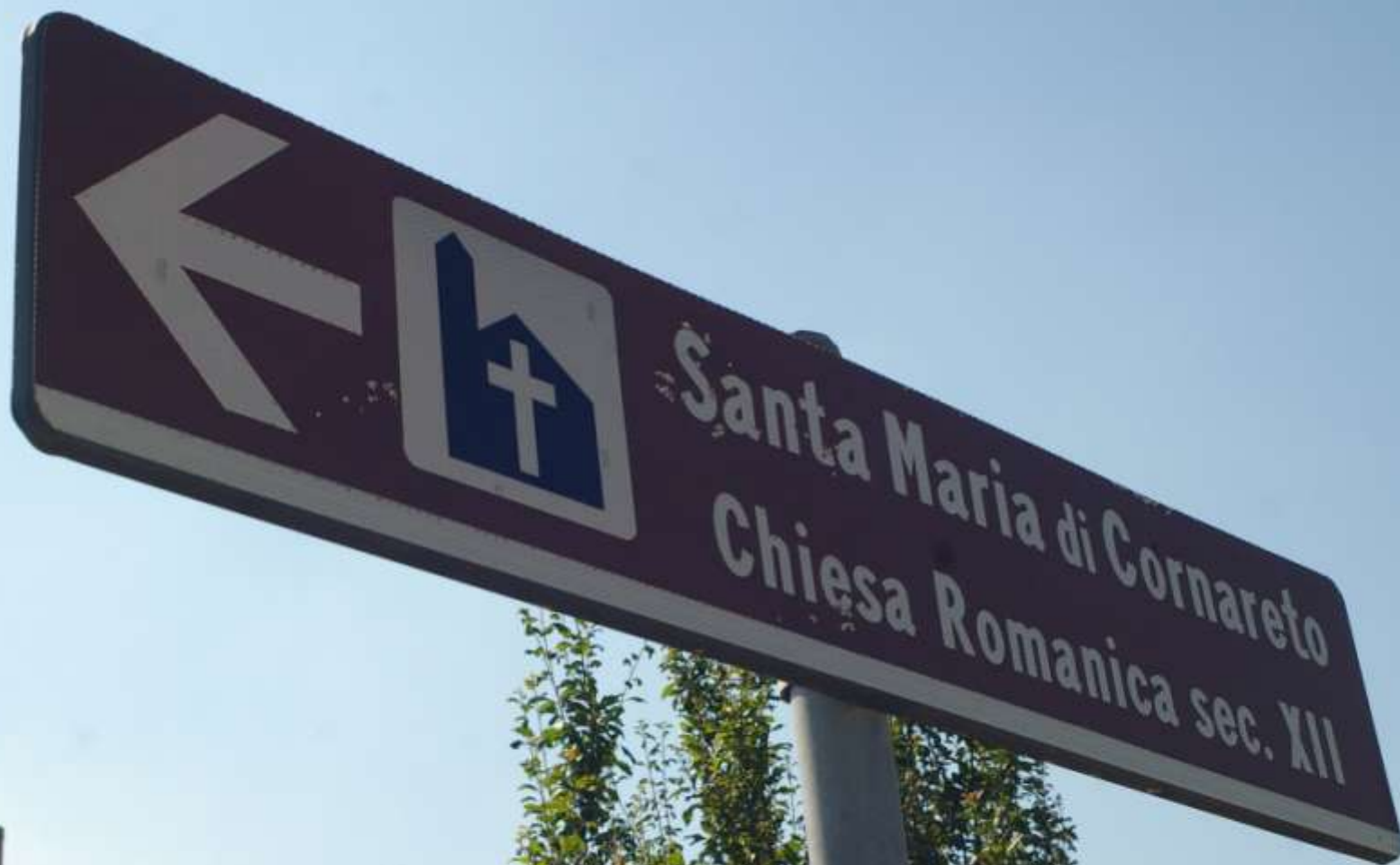
Chiesa romanica di Santa Maria di Cornareto a Castelnuovo Don Bosco (AT)