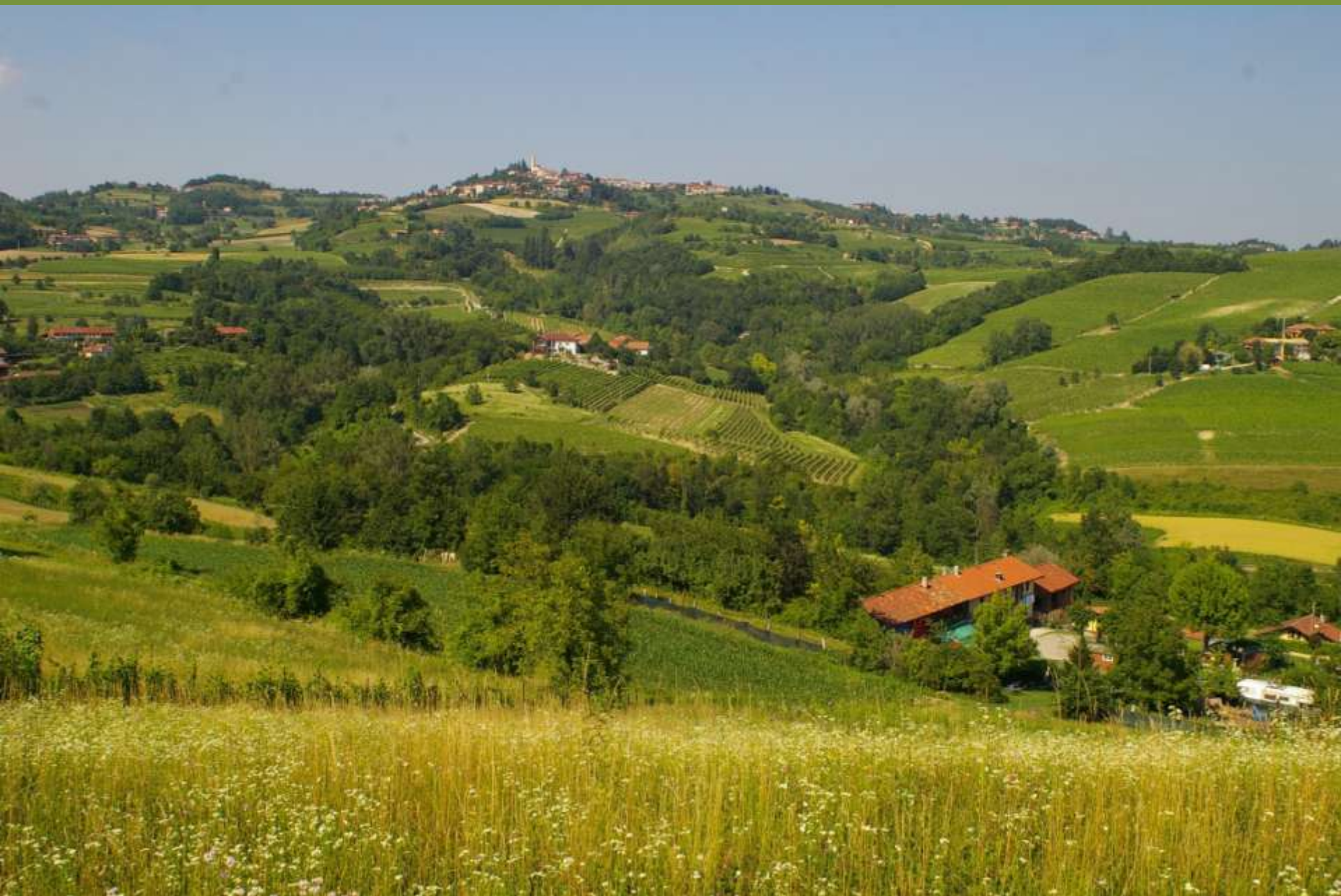
Paesaggio agrario tra Castelnovo Don Bosco ed Albugnano (AT)