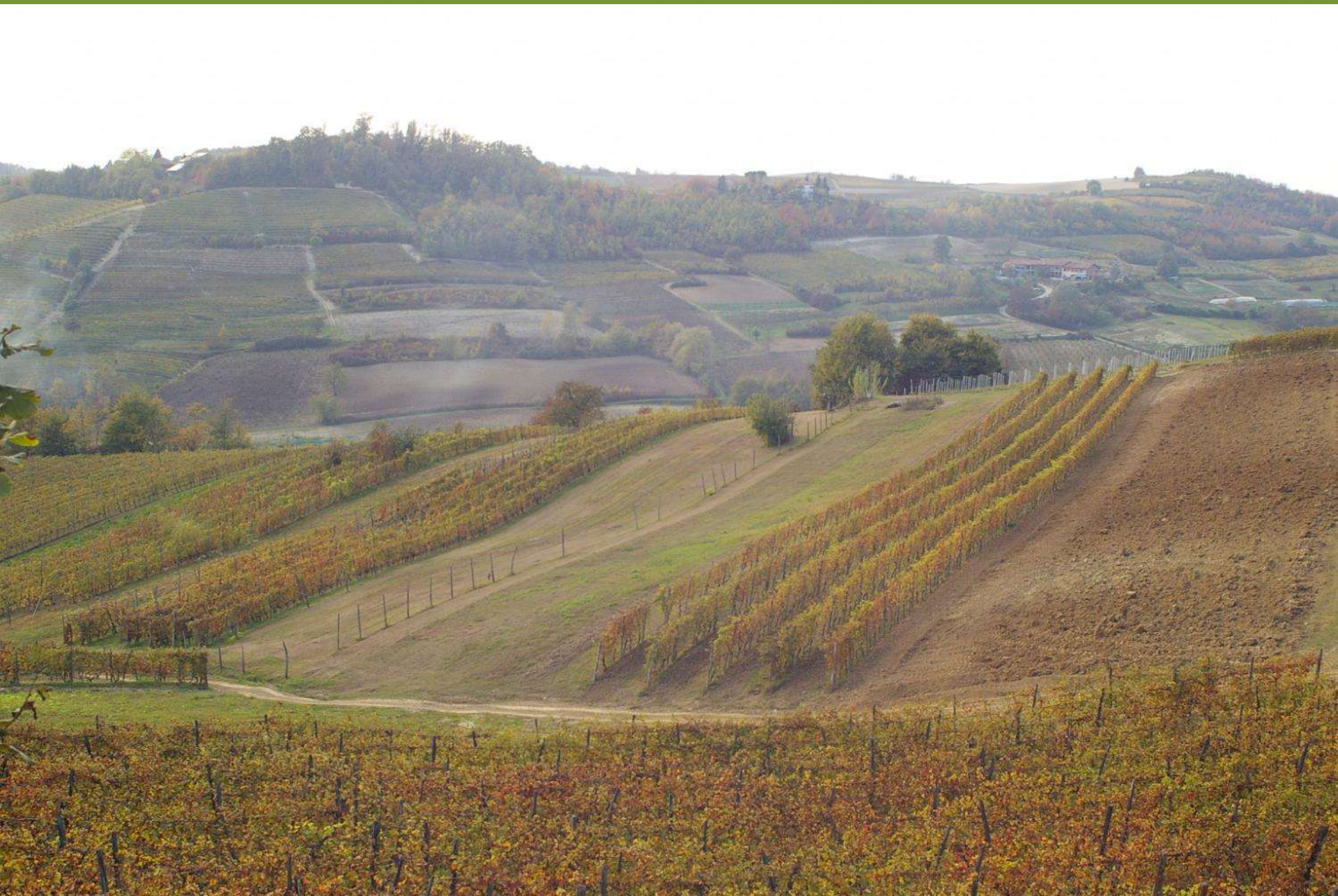
Castelnovo Don Bosco (AT)