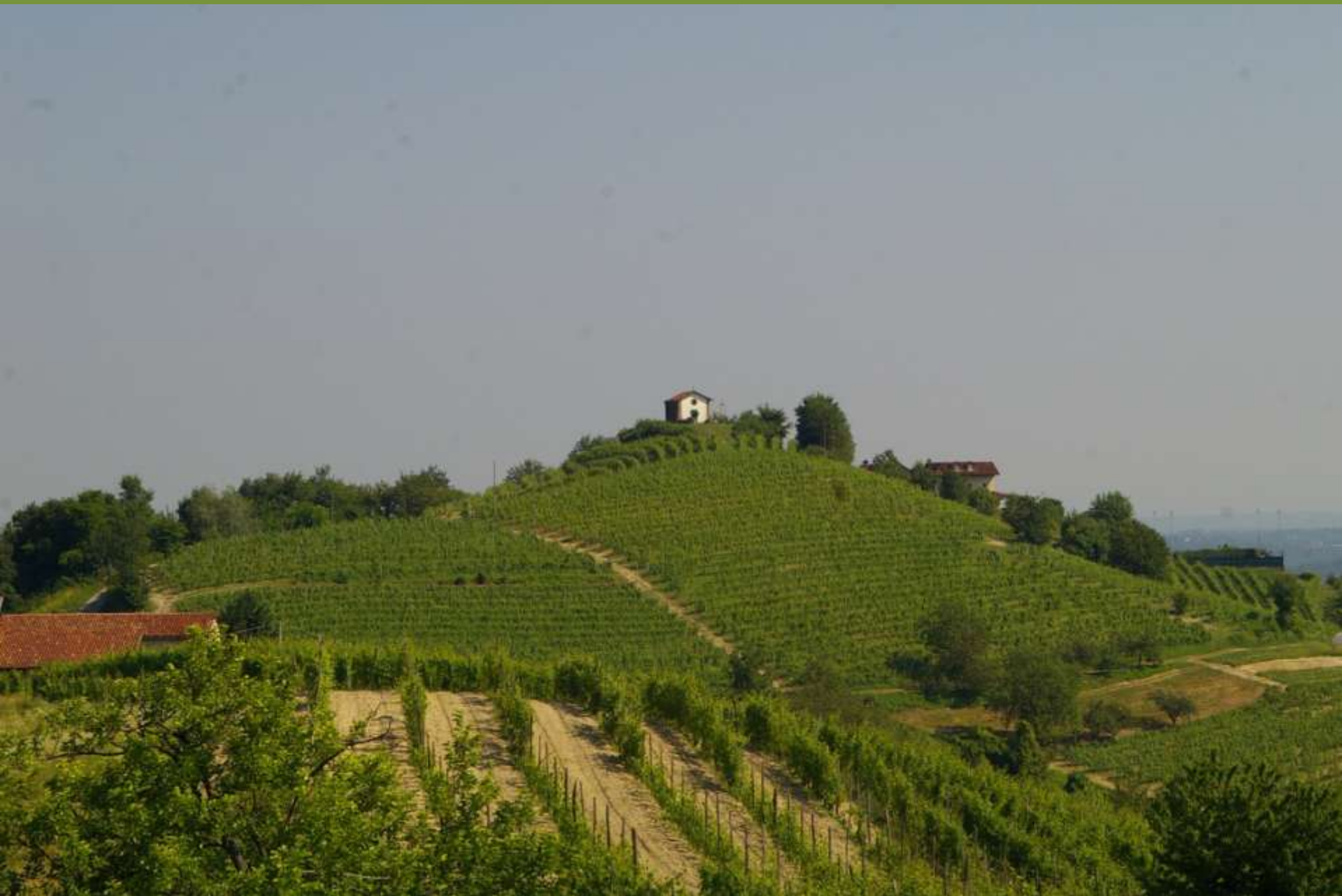
Chiesa romanica di Santa Maria di Cornareto a Castelnuovo Don Bosco (AT)