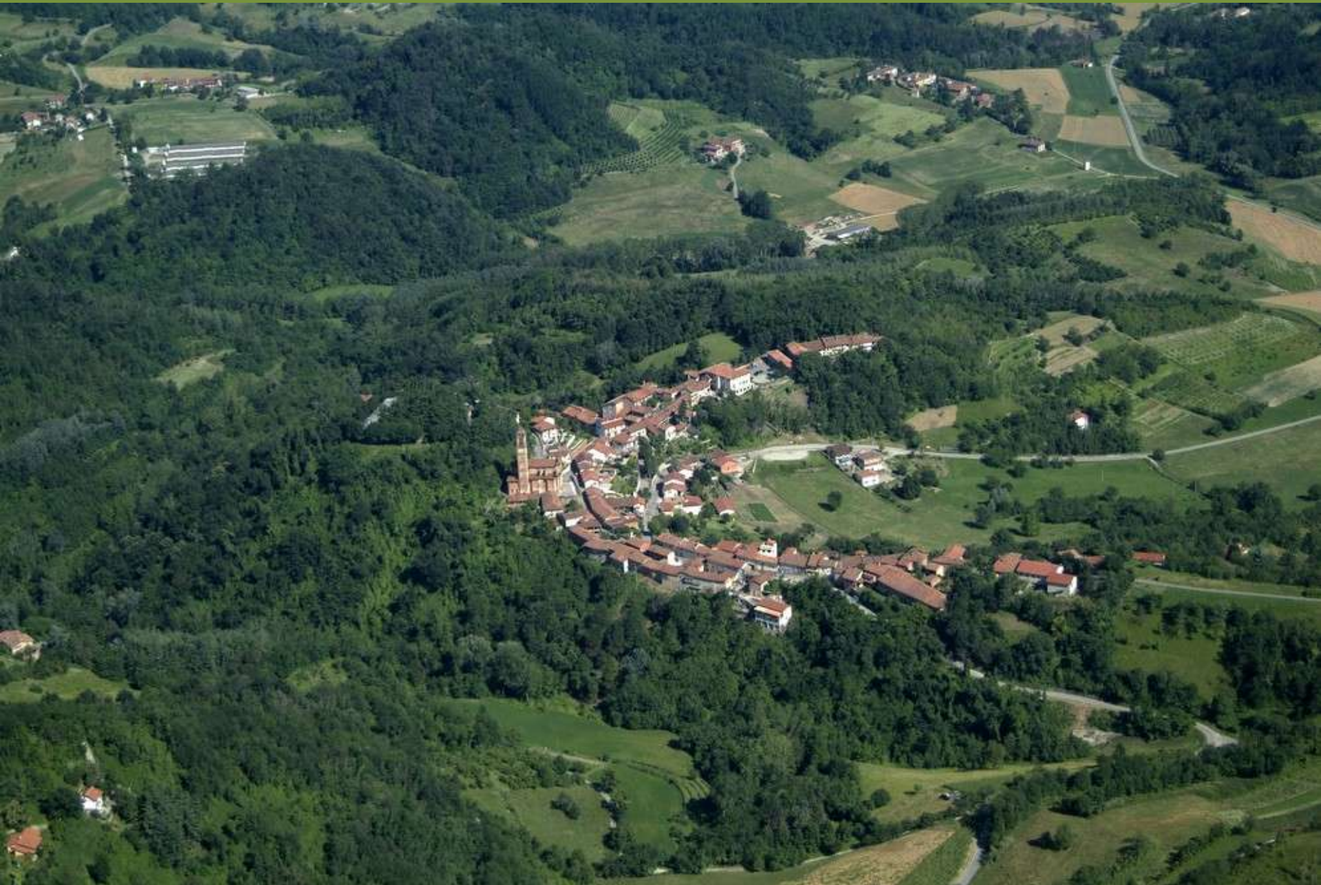
Foto aerea