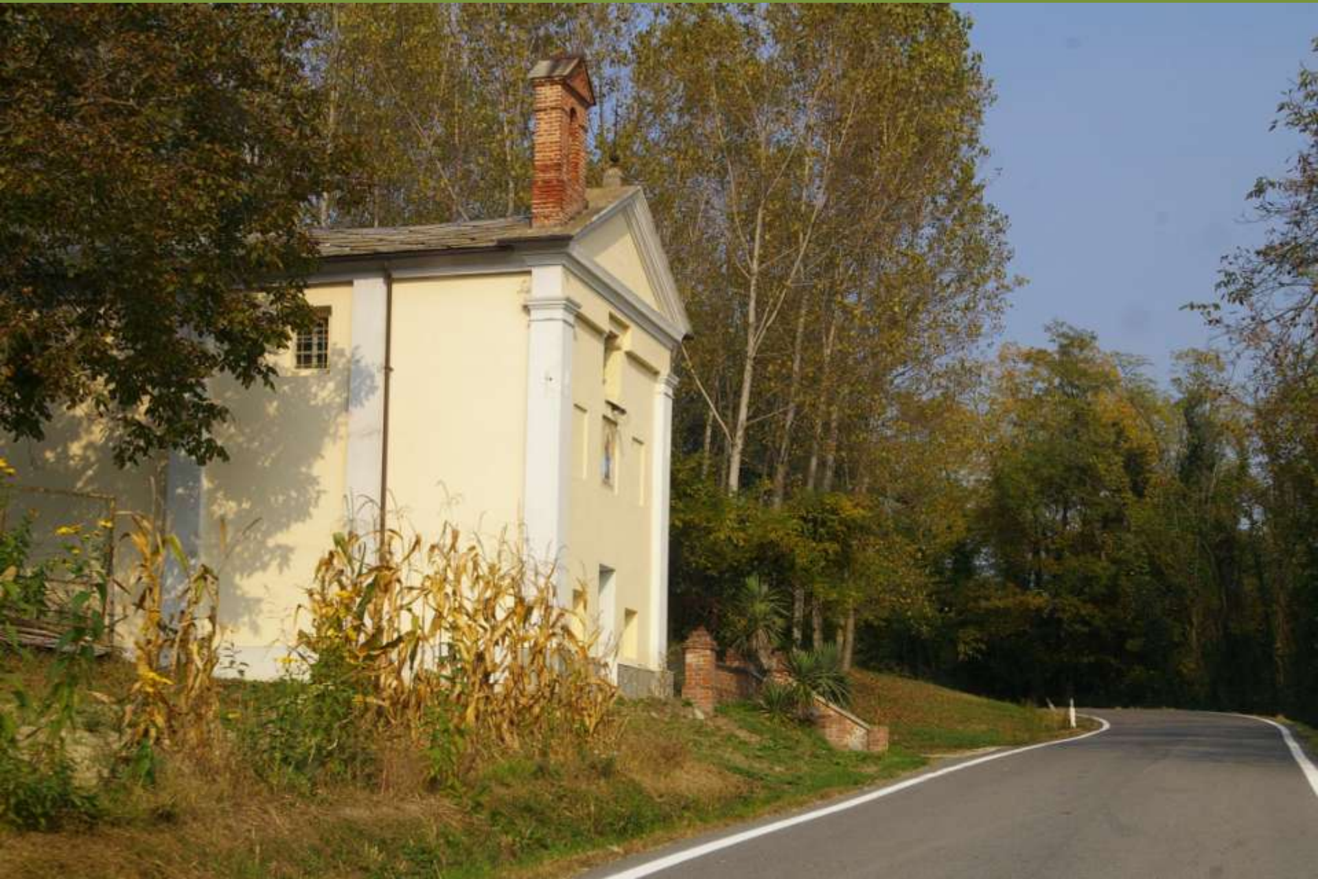
Moncuco Torinese (TO)