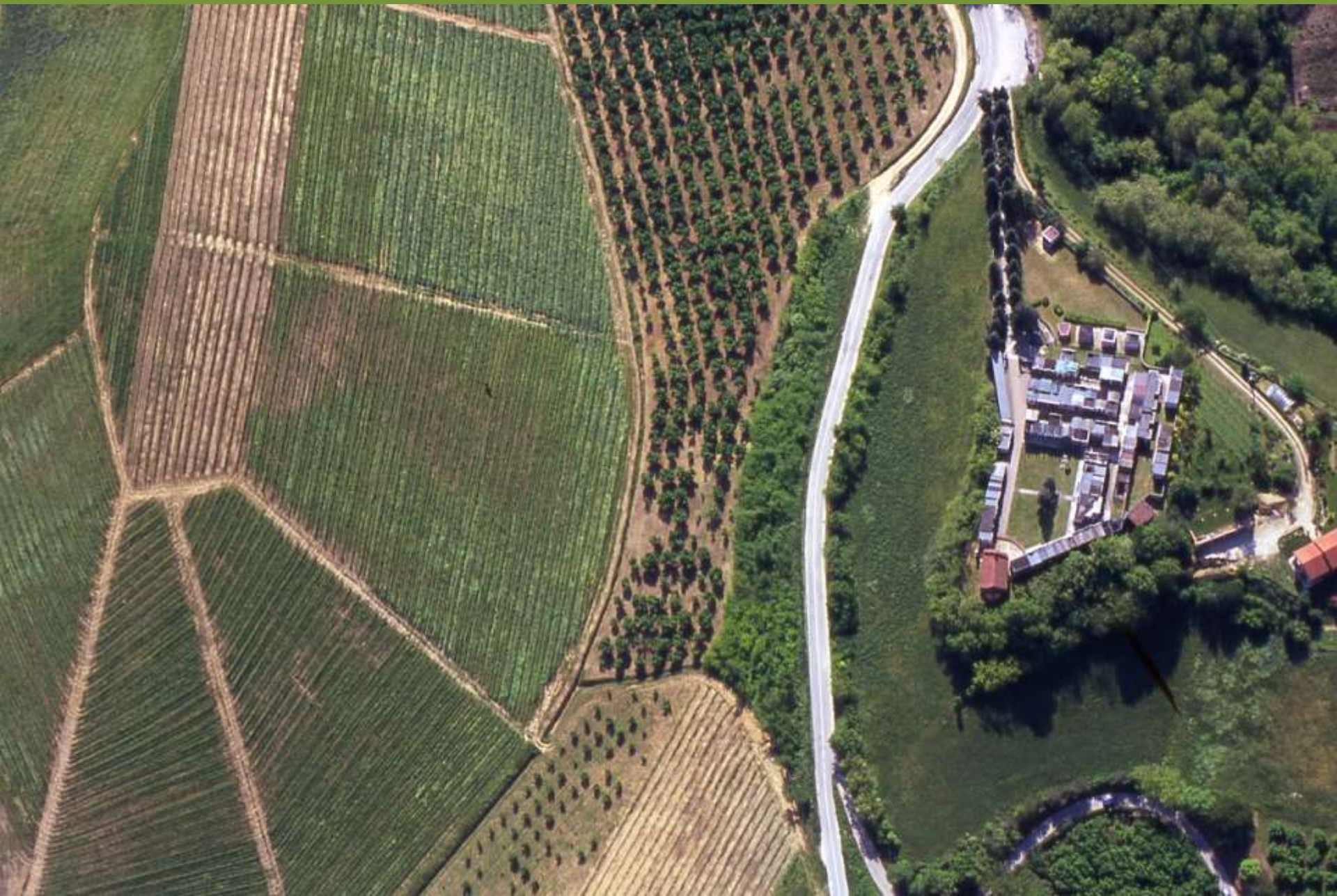
Foto aerea