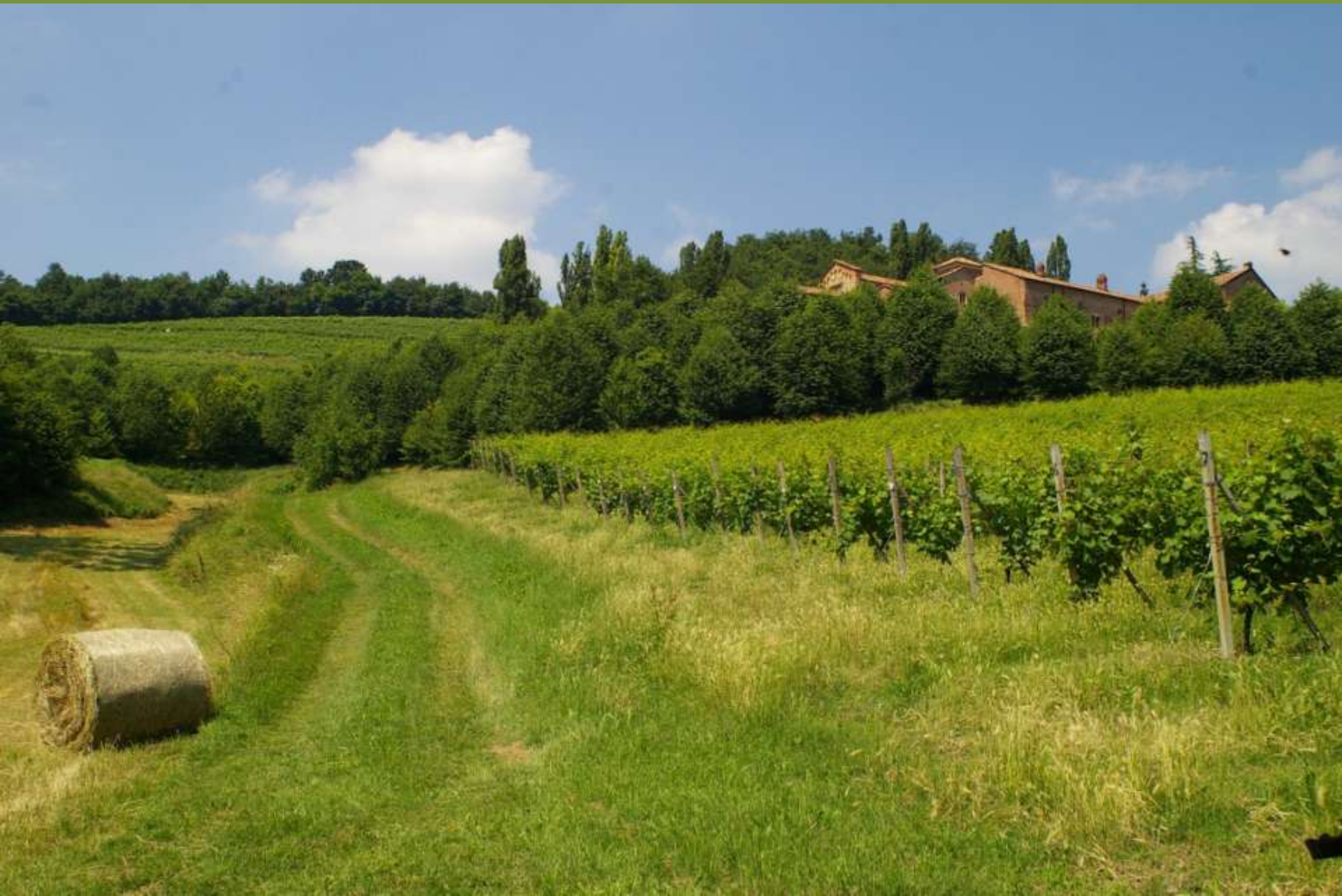
Canonica di Santa Maria di Vezzolano ad Albugnano (AT)