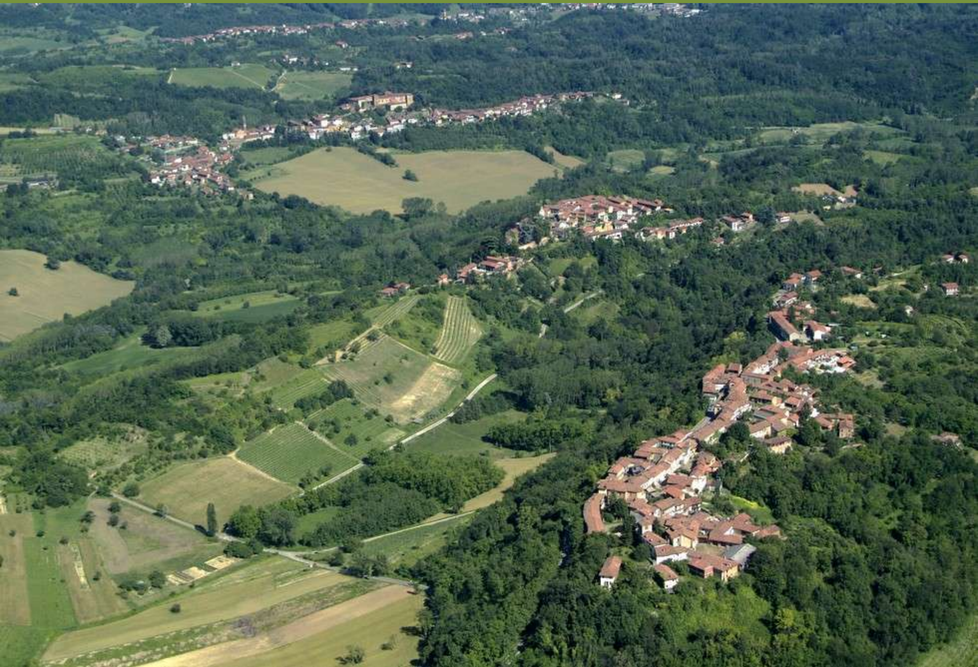
Foto aerea