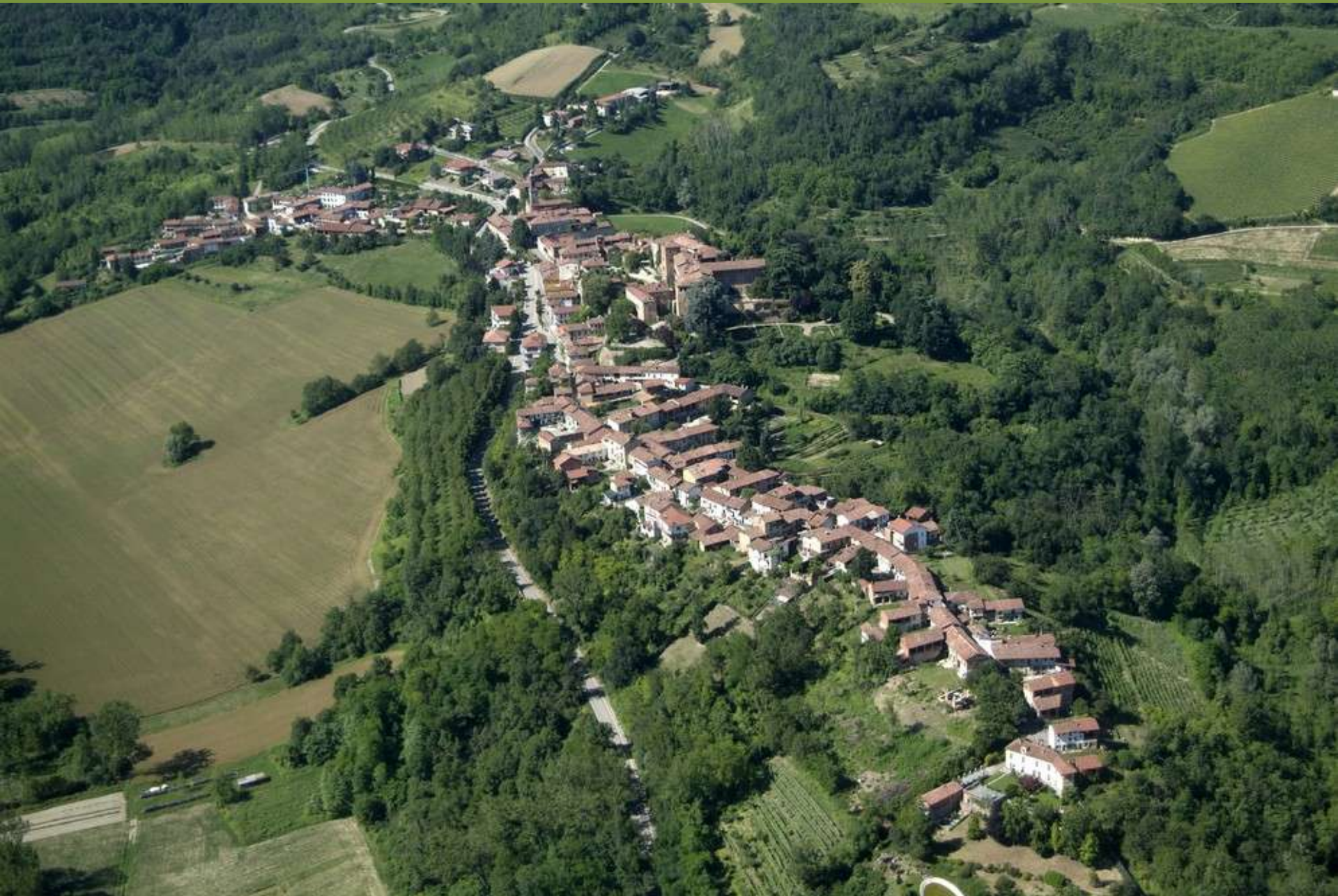
Foto aerea