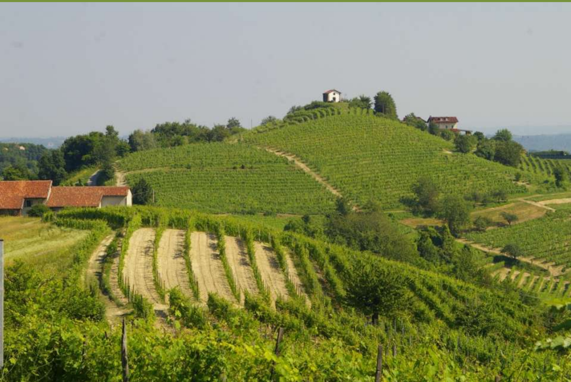
Chiesa romanica di Santa Maria di Cornareto a Castelnuovo Don Bosco (AT)