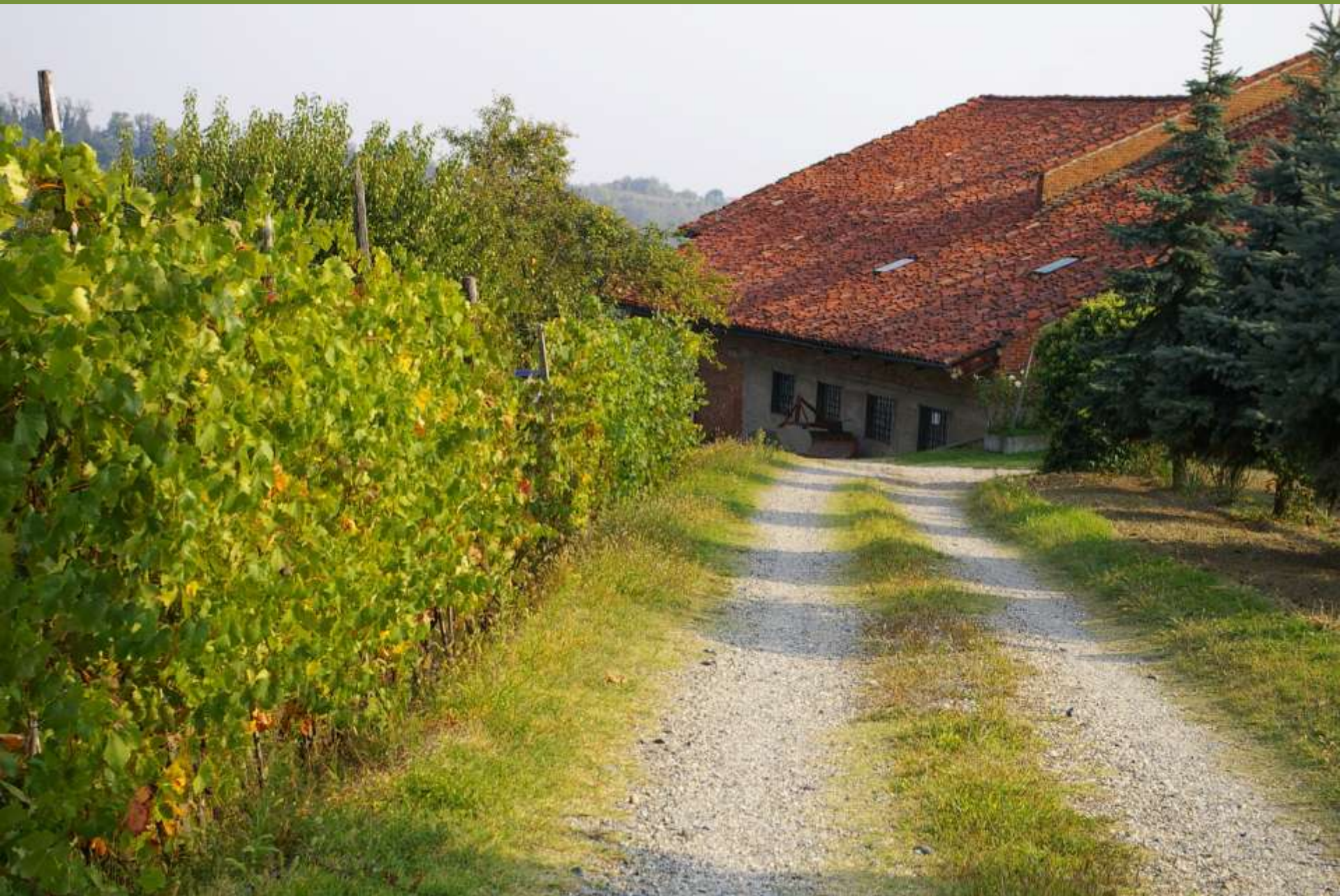
Moncuco Torinese (TO)