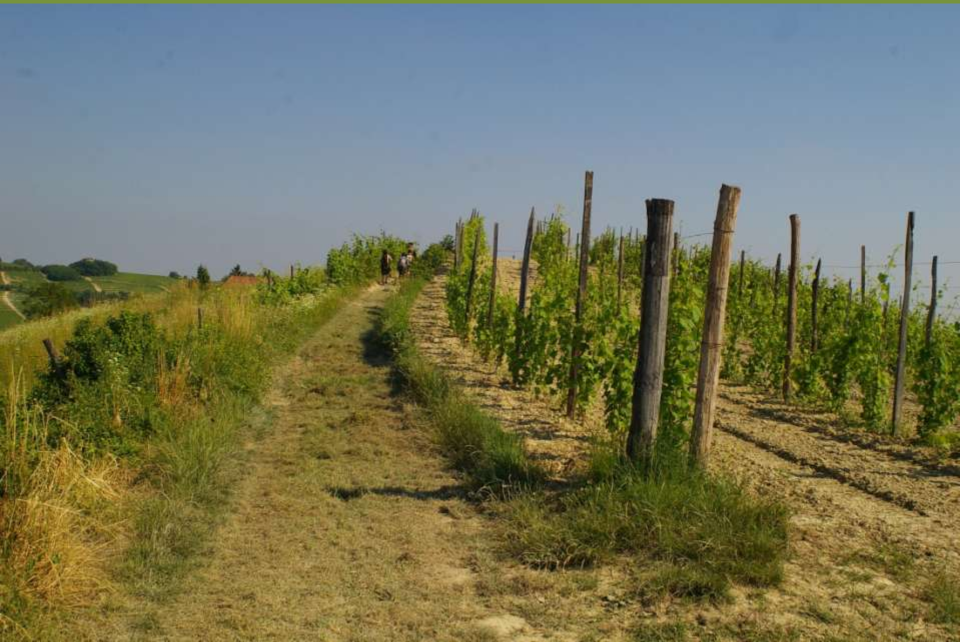
Vigneti a Castelnovo Don Bosco (AT)