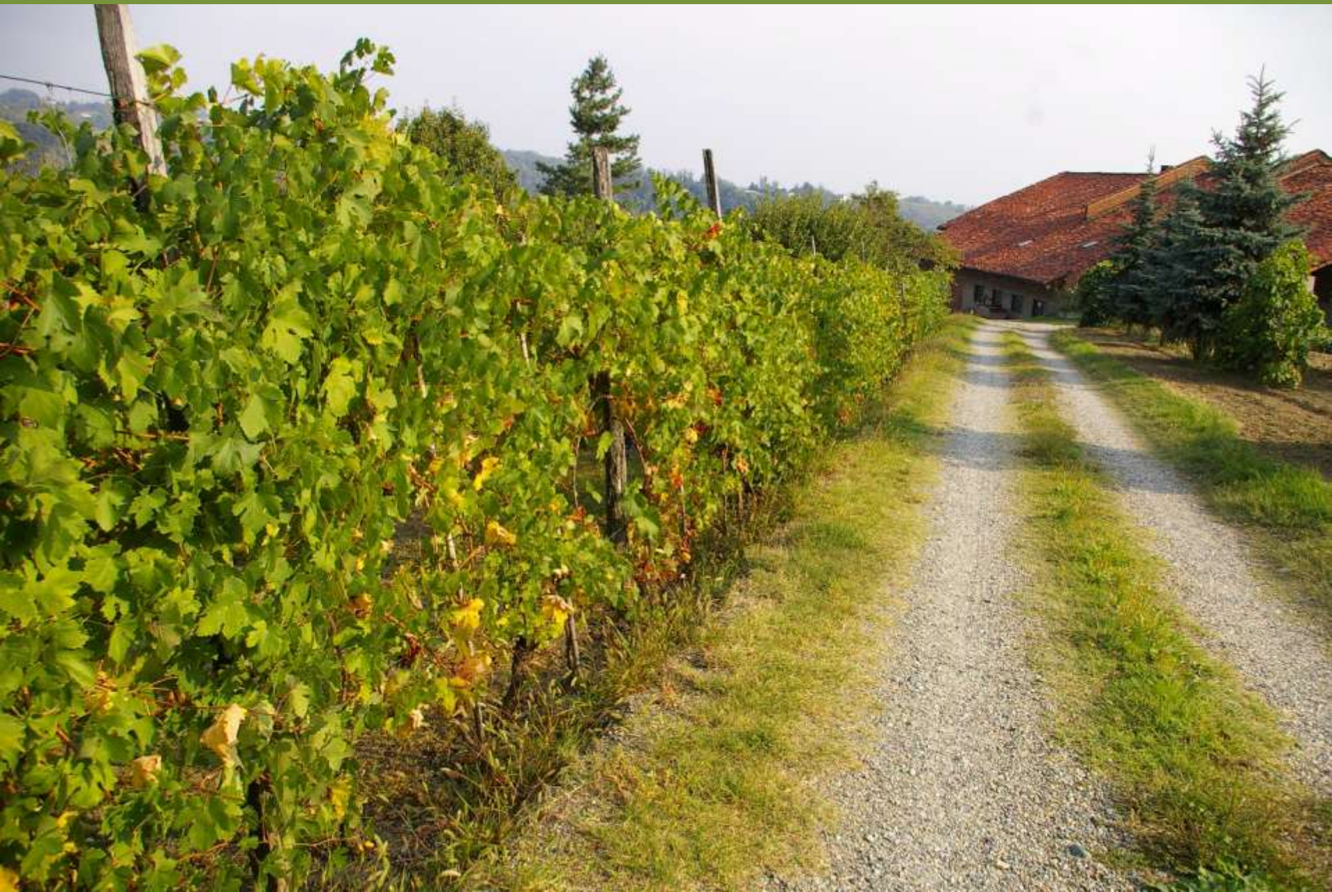
Moncuco Torinese (TO)