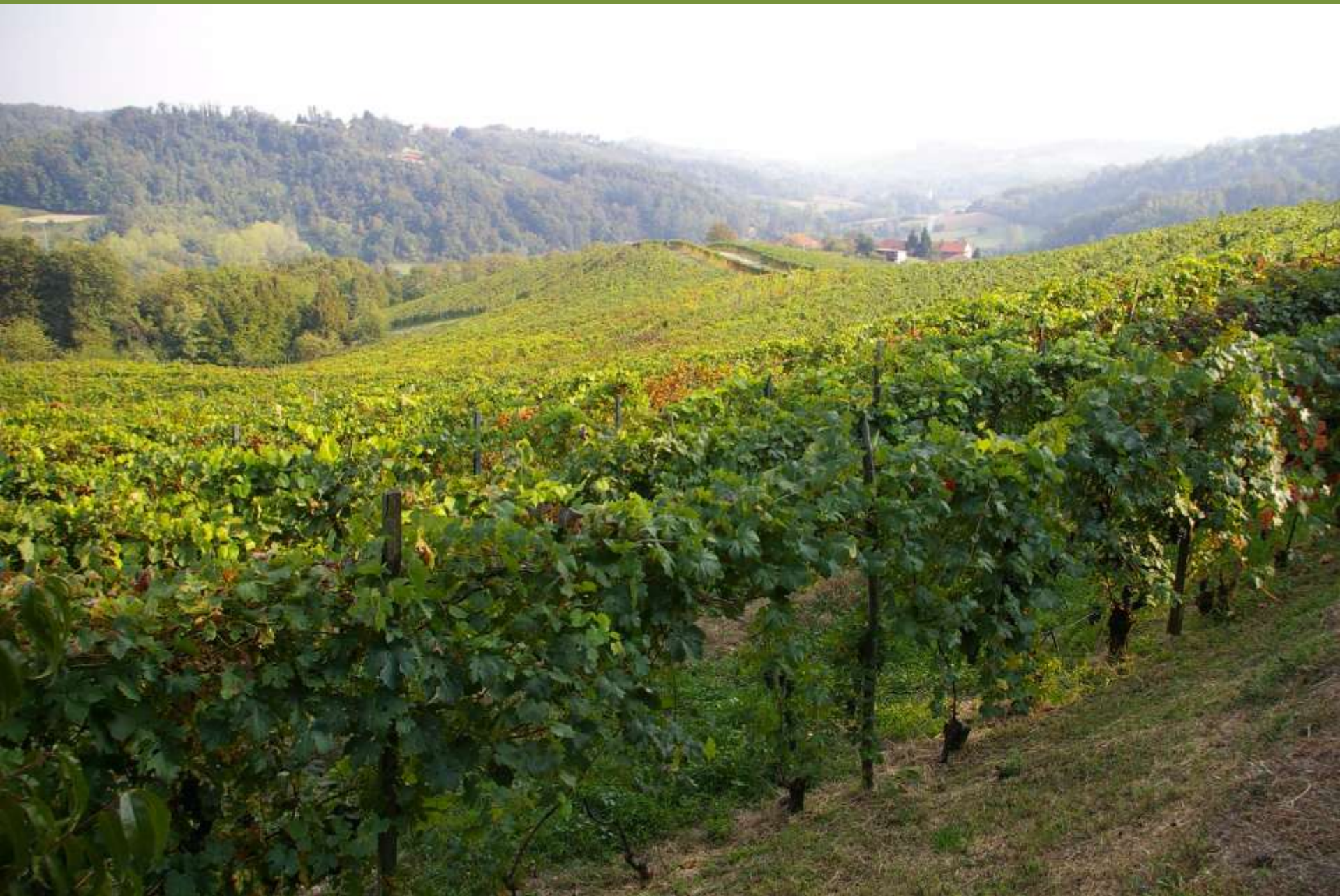
Moncuco Torinese (TO)