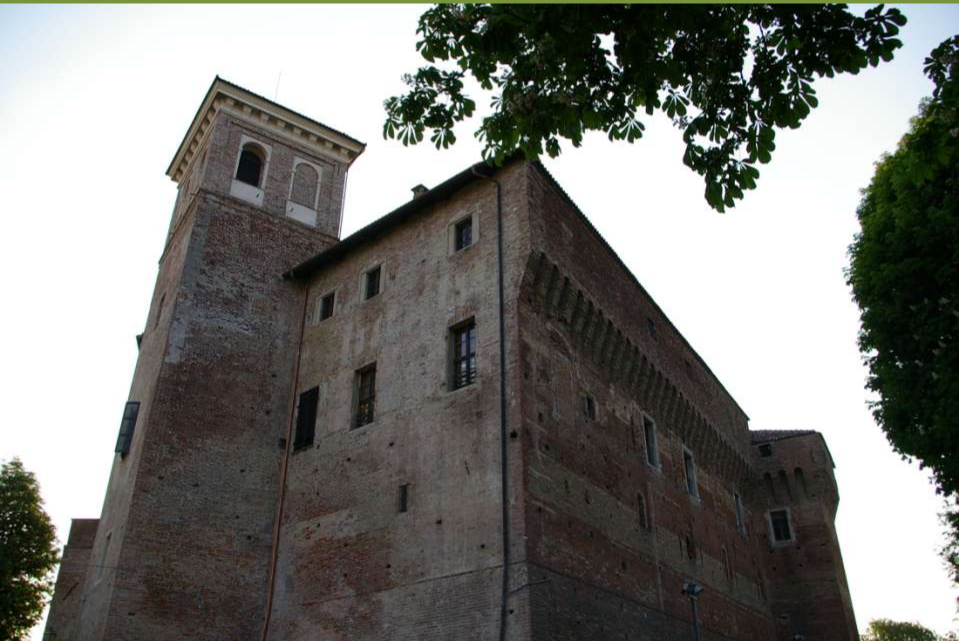
Moncuoco Torinese (TO)