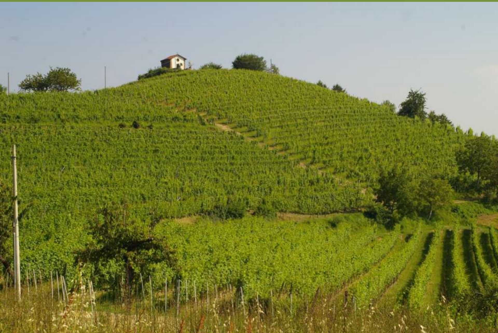
Chiesa romanica di Santa Maria di Cornareto a Castelnuovo Don Bosco (AT)