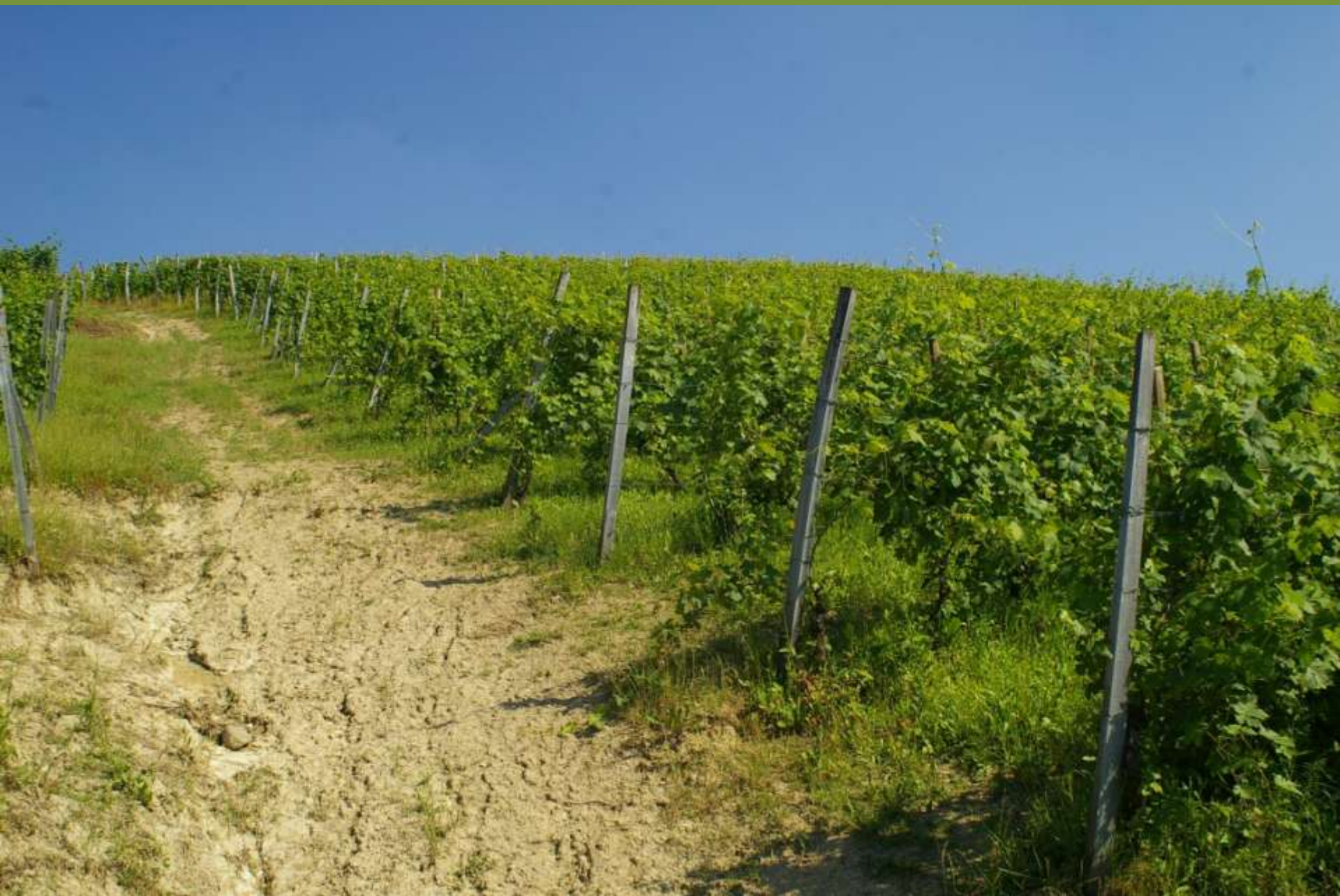
Vigneti a Castelnuovo Don Bosco (AT)