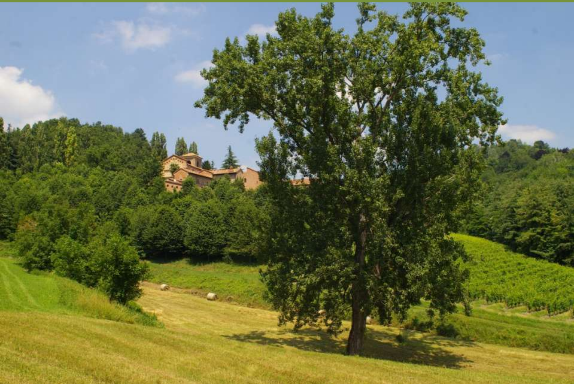
Canonica di Santa Maria di Vezzolano ad Albugnano (AT)