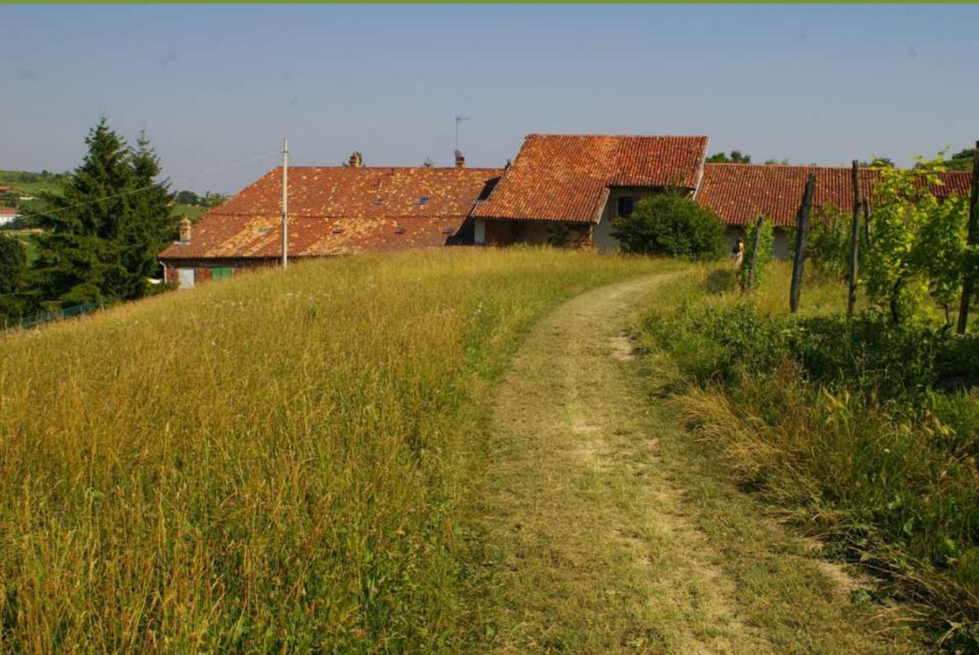
Paesaggio agrario a Castelnovo Don Bosco (AT)