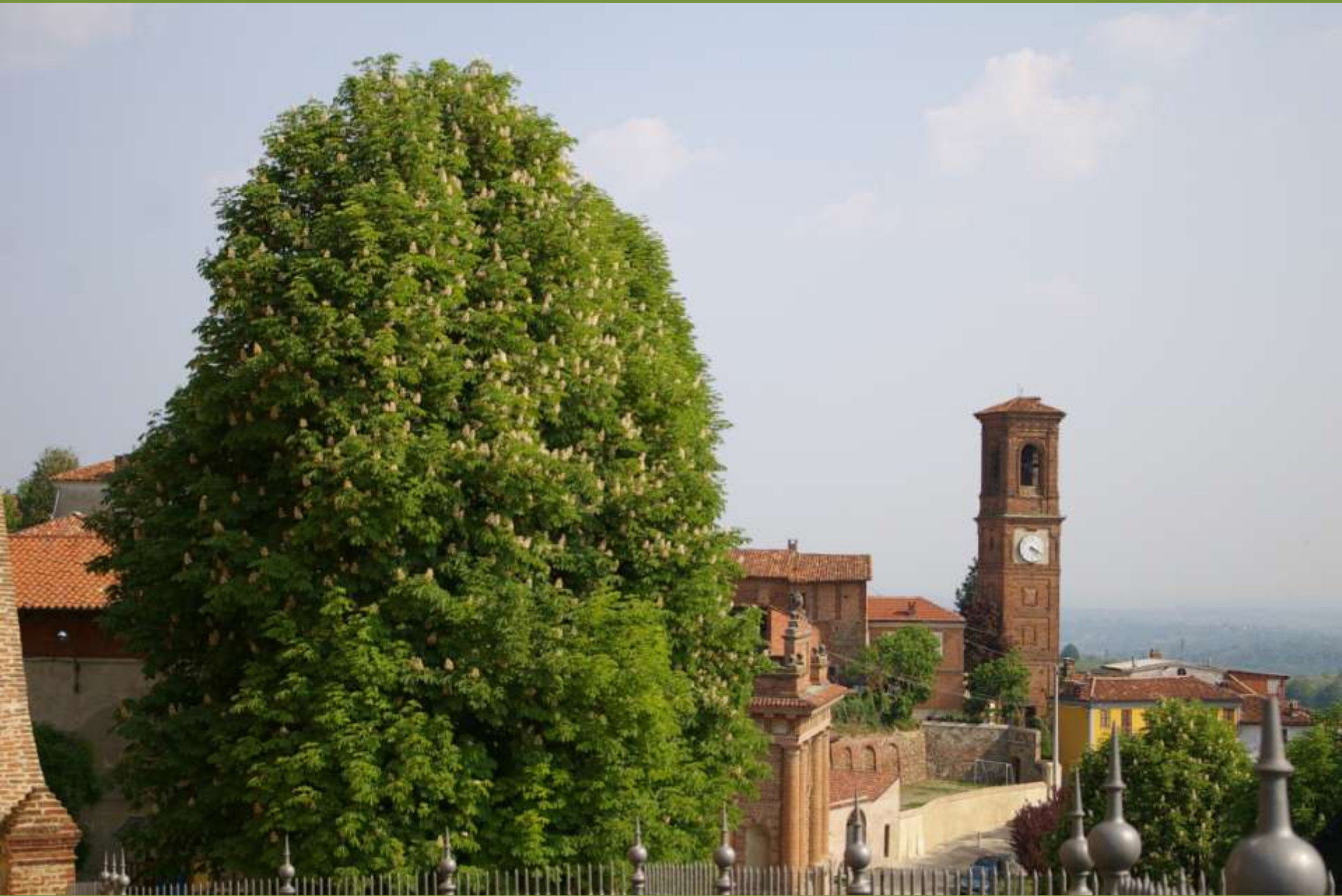
Moncuco Torinese (TO)