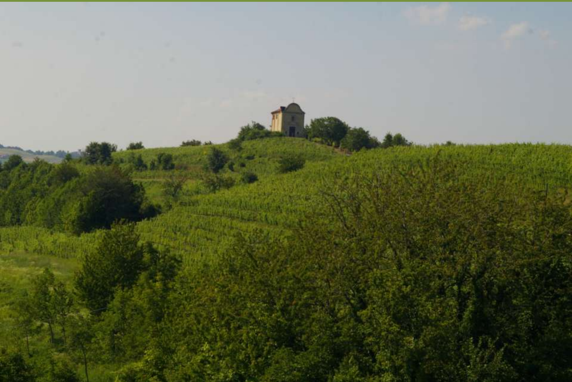
Chiesa di San Michele a Castelnuovo Don Bosco (AT)