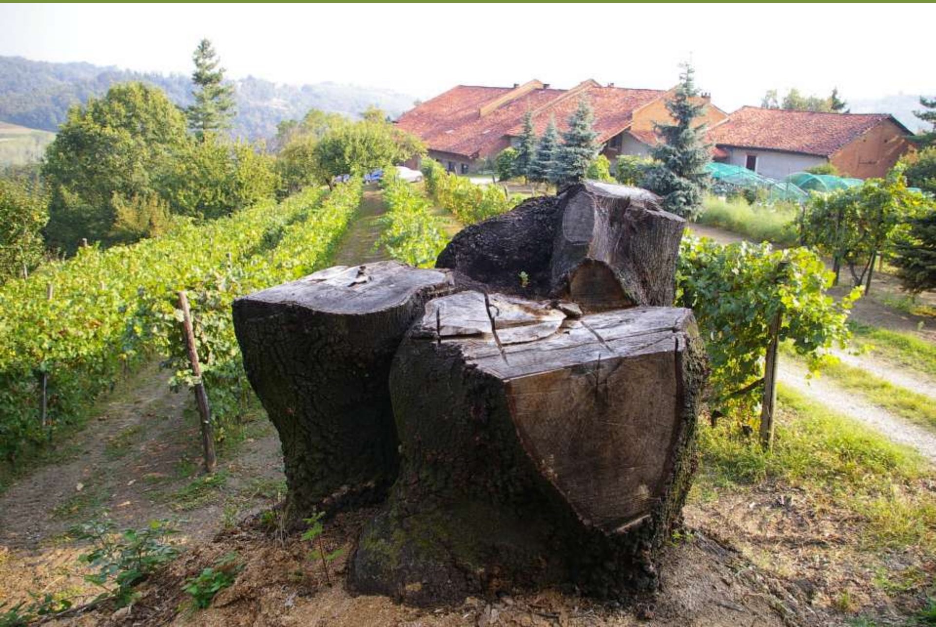
Moncuco Torinese (TO)