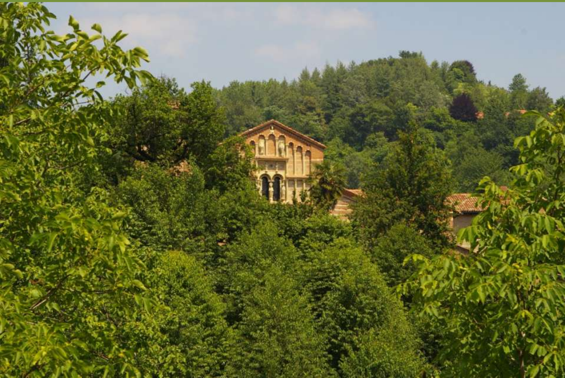
Canonica di Santa Maria di Vezzolano ad Albugnano (AT)