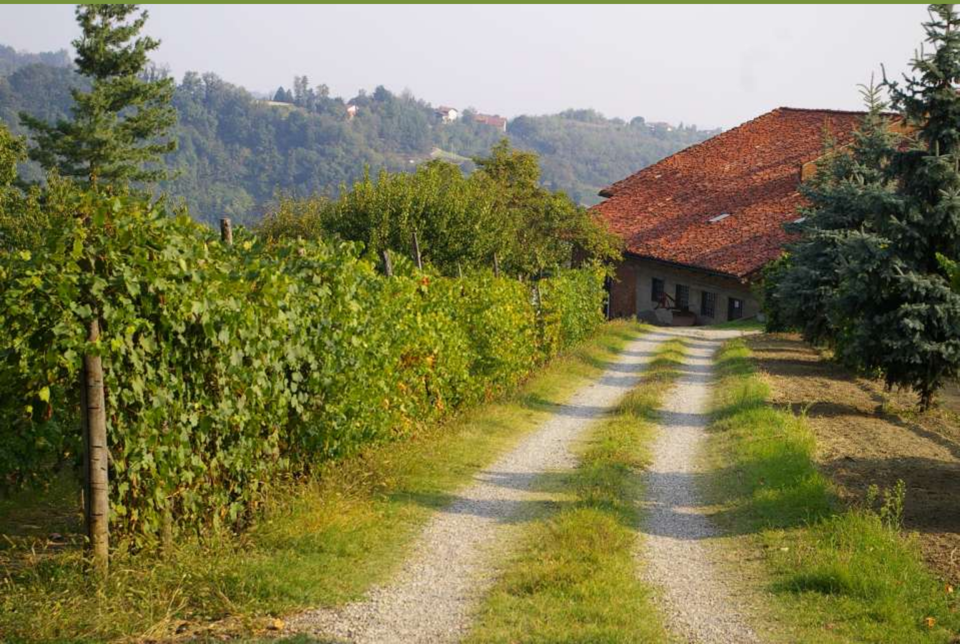
Moncuco Torinese (TO)