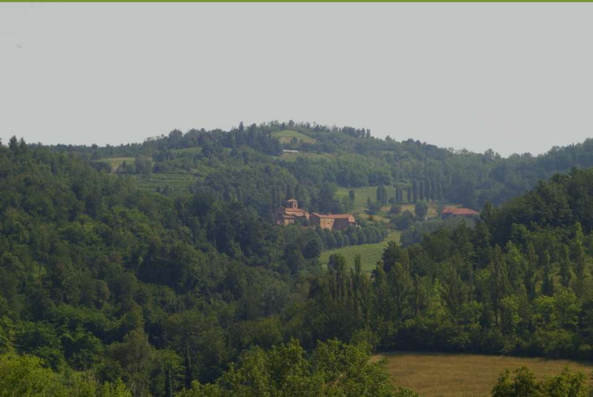
Canonica di Santa Maria di Vezzolano ad Albugnano (AT)