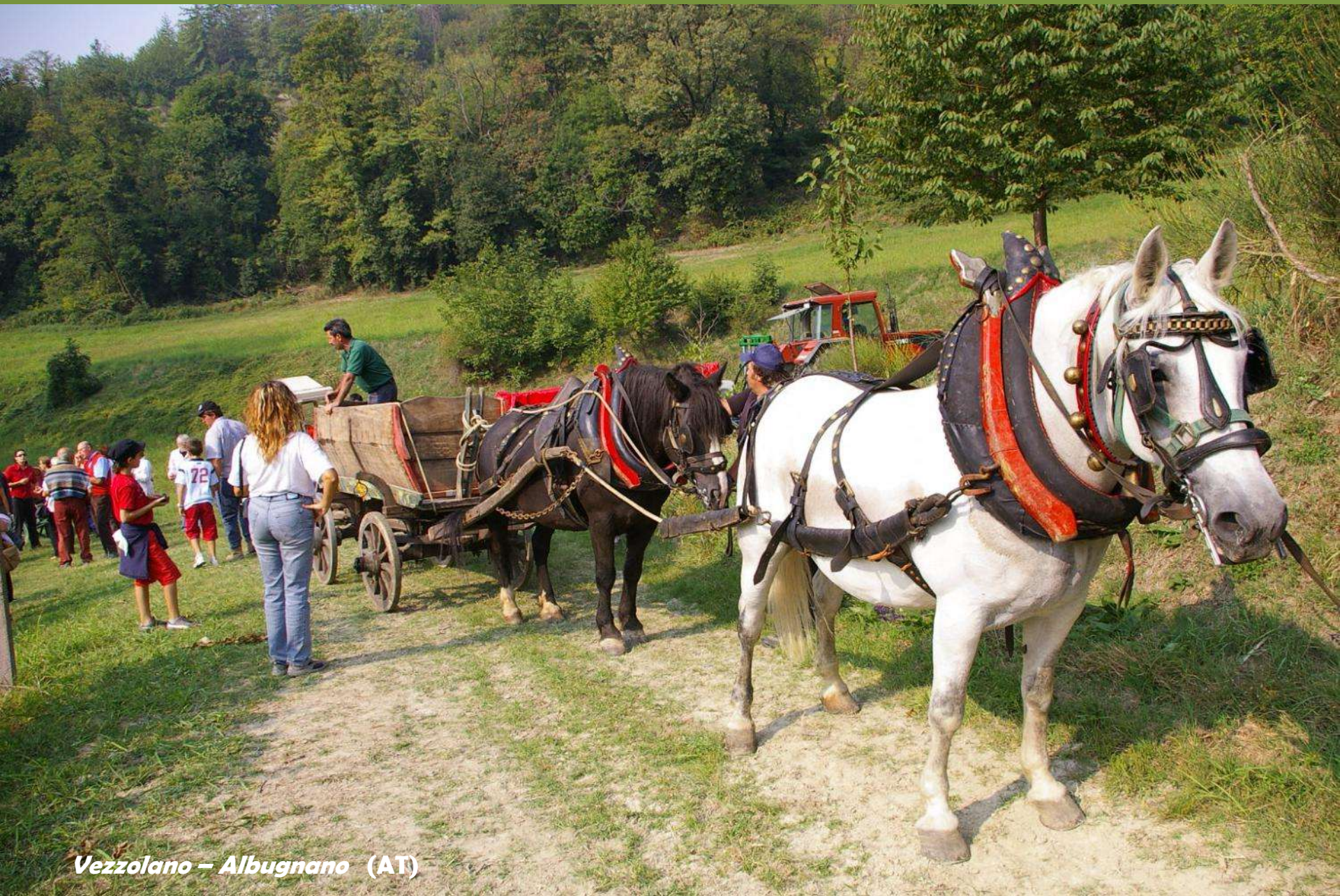
Vezzolano – Albugnano (AT)