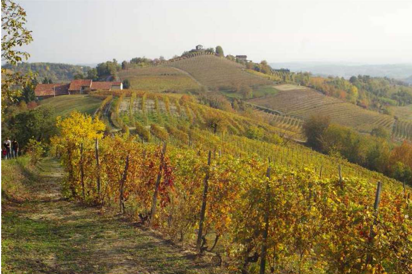
Veduta dello straordinario paesaggio viticolo dell'Alto Astigiano e sullo sfondo tra i vigneti la Chiesa romanica di Santa Maria di Cornareto.

Vezzolano - Azienda Sperimentale dell'Accademia dell'Agricoltura di Torino, sabato 22 dicembre 2012 alle ore 15.00