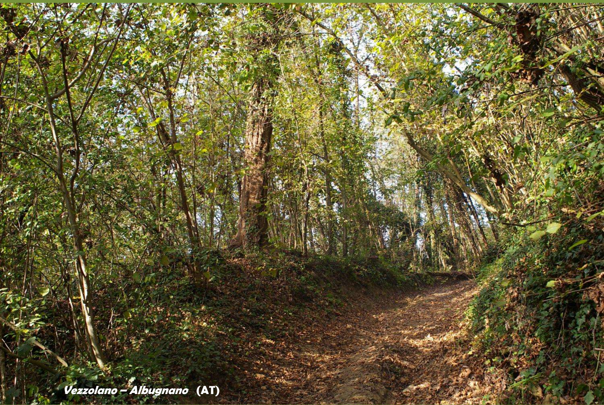
Vezzolano – Albugnano (AT)