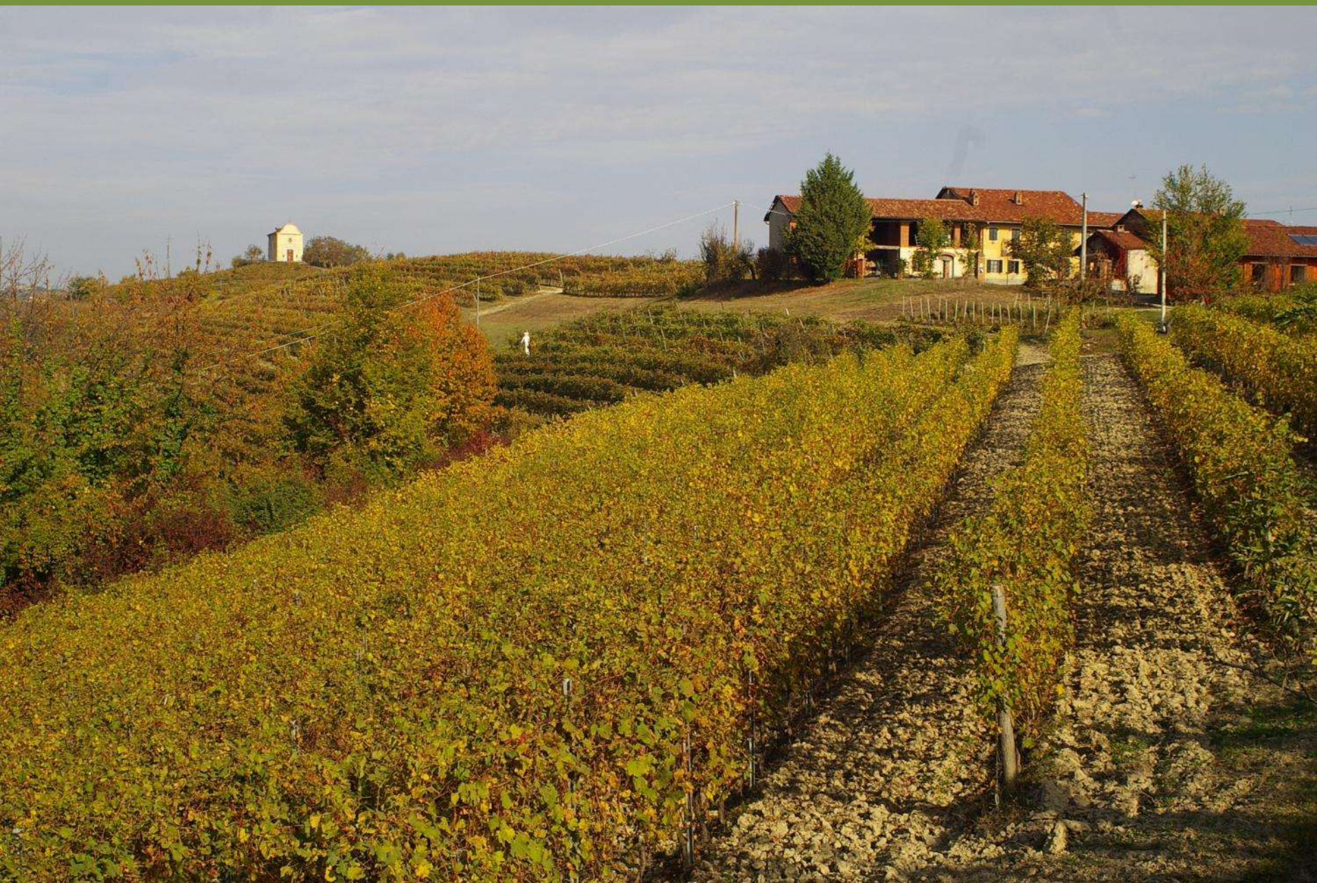
Chiesa di San Michele a Castelnuovo Don Bosco (AT)