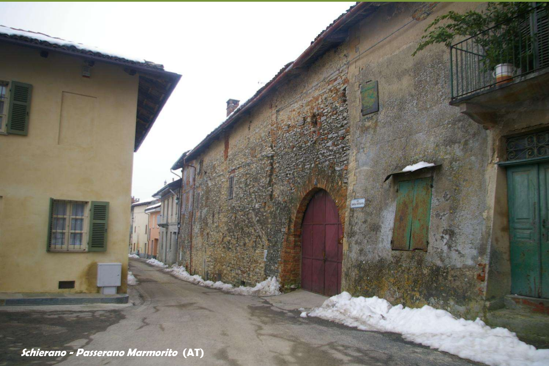
Schierano - Passerano Marmorito (AT)