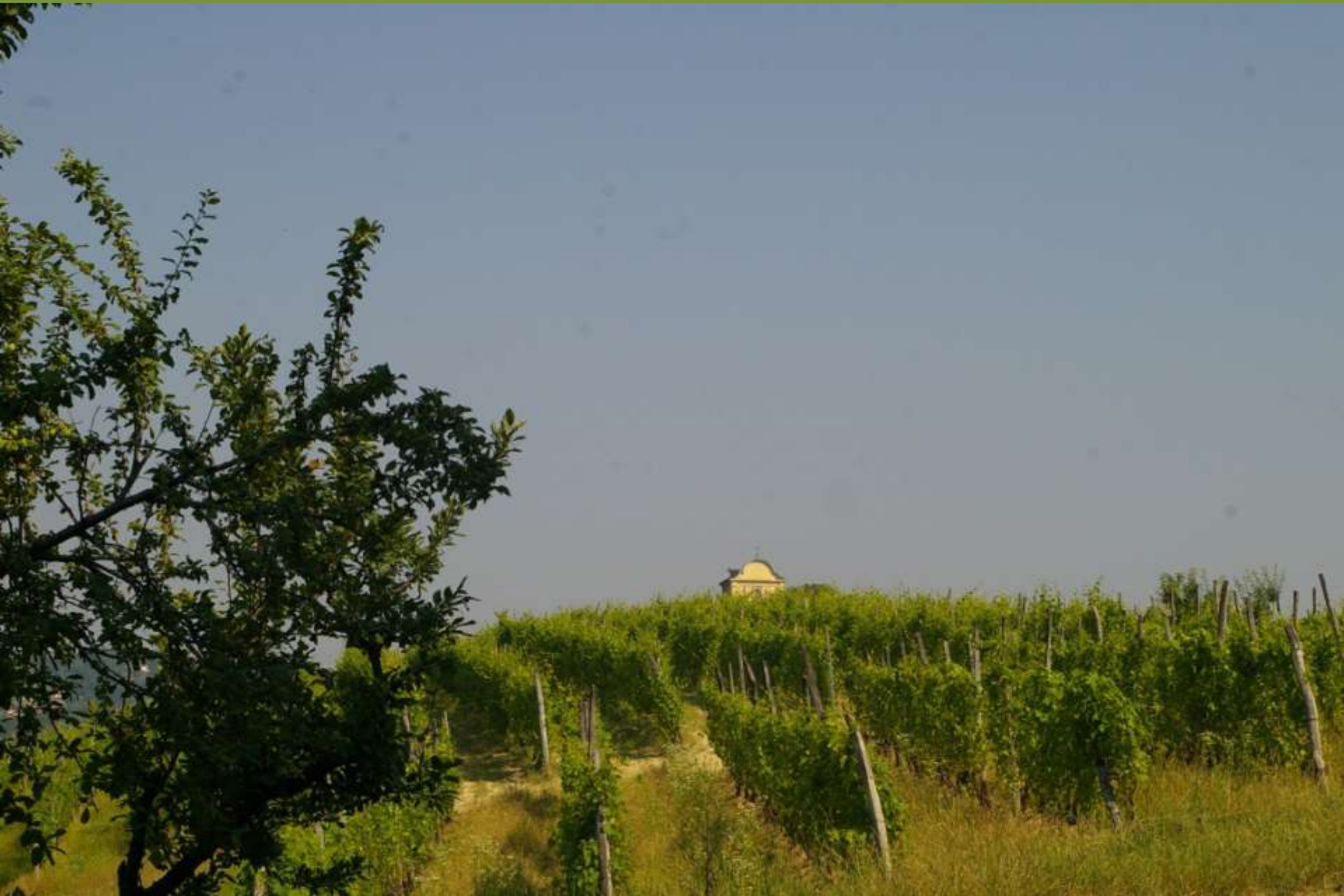
Chiesa di San Michele a Castelnuovo Don Bosco (AT)