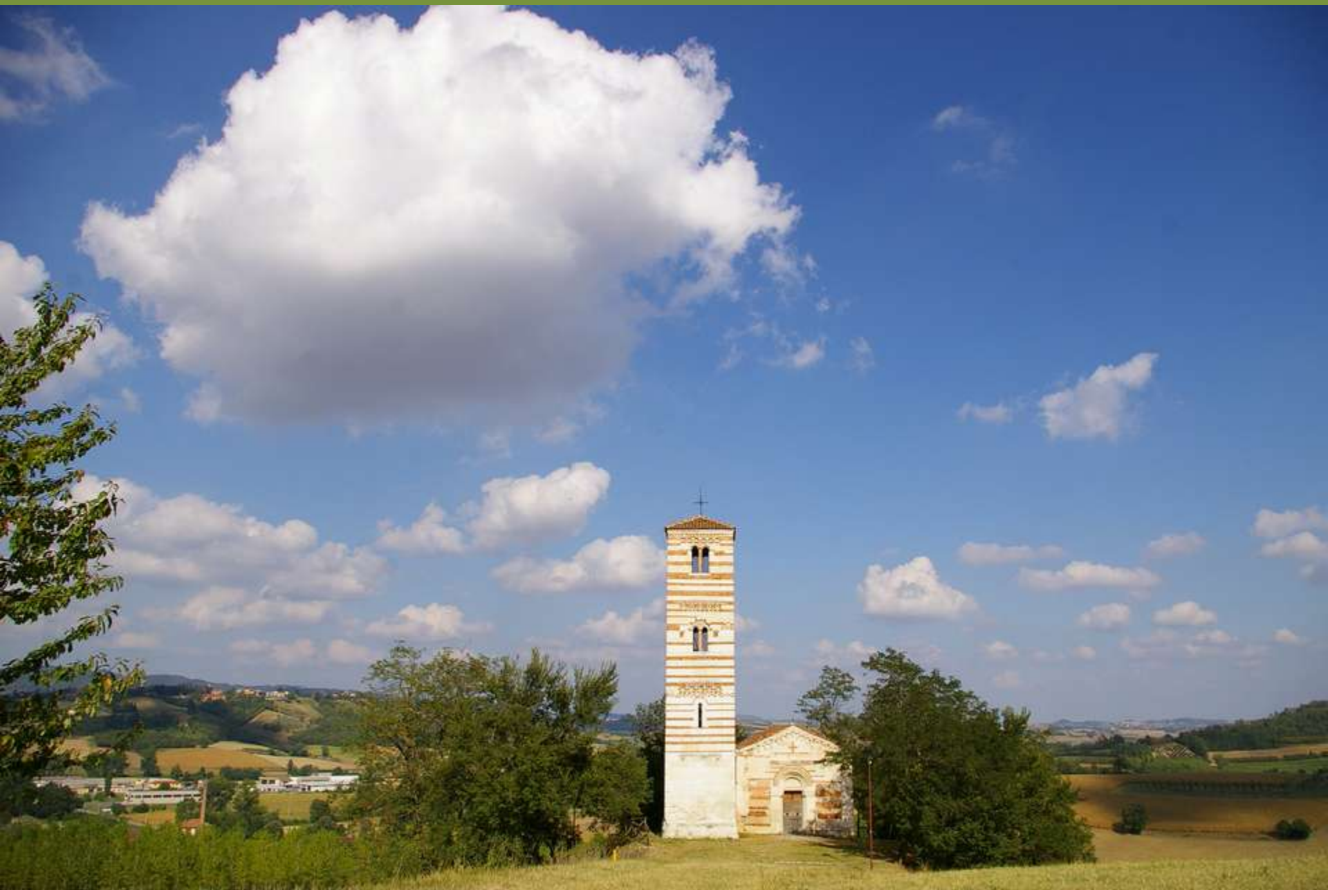
Chiesa romanica dei SS Nazario e Celso a Montechiaro d'Asti (AT)