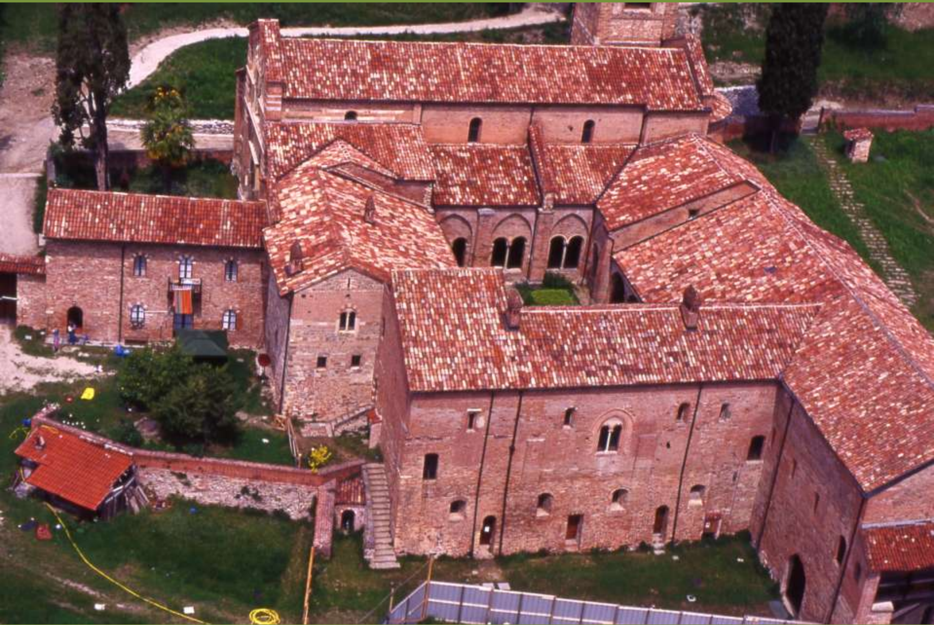
Foto aerea