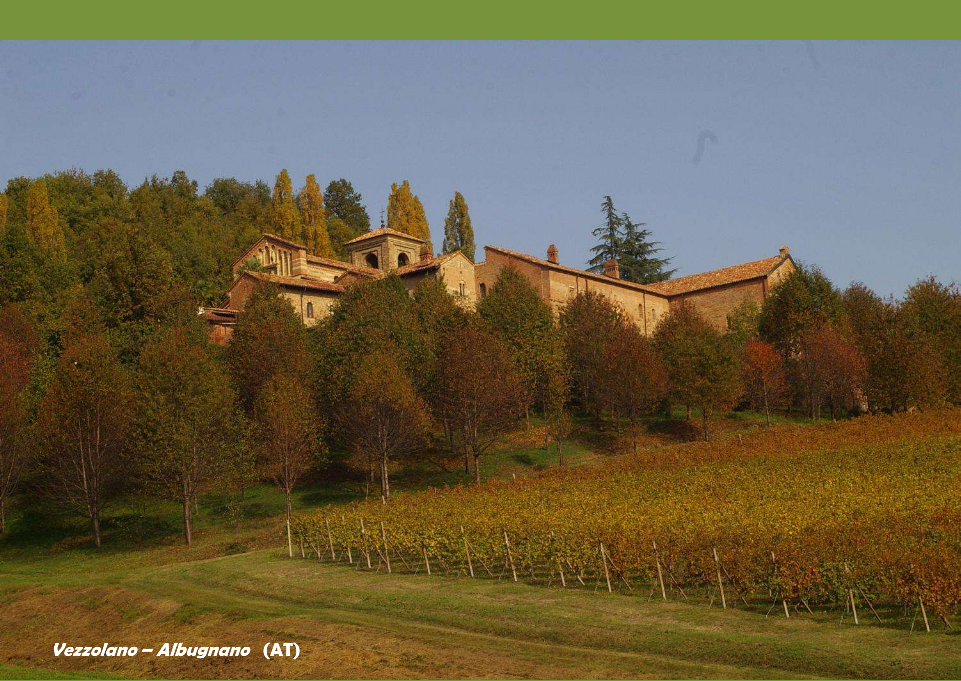
Vezzolano – Albugnano (AT)