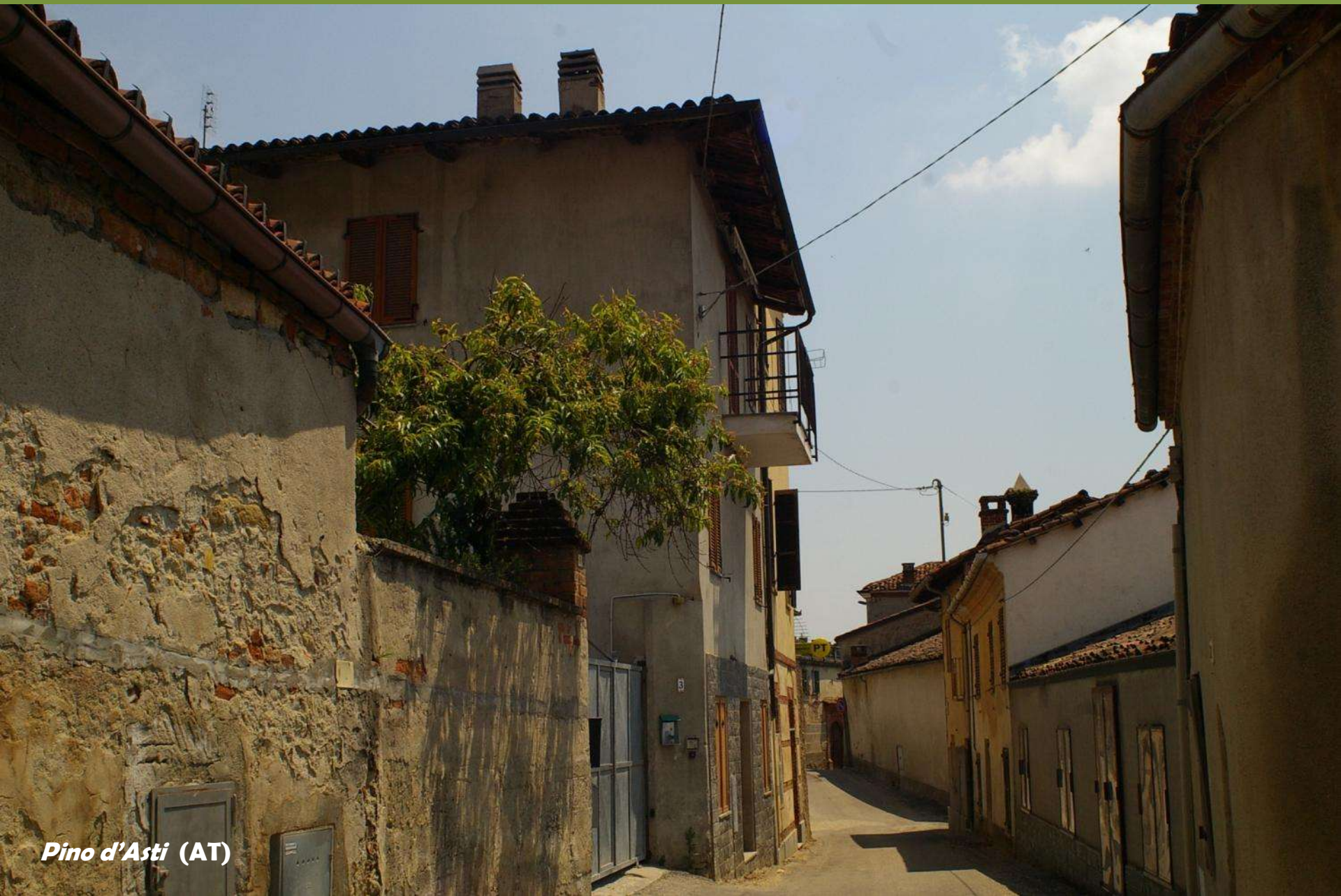
Pino d'Asti (AT)