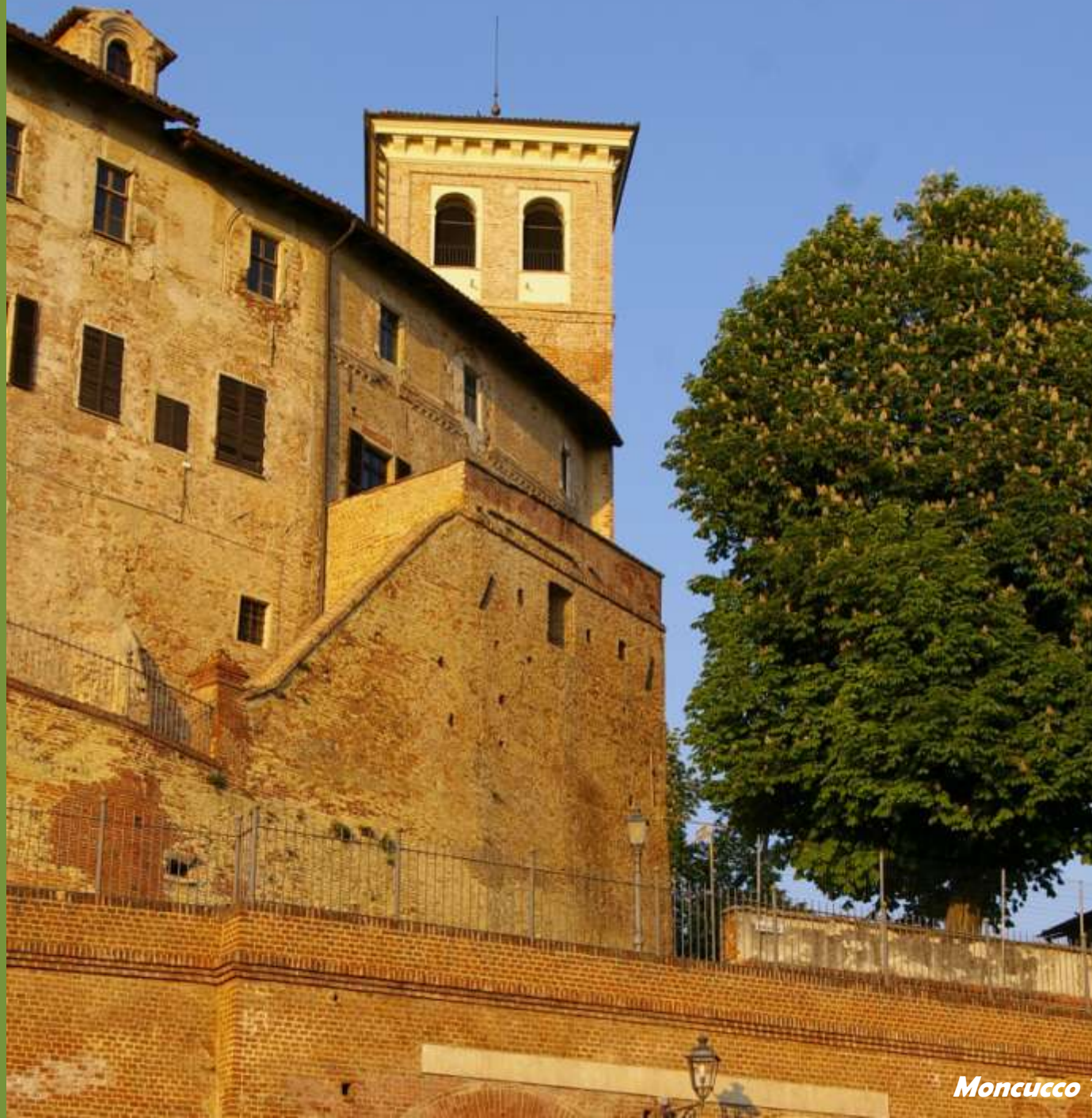
Moncuoco Torinese (TO)