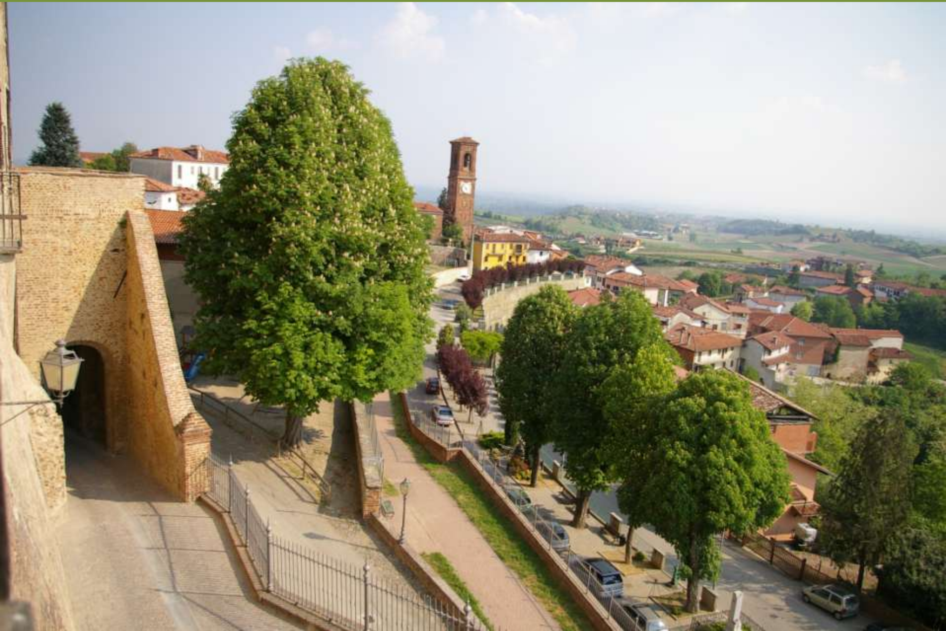
Moncuco Torinese (TO)