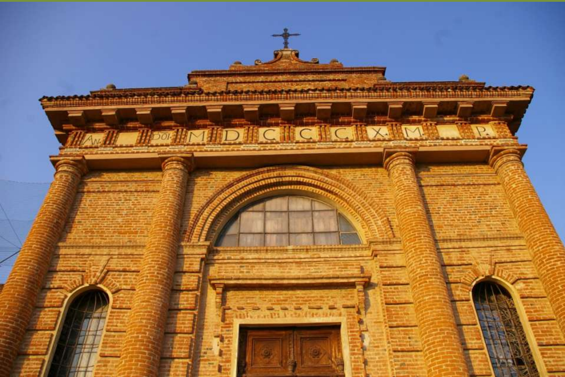
Moncuoco Torinese (TO)