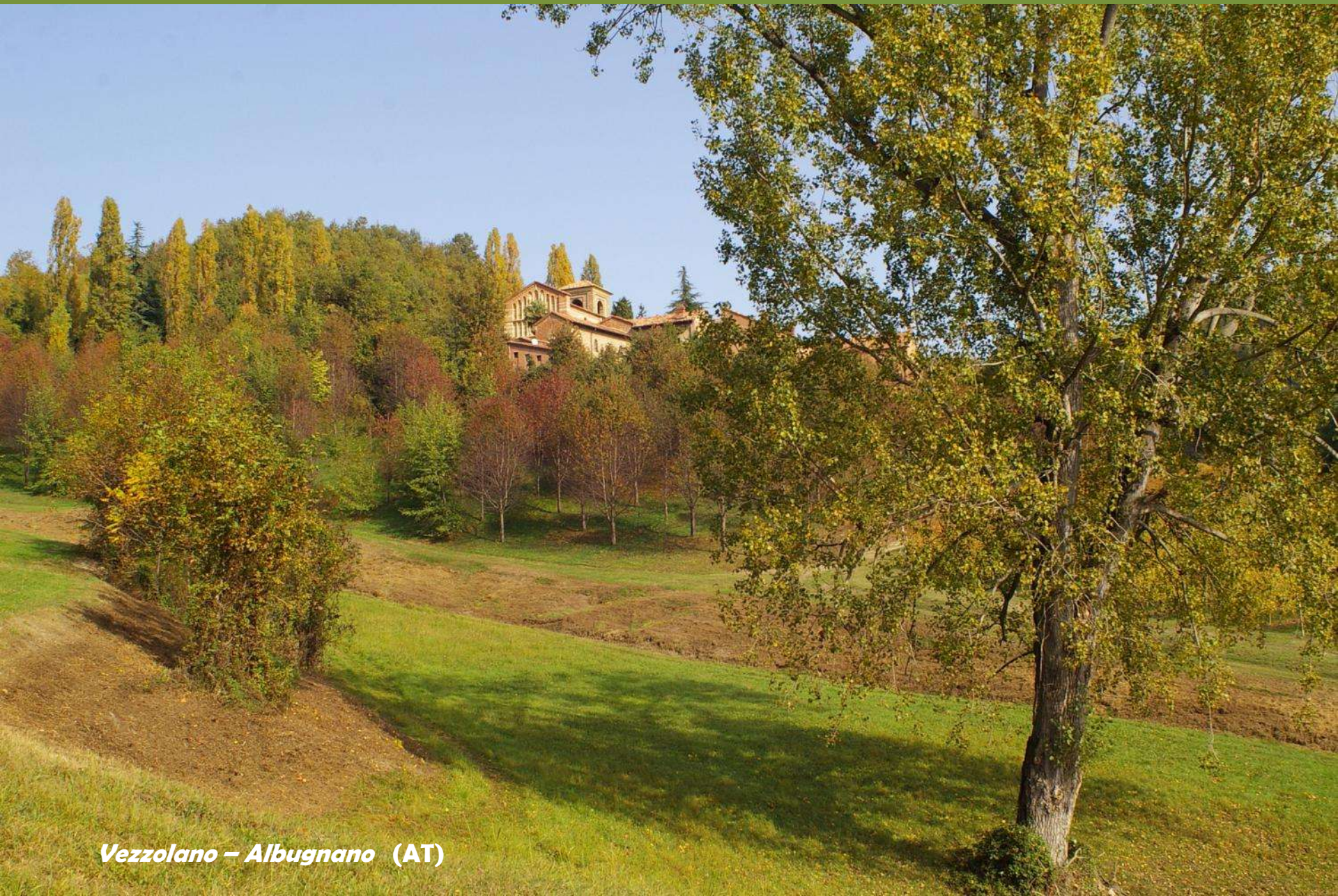
Vezzolano – Albugnano (AT)