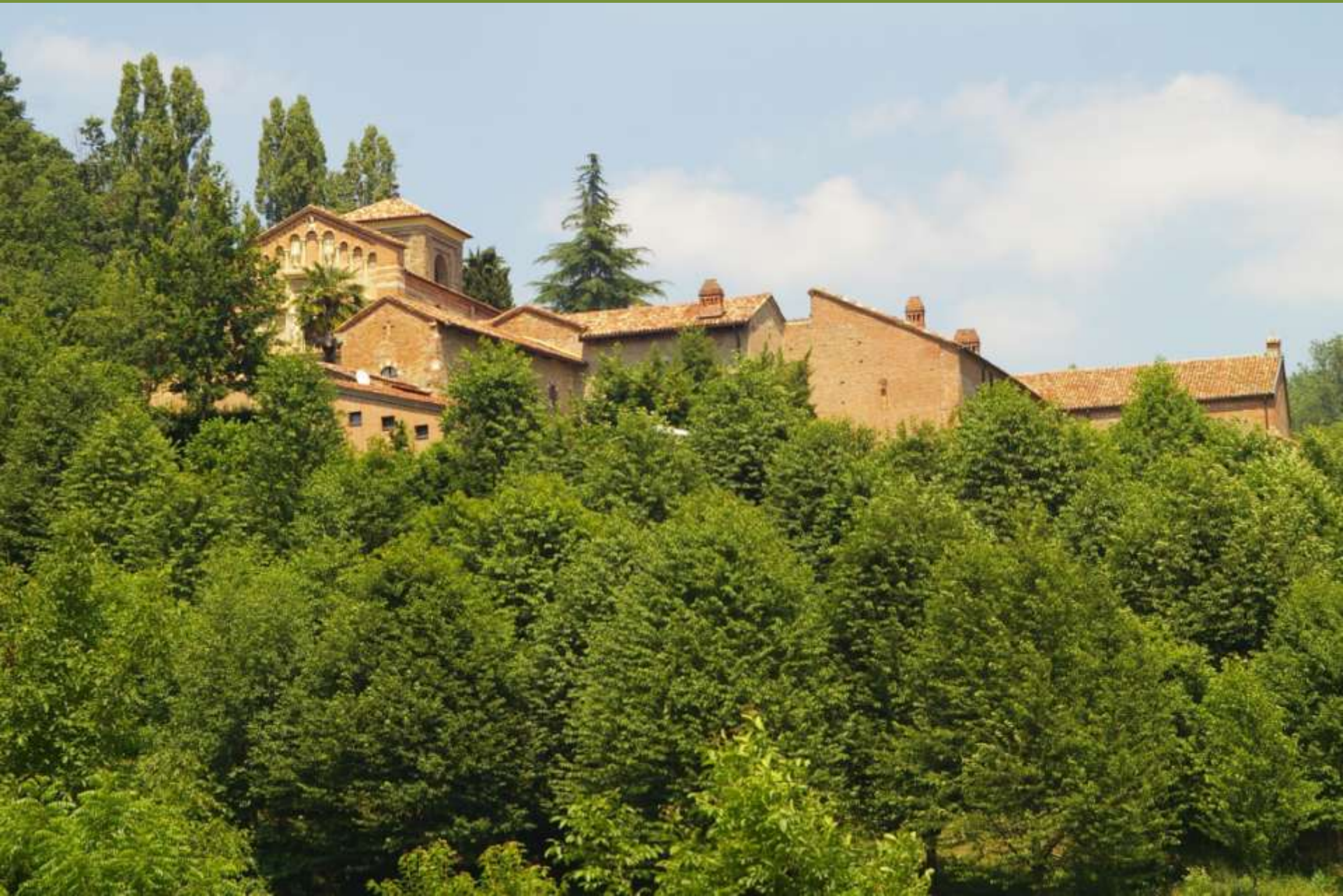
Canonica di Santa Maria di Vezzolano ad Albugnano (AT)