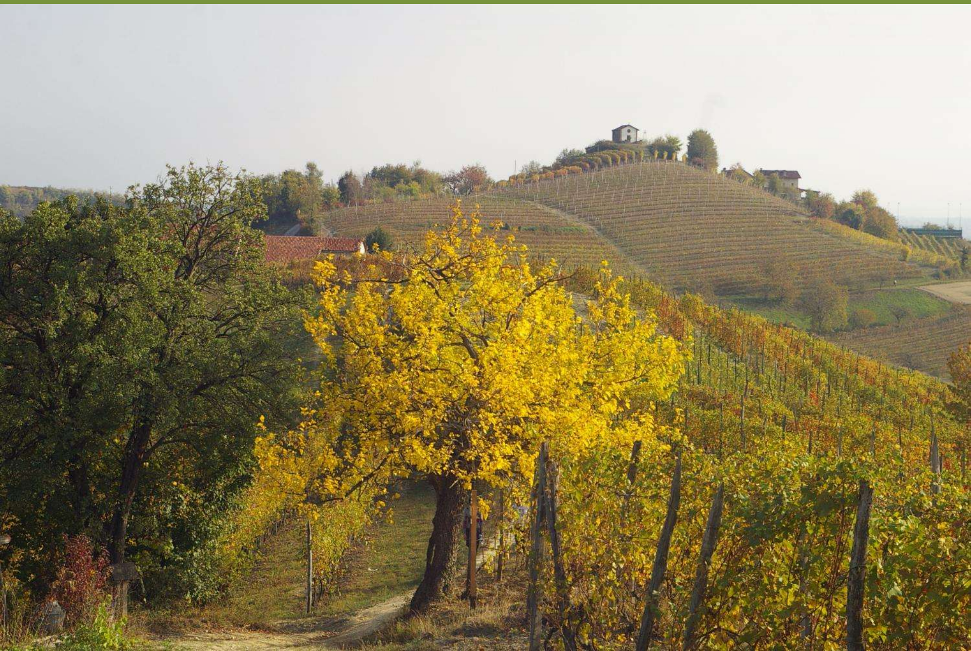
Chiesa romanica di Santa Maria di Cornareto a Castelnuovo Don Bosco (AT)