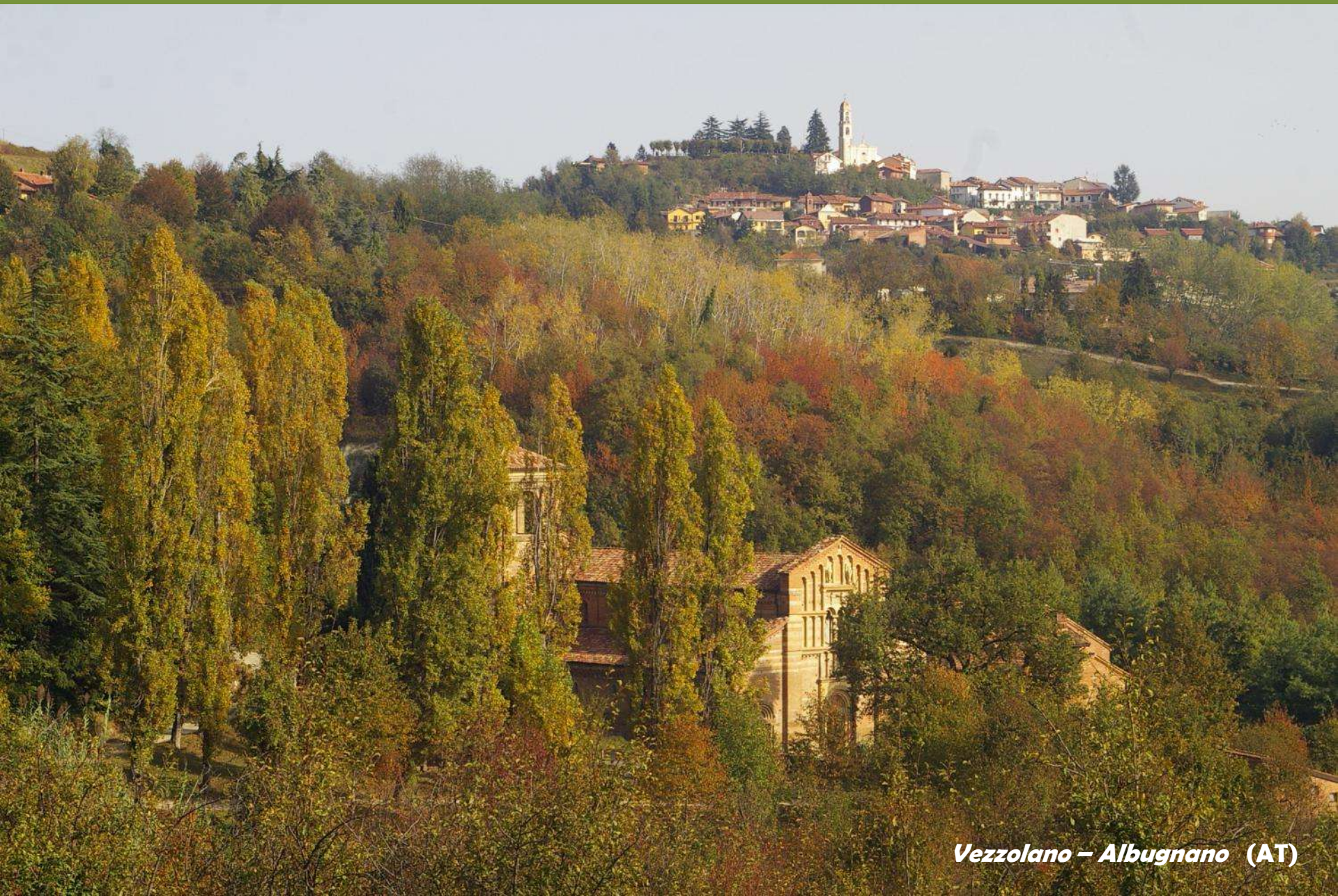
Vezzolano – Albugnano (AT)