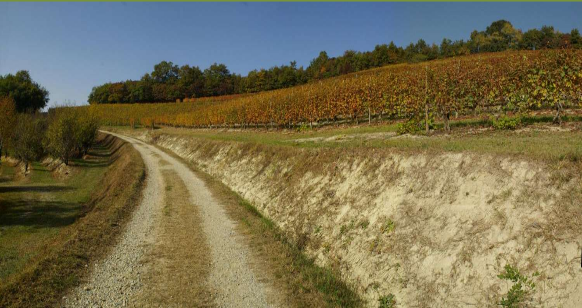
Vezzolano – Albugnano (AT)