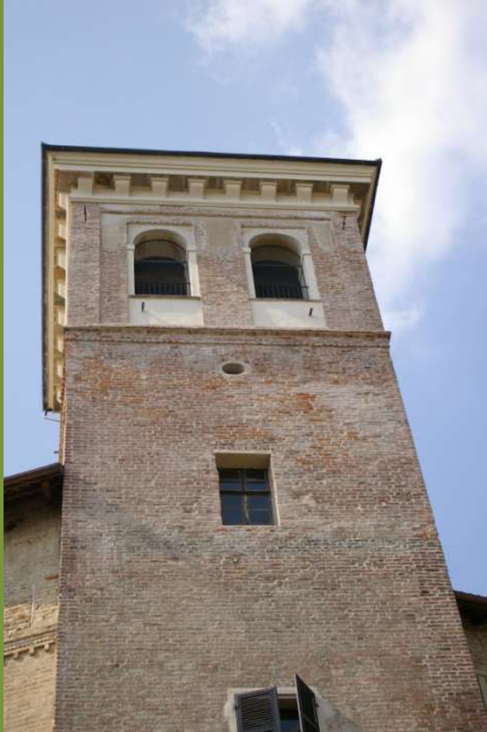
Moncuco Torinese (TO)