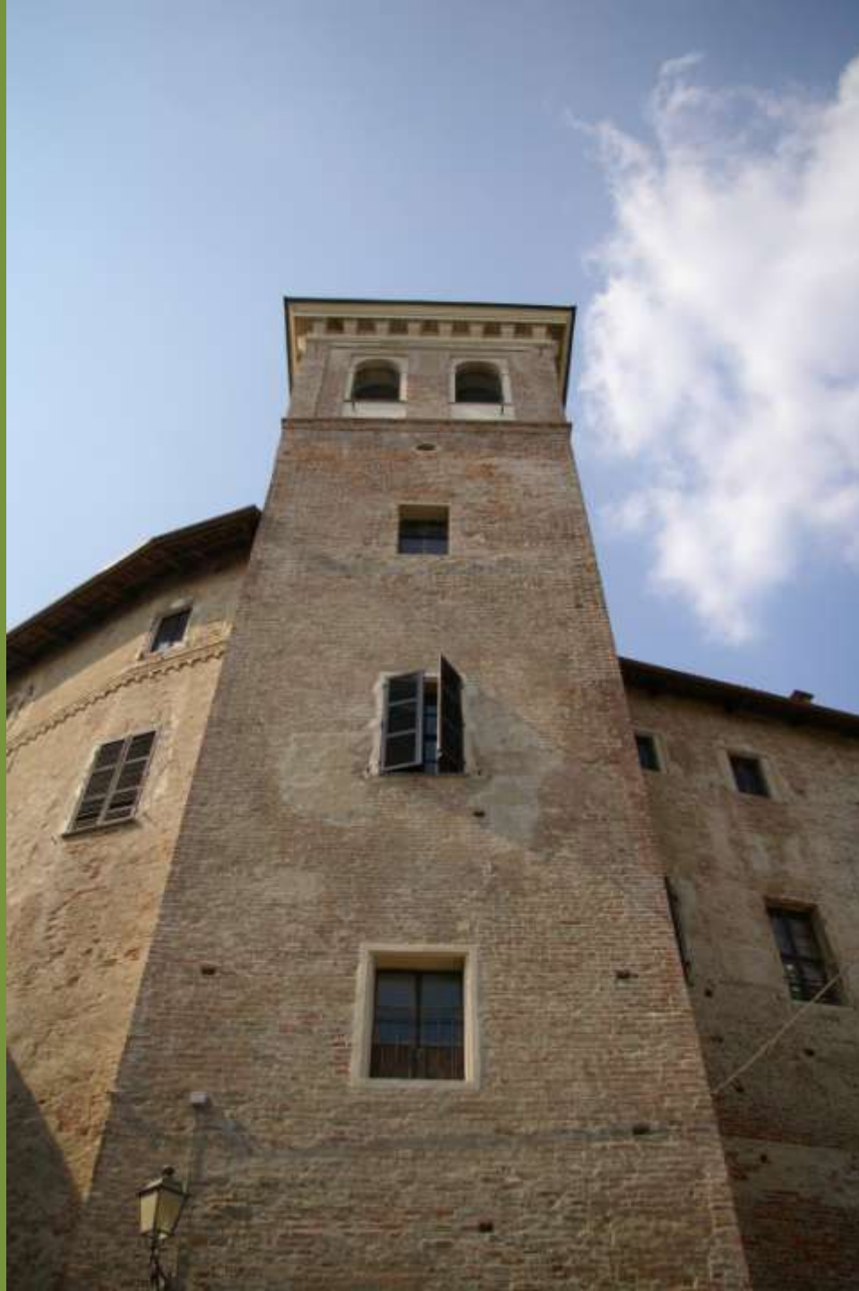
Moncuoco Torinese (TO)