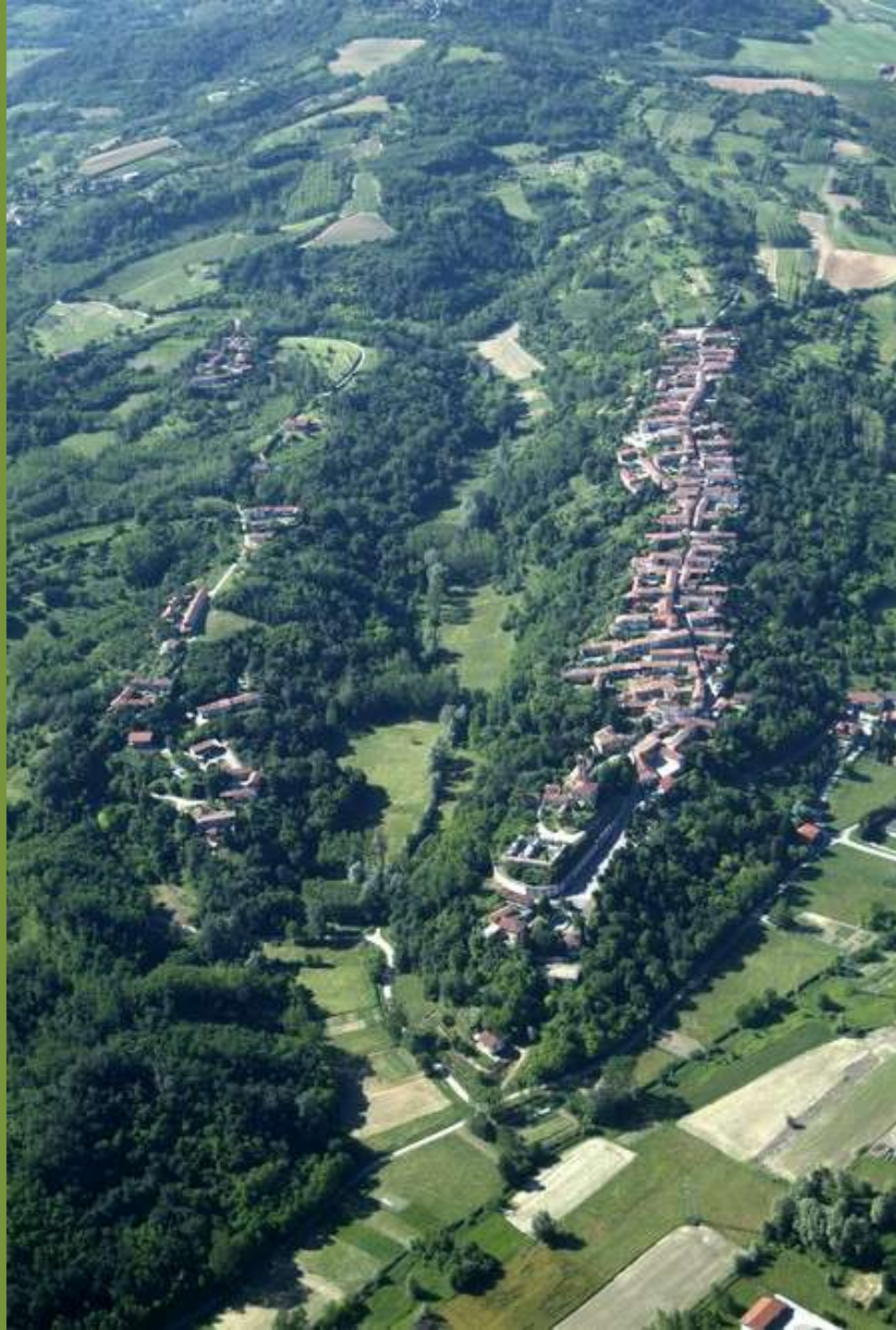
Cerreto d'Asti (AT)