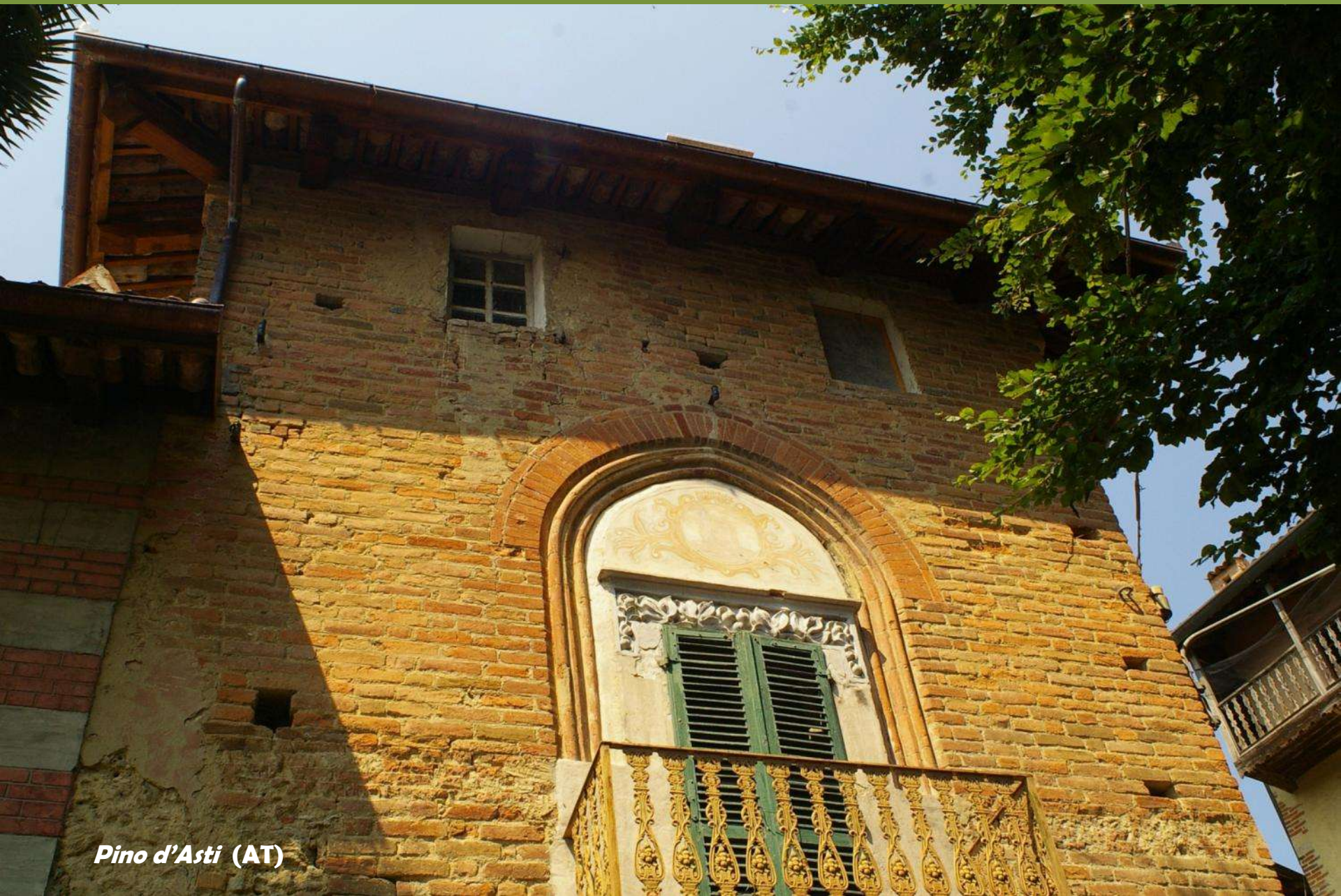
Pino d'Asti (AT)