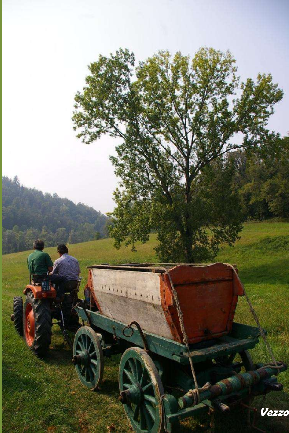
Vezzolano – Albugnano (AT)