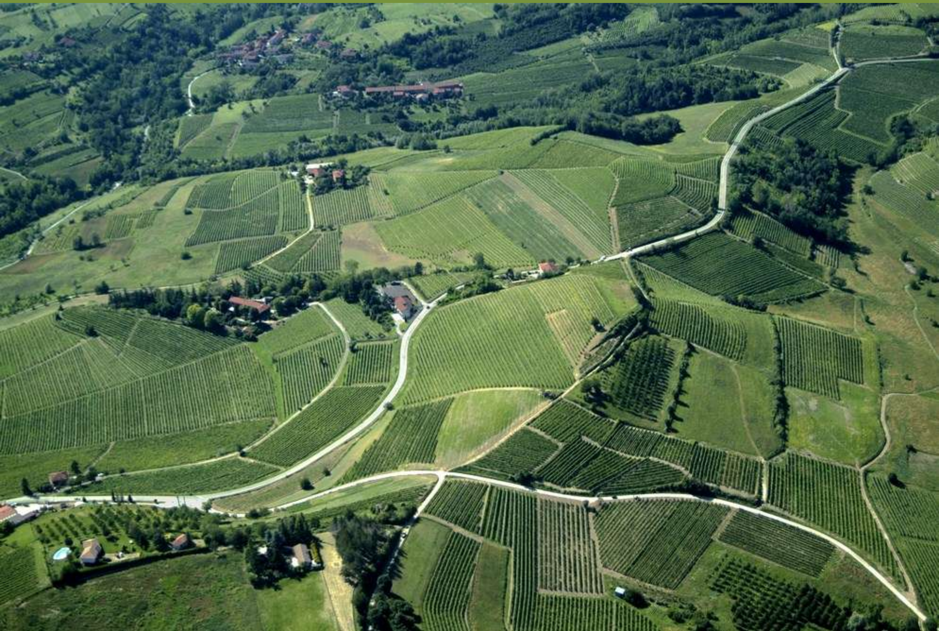
Foto aerea