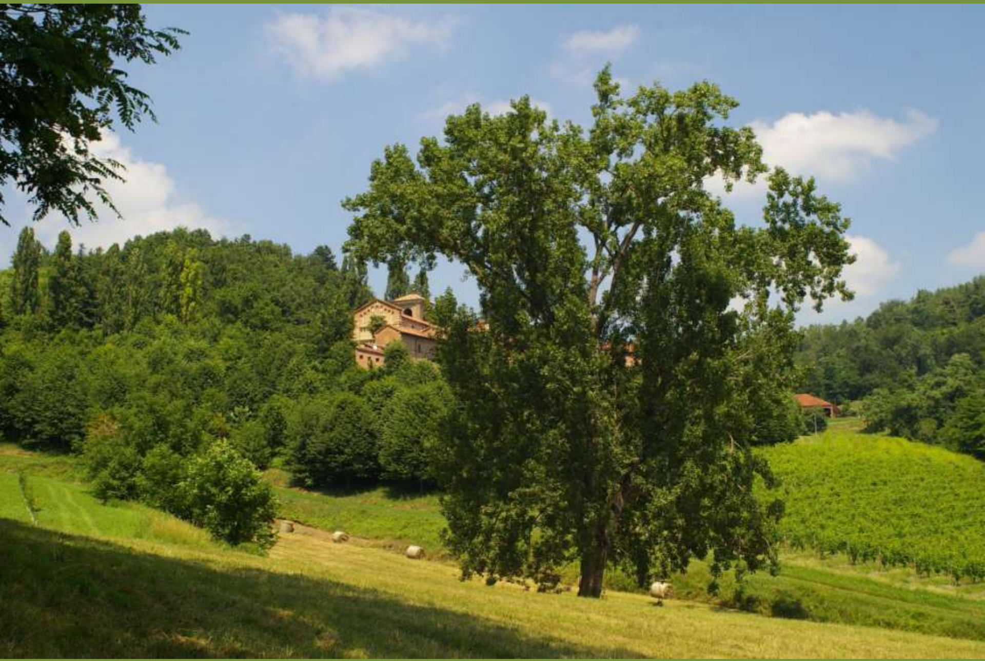
Canonica di Santa Maria di Vezzolano ad Albugnano (AT)