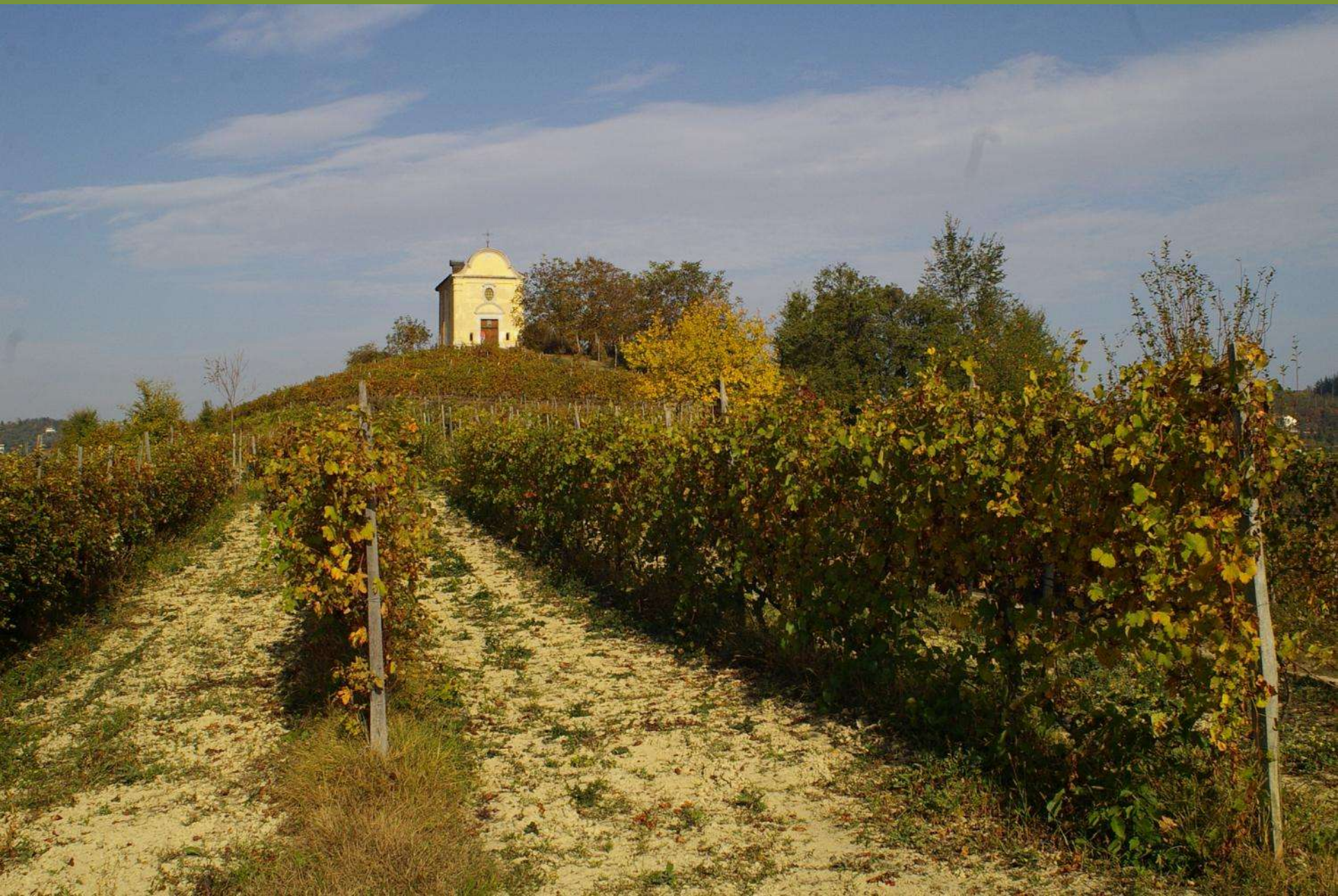
Chiesa di San Michele a Castelnuovo Don Bosco (AT)