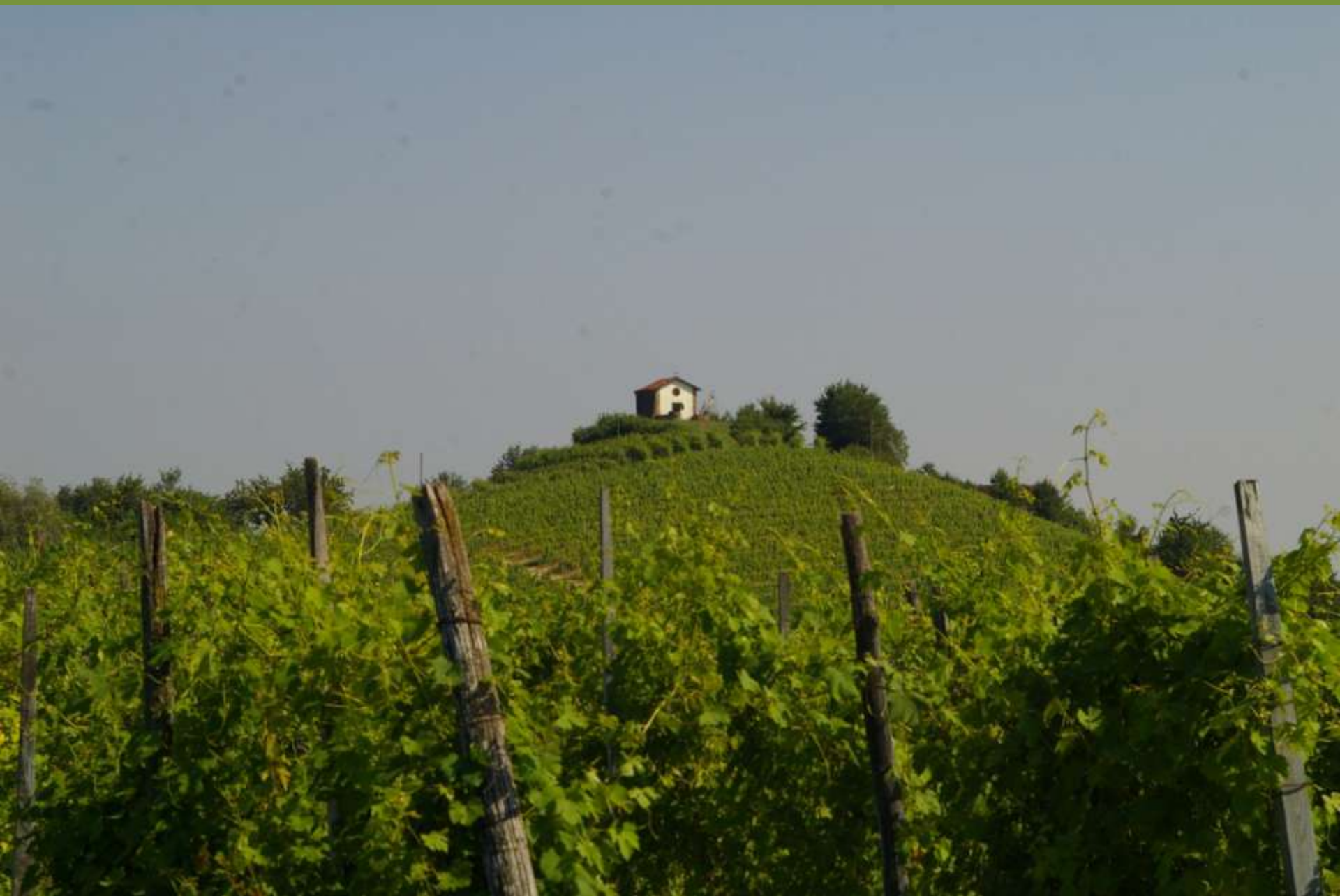
Chiesa romanica di Santa Maria di Cornareto a Castelnuovo Don Bosco (AT)