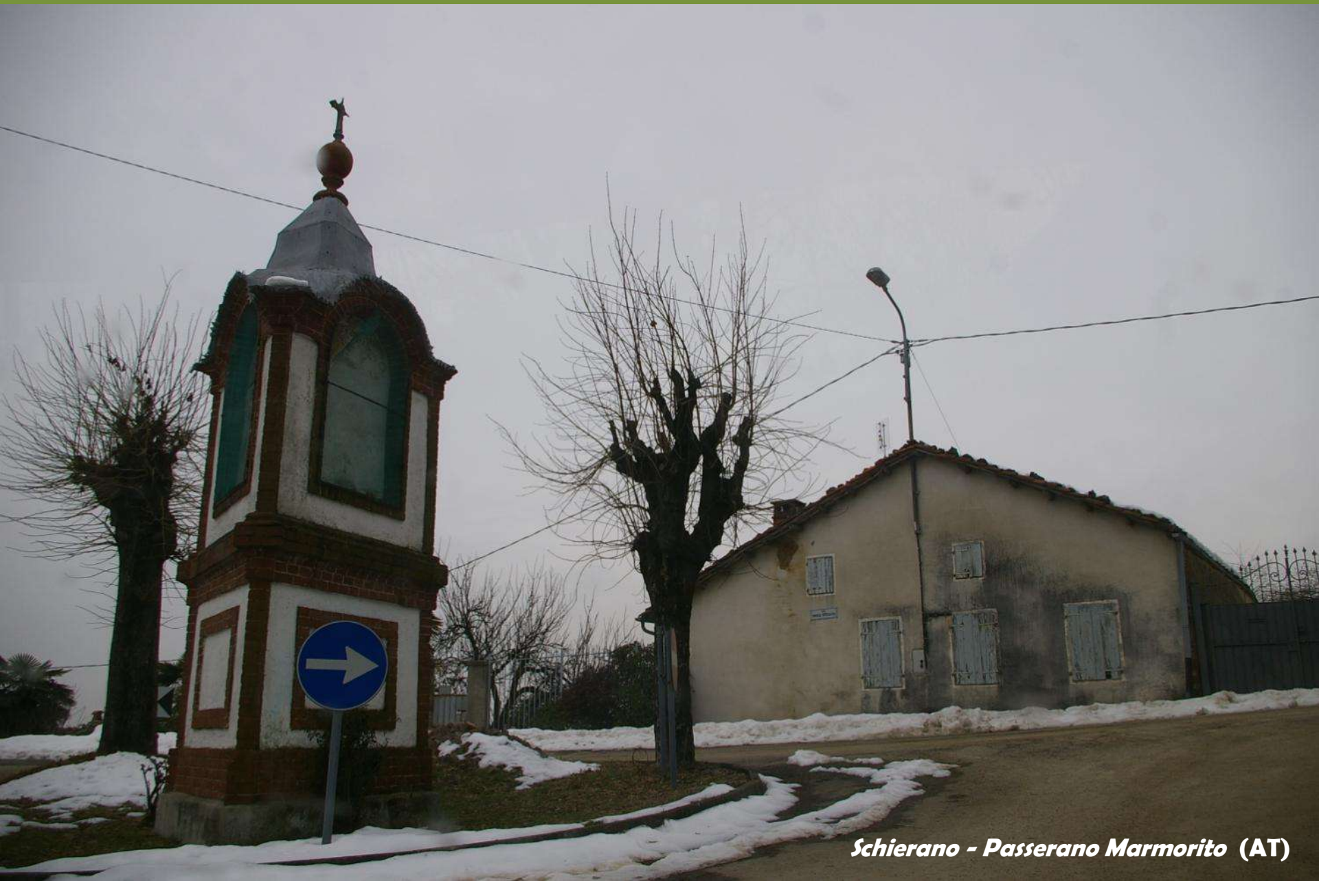
Schierano - Passerano Marmorito (AT)