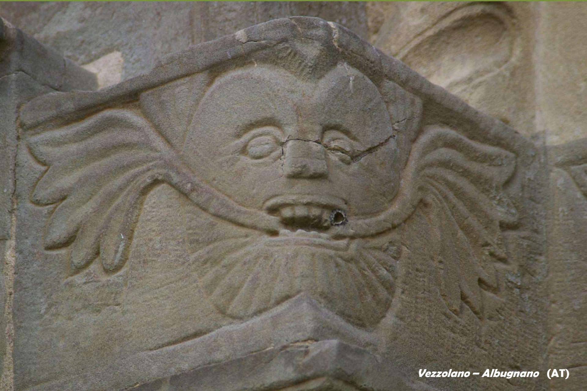
Vezzolano – Albugnano (AT)