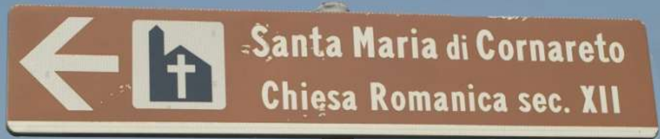
Chiesa romanica di Santa Maria di Cornareto a Castelnuovo Don Bosco (AT)