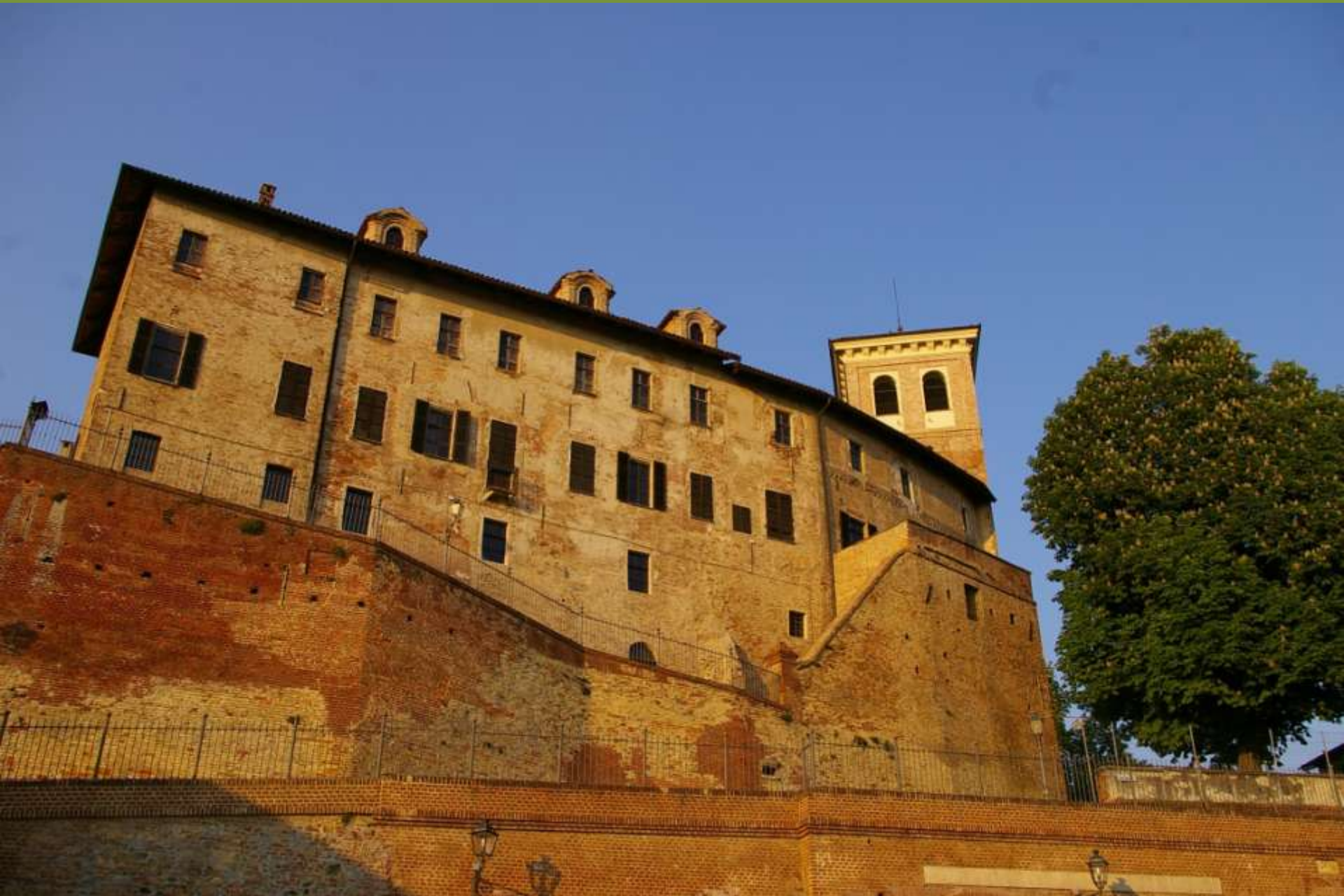
Moncuco Torinese (TO)