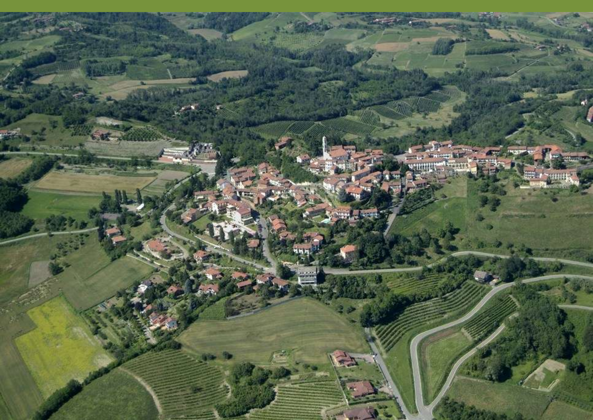
Foto aerea