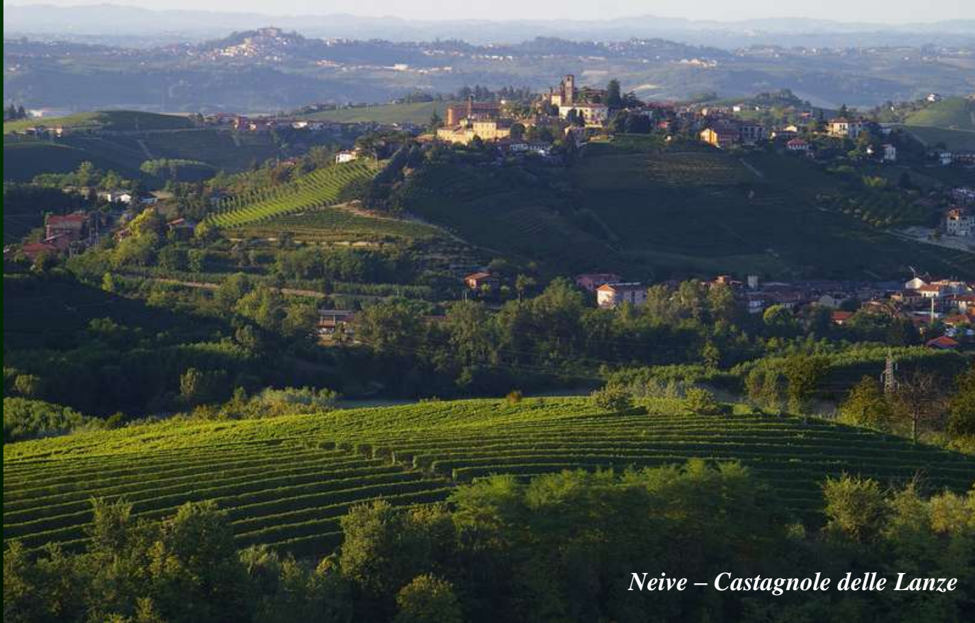
Neive – Castagnole delle Lanze