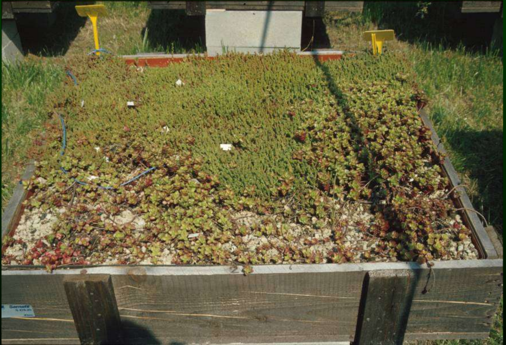
Coltivazione in cassoni di Crassulaceae