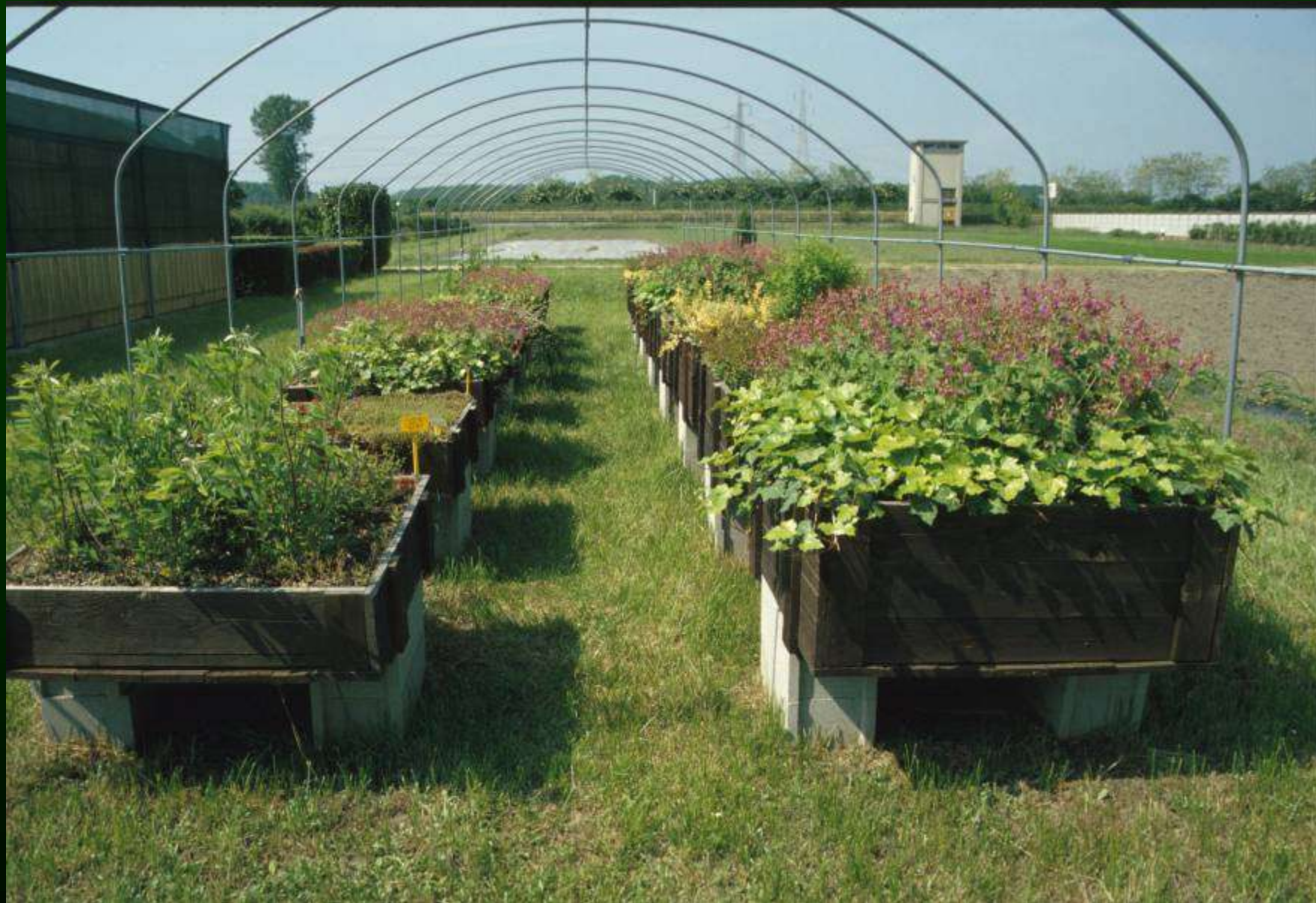
Prove sperimentali con coltivazione in cassoni