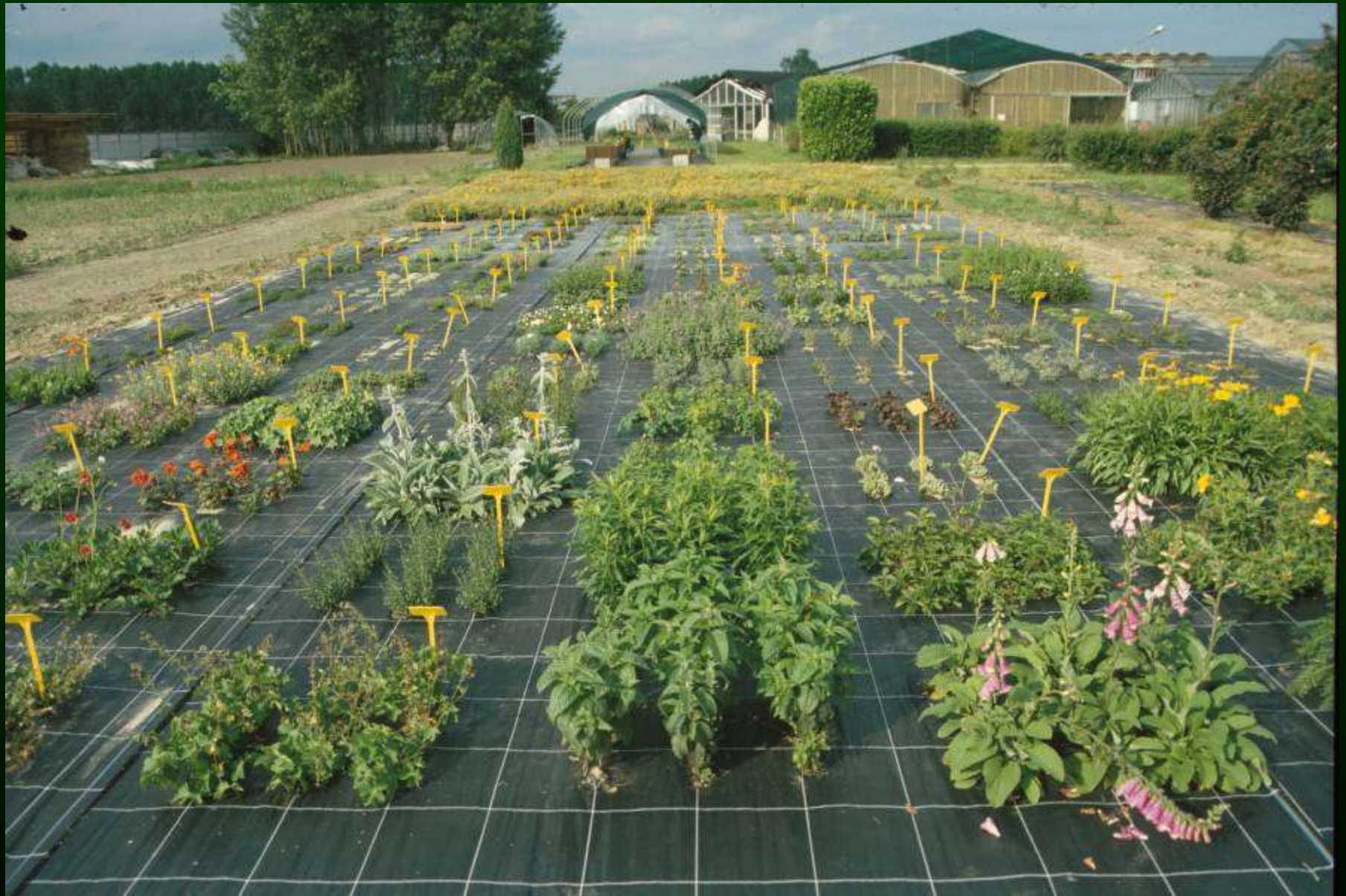
Campi catalogo – Centro sperimentale della Facoltà a Carmagnola (TO)