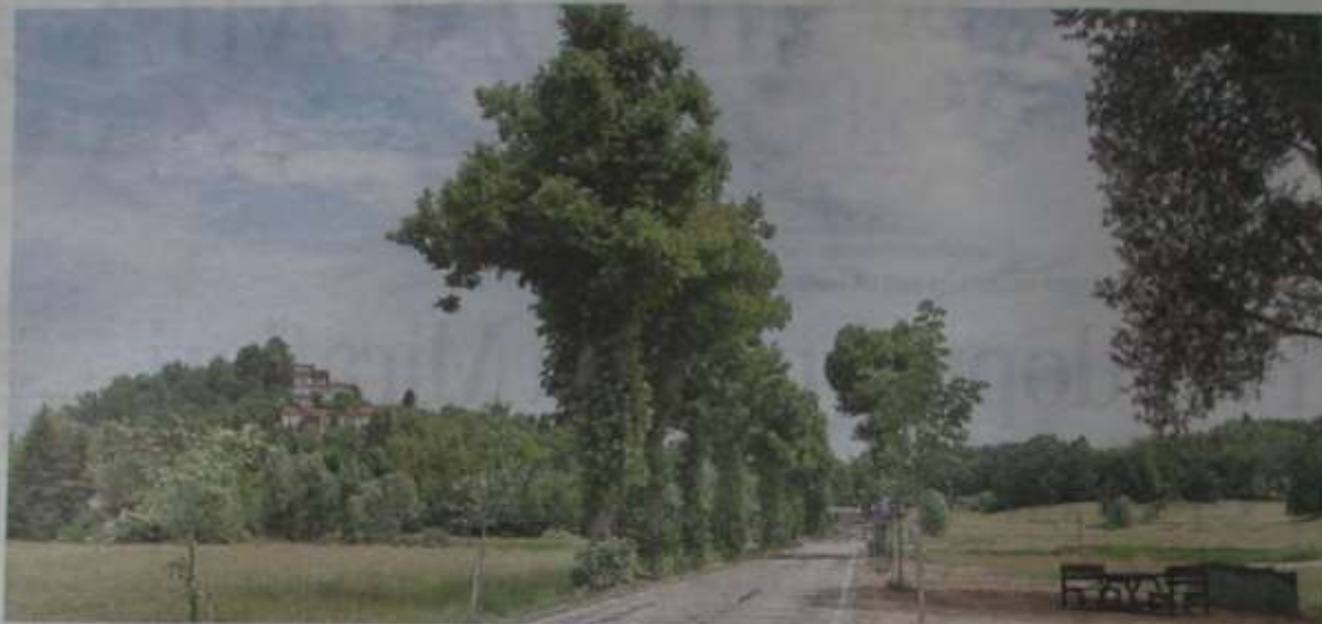
G. G. MONTAFIA

Salvi Grazie a tre anni di battaglie l'associazione per la difesa dei tigli di Montafia è vissuta a salvare gli alberi dall'abbatti- mento deciso dalla Provincia