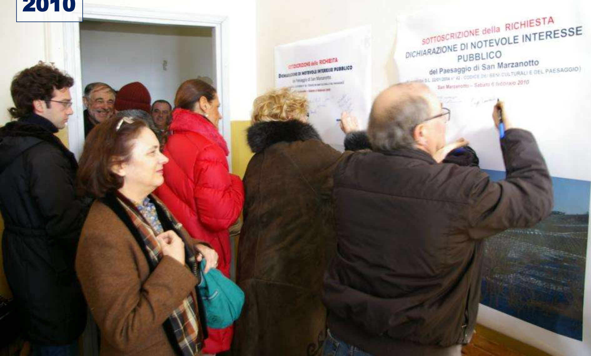
SOTTOSCRIZIONE della Dichiarazione di notevole Interesse pubblico del paesaggio di San Marzanotto (6 febbraio 2010)