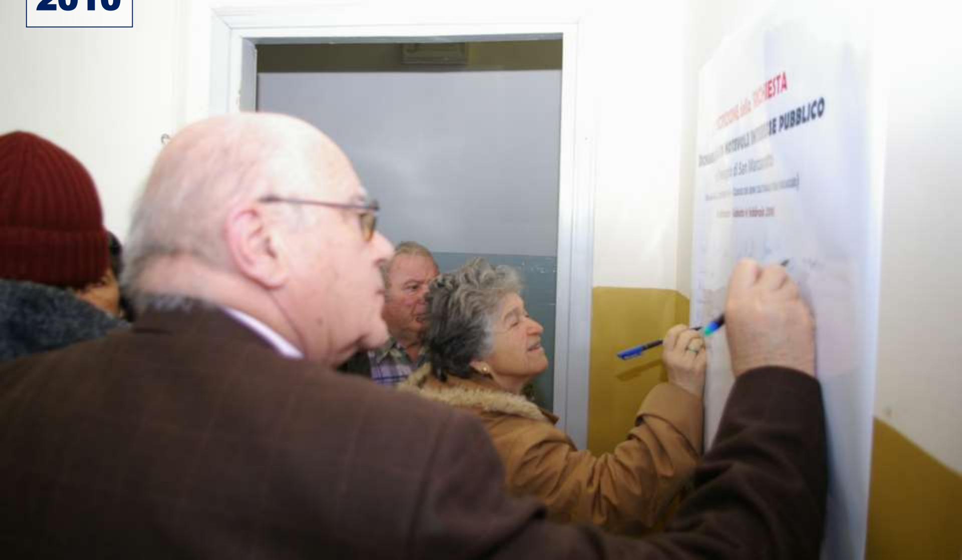
SOTTOSCRIZIONE della Dichiarazione di notevole Interesse pubblico del paesaggio di San Marzanotto (6 febbraio 2010)