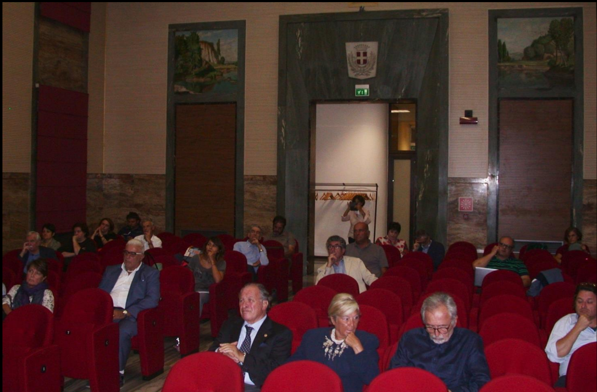
Veduta del pubblico presente in sala