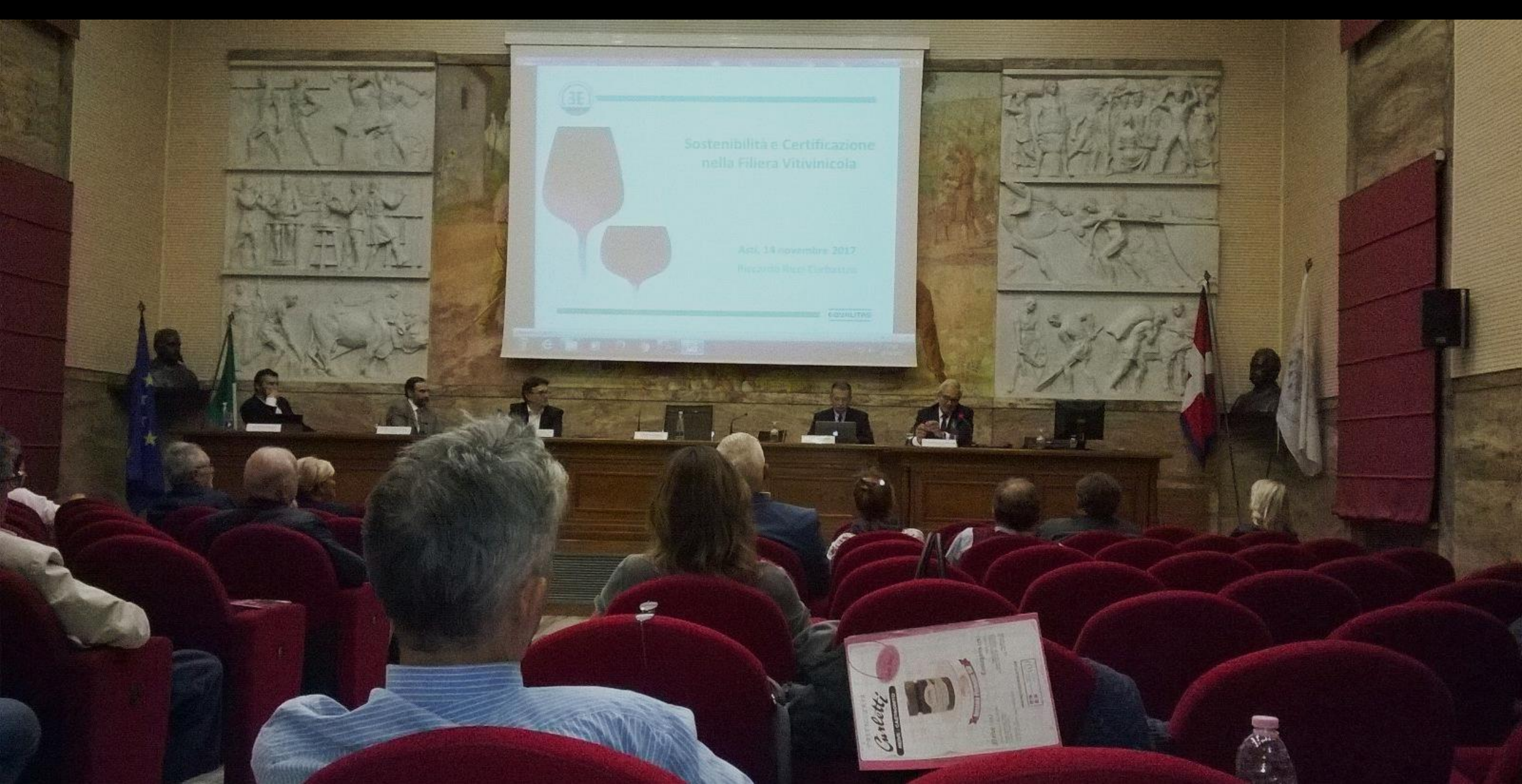
Veduta del pubblico presente in sala