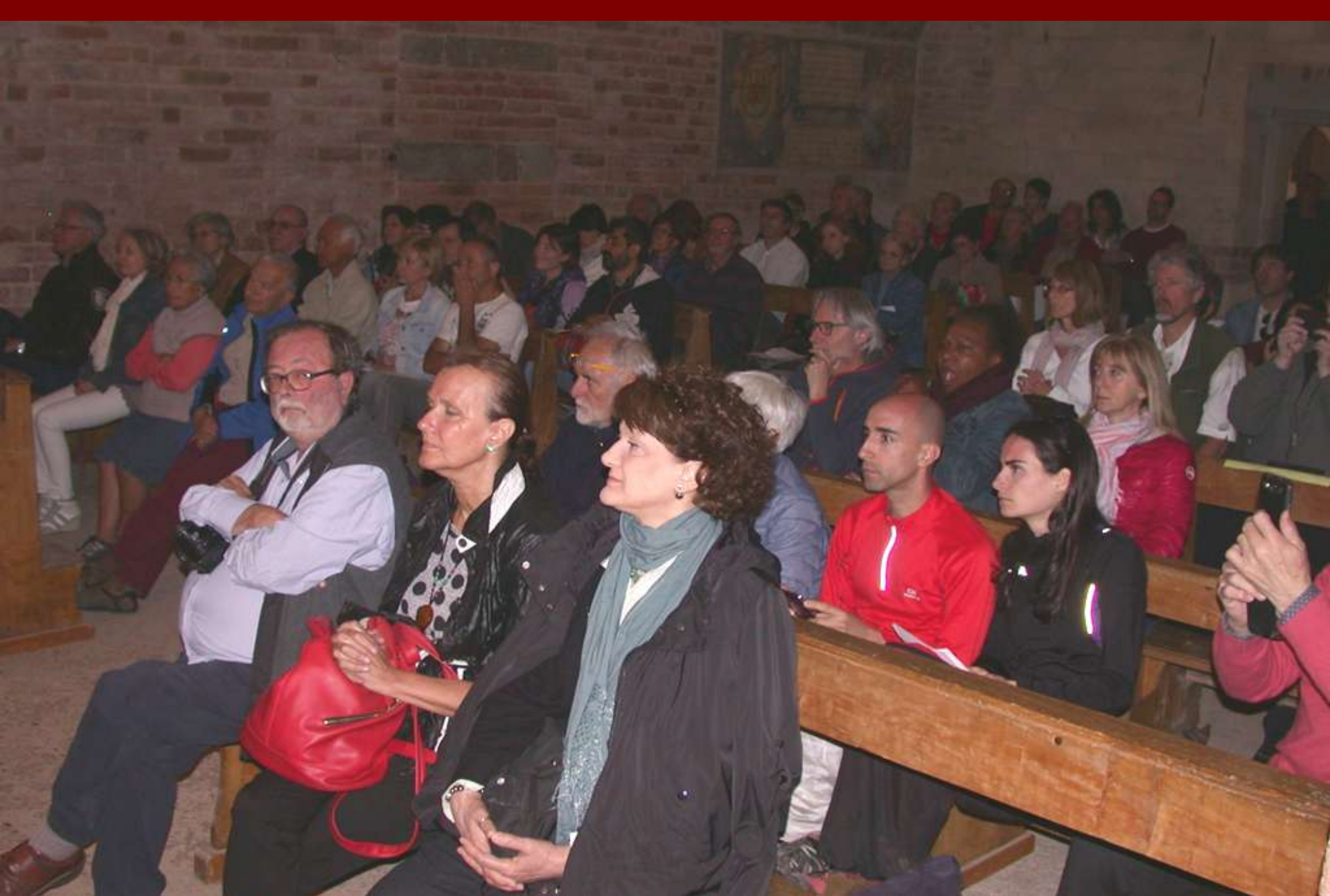
Folto pubblico presente al Concerto del Gruppo di Musica antica La Ghironda dal titolo "Echo la primavera" presso la Canonica di Santa Maria di Vezzolano