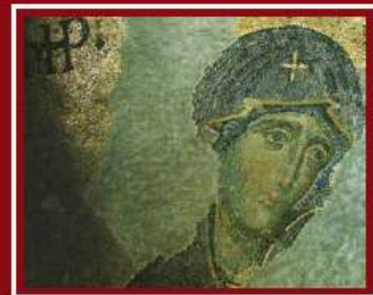
La Vergine Maria (mosaico di Istanbul)