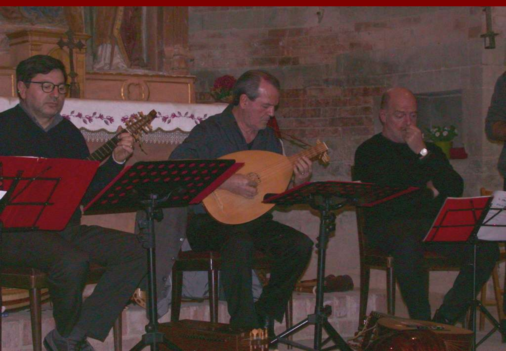
Esecuzione di Brani di musiche medioevali dei secoli XIII e XIV