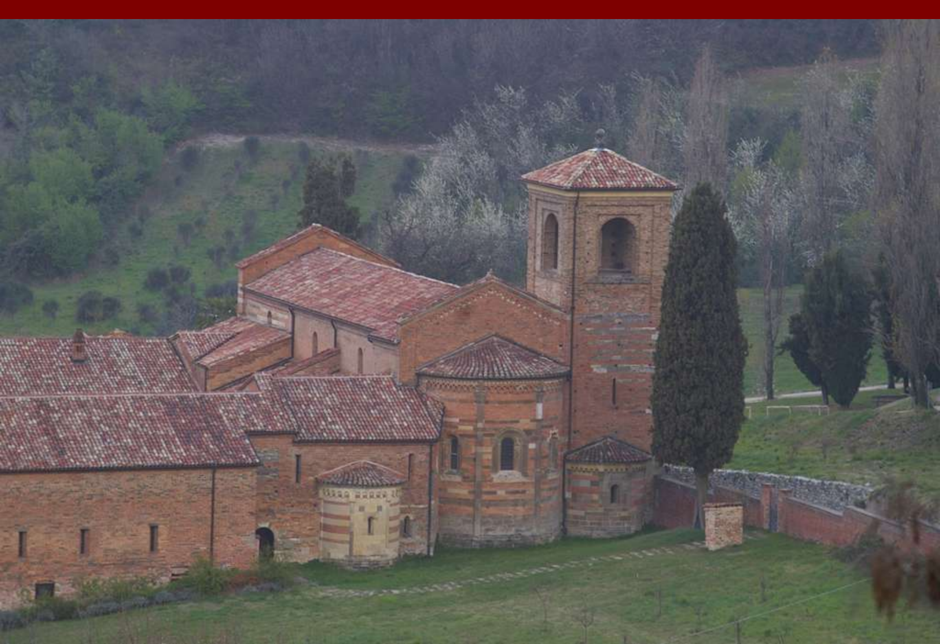
Veduta della Canonica di Santa Maria di Vezzolano, inserita in un paesaggio agrario di straordinario valore