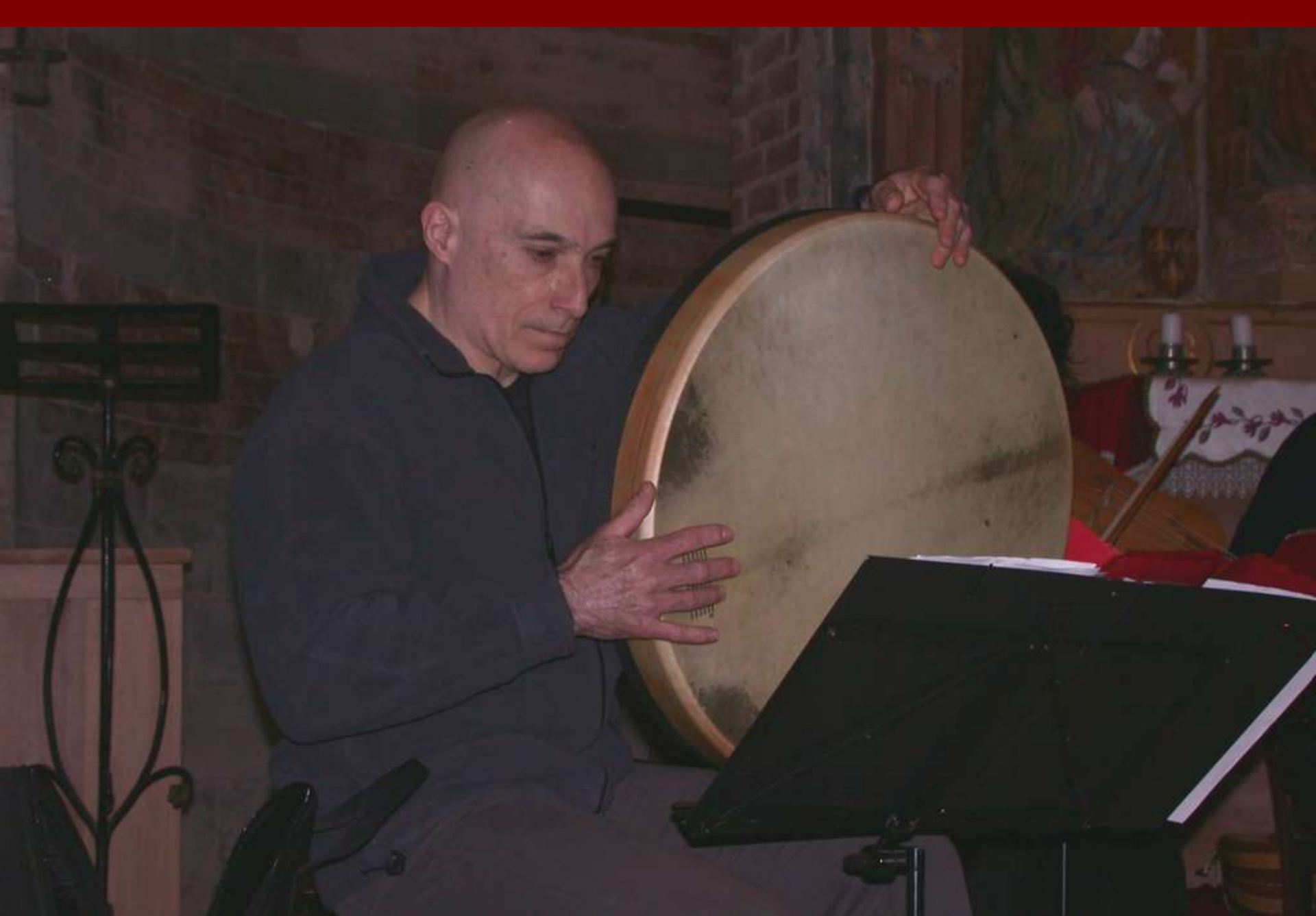
Esecuzione di Brani di musiche medioevali dei secoli XIII e XIV