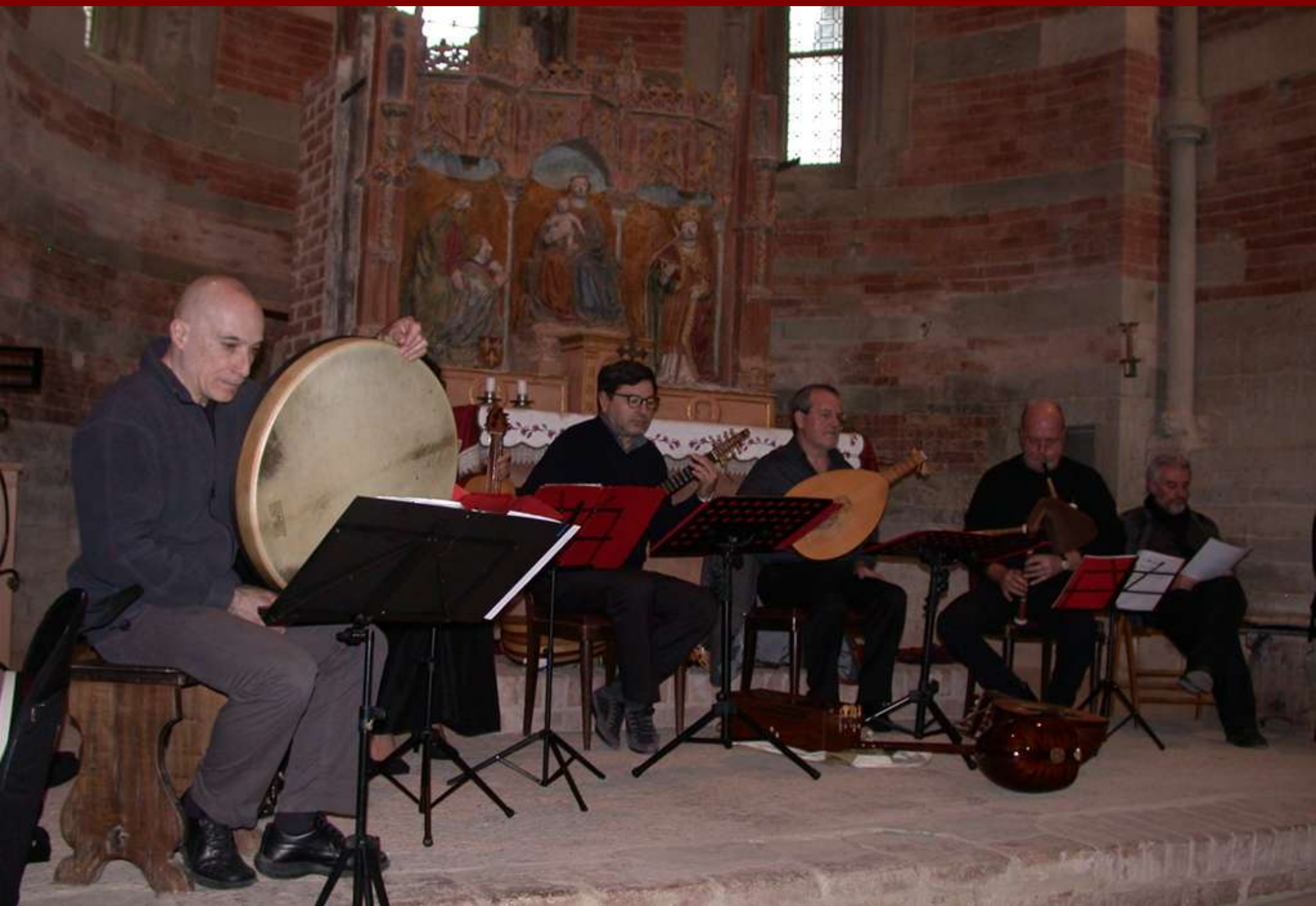
Avvio del Concerto di canti e musiche dei secoli XIII e XIV del Gruppo di Musica antica La Ghironda dal titolo "Echo la primavera"