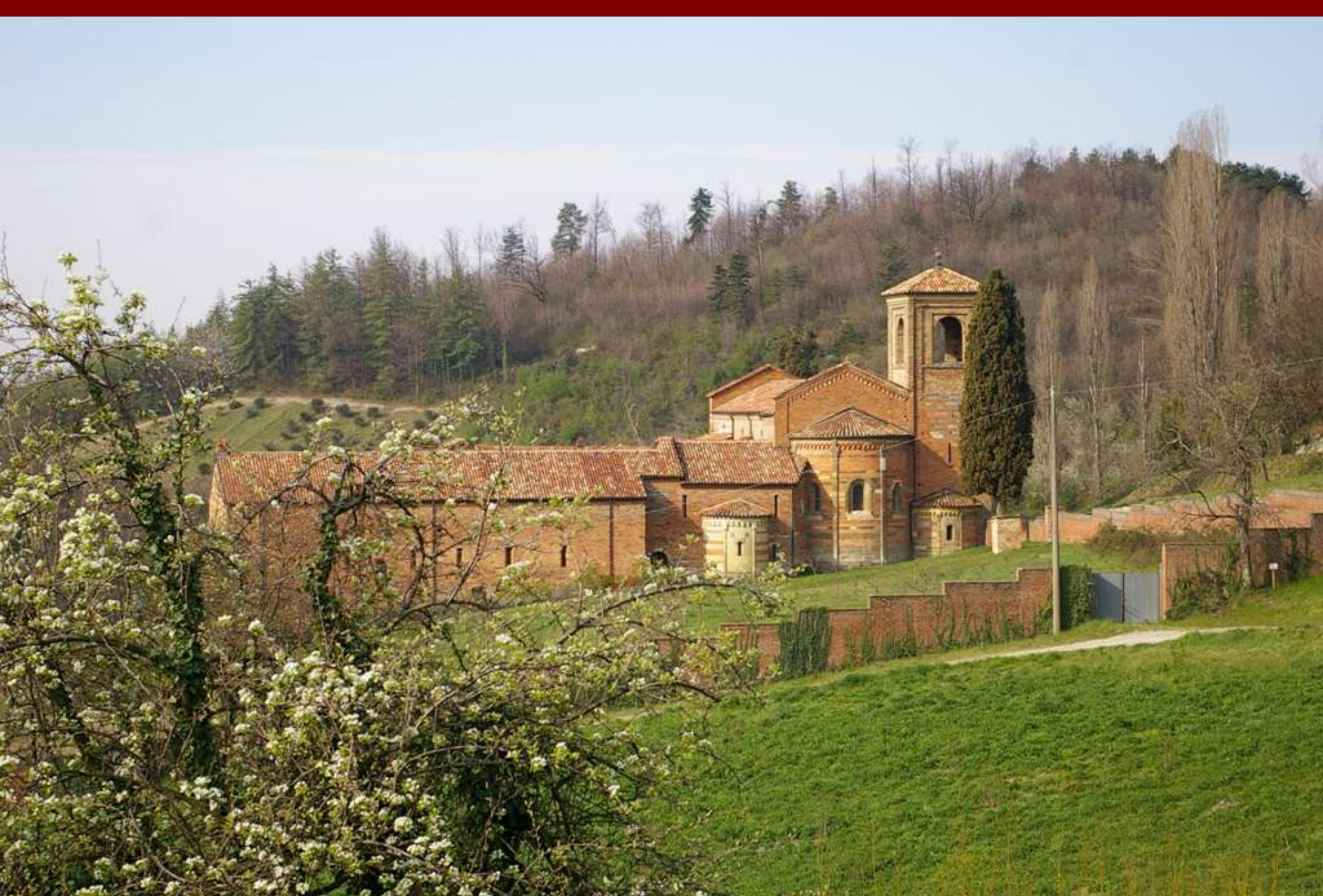
Veduta della Canonica di Santa Maria di Vezzolano nella veste primaverile del paesaggio circostante