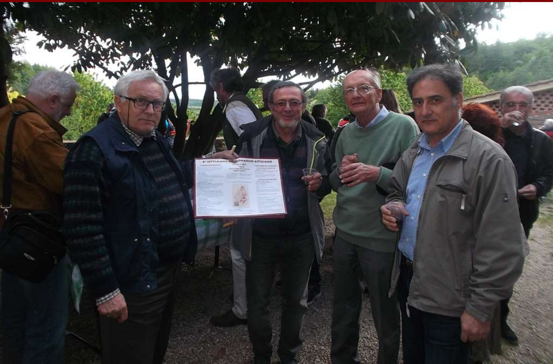
Brindisi nella Corte interna della Canonica di Santa Maria di Vezzolano alla straordinaria figura di Guglielmo da Volpiano studiato nell'ambito della VIII Settimana del Romanico astigiano