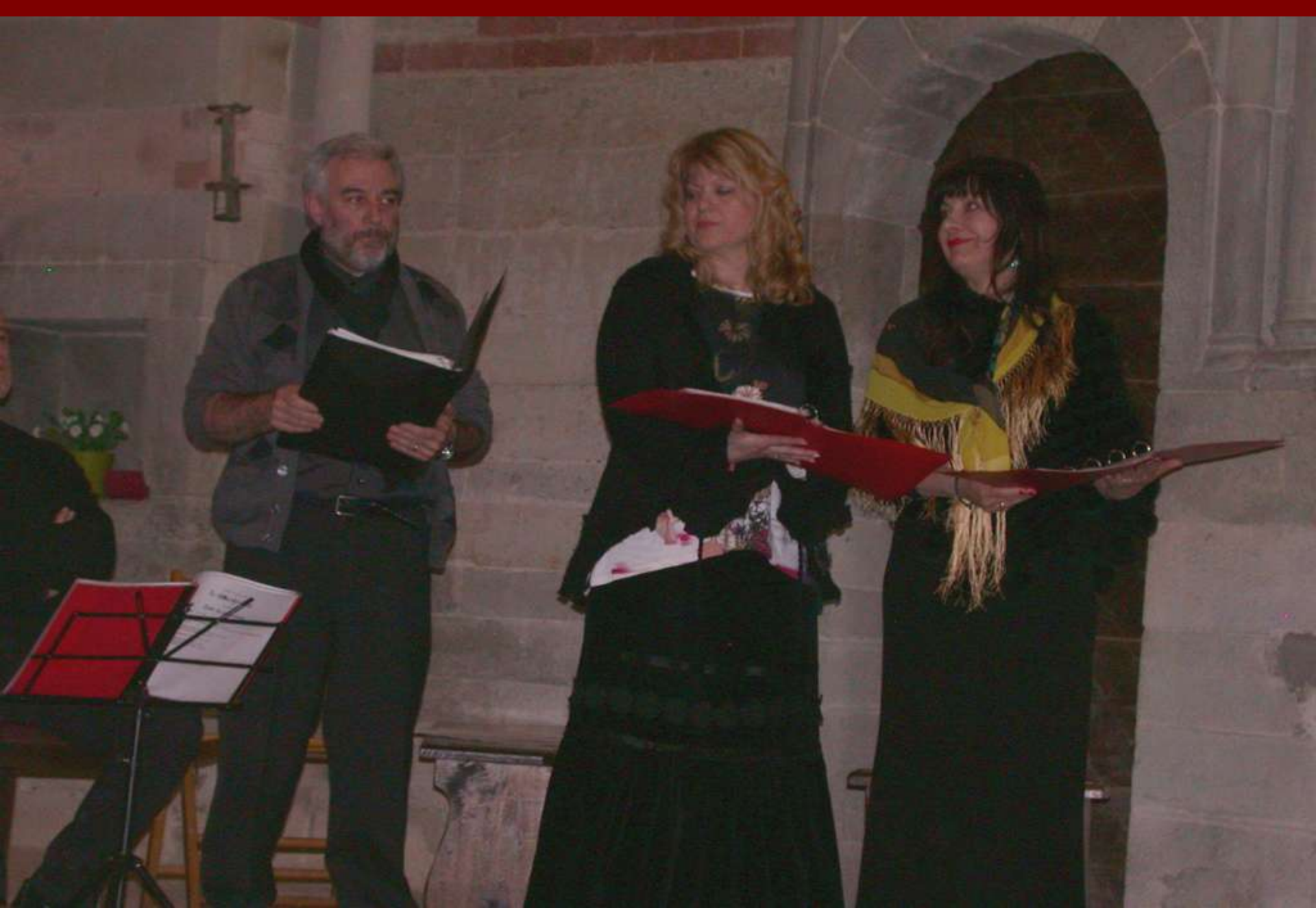
Esecuzione di Brani di canti medioevali dei secoli XIII e XIV