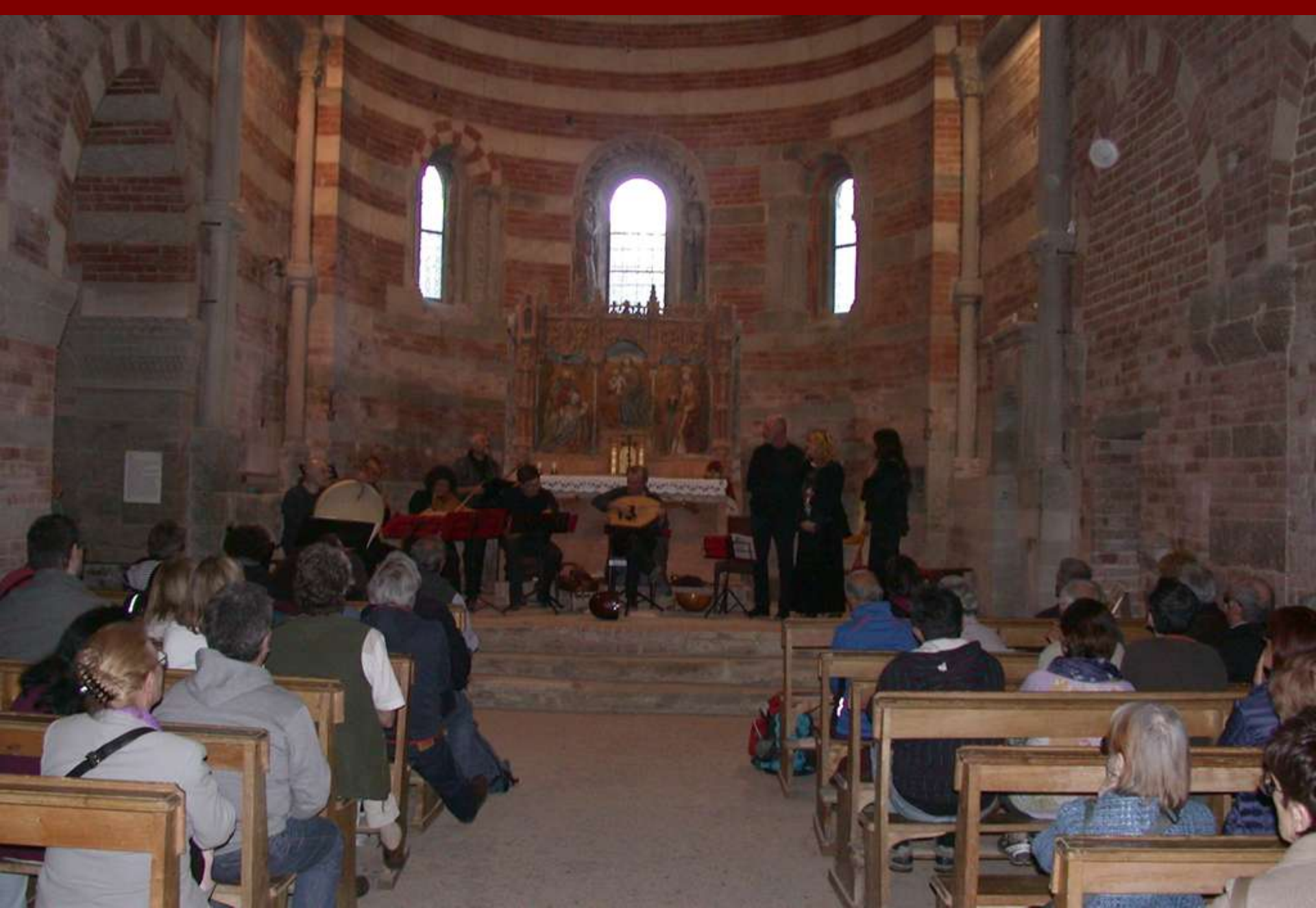
Esecuzione di Brani di musiche medioevali dei secoli XIII e XIV