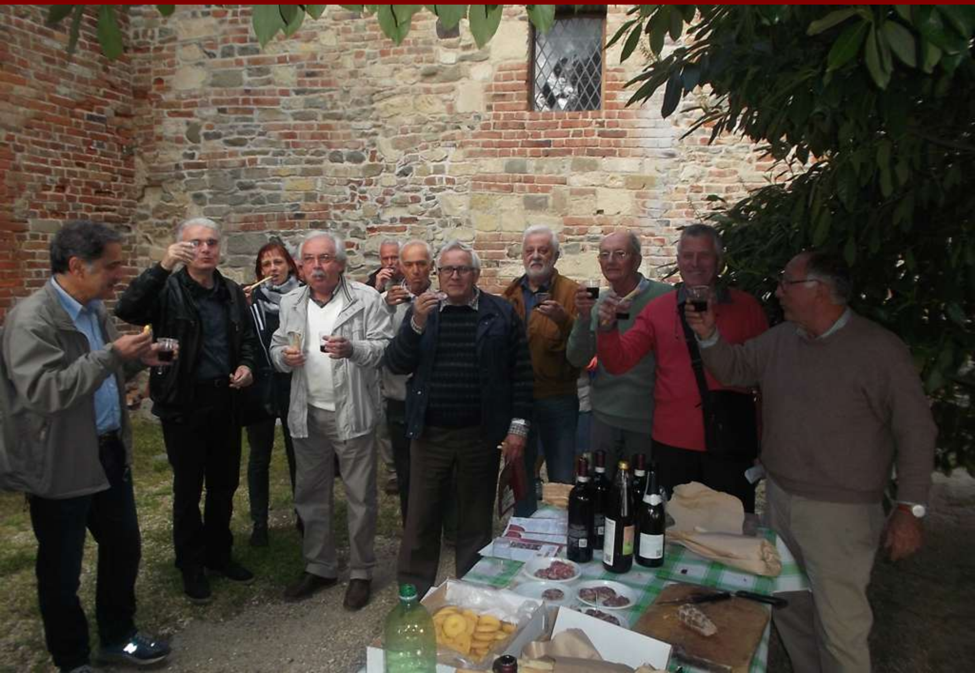
Brindisi nella corte interna della Canonica di Santa Maria di Vezzolano al termine della VIII Settimana del Romanico astigiano