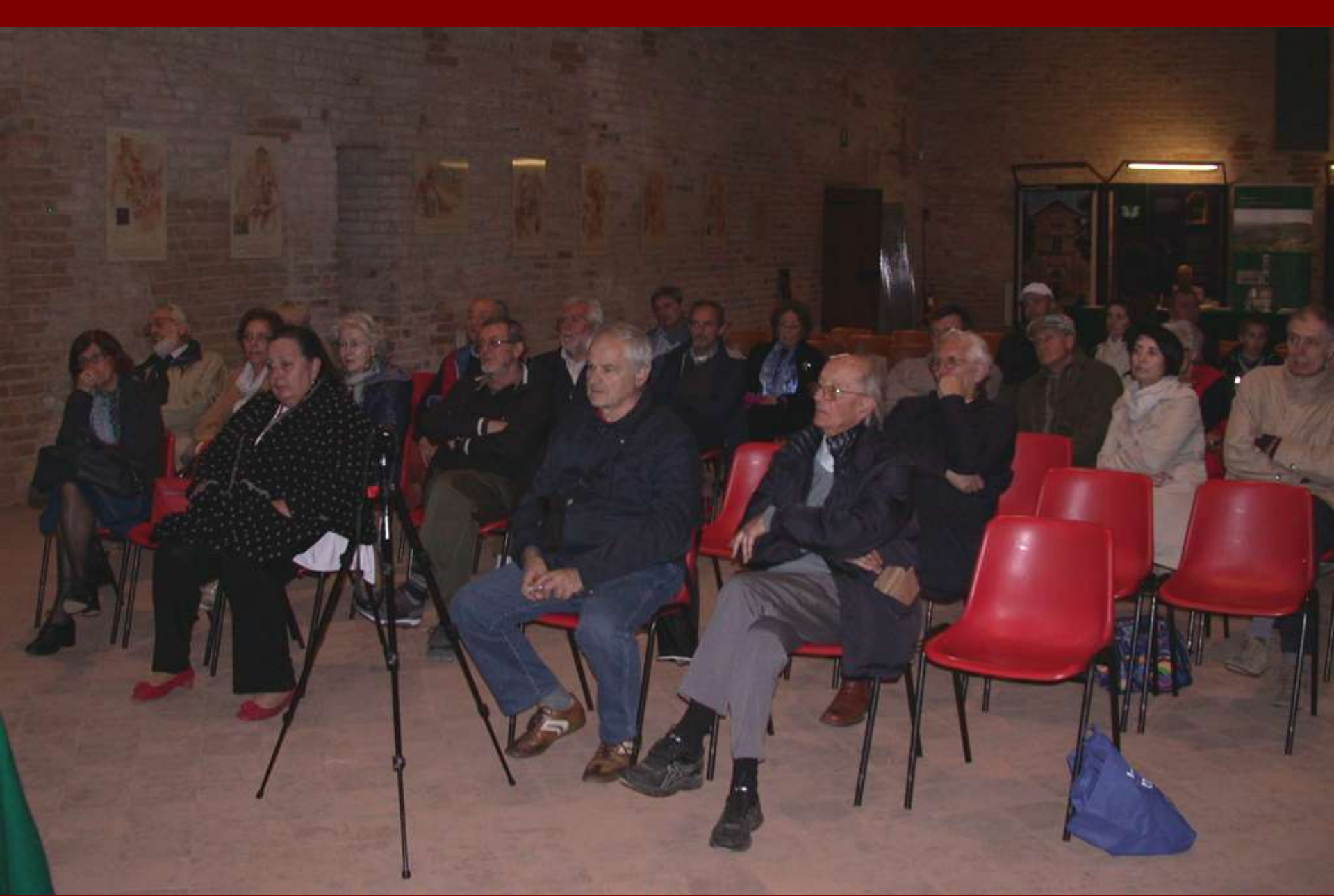
Veduta del folto ed interessato pubblico presente alla giornata di studio inaugurale dell'ottava Settimana del Romanico astigiano