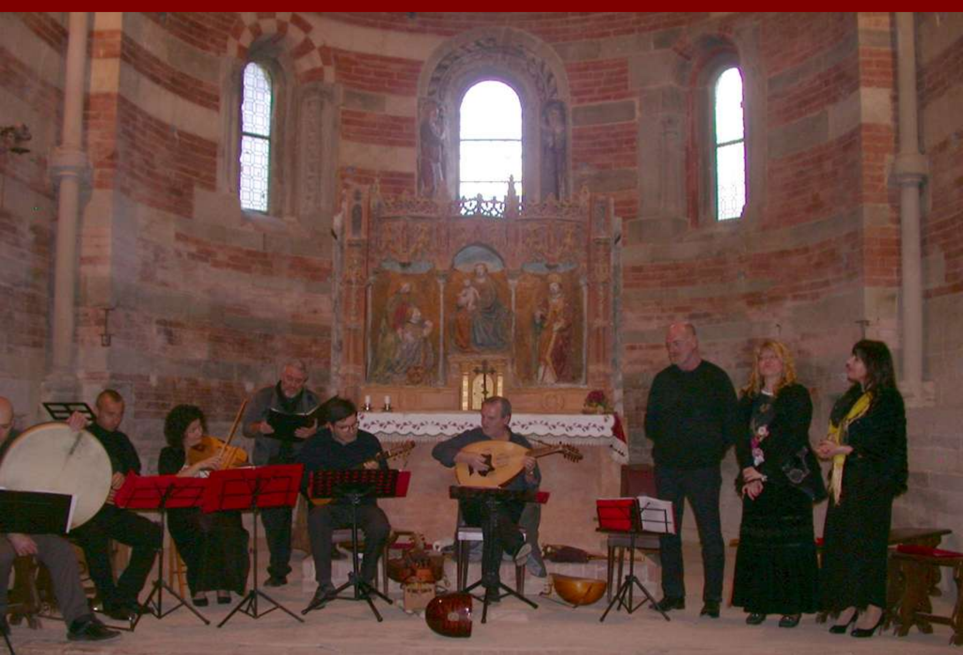
Esecuzione di Brani di musiche medioevali dei secoli XIII e XIV nella suggestiva Canonica di Santa Maria di Vezzolano