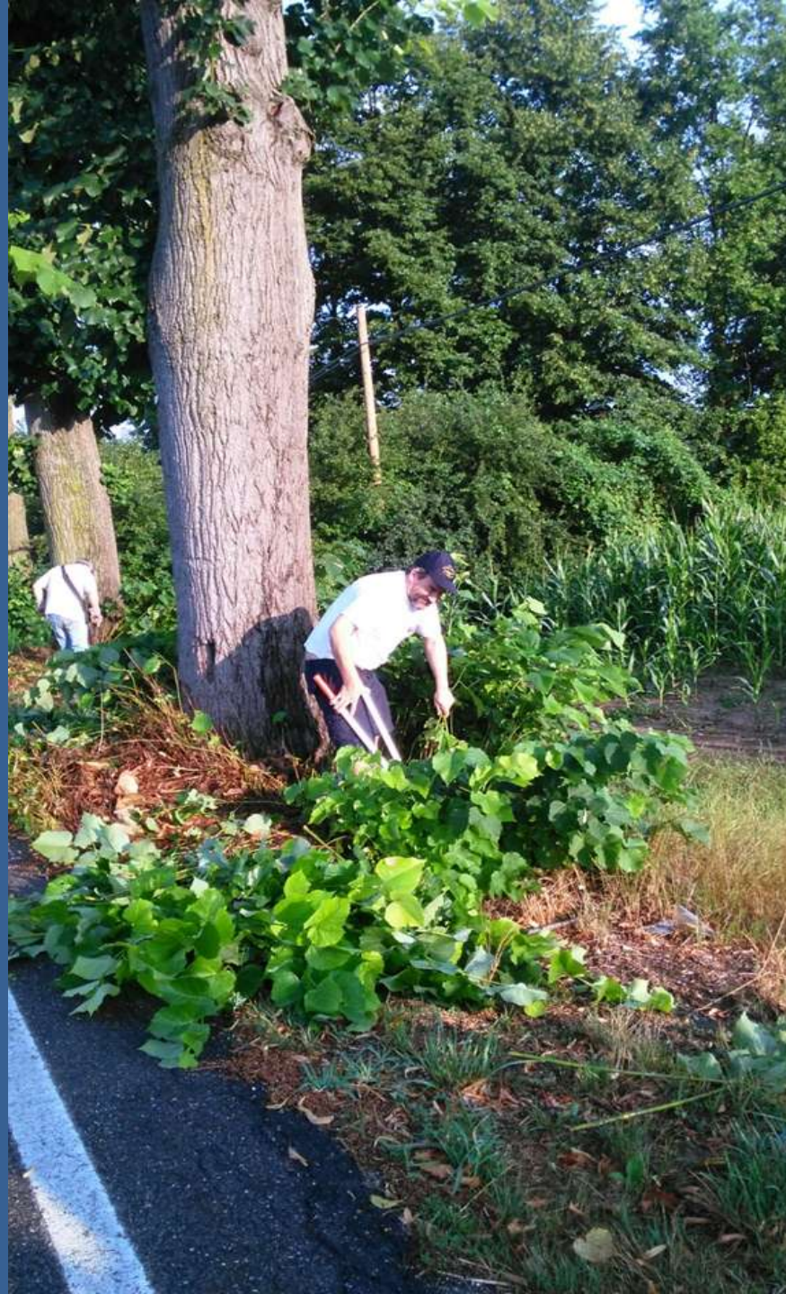
Effettuazione della spollonatura dei tigli a mano con cesoie