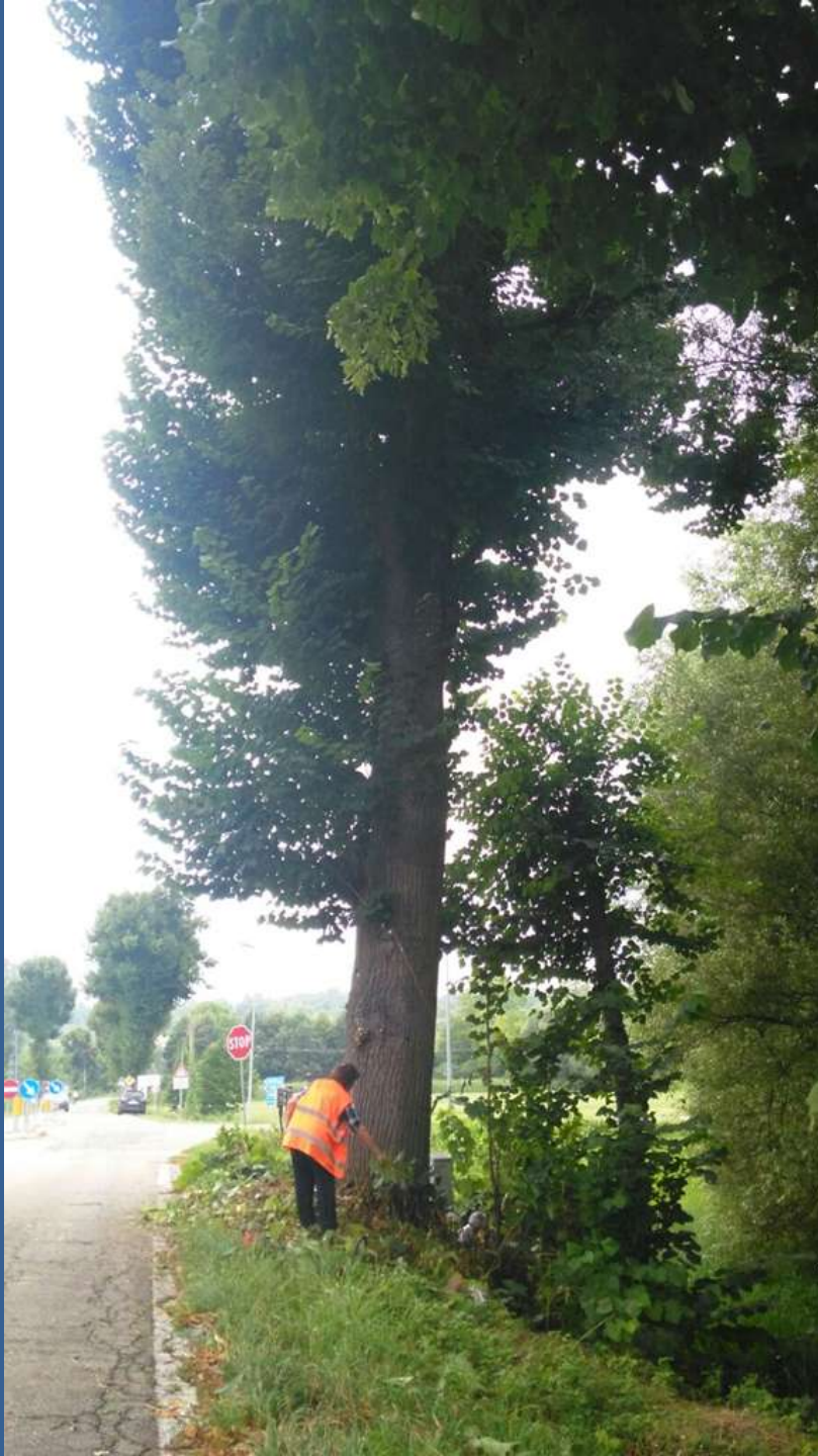
Effettuazione della spollonatura dei tigli a mano con cesoie