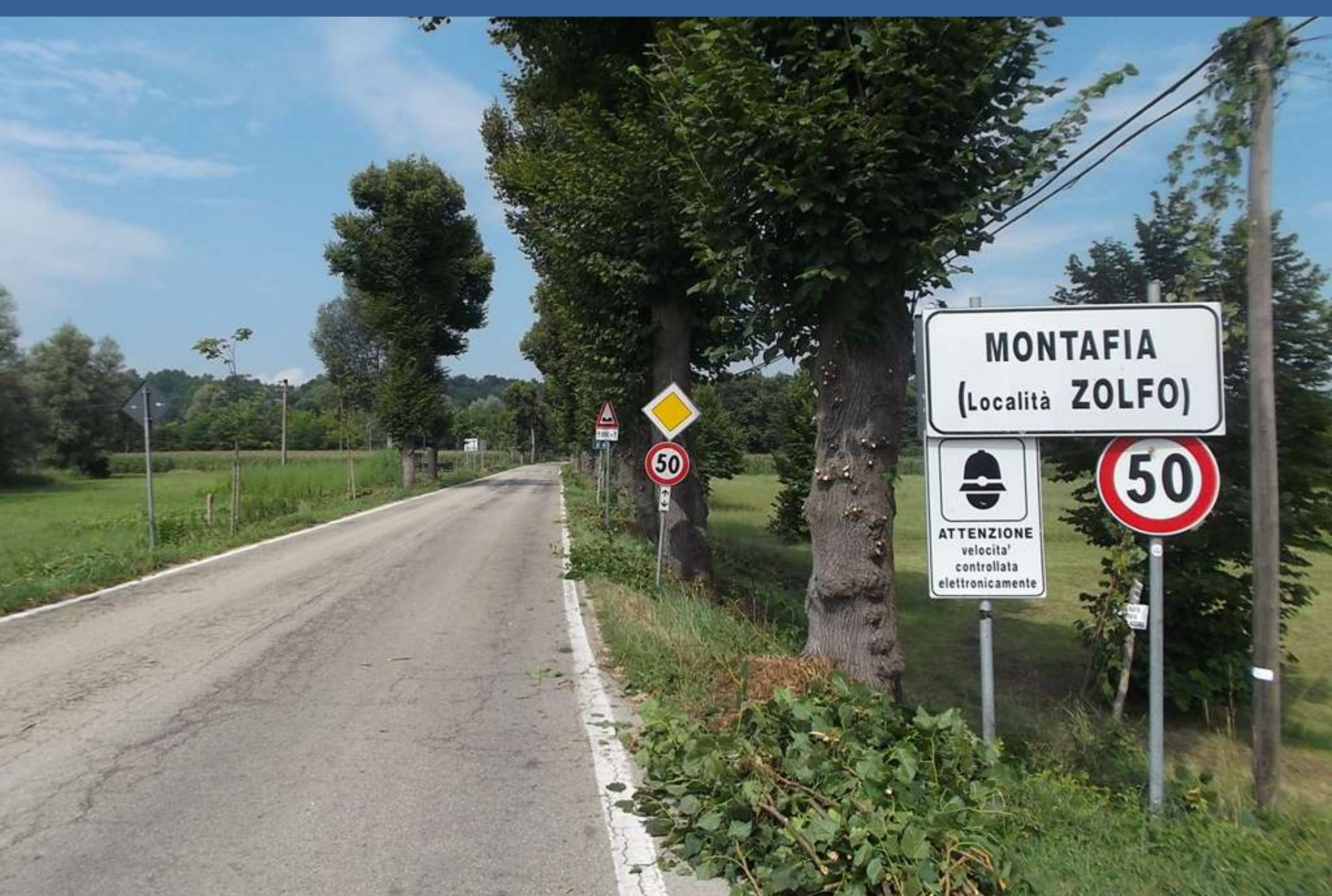
Veduta d'insieme del primo tratto del Viale di Montafia d'Asti al termine della spollonatura e rimozione dei ricacci sui fusti dei tigli