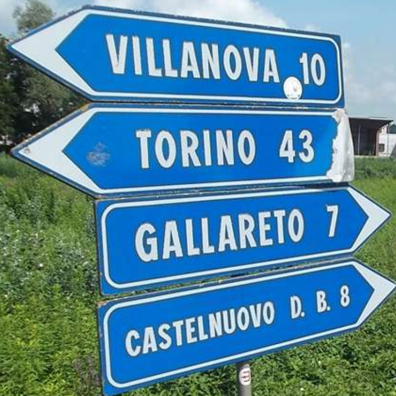
Punto di incrocio con la SP 10 per Villafranca d'Asti che divide in due parti il Viale storico di Montafia