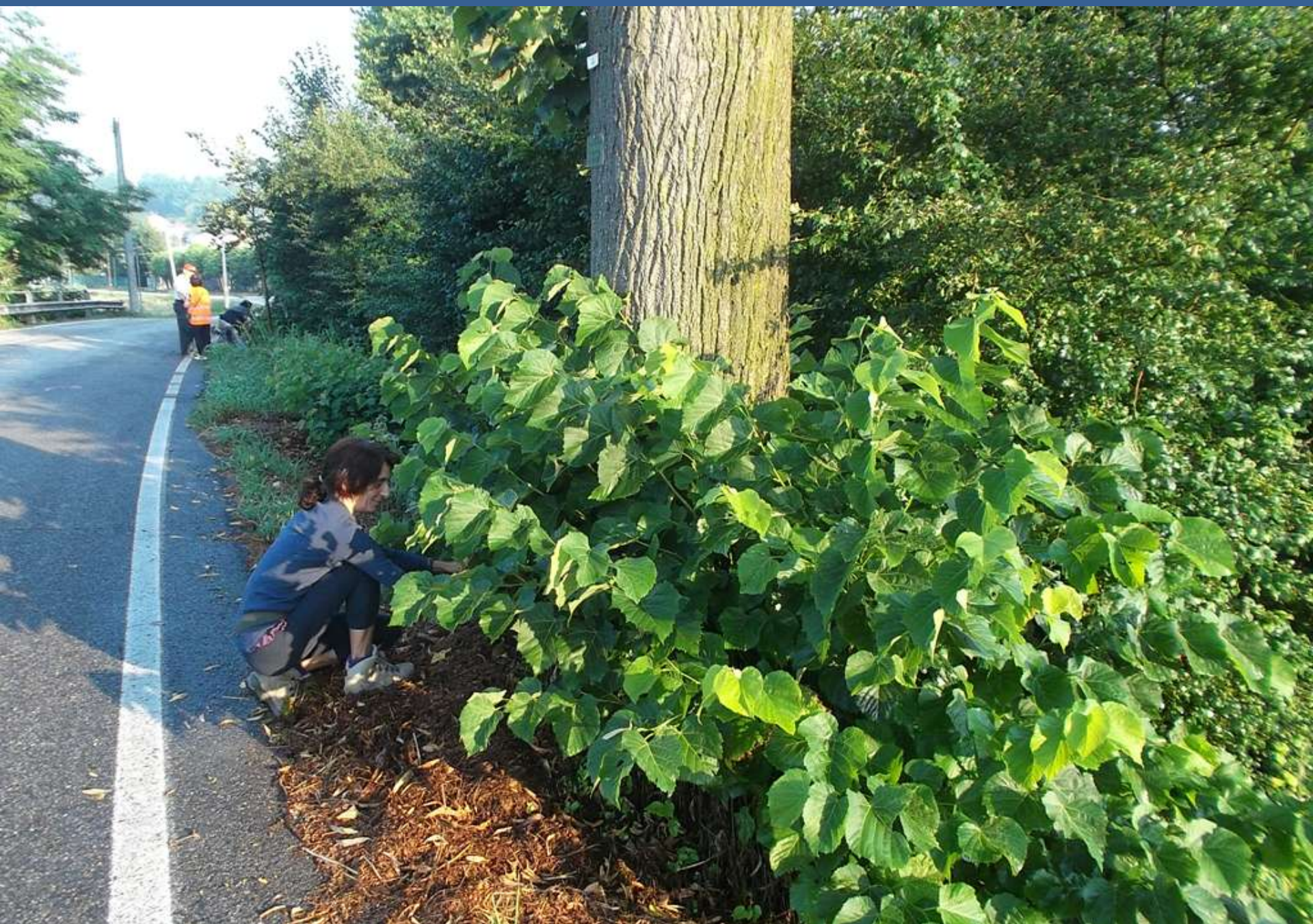
Effettuazione della spollonatura dei tigli a mano con cesoie