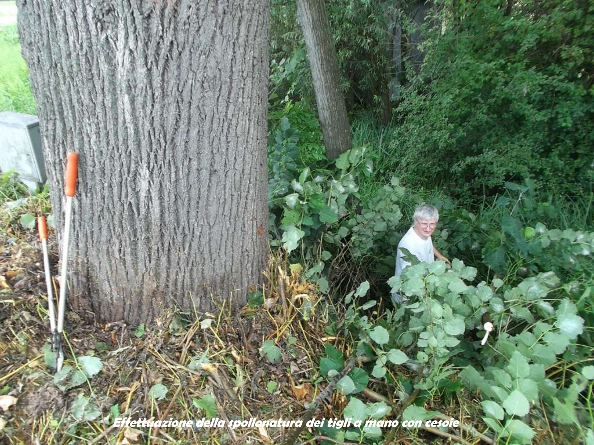
Effettuazione della spollonatura dei tigli a mano con cesoie