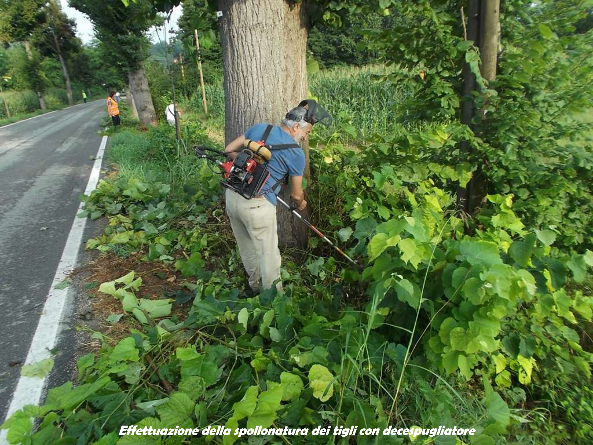
Effettuazione della spollonatura dei tigli con decespugliatore