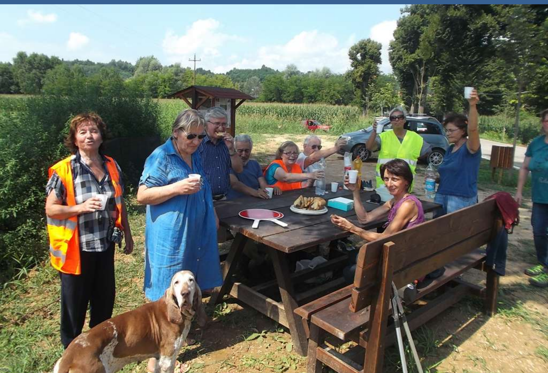
Momento conviviale del gruppo di lavoro al termine dell'intervento partecipato di spollonatura del Viale storico di Montafia d'Asti