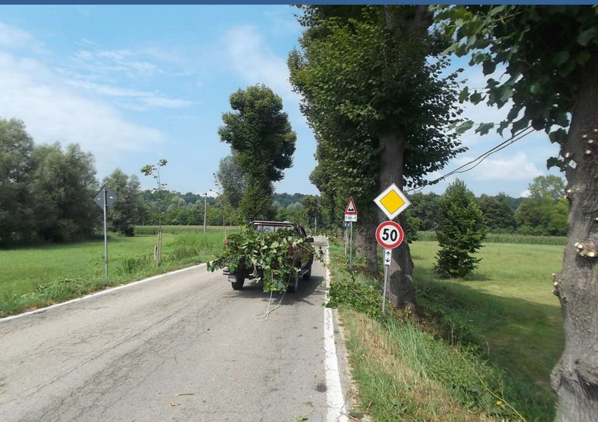
Raccolta, rimozione e trasporto dei polloni rimossi lungo il Viale storico di Montafia