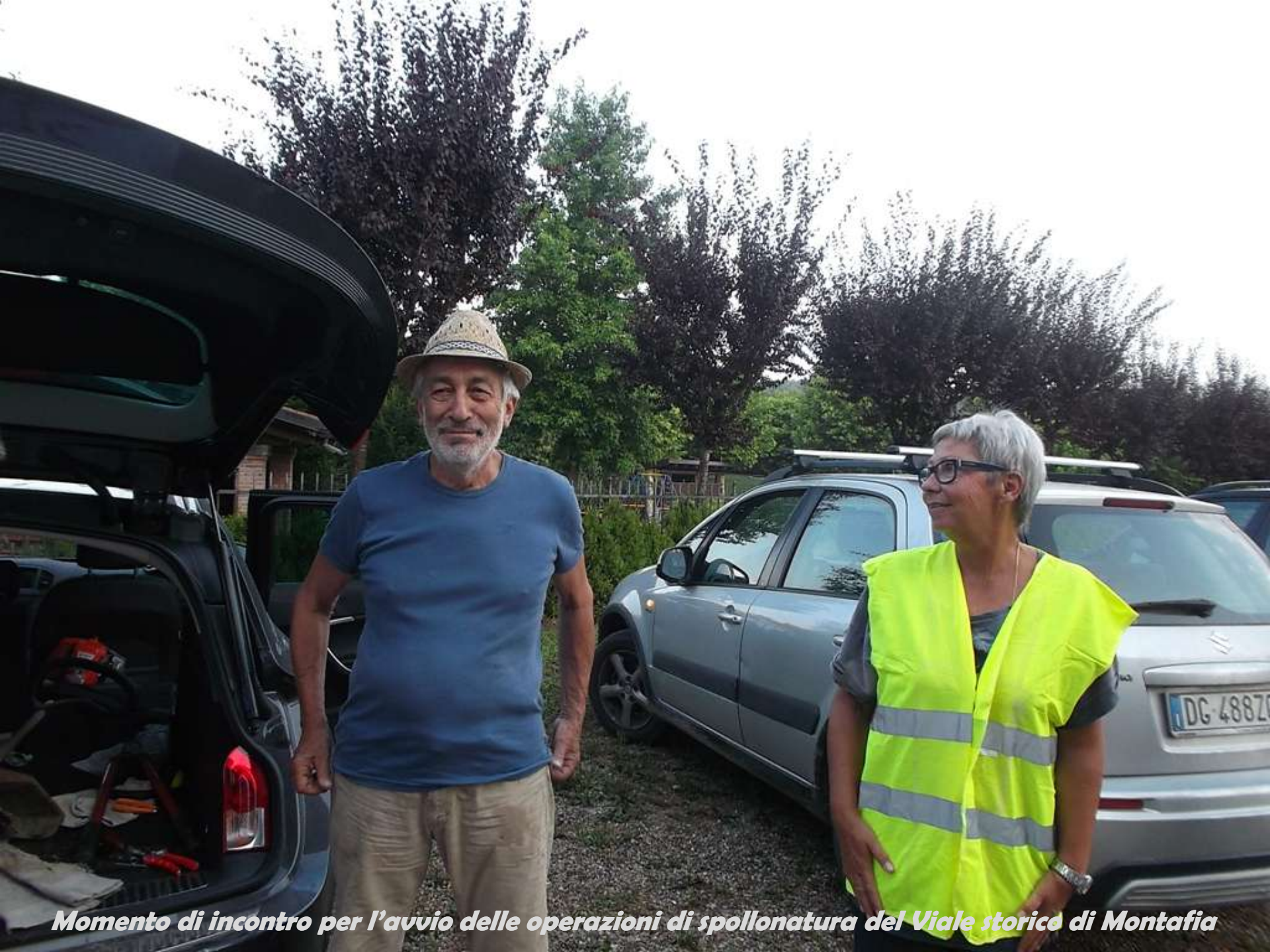
Momento di incontro per l'avvio delle operazioni di spollonatura del Viale storico di Montafia