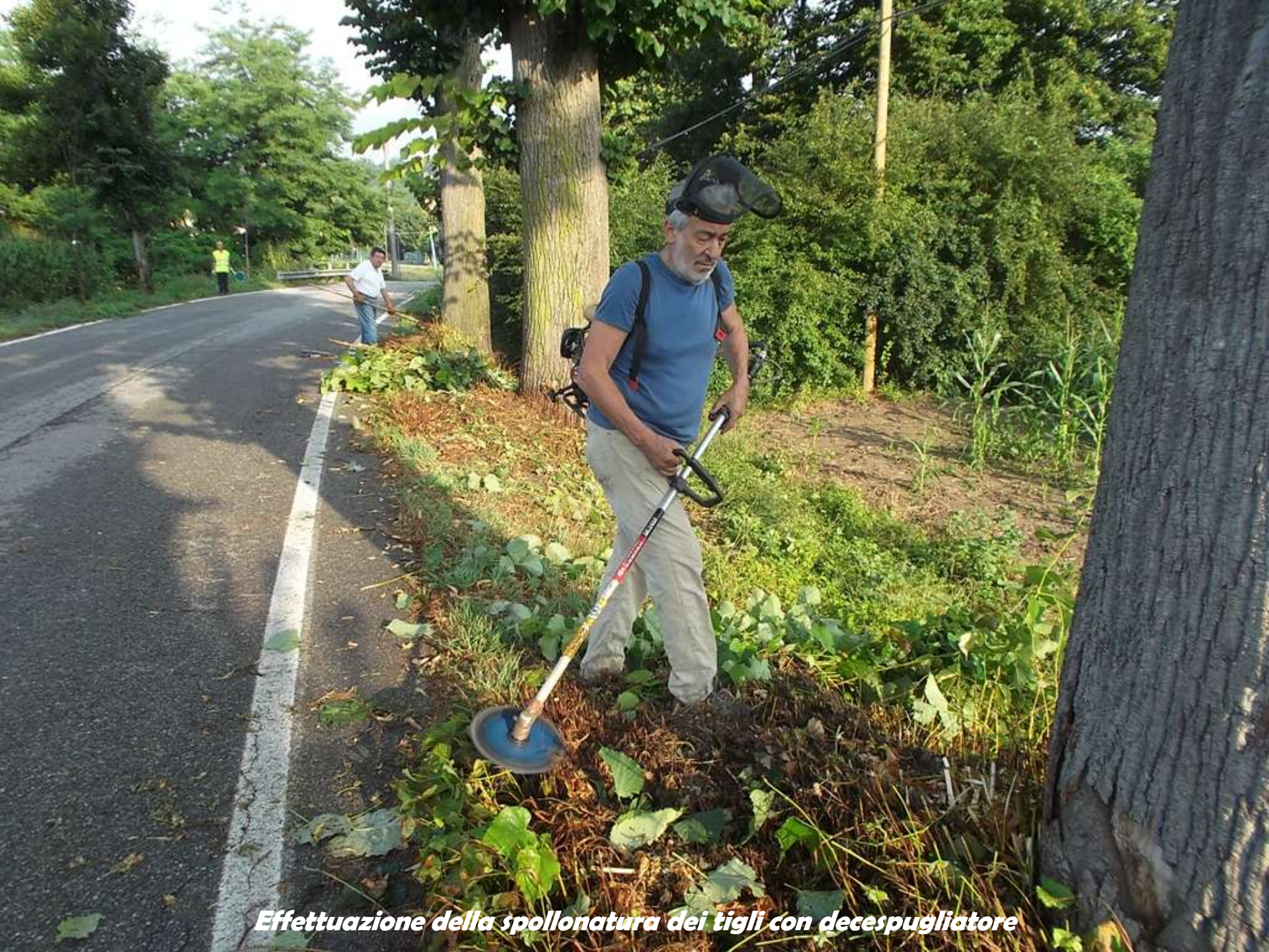
Effettuazione della spollonatura dei tigli con decespugliatore