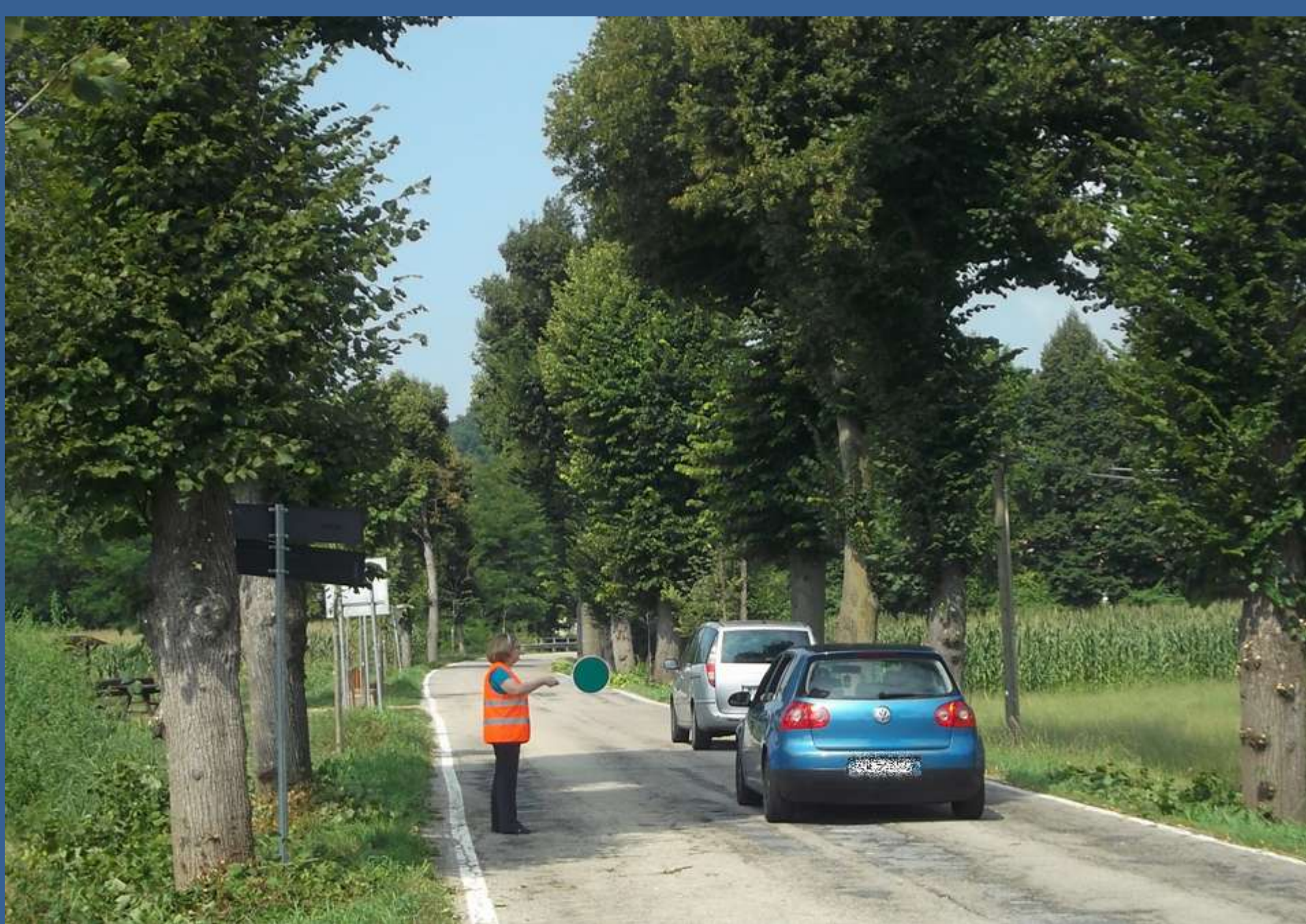
Regolazione del traffico alternato per la gestione in sicurezza del Cantiere stradale di spollonatura