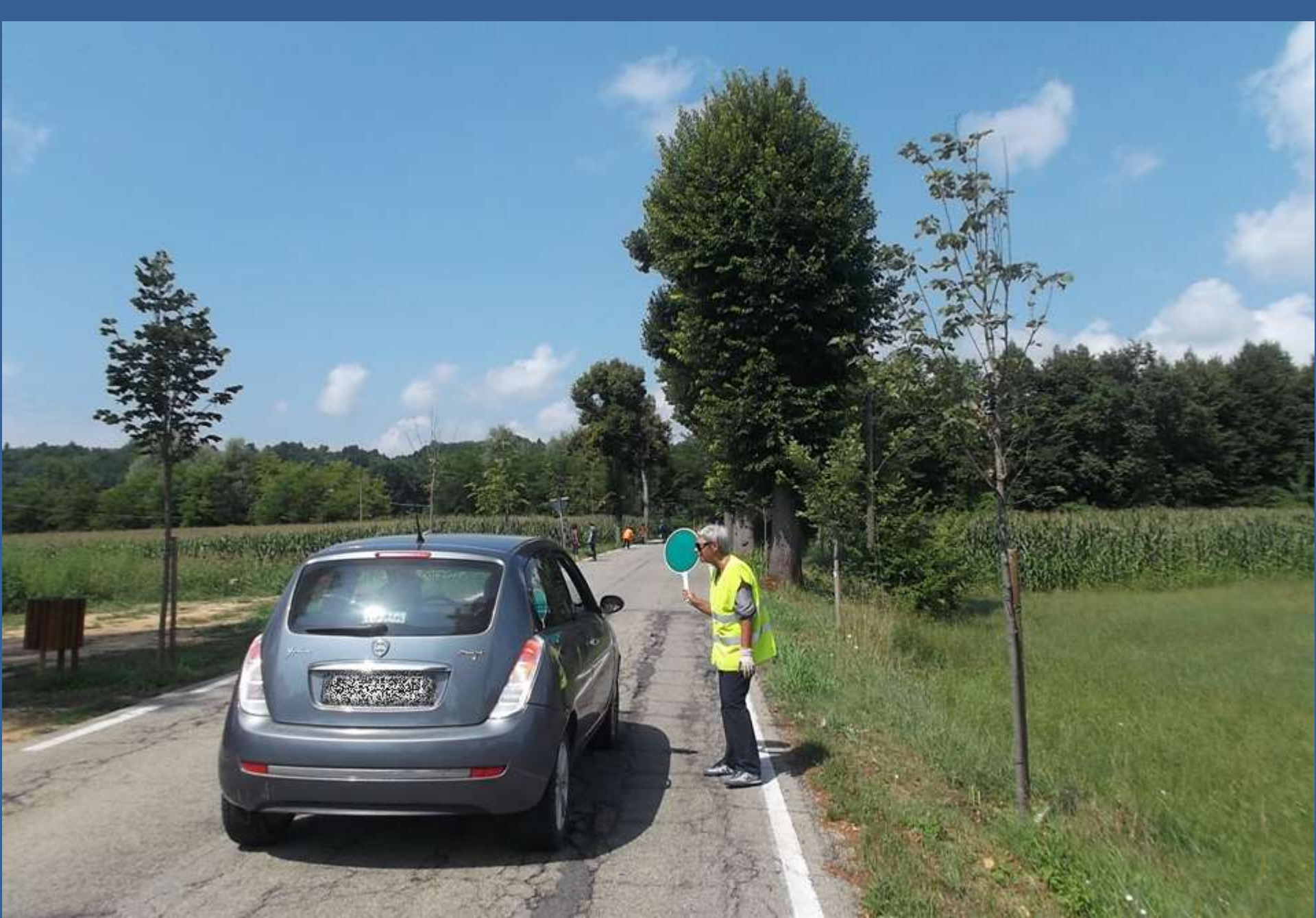
Regolazione del traffico alternato per la gestione in sicurezza del Cantiere stradale di spollonatura