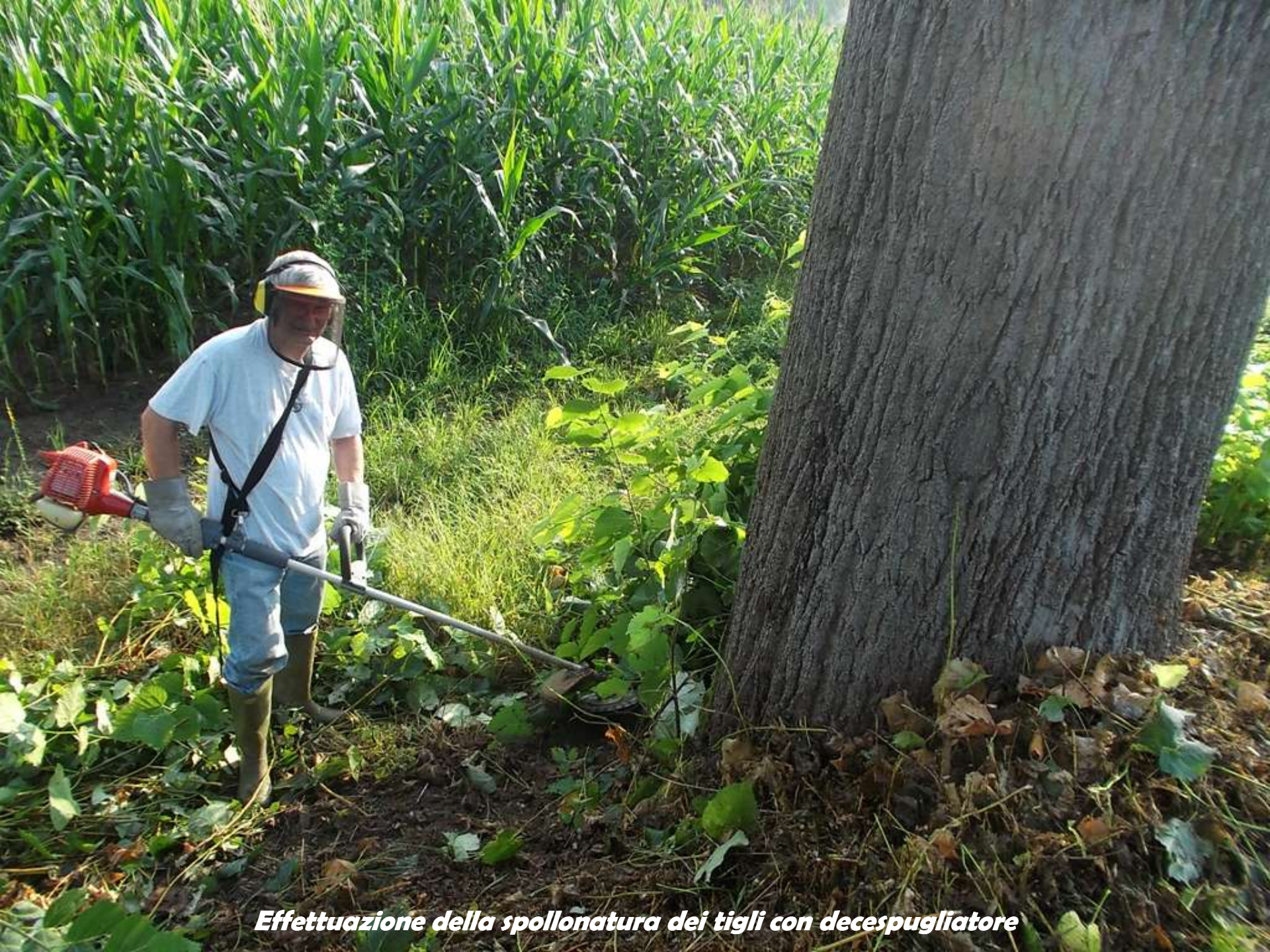
Effettuazione della spollonatura dei tigli con decespugliatore