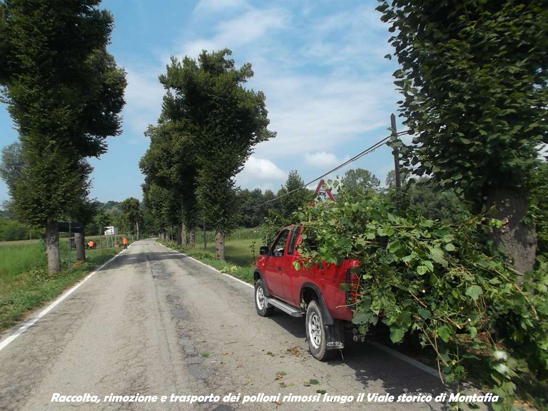
Raccolta, rimozione e trasporto dei polloni rimossi lungo il Viale storico di Montafia