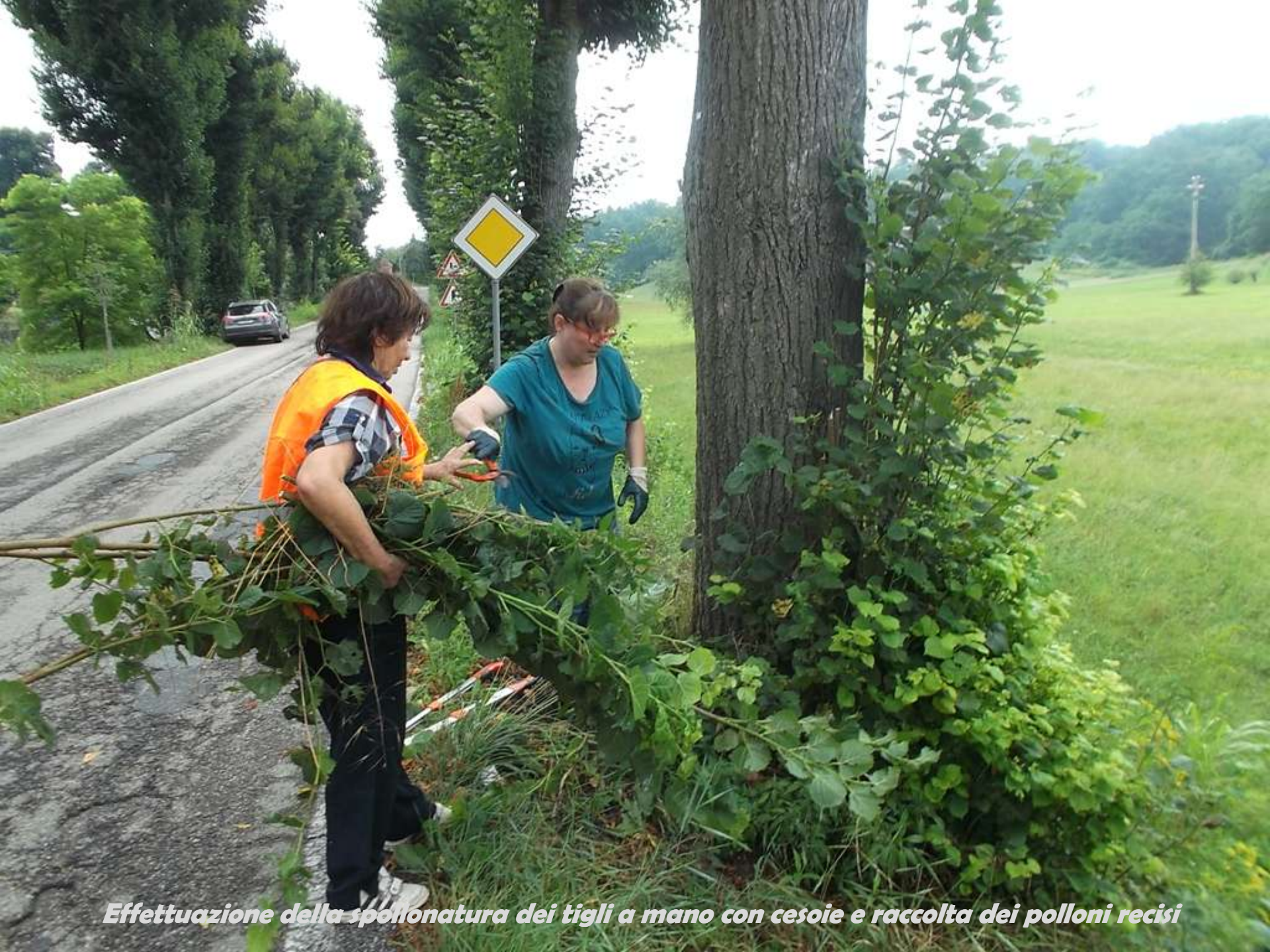
Effettuazione della spollonatura dei tigli a mano con cesoie e raccolta dei polloni recisi