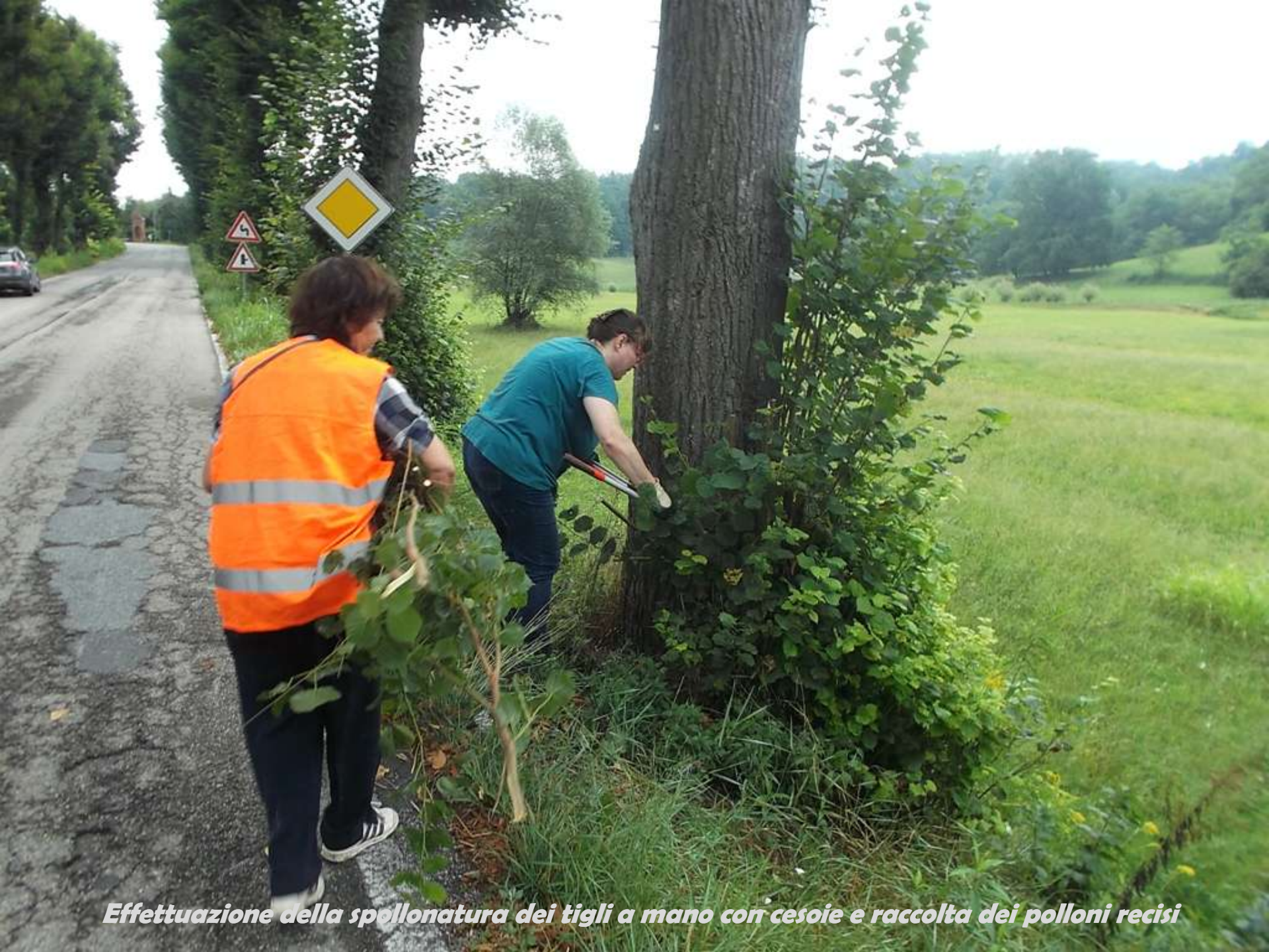
Effettuazione della spollonatura dei tigli a mano con cesoie e raccolta dei polloni recisi