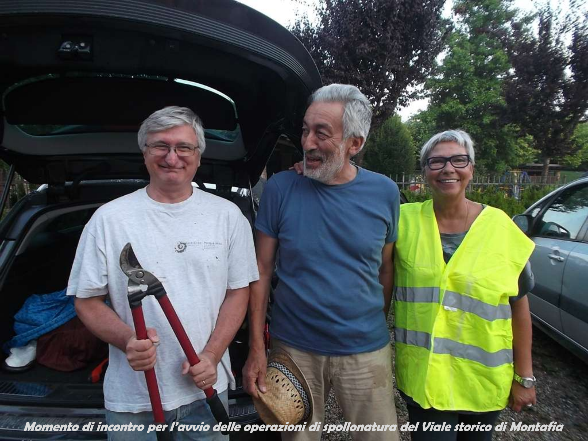
Momento di incontro per l'avvio delle operazioni di spollonatura del Viale storico di Montafia