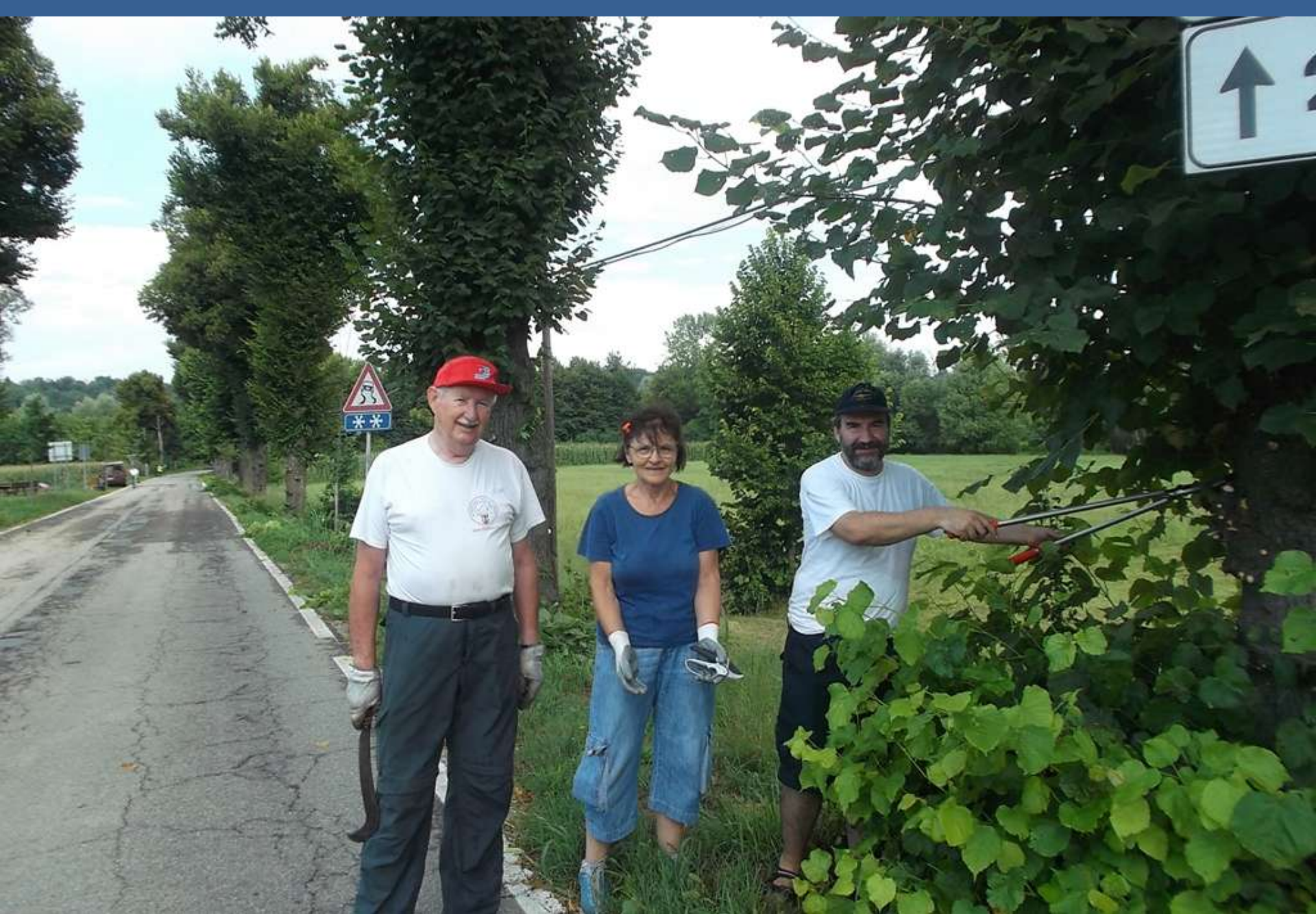
Rimozione dei ricacci presenti sul fusto dei tigli sino a circa 2 metri di altezza