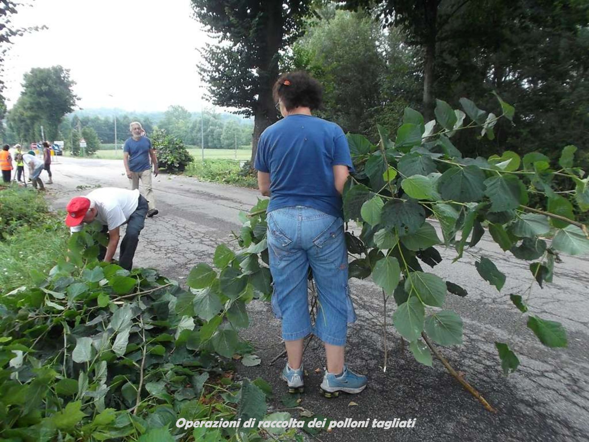
Operazioni di raccolta dei polloni tagliati