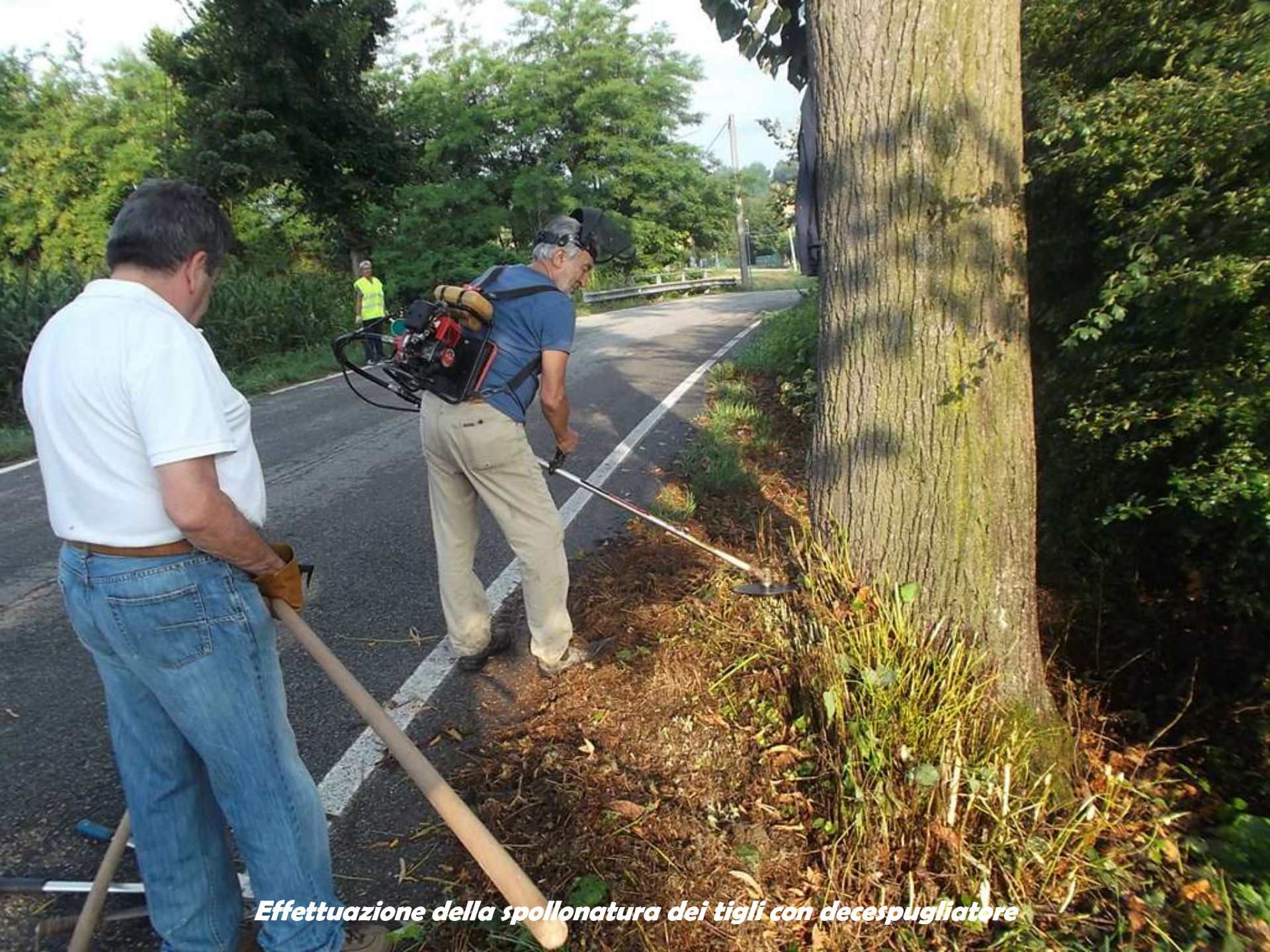
Effettuazione della spollonatura dei tigli con decespugliatore