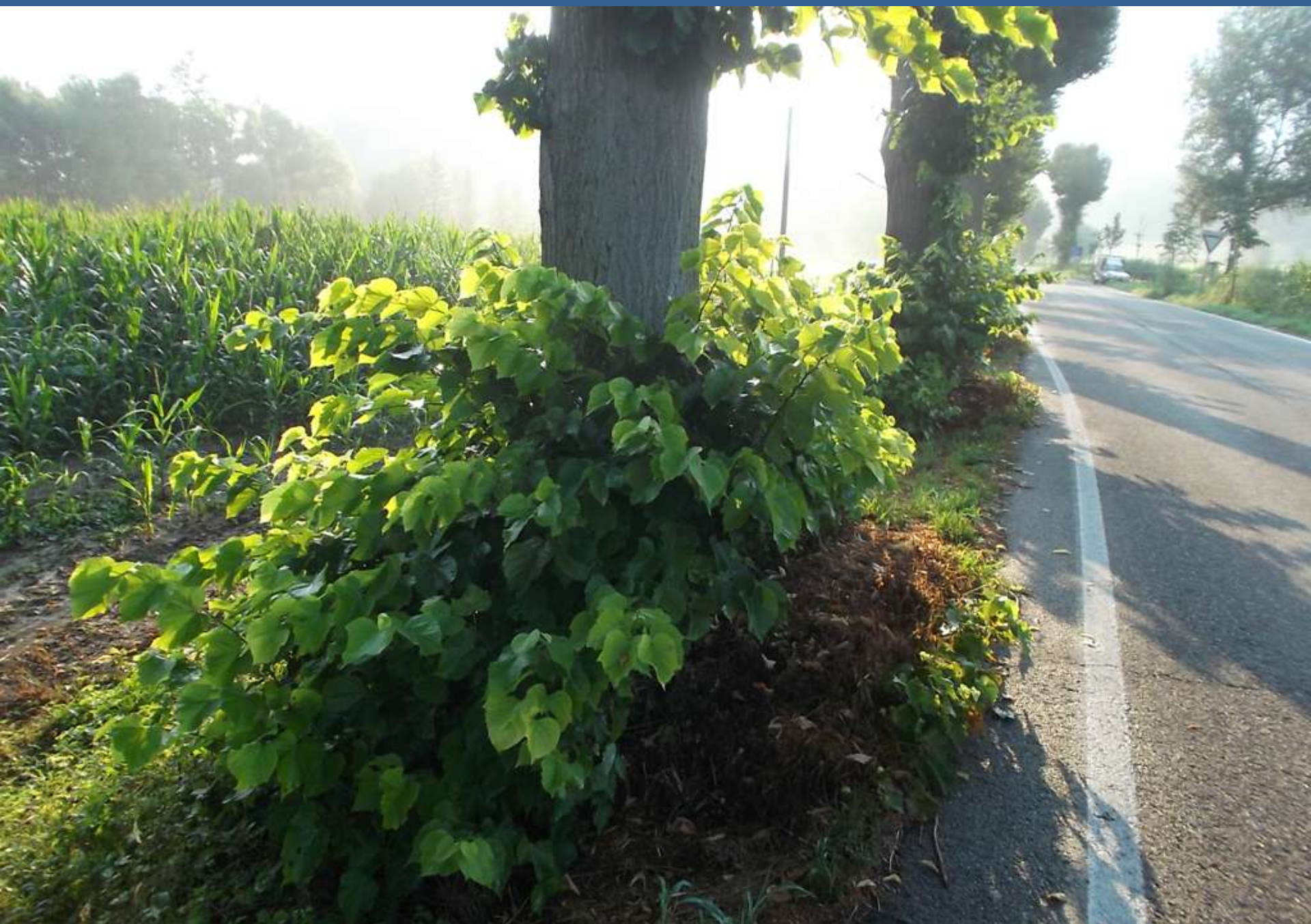
Condizioni iniziali delle piante di taglio del Viale storico di Montafia con rigogliosi polloni basali