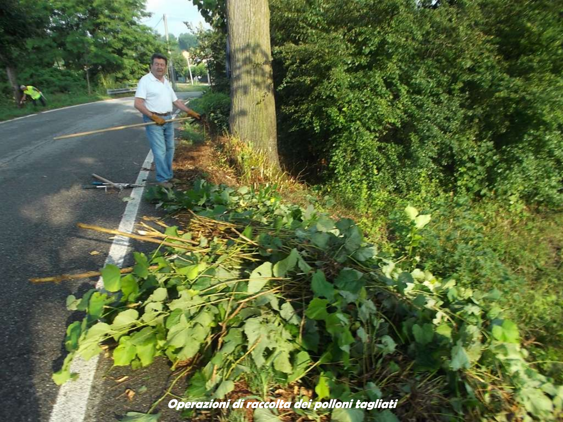
Operazioni di raccolta dei polloni tagliati