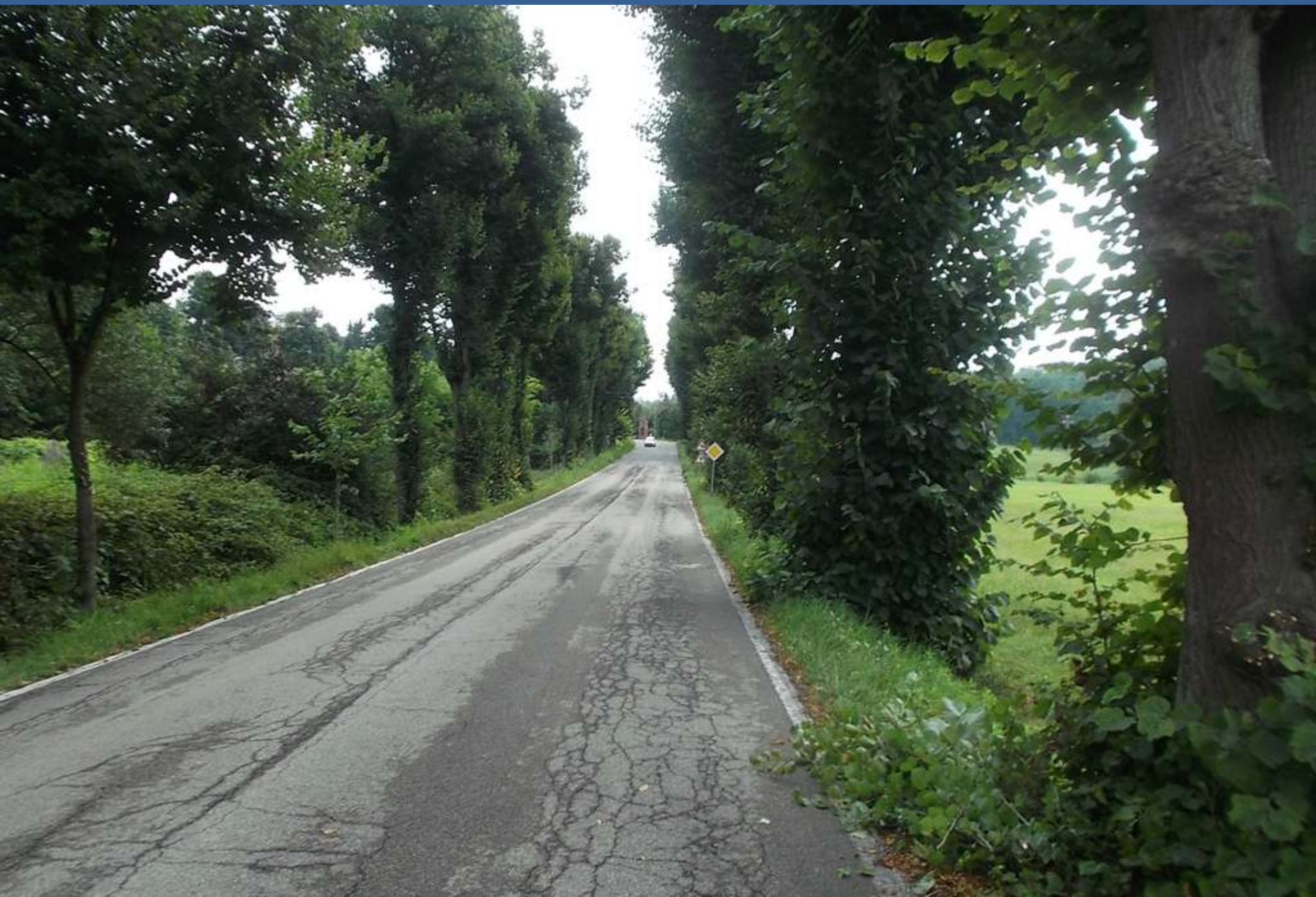
Condizioni iniziali dei tigli del secondo tratto del Viale dall'incrocio con la SP 10 all'abitato di Montafia