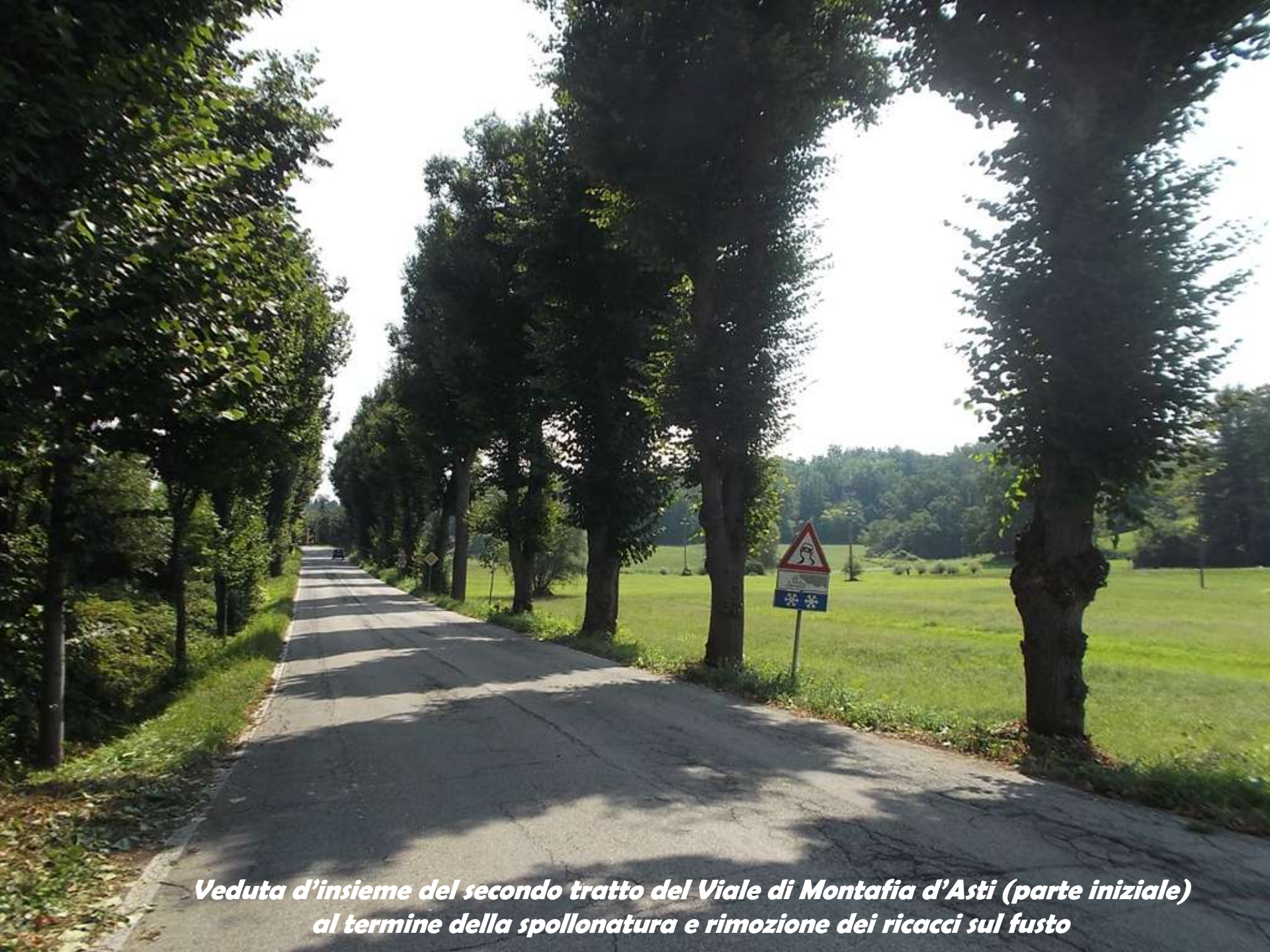
Veduta d'insieme del secondo tratto del Viale di Montafia d'Asti (parte iniziale) al termine della spollonatura e rimozione dei ricacci sul fusto