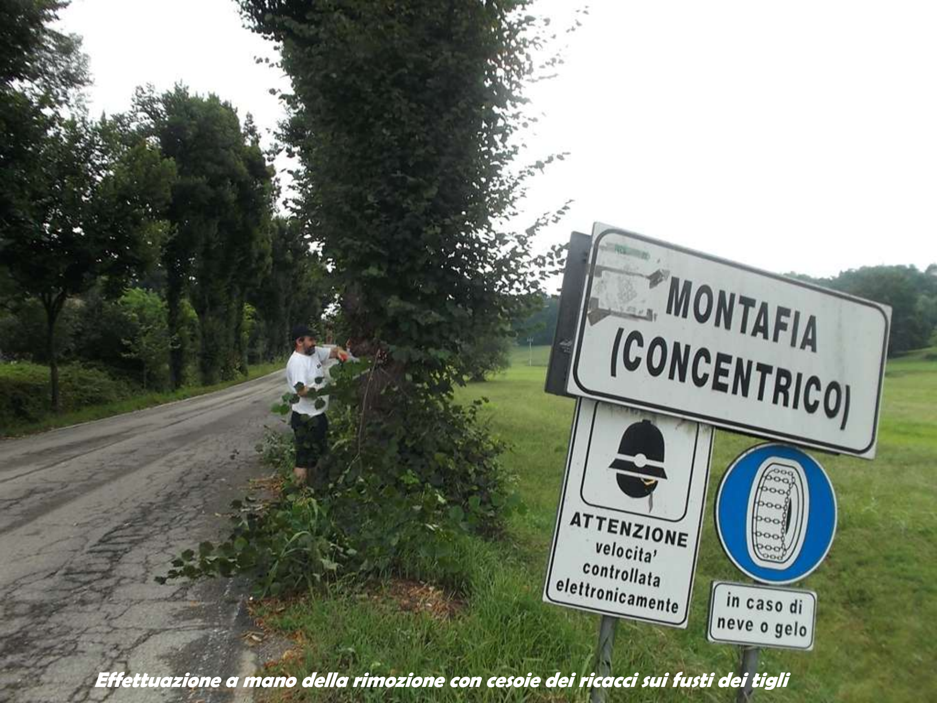
Effettuazione a mano della rimozione con cesoie dei ricacci sui fusti dei tigli