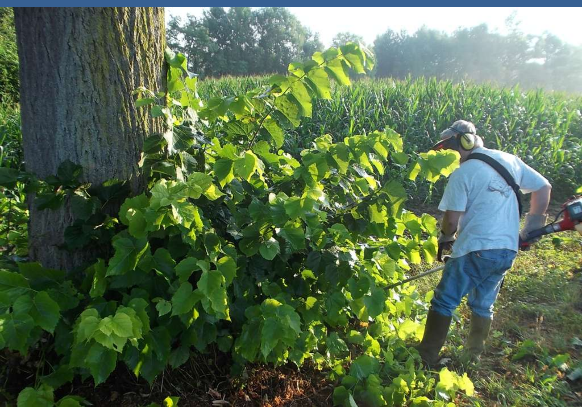
Effettuazione della spollonatura dei tigli con decespugliatore