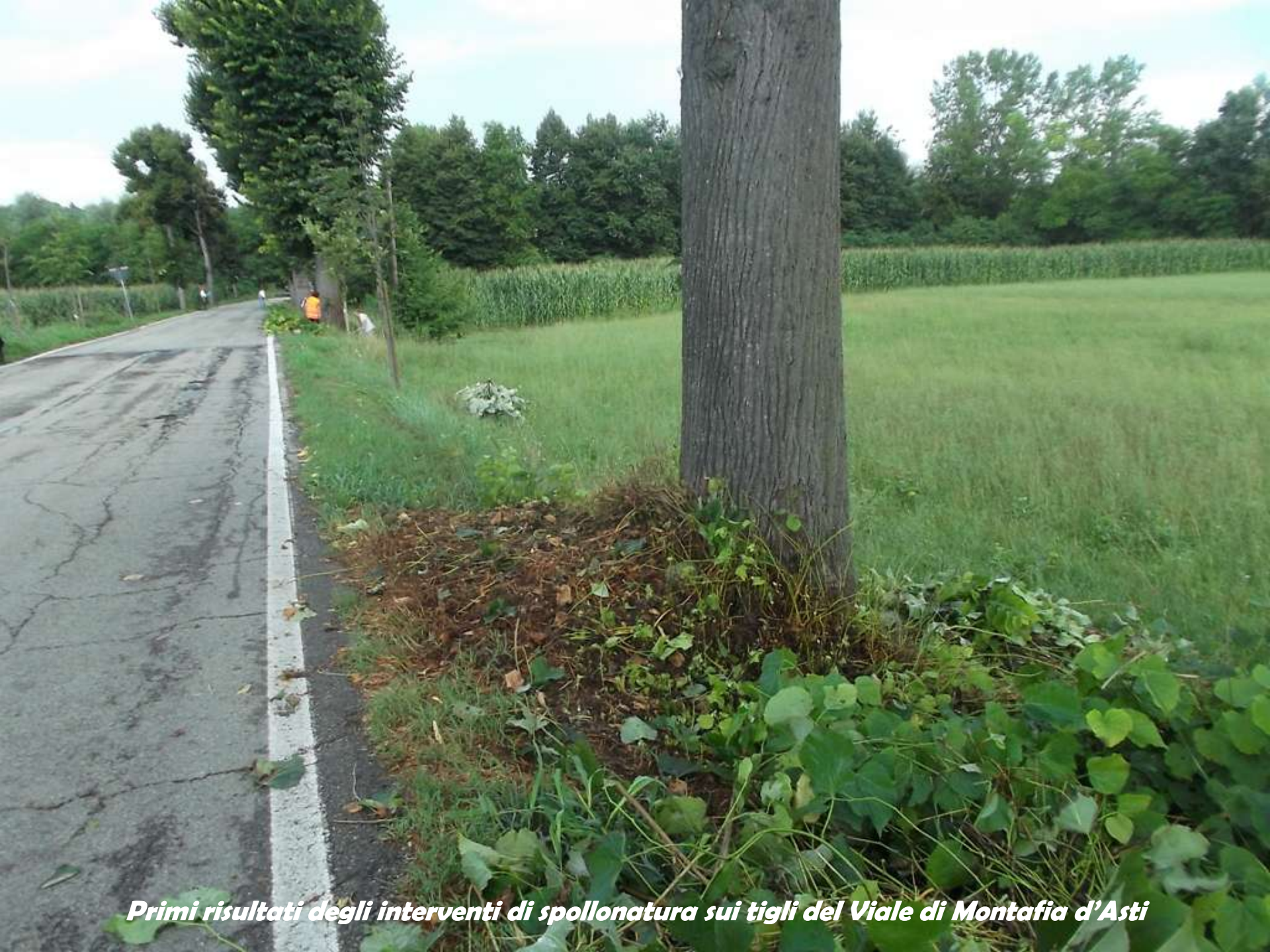
Primi risultati degli interventi di spollonatura sui tigli del Viale di Montafia d'Asti