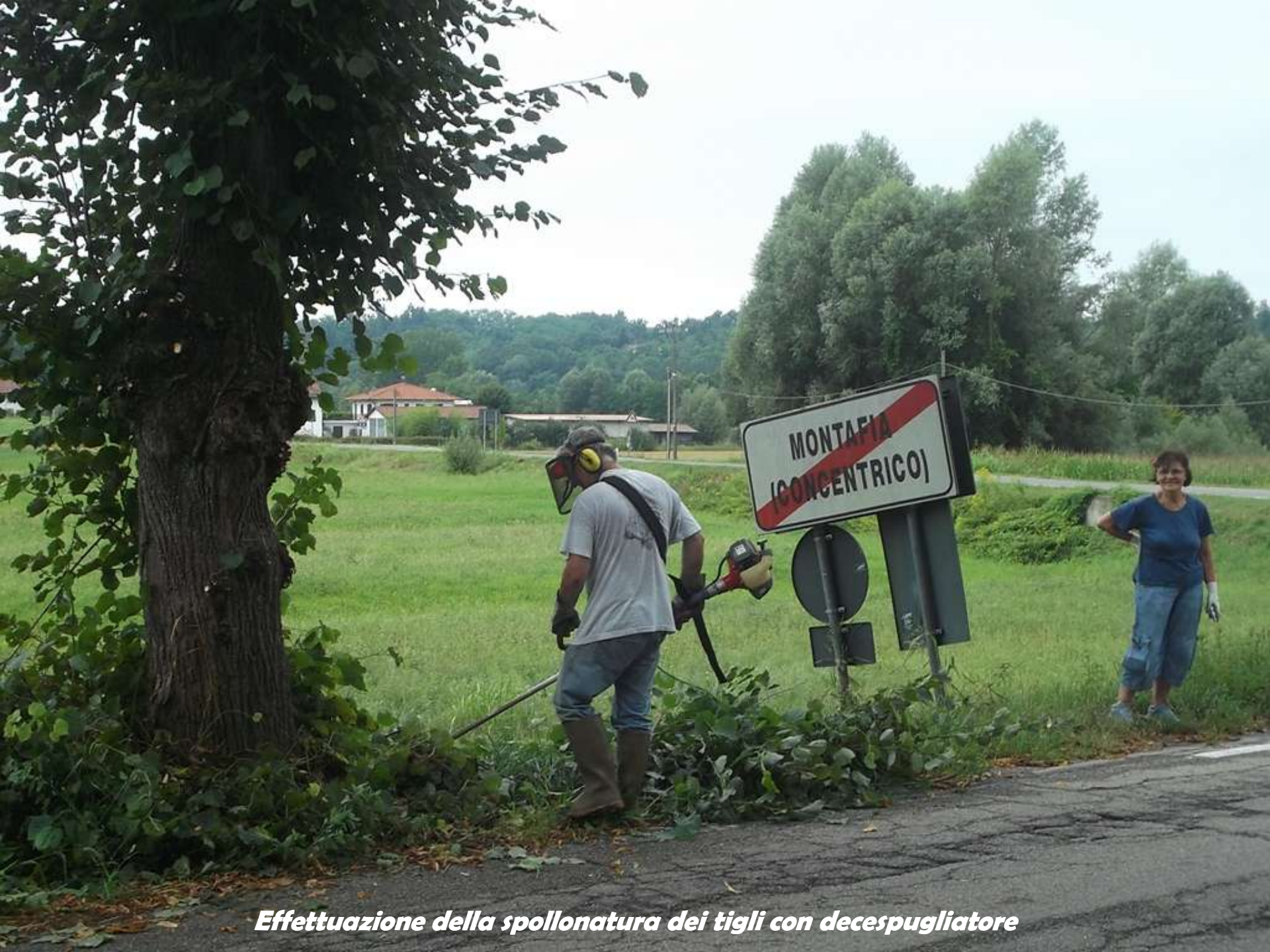
Effettuazione della spollonatura dei tigli con decespugliatore