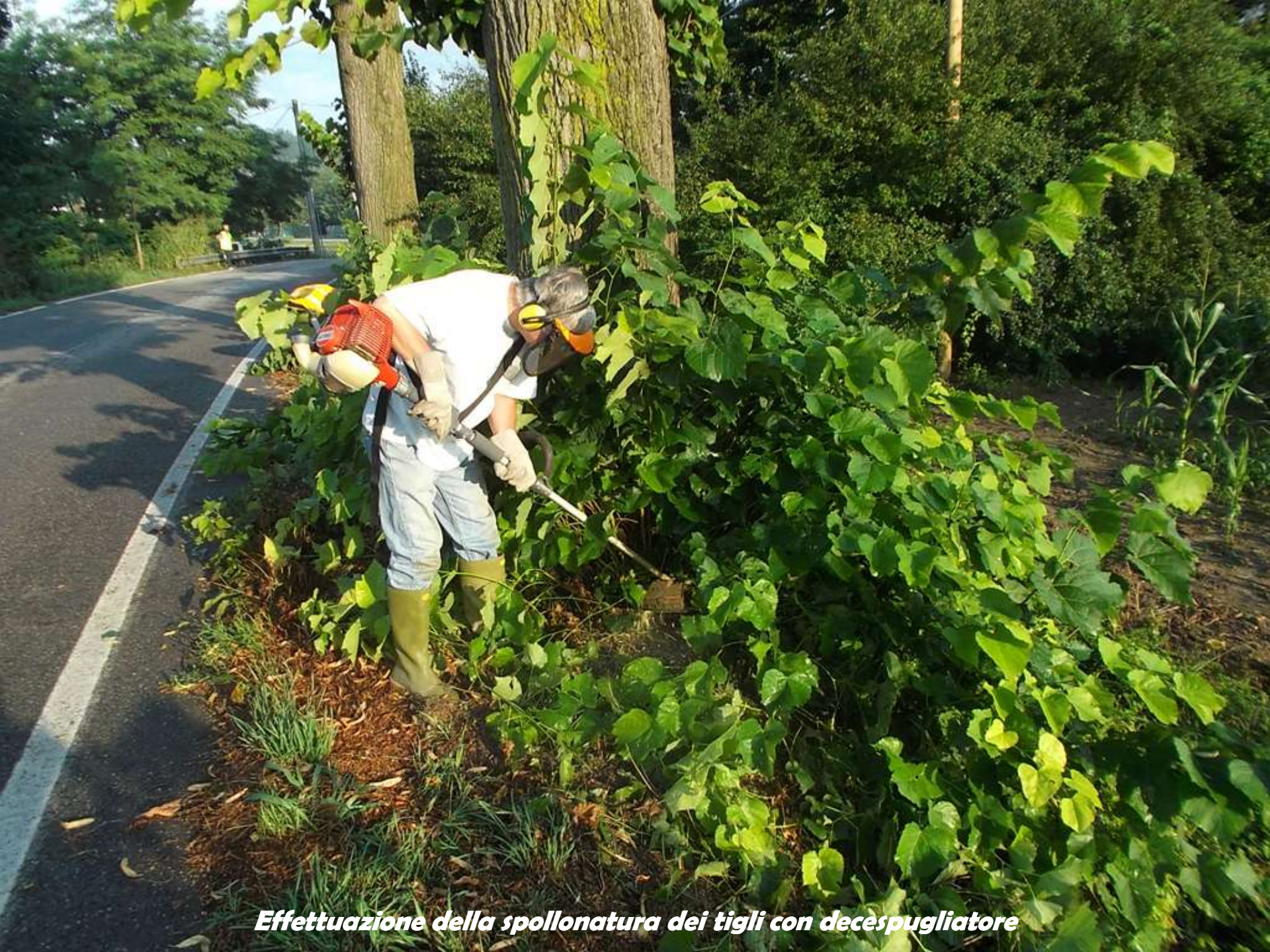
Effettuazione della spollonatura dei tigli con decespugliatore