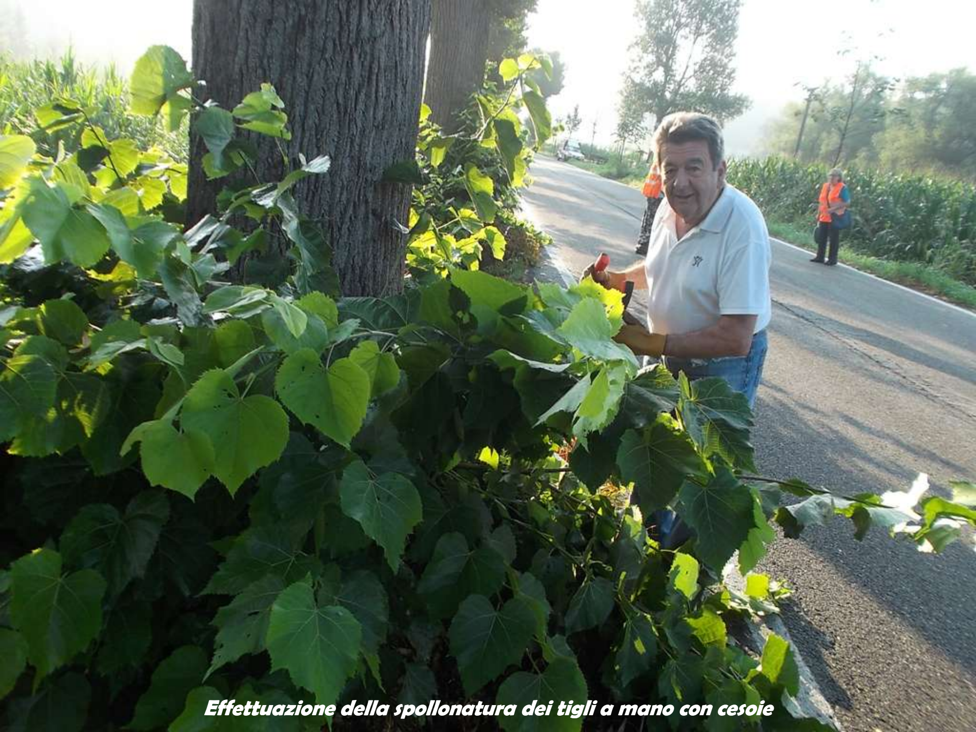
Effettuazione della spollonatura dei tigli a mano con cesoie