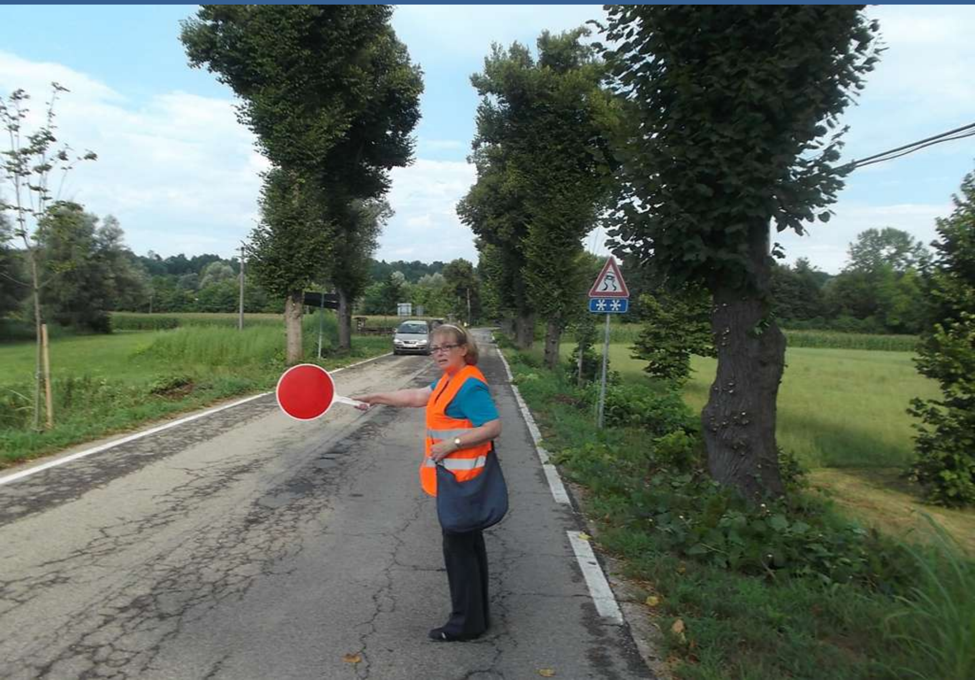
Regolazione del traffico alternato per la gestione in sicurezza del Cantiere stradale di spollonatura