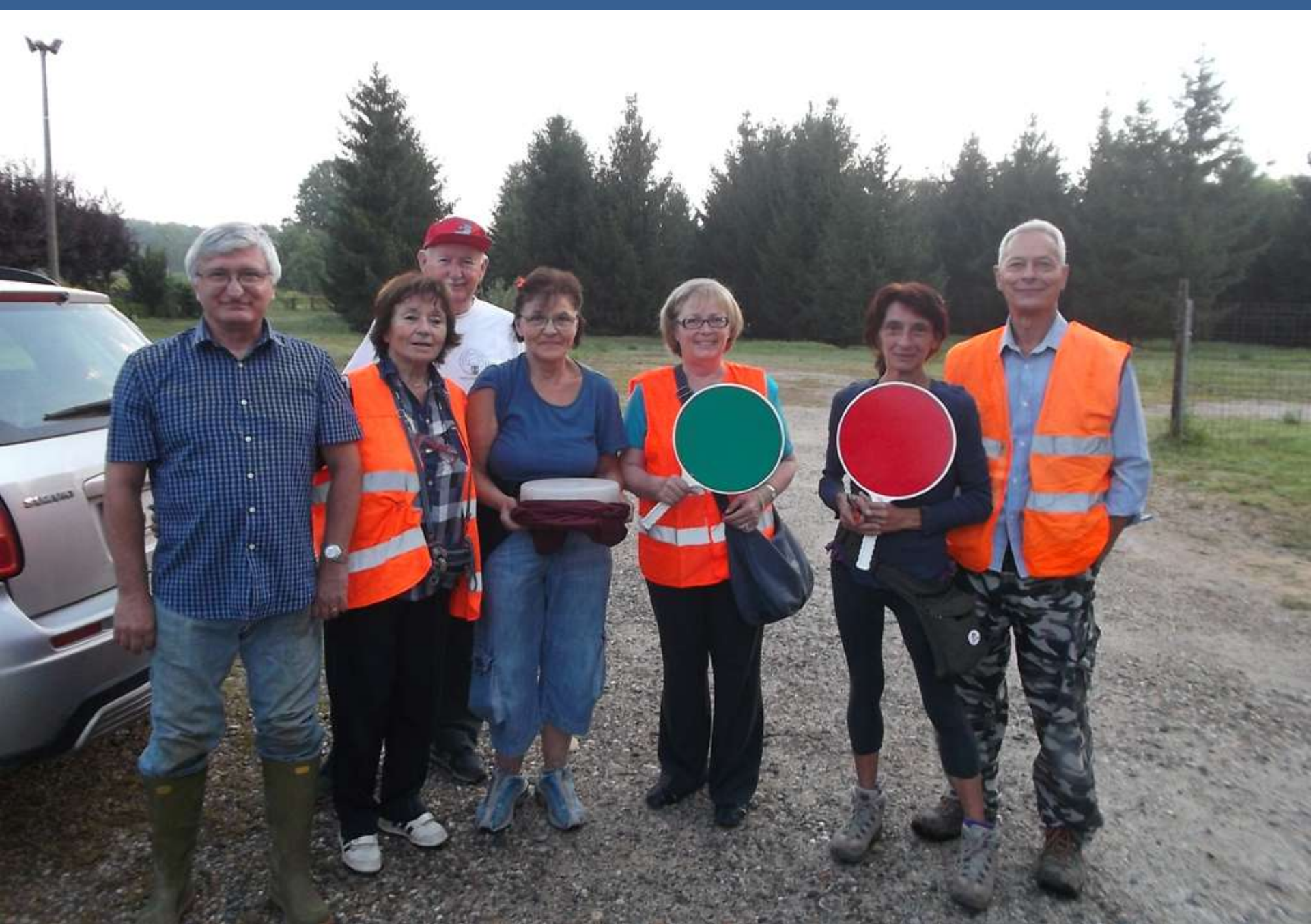
Momento di incontro per l'avvio delle operazioni di spollonatura del Viale storico di Montafia