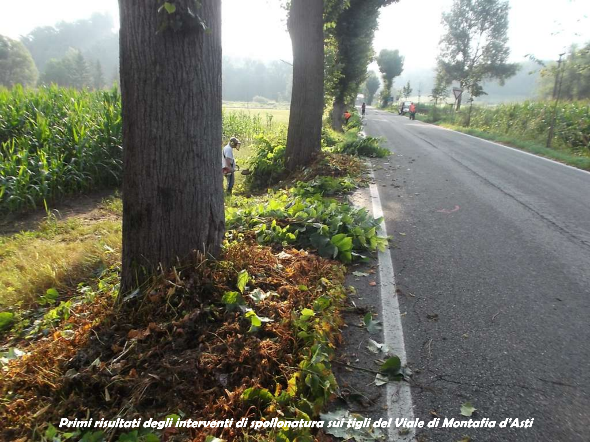
Primi risultati degli interventi di spollonatura sui tigli del Viale di Montafia d'Asti