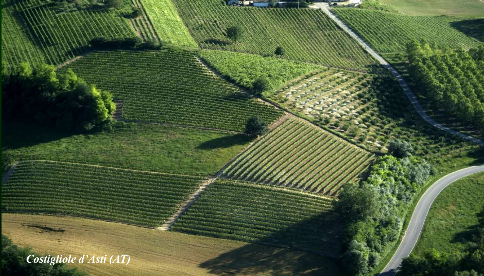
Costigliole d'Asti (AT)