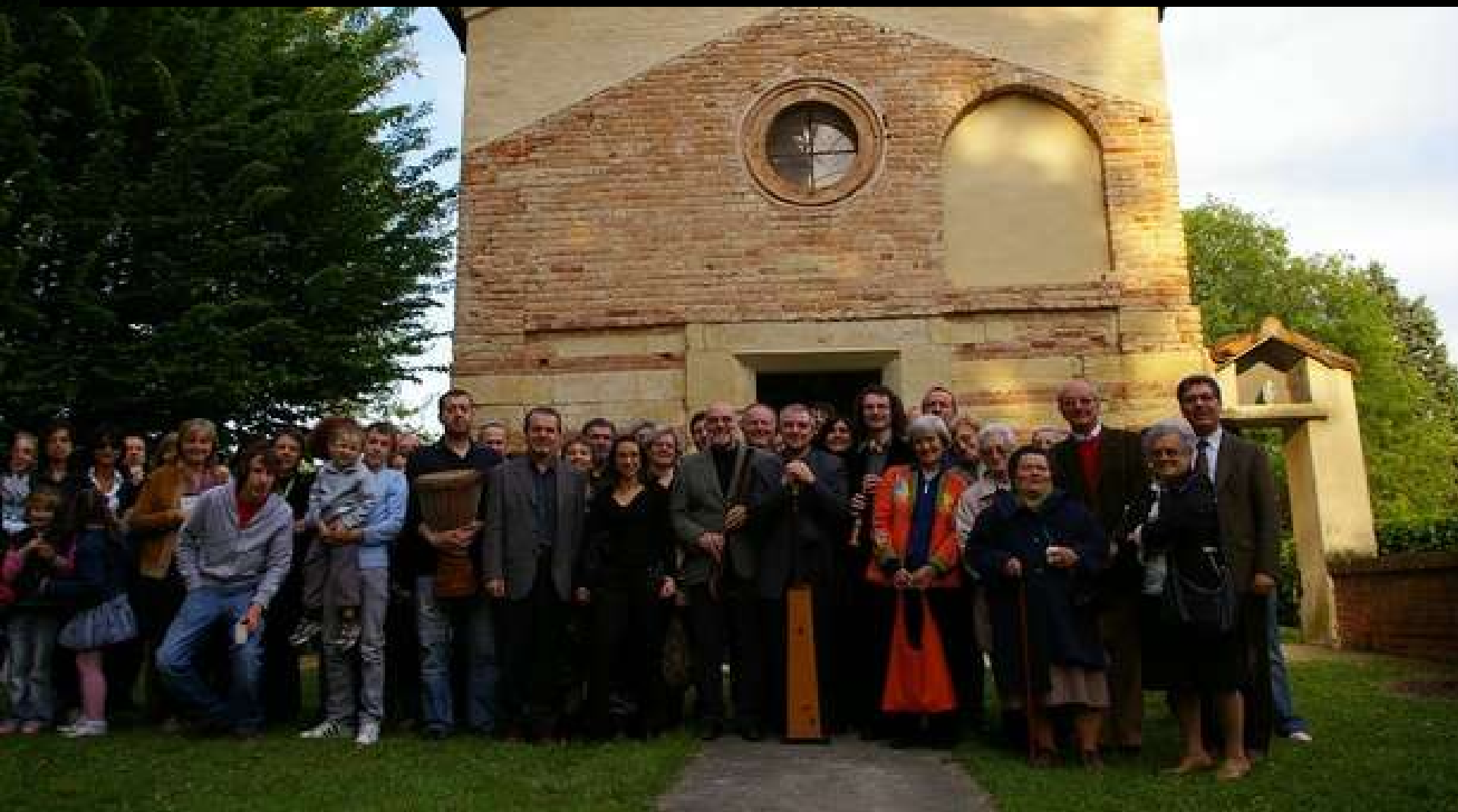
Foto del Concerto "Musica Sacra e Profana dei Secoli XII e XIII in Santa Maria de Viallo" Canti e Laudi del Medioevo

Chiesa di Santa Maria della Neve - Sabato 25 aprile 2009