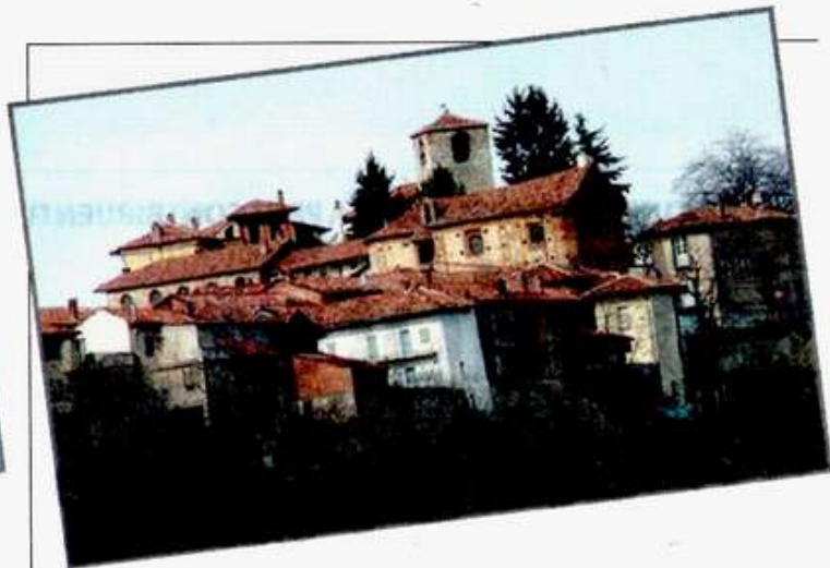
Schierano di Passerano