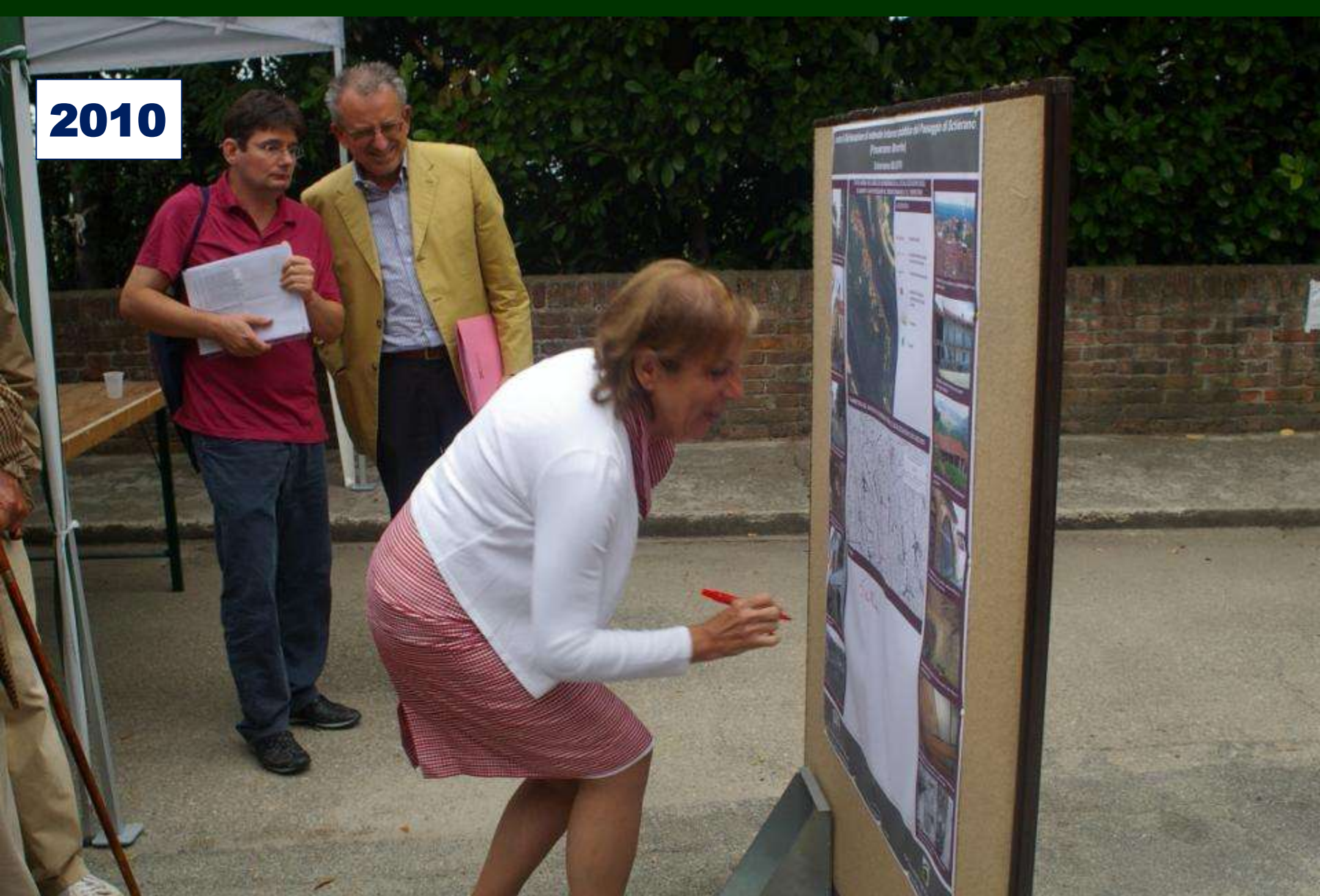
SOTTOSCRIZIONE pubblica della richiesta di Dichiarazione di notevole Interesse pubblico del paesaggio di Schierano (Passerano Marmorito Lunedì 6 settembre 2010)