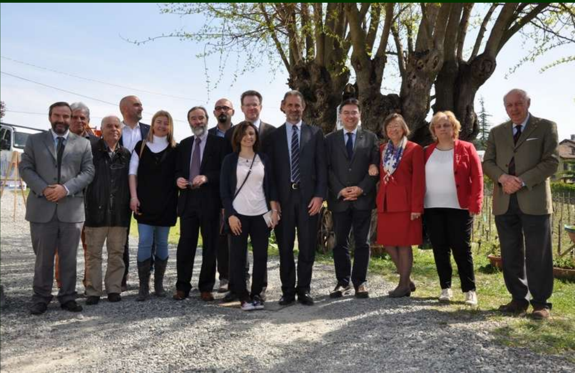
Foto ricordo in occasione della "FESTA della DEMOLIZIONE" del Capannone (Nizza Monferrato, martedì 14 aprile 2015)