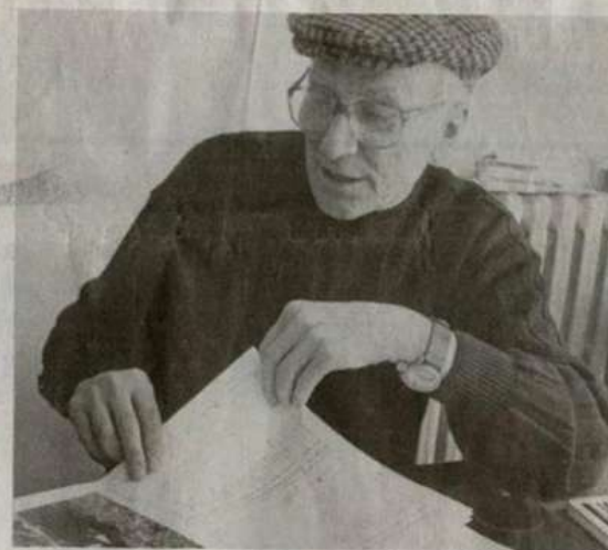
Bartolo Mascarello, figura storica del Barolo