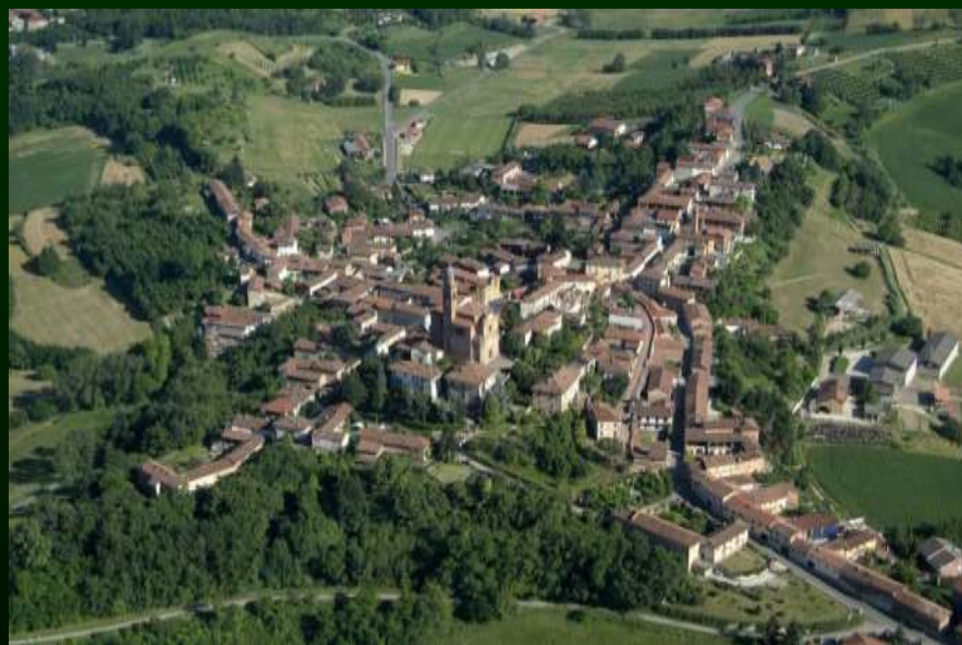
Villa San Secondo (AT)