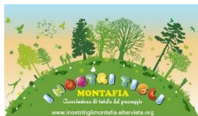
Associazione "I nostri tigli"