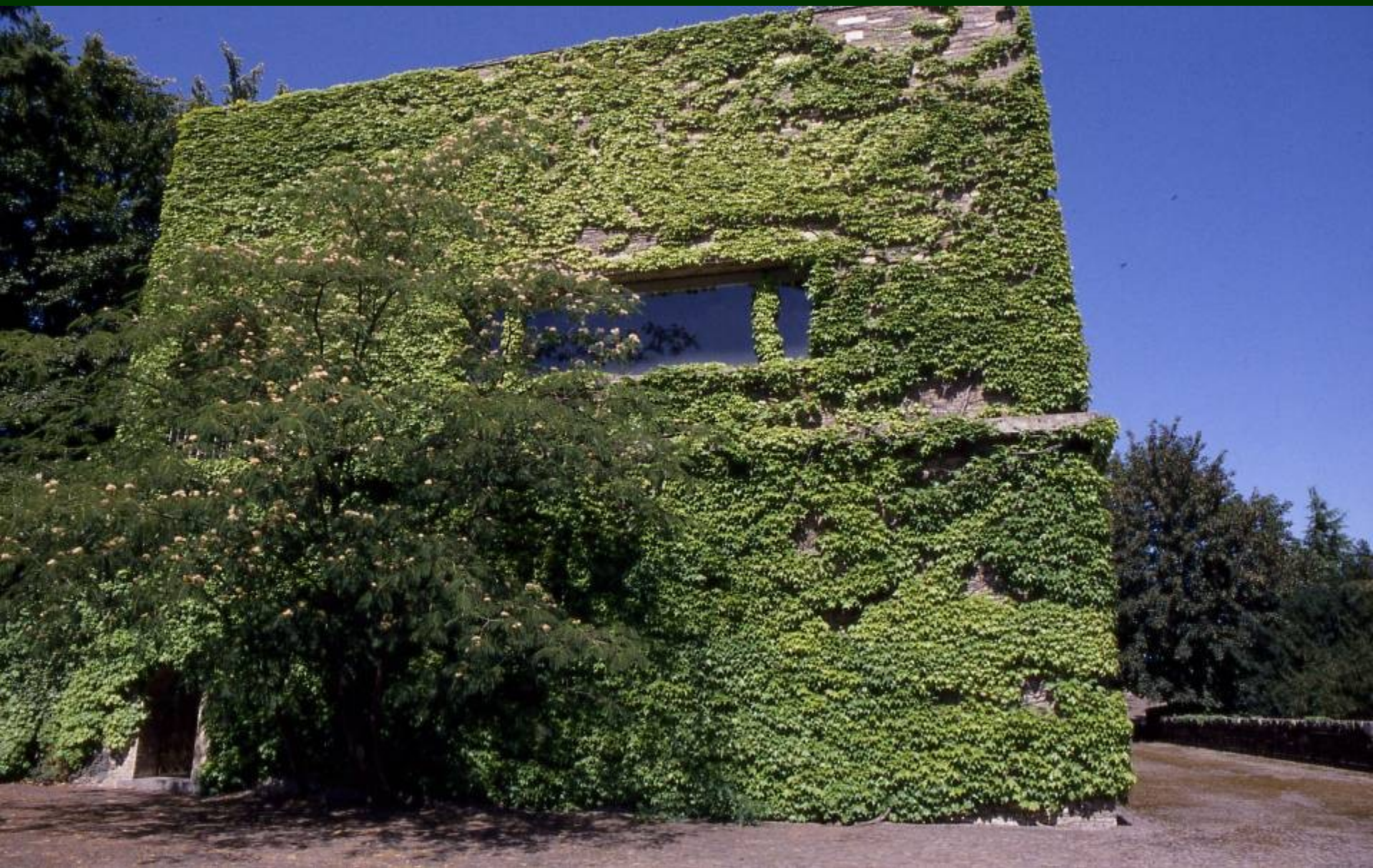
Parete verde realizzata su progetto dal paesaggista Pietro Porcinai per la cantina della Tenuta Monterosso ad Acqui Terme (AI)