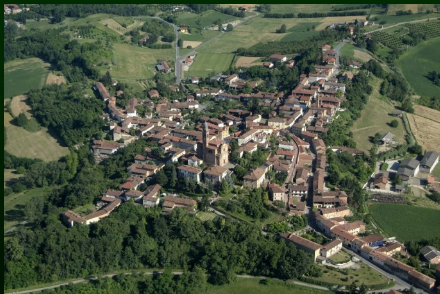
Villa San Secondo (AT)