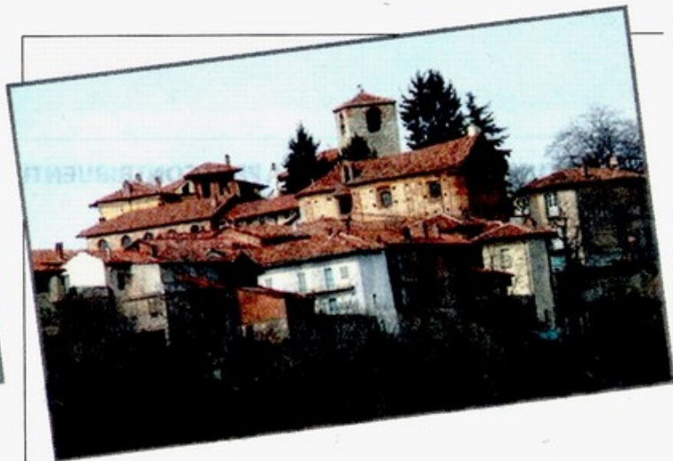
Schierano di Passerano