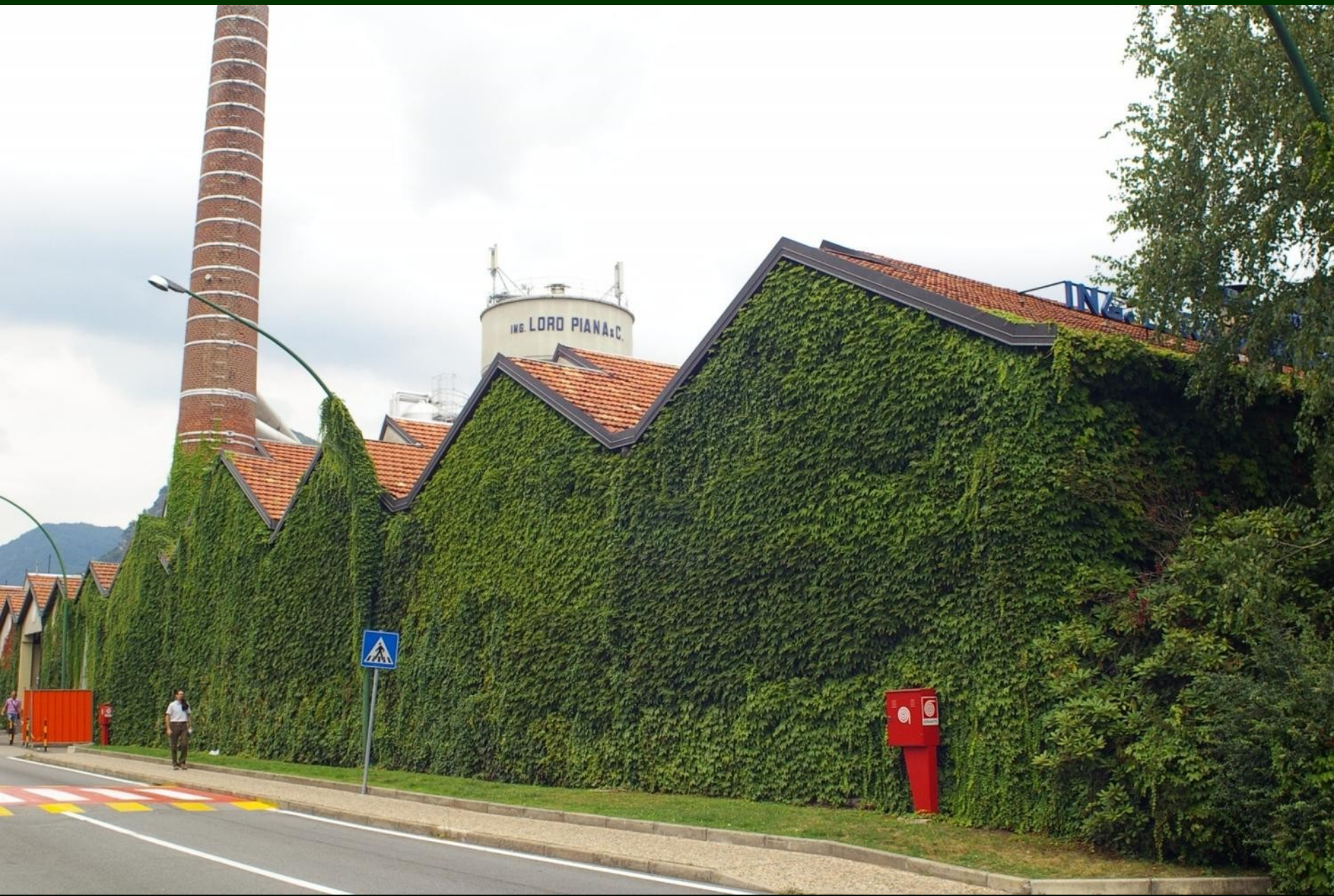
Capannone rinverdito con l'impiego della specie Parthenocissus tricuspidata