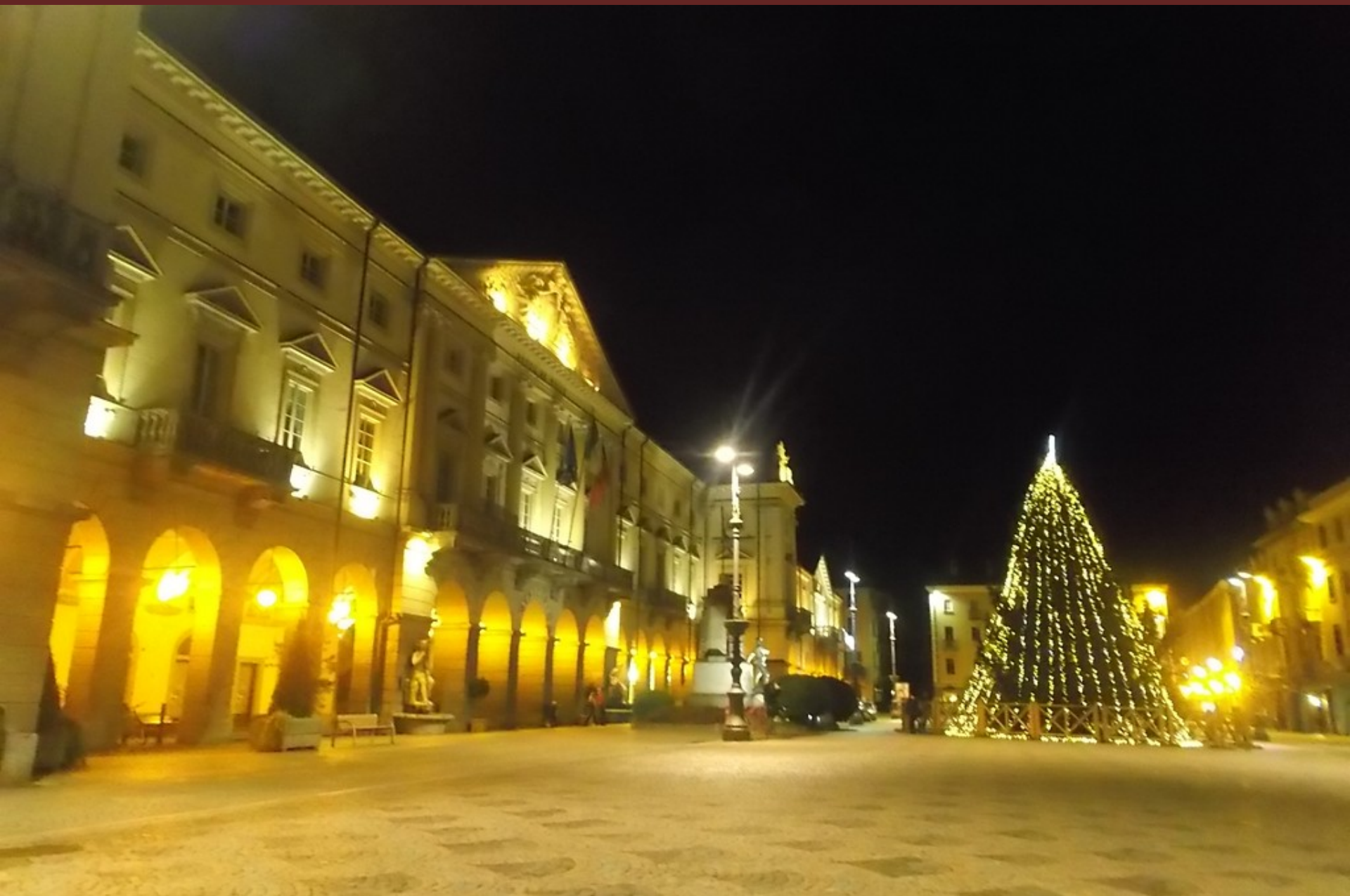
Hotel des Etats , sede del Convegno, nella bellissima Piazza Émile Chanoux nel centro di Aosta