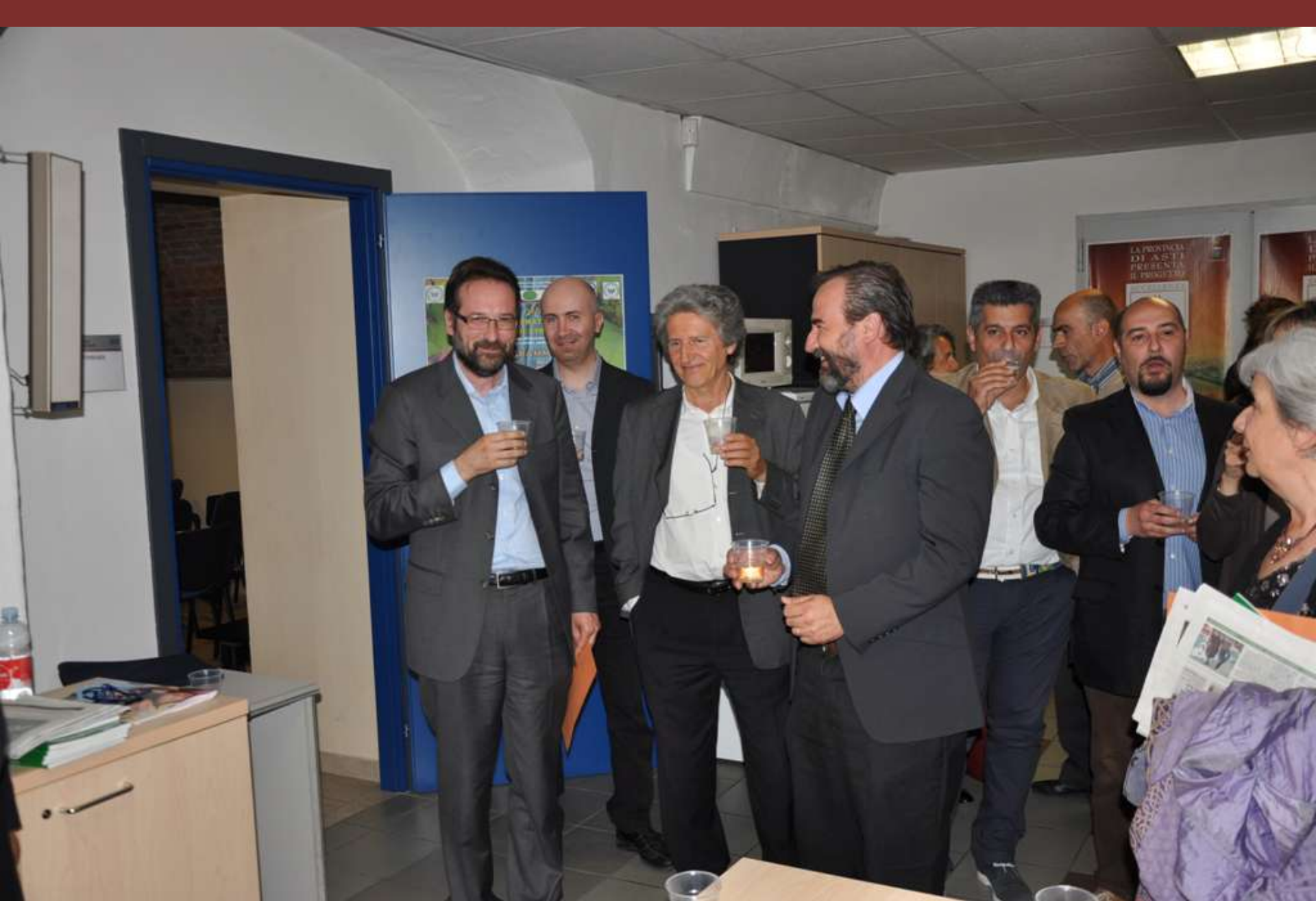
Brindisi conclusivo al termine della Tavola rotonda su “Flavescenza dorata della vite: 15 anni di strategie”