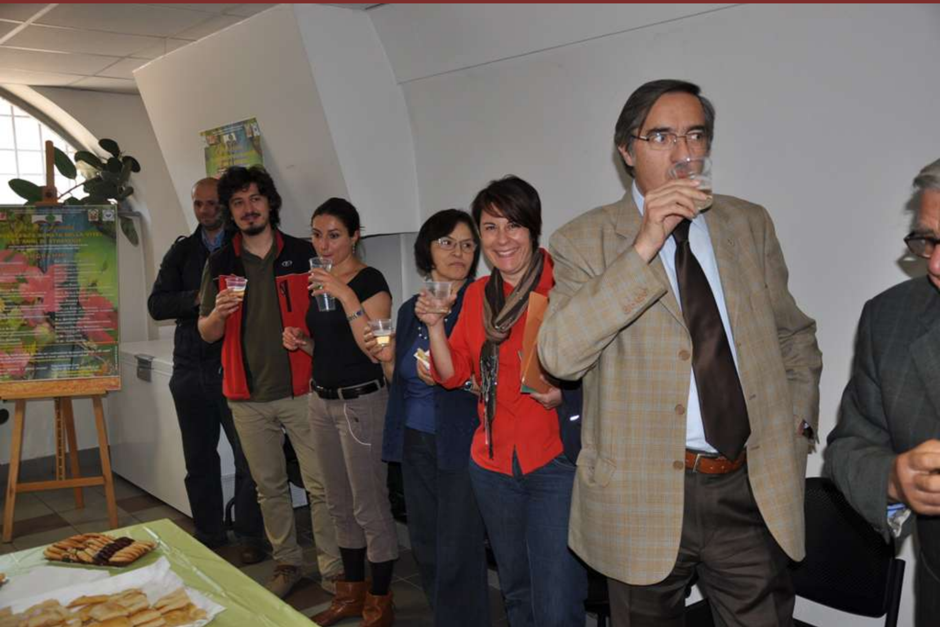
Brindisi conclusivo al termine della Tavola rotonda su “Flavescenza dorata della vite: 15 anni di strategie”