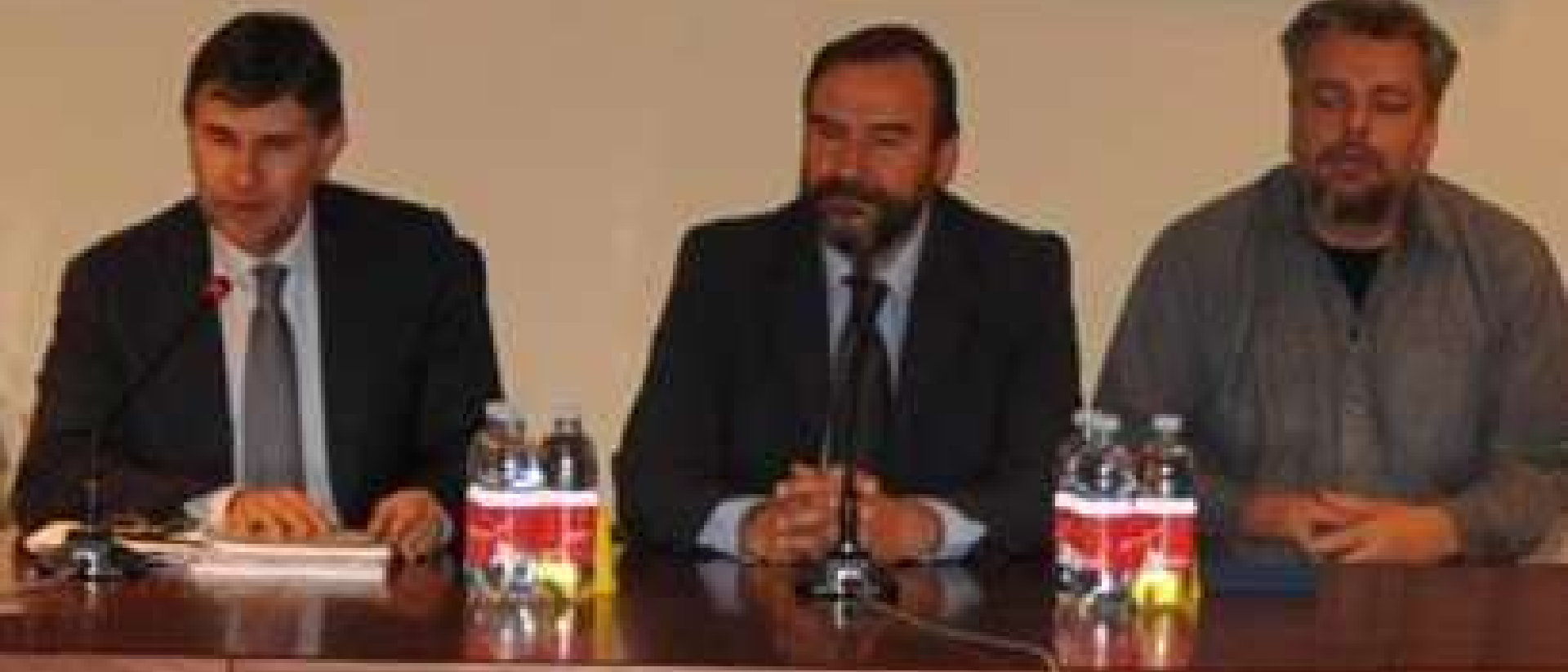
Saluto iniziale da parte dell'On.le Senatore Andrea Olivero, Vice Ministro all'Agricoltura