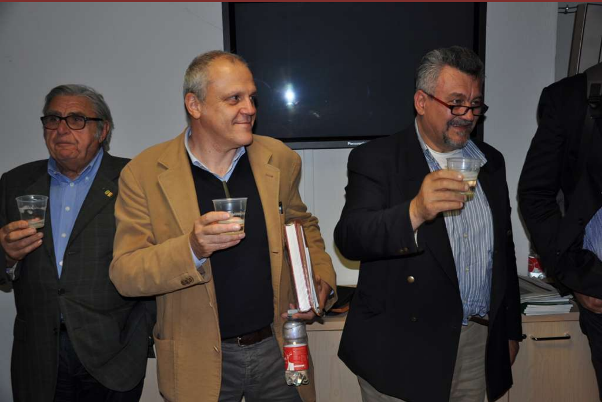
Brindisi conclusivo al termine della Tavola rotonda su “Flavescenza dorata della vite: 15 anni di strategie”