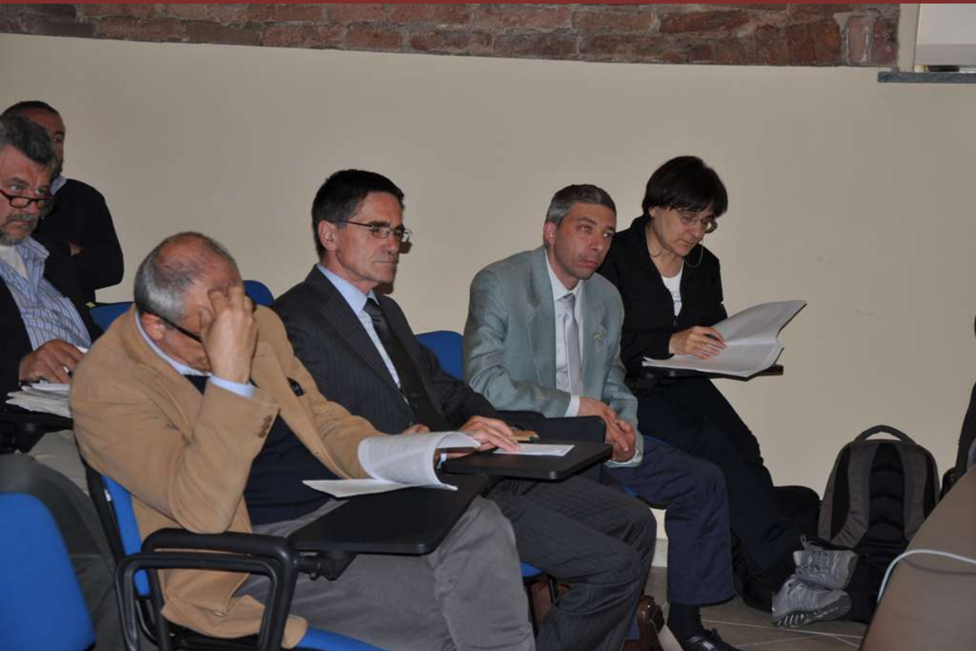
Veduta del folto pubblico presente in sala.