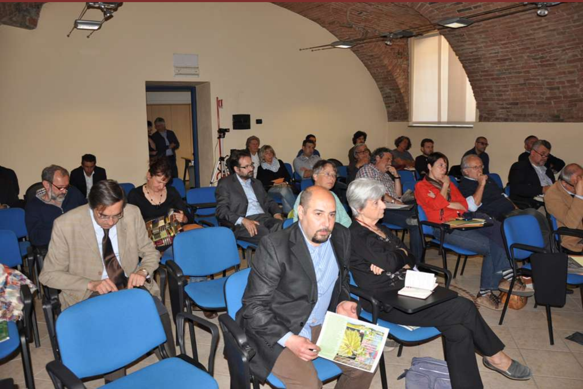
Veduta del folto pubblico presente in sala.