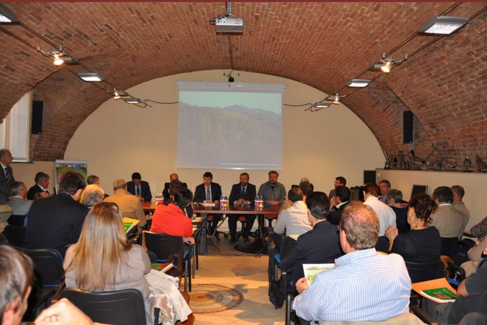
Saluto iniziale da parte dell'On.le Senatore Andrea Olivero, Vice Ministro all'Agricoltura