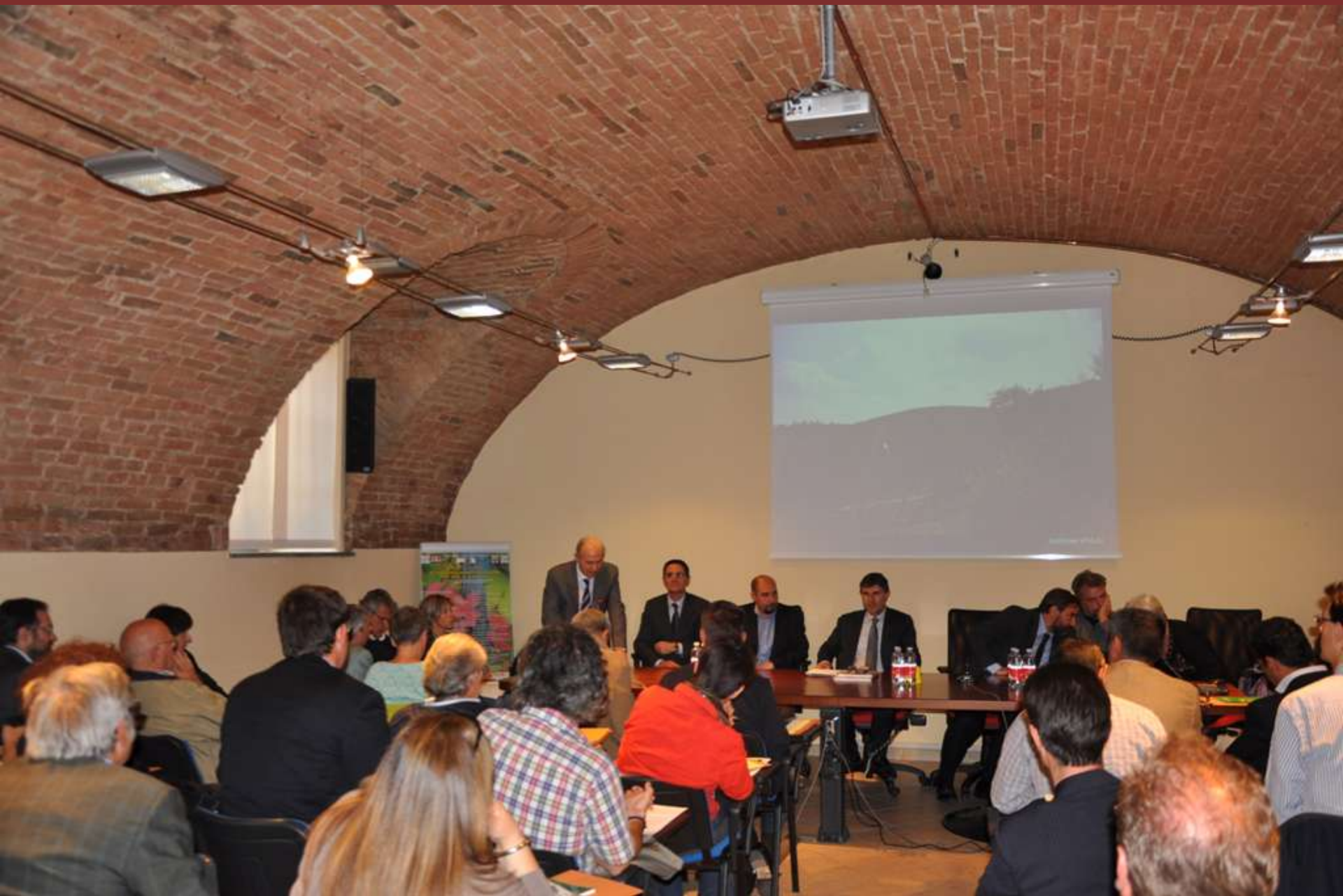
Saluto iniziale da parte del Dott. Gualtiero Freiburger della Regione Piemonte