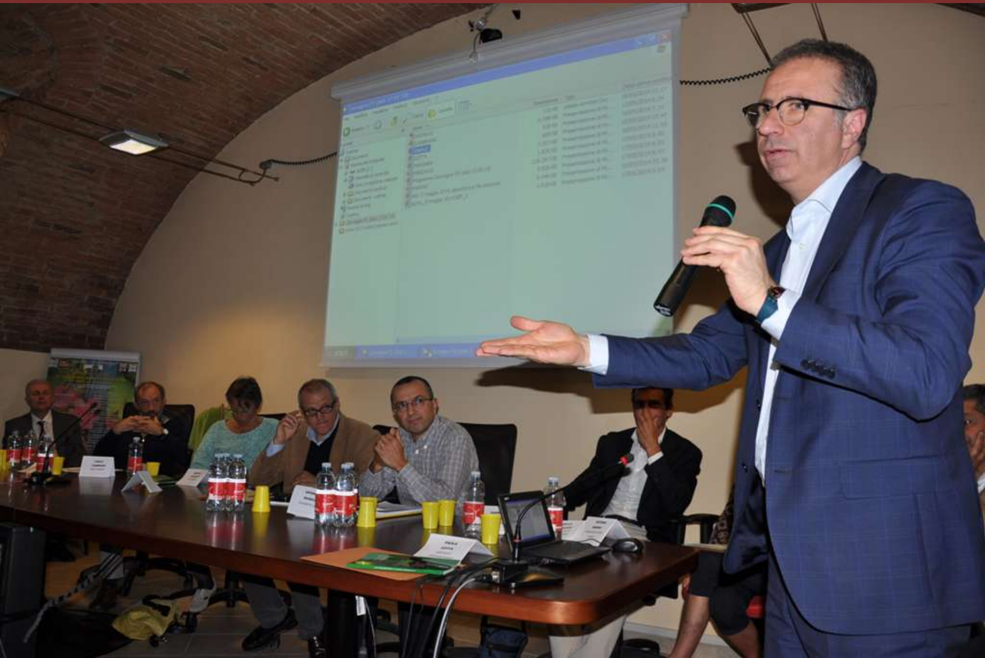
Riflessione da parte dell'On.le Massimo Fiorio della Commissione Agricoltura della Camera dei Deputati