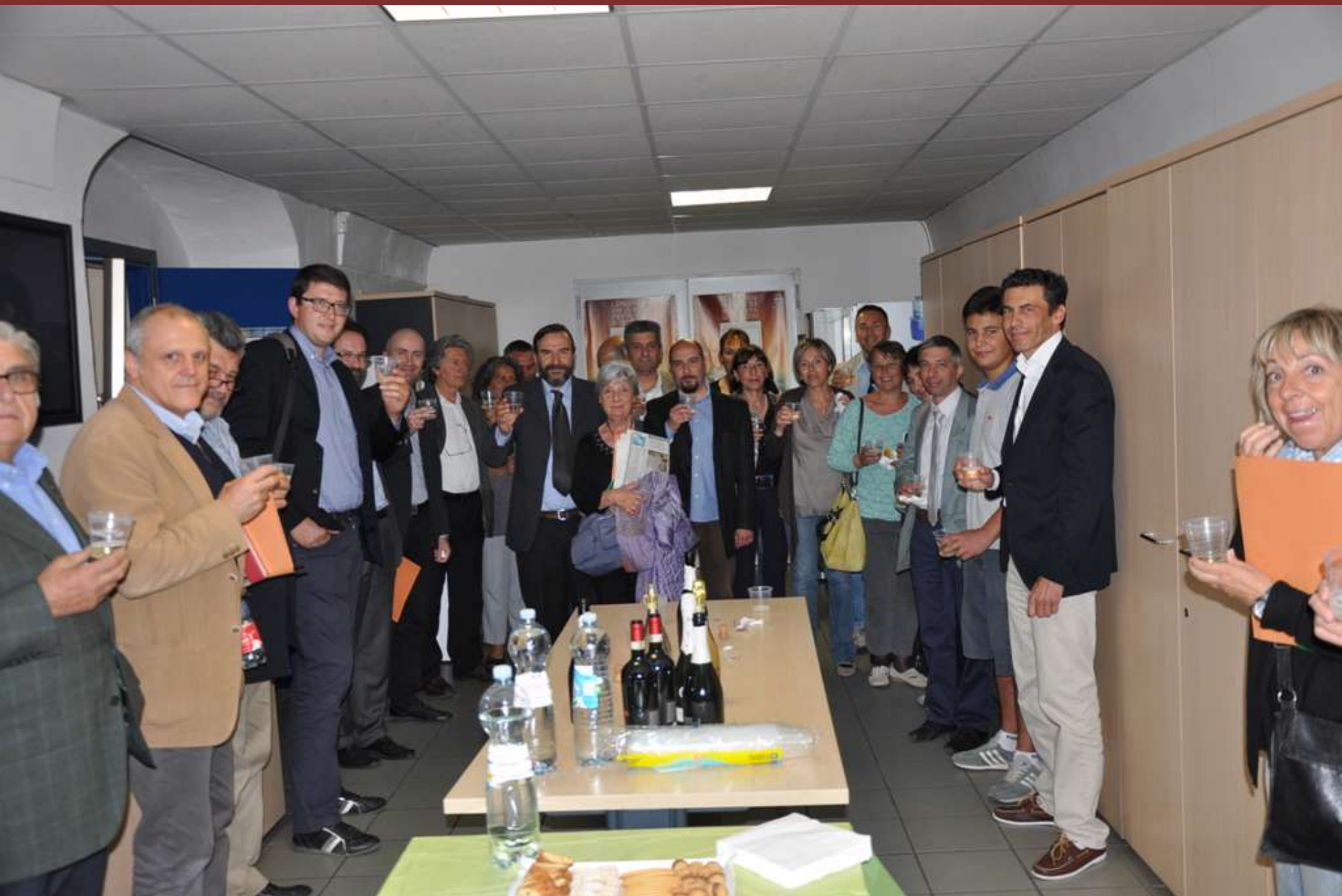
Brindisi conclusivo al termine della Tavola rotonda su “Flavescenza dorata della vite: 15 anni di strategie”