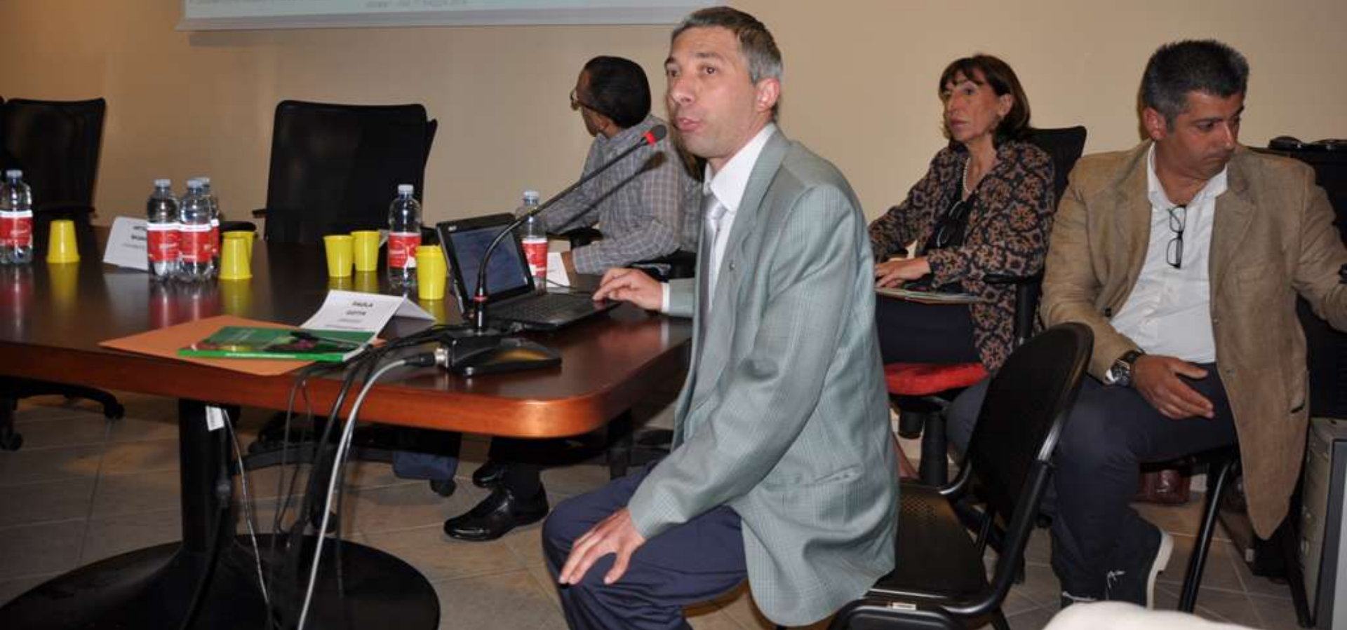
Contributo di approfondimento da parte del DOTT. PAOLO CAMERANO (Unità Paesaggio Foreste e Biodiversità – IPLA)