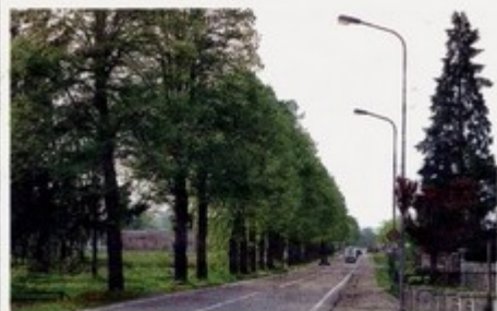
Oggi a Castelnuovo Don Bosco si discuterà di alberi e strade