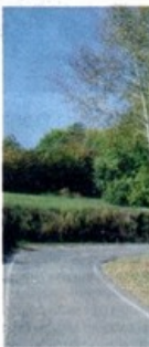
SONO A RISCHIO ABBATI