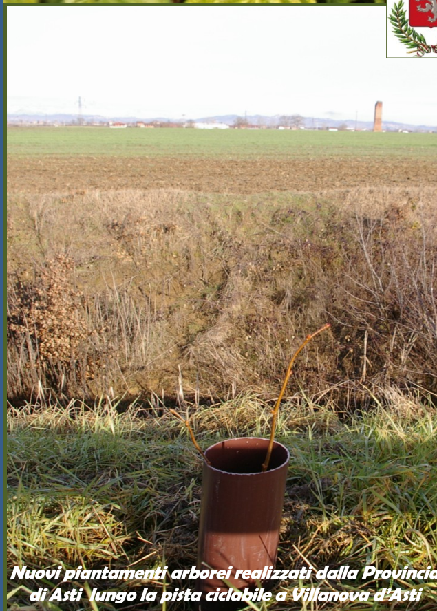
Nuovi piantamenti arborei realizzati dalla Provincia di Asti lungo la pista ciclabile a Villanova d'Asti