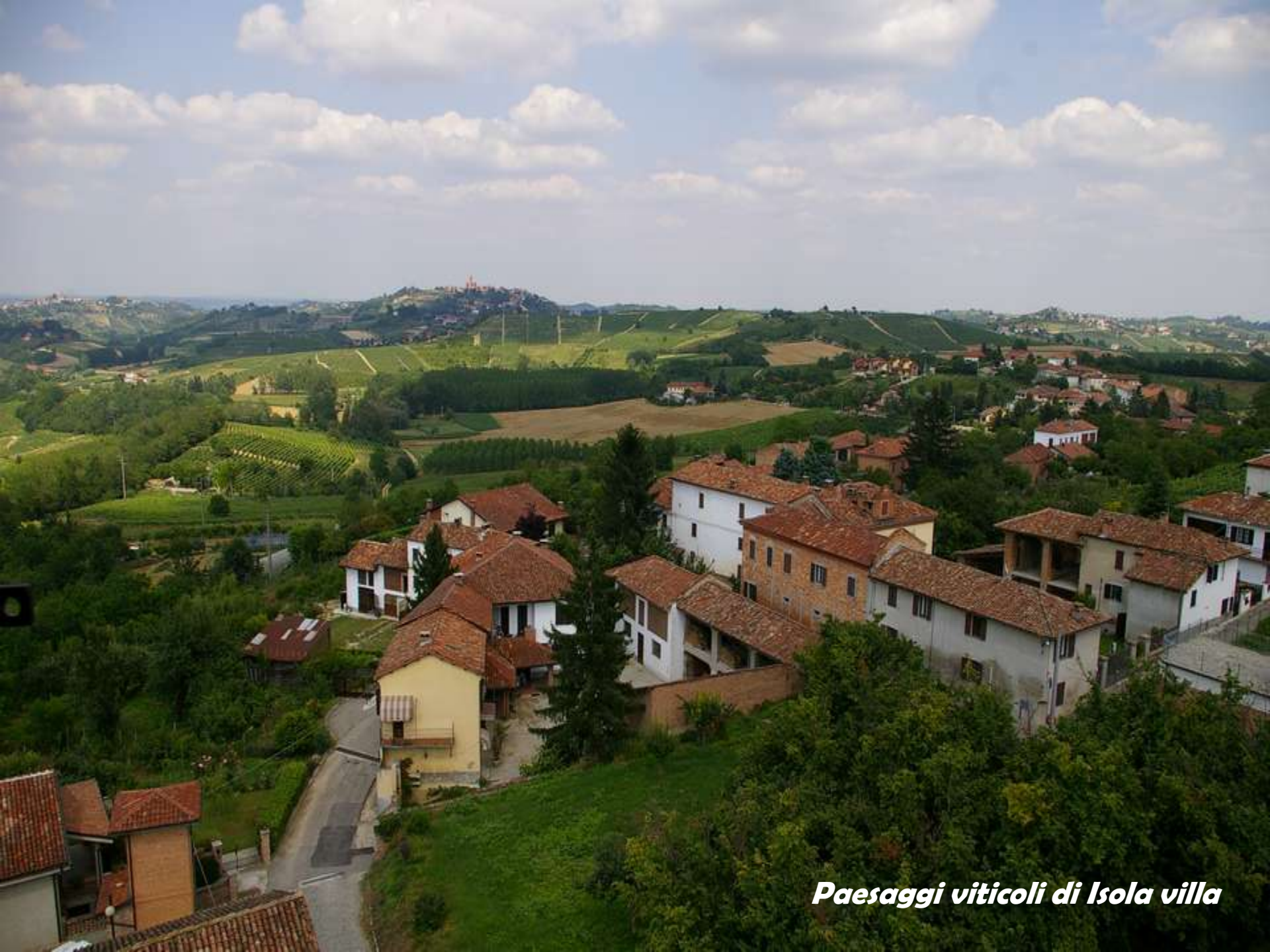
Paesaggi viticoli di Isola villa