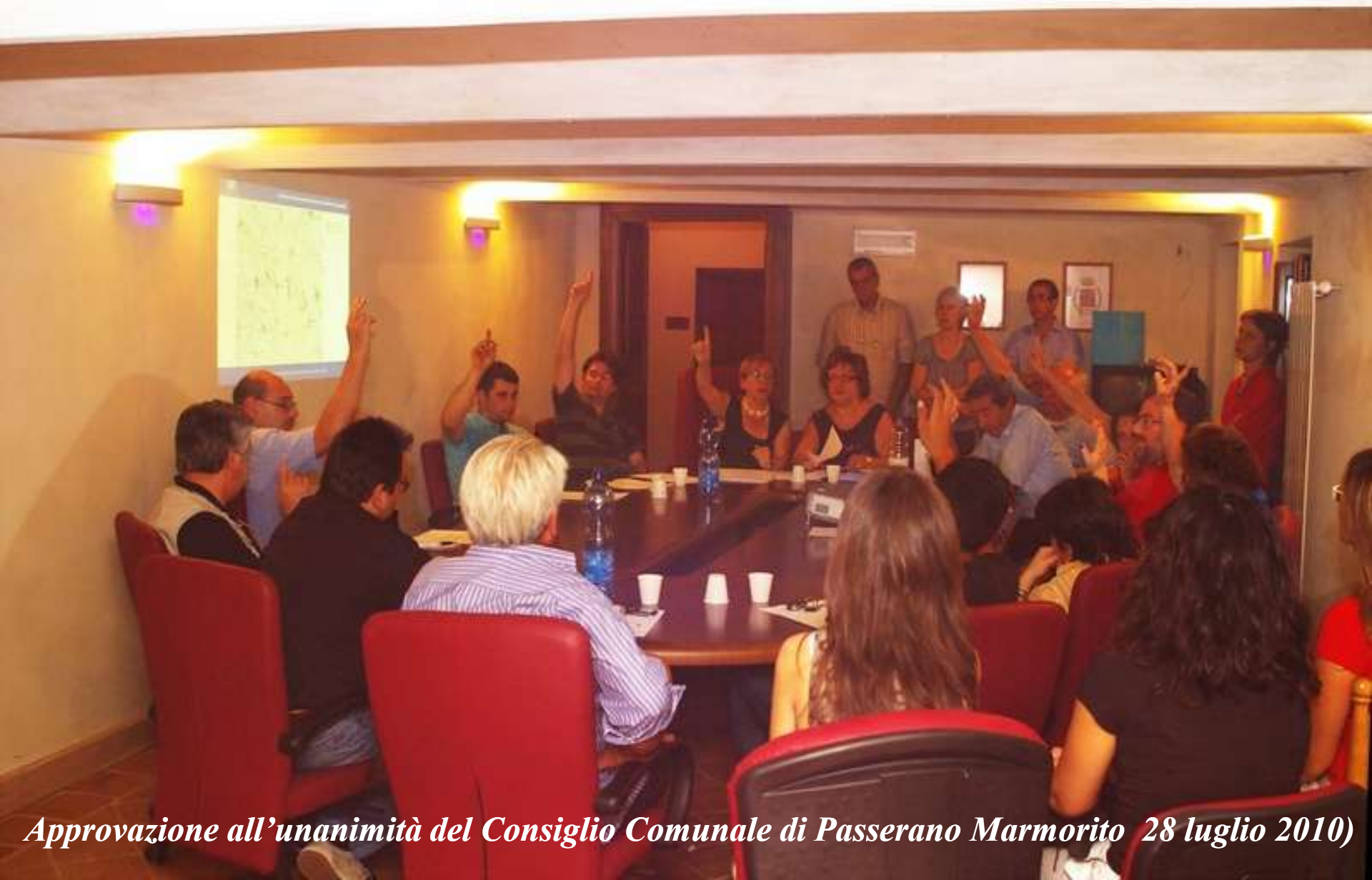
Approvazione all'unanimità del Consiglio Comunale di Passerano Marmorito (28 luglio 2010)