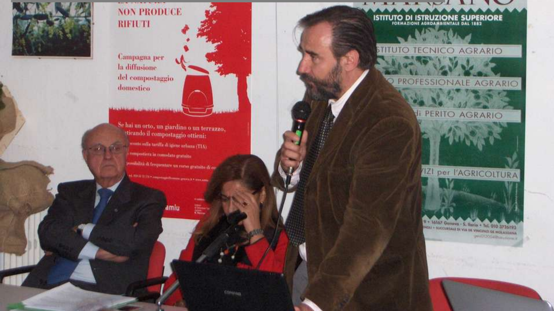
Convegno sul Codice Urbani, con l'ex Ministro Giuliano URBANI a Sant'Ilario (GE) 24 gennaio 2013