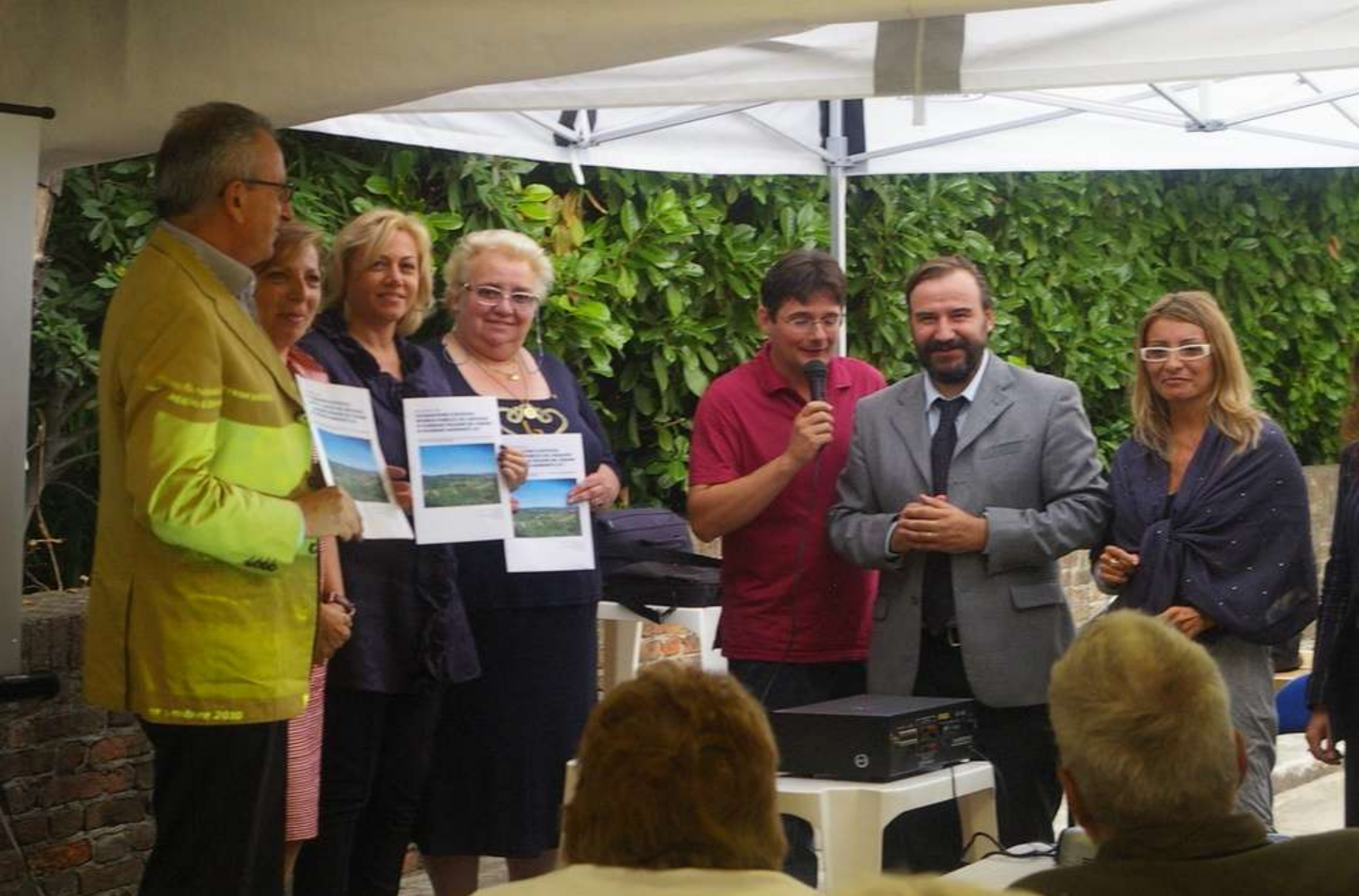
CONSEGNA DICHIARAZIONE DI NOTEVOLE INTERESSE PUBBLICO DEL PAESAGGIO DI SCHIERANO (6 settembre 2010)