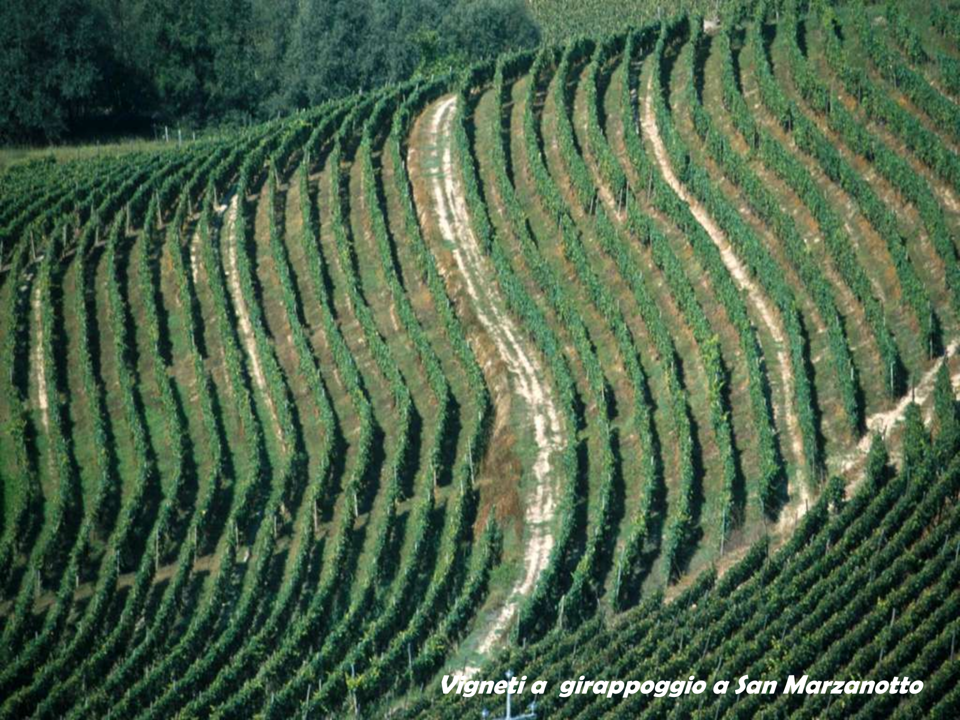
Vigneti a girappoggio a San Marzanotto