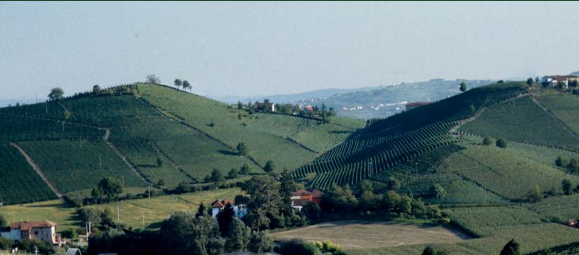
Vallata tra San Marzanotto e Mongardino