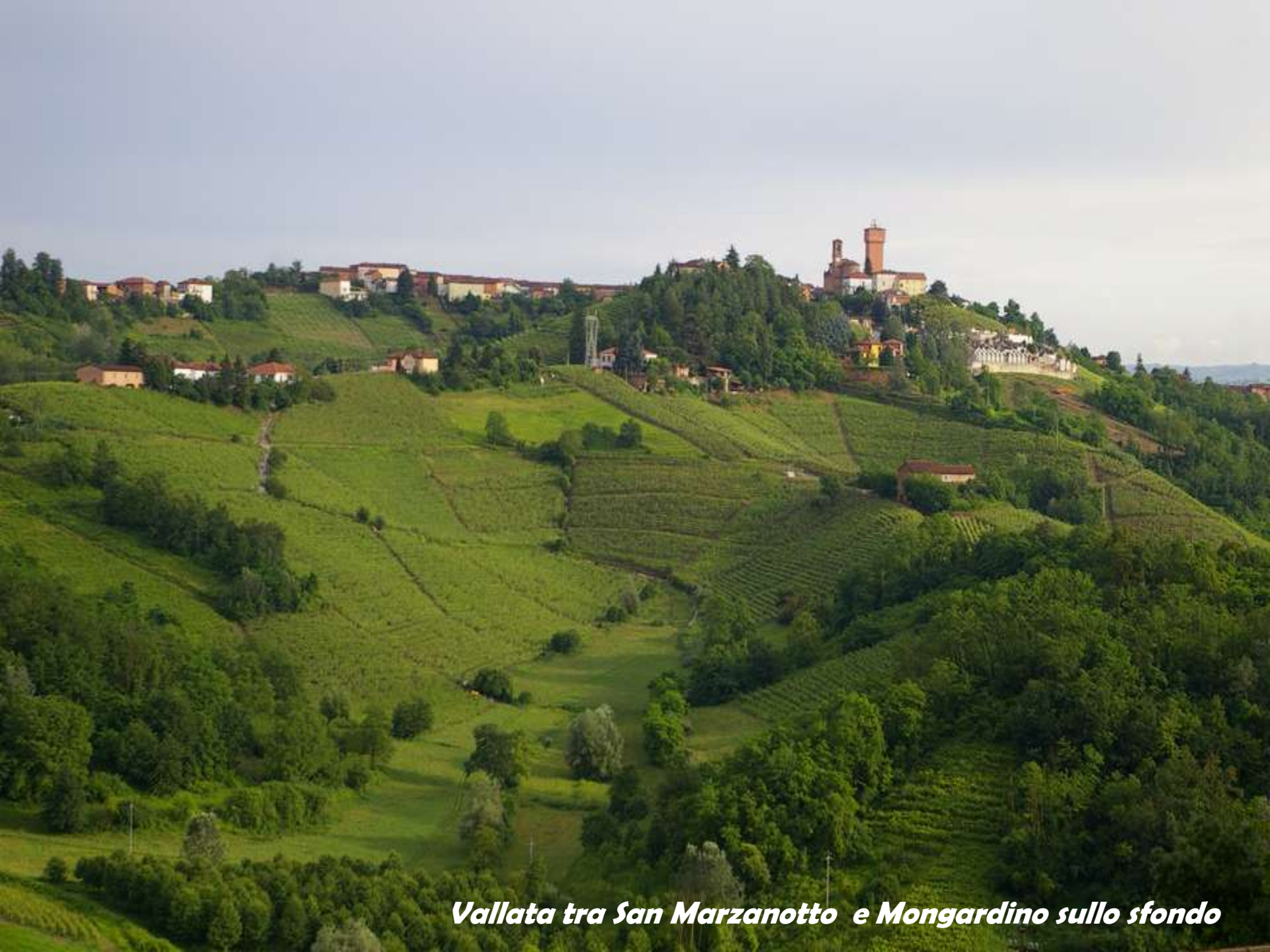
Vallata tra San Marzanotto e Mongardino sullo sfondo