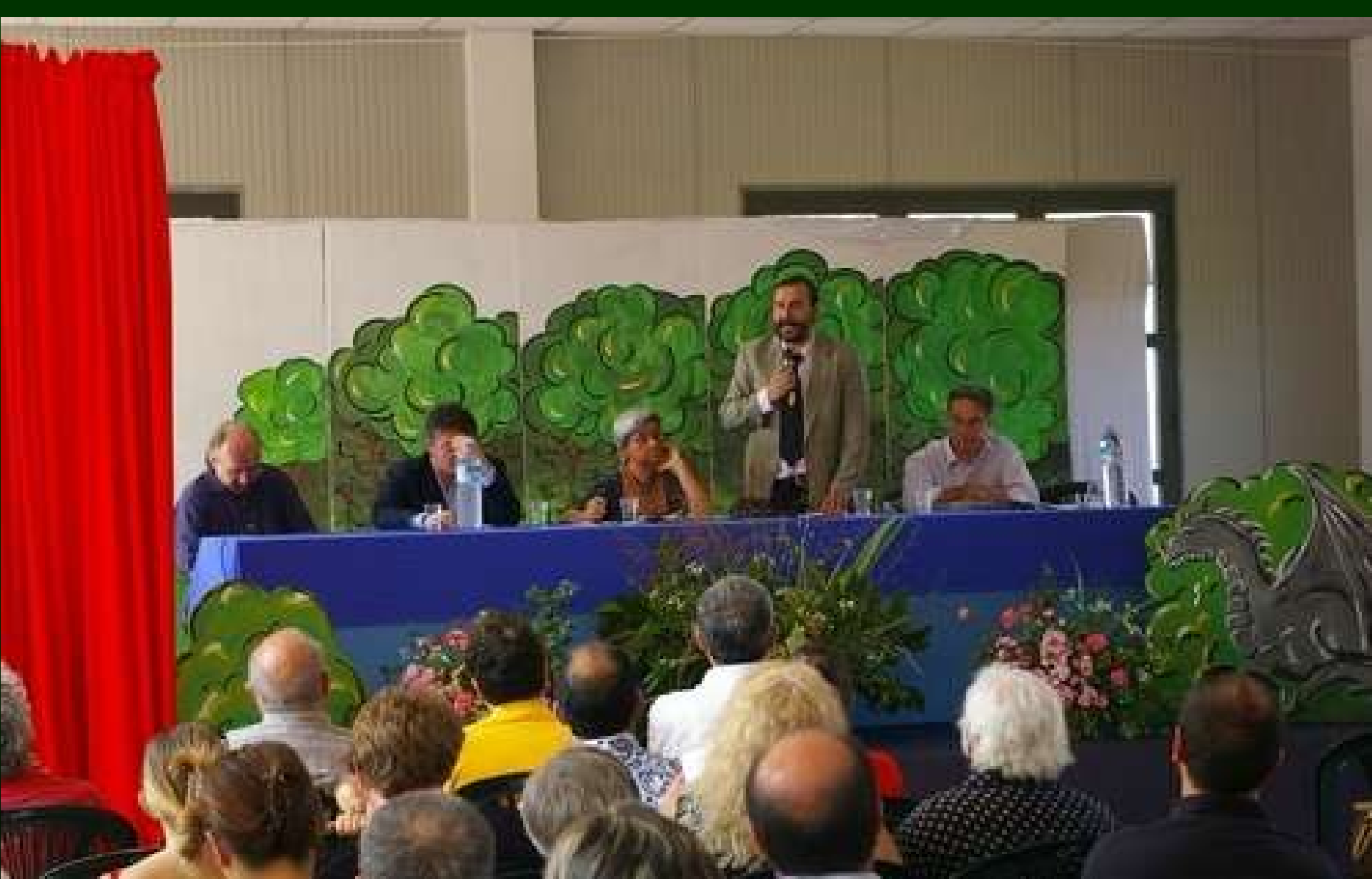
Convegno DICHIARAZIONE PER LA NOTEVOLE INTERESSE PUBBLICO DEL PAESAGGIO DI CORTIGLIONE (Codice Urbani) 1 luglio 2007