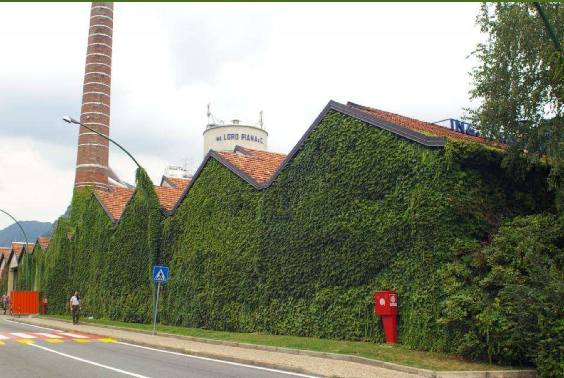
Capannone rinverdito con l'impiego della specie Parthenocissus tricuspidata