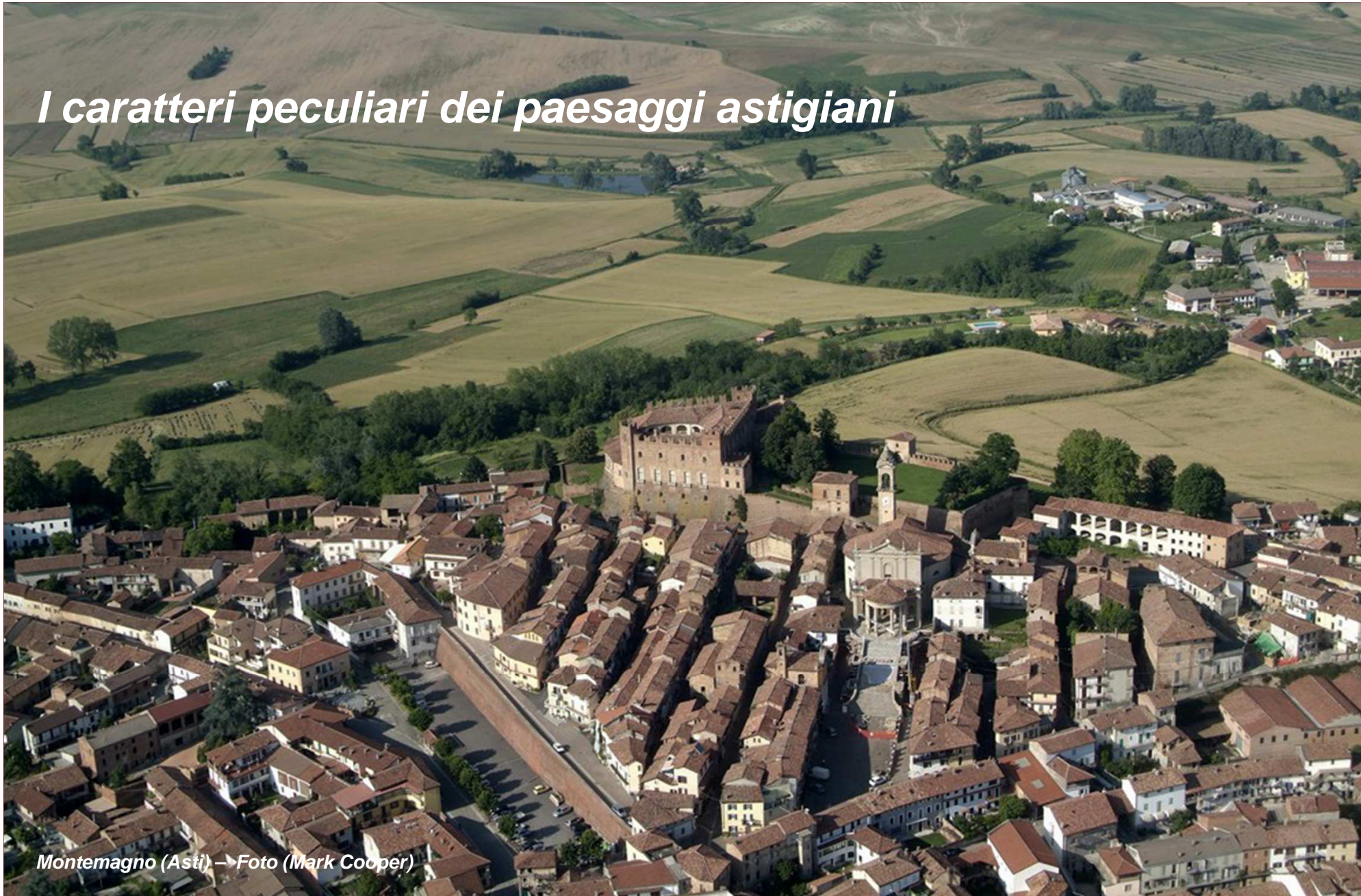
Montemagno (Asti) → Foto (Mark Cooper)