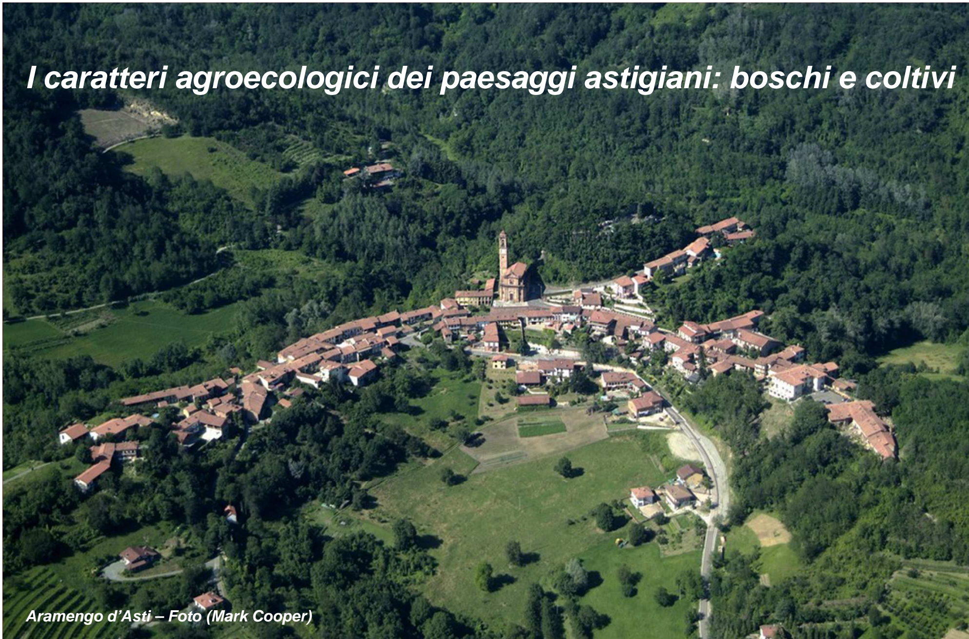
Aramengo d'Asti