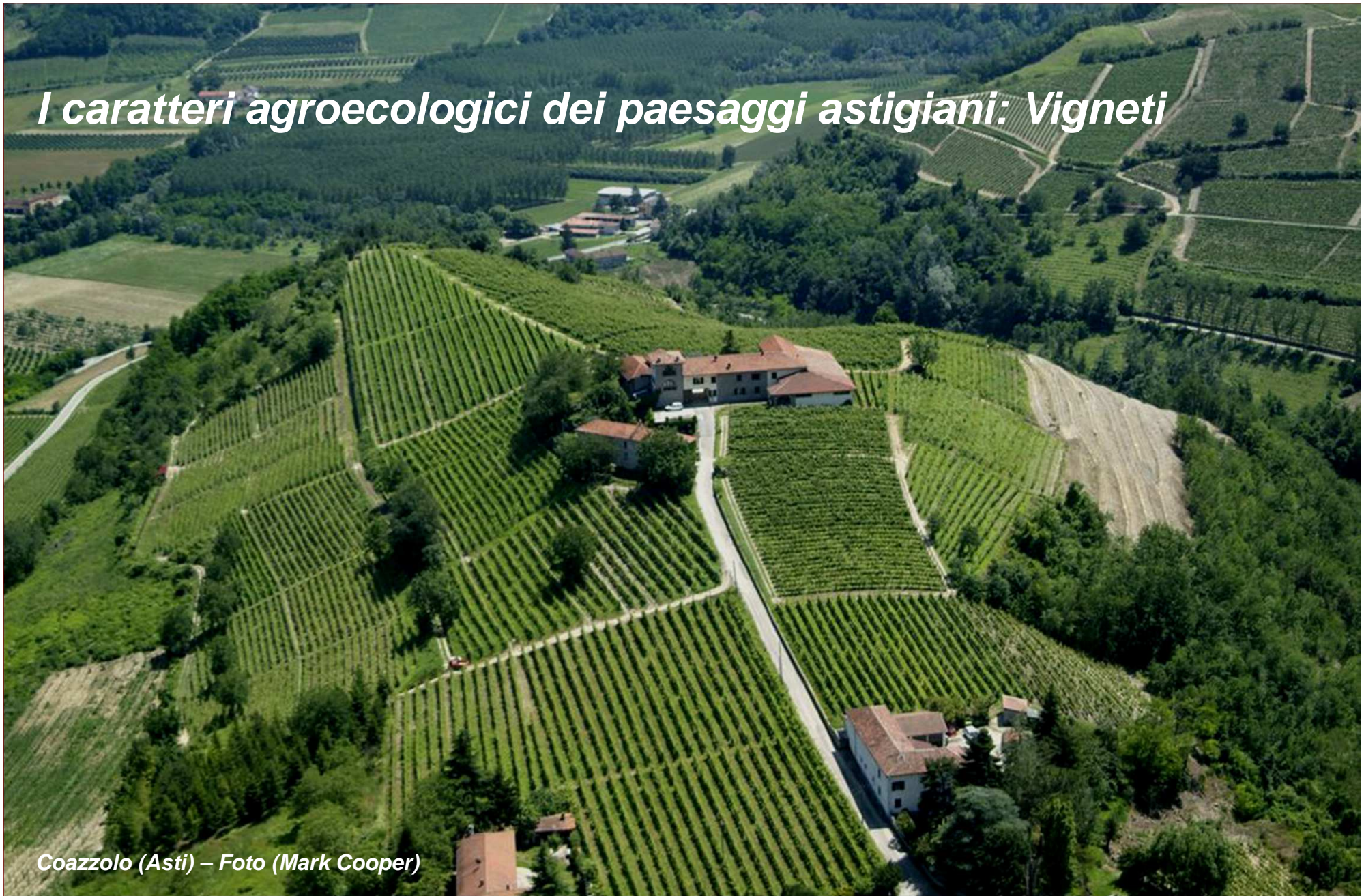
Coazzolo (Asti)