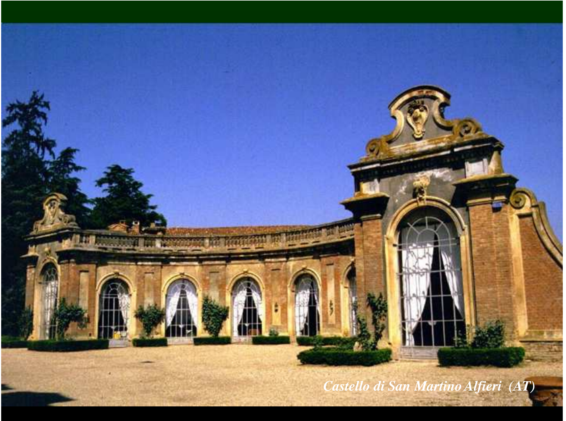
Castello di San Martino Alfieri (AT)