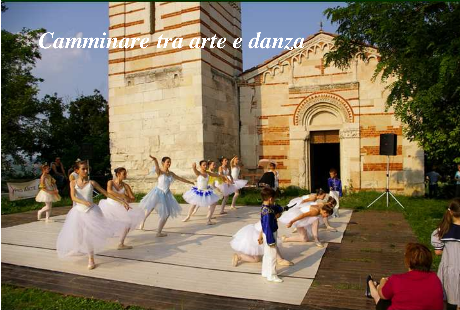
Chiesa romanica dei Santi Nazario e Celso – Montechiaro d'Asti – giugno 2008