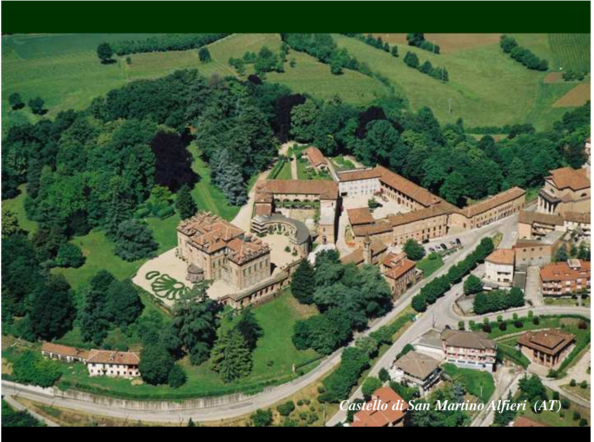
Castello di San Martino Alfieri (AT)