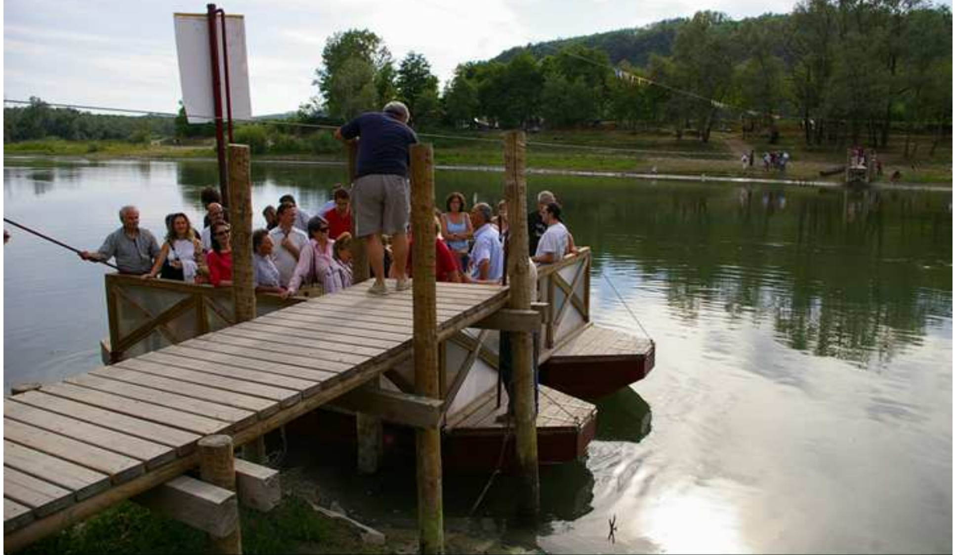
Lungo Tanaro (Antignano – Giugno 2007)