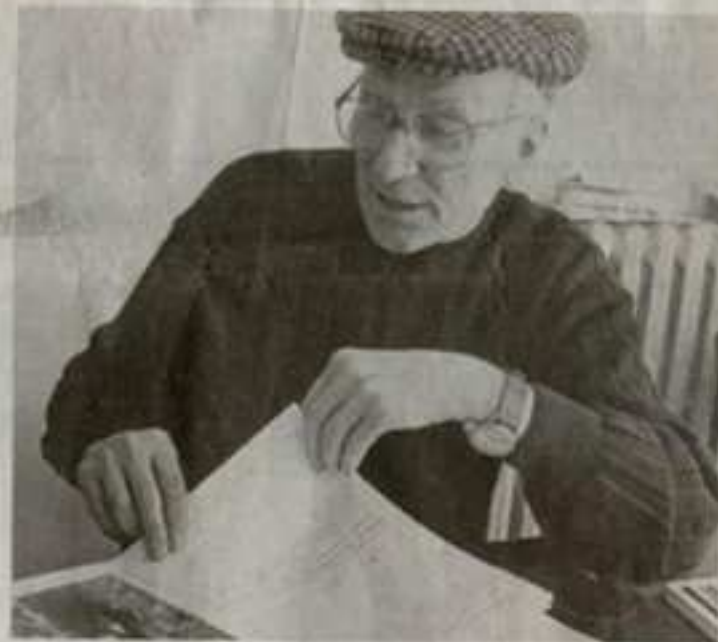
Bartolo Mascarello, figura storica del Barolo