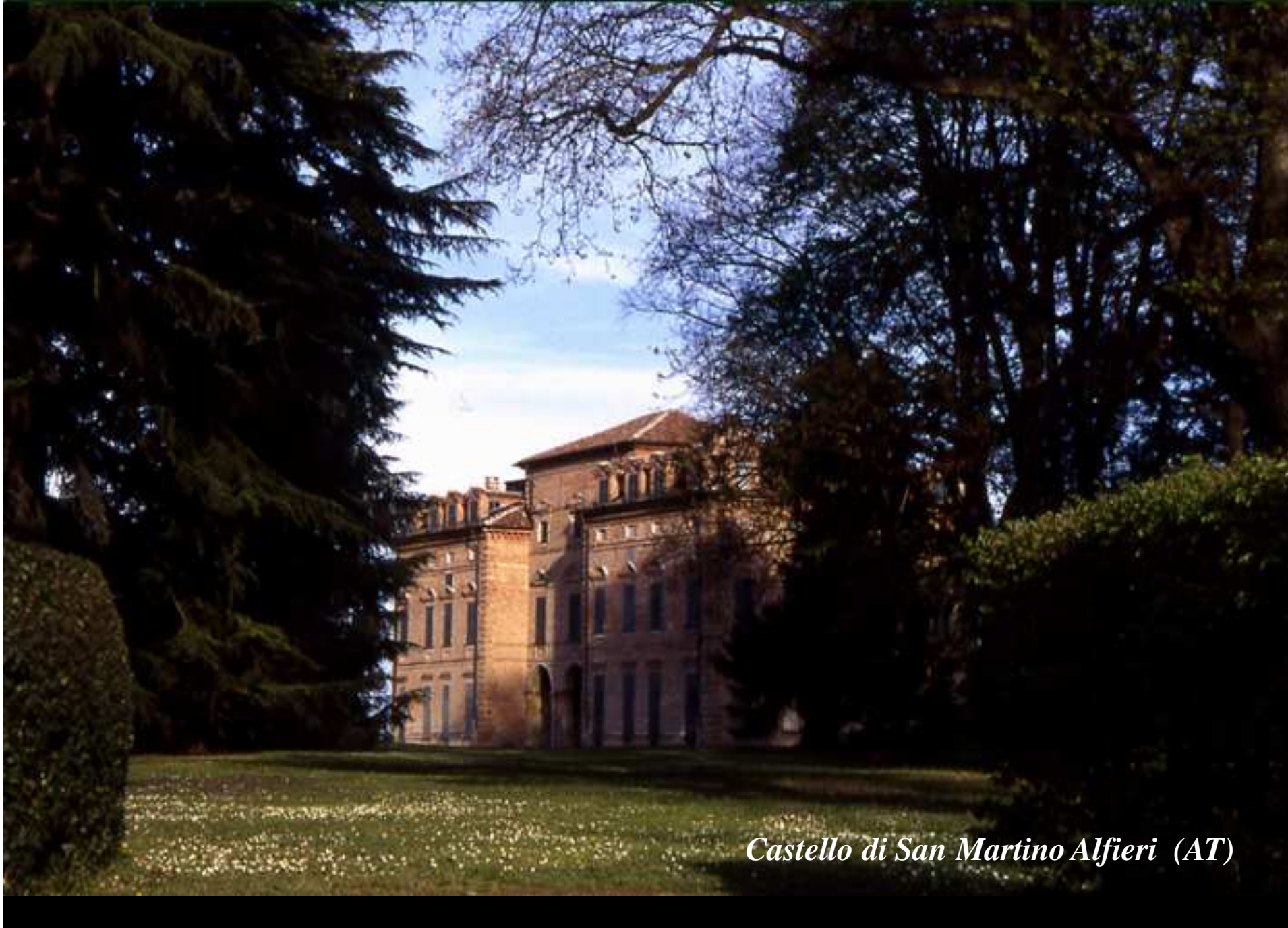
Castello di San Martino Alfieri (AT)